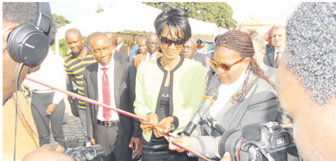
Coupe du ruban symbolique par l'ambassadeur du Venezuela et la directrice du cabinet du ministre de la culture et des arts

En effet, la République du Congo et la République bolivarienne du Venezuela, pays pétroliers savent qu'il faut mettre en œuvre des plans stratégiques à l'échelle nationale et internationale pour l'exploitation du