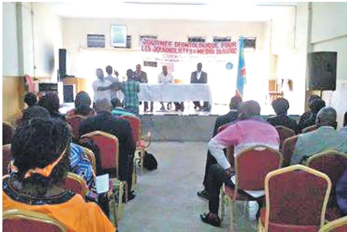
Vue de la salle lors des travaux

L'orateur a, lui également, rendu un vibrant hommage aux membres de l'Olpa pour avoir non seulement porté son dévolu sur sa modeste personne mais