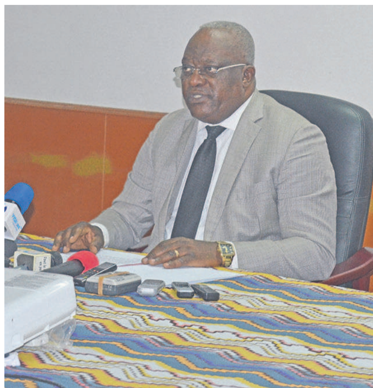
Le ministre Léon Alfred Opimbat