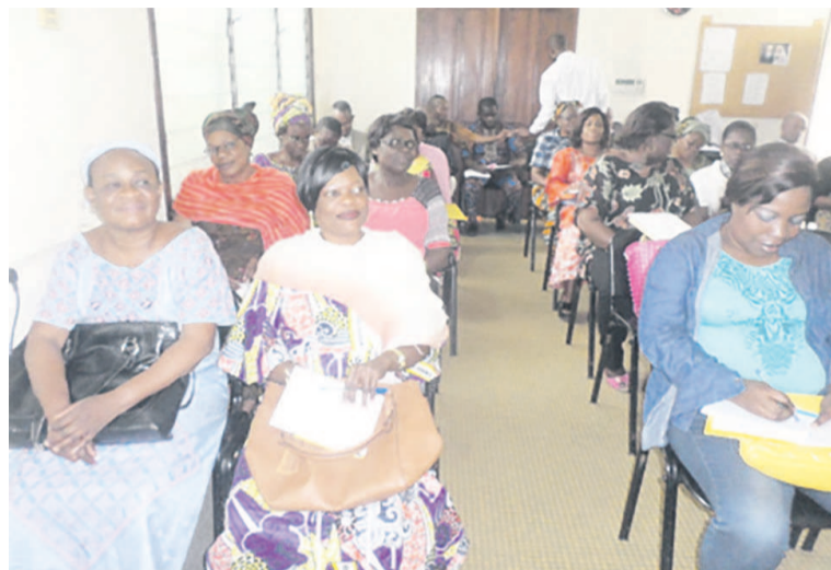
Les participants à l'atelier