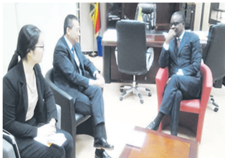
L'entretien entre les deux parties

« Je suis ici premièrement, pour rattraper une erreur que j'ai commise car, après la composition de la nouvelle équipe gouvernementale, j'aurais pu venir rendre une visite de courtoisie au ministre », a indiqué l'ambassadeur de Chine. Au-delà d'une simple visite de