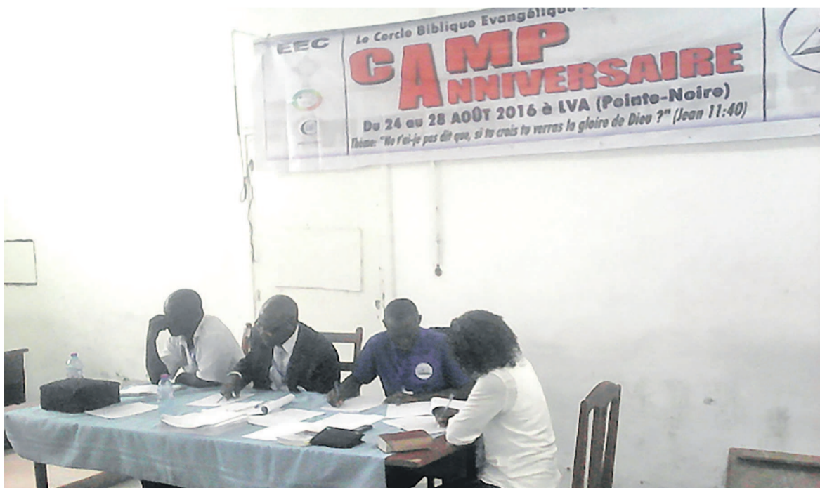
Les modérateurs pendant le forum