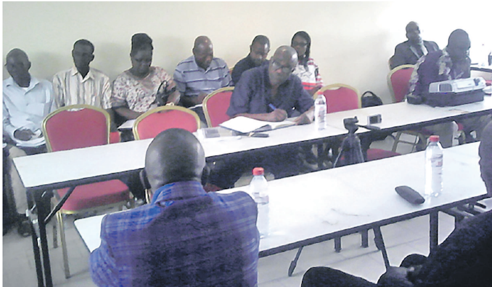
Les participants à l'atelier du PEEDU