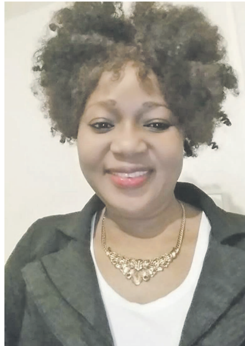
La présidente de la fondation Thérèse-Lisungi