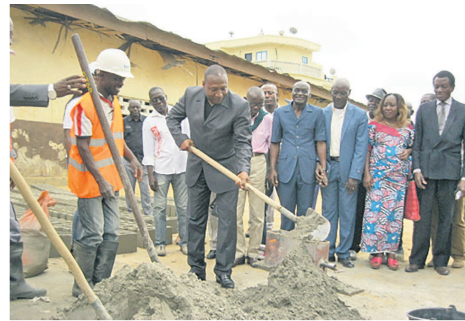
L'honorable Maurice Mavoungou lançant les travaux

Le député de la circonscription numéro 3 Lumumba, Maurice Mavoungou, a lancé le 26 août les travaux de restauration du mur de l'école primaire Lien-Athanase-Dambou. Cette activité s'est déroulée en présence des élèves, des responsables de cet établissement scolaire et des chefs de quartiers.