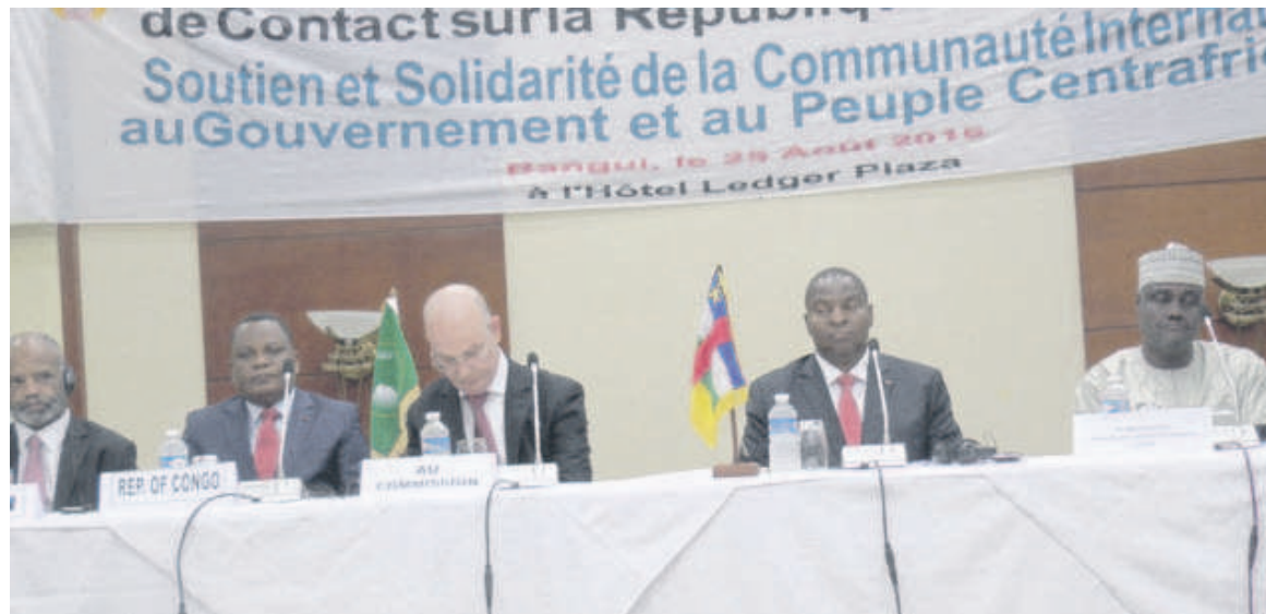
Une vue du présidium à l'ouverture des travaux

Au regard du nouveau contexte institutionnel et des défis auxquels sont confrontées les actuelles autorités de la Centrafrique, dans un environnement post-conflit, le soutien des partenaires est plus qu'urgent, soulignait à l'ouverture des travaux le ministre congolais des Affaires étrangères, Jean-Claude Gakosso qui a présidé cette réunion avec le commissaire à la Paix et à la sécurité de l'Union africaine (UA), Smail Chergui. La convocation de la réunion des donateurs prévue le 17 novembre à Bruxelles, en Belgique, s'inscrit dans cette