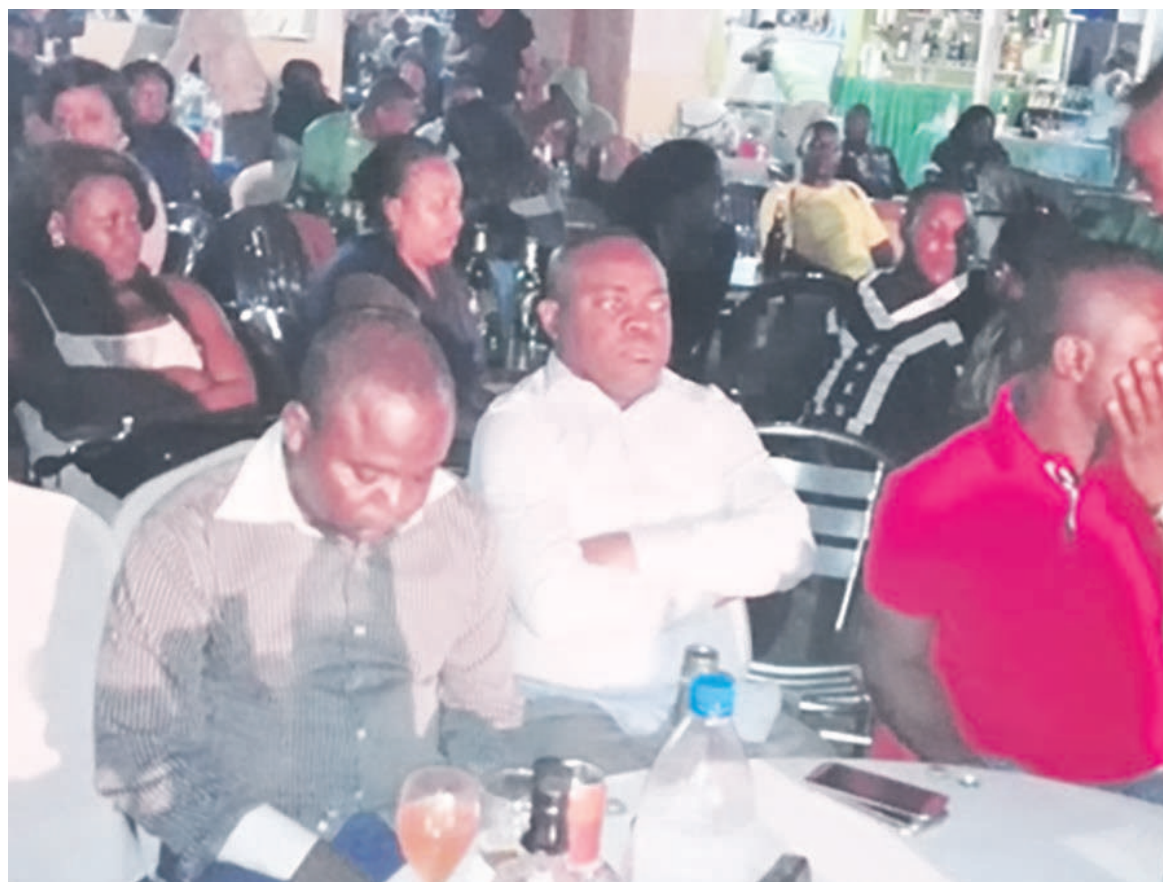
Le ministre de la Culture et des Arts à l'ouverture officielle de la foire Holidays

La première édition de la foire Holidays a été ouverte officiellement le week-end dernier au stade Félix-Éboué par Younes Levy Ambvouli, président du bureau exécutif national de la Dynamique pour le renouveau, en présence du ministre de la Culture et des Arts, Léonidas Carel Mottom Mamoni. Un concert musical a agrémenté la cérémonie.