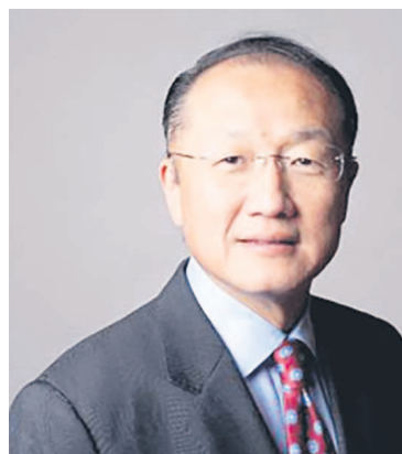
Jim Yong Kim

« Nous pouvons exploiter ce potentiel plus systématiquement et créer à terme des emplois tout en obtenant de meilleurs résultats en matière de santé. En procédant à des investissements judicieux, nous pouvons sauver la vie de millions de personnes, aider les populations à échapper à l'extrême pauvreté et permettre à tous les êtres humains de vivre en meilleure santé, plus longtemps et de façon plus productive. Cet objectif est à la portée de l'Afrique, dont la