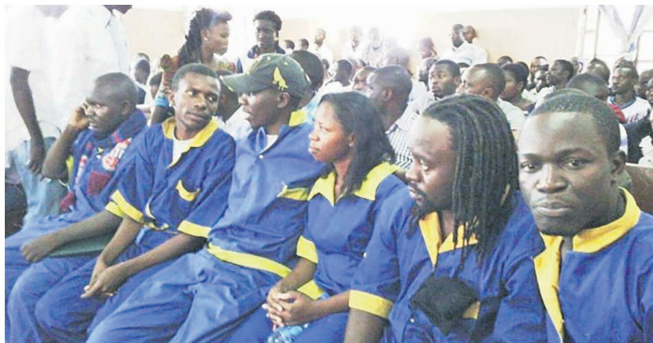
Quatre membres de la Lucha et une de Filimbi en passe d'être libérés

Une semaine après l'annonce de la libération de vingt-quatre prisonniers politiques, le gouvernement a décidé le 26 août d'engager les procédures réglementaires pour la remise en liberté de cinq autres prisonniers d'opinion, appartenant tous à des mouvements citoyens, en détention à Kinshasa depuis plusieurs mois. Ces nouvelles libérations vont, selon le gouvernement, dans le sens de décriper davantage le climat politique en RDC. Quoiqu'ils se félicitent de cette avancée, les mouvements concernés (Lucha et Filimbi) la jugent insuffisante et demandent la libération de tous leurs membres, y compris les quatre derniers éligibles, mais aussi le reste des détenus politiques.