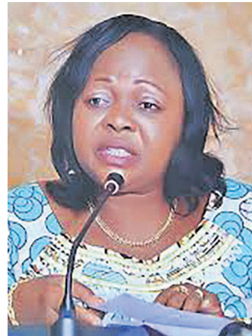
La ministre de la Femme, Famille et Enfant, Lucie Kipele

Remerciant Onufemmes pour cet appui qui vise à renforcer les capacités du Secrétariat général de la résolution 1325, la ministre de la Femme, Famille et Enfant, Lucie Kipele, a demandé aux bénéficiaires d'utiliser à bon escient ces matériels roulants et de bureau. Elle a, en outre, sensibilisé