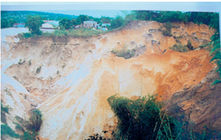
Cette zone de glissement de terrain est située après le marché Bas Prix au quartier Kombo entre les rues Oyalé et Botoka, en descendant vers la zone Lounda, située au quartier Jacques Opangault