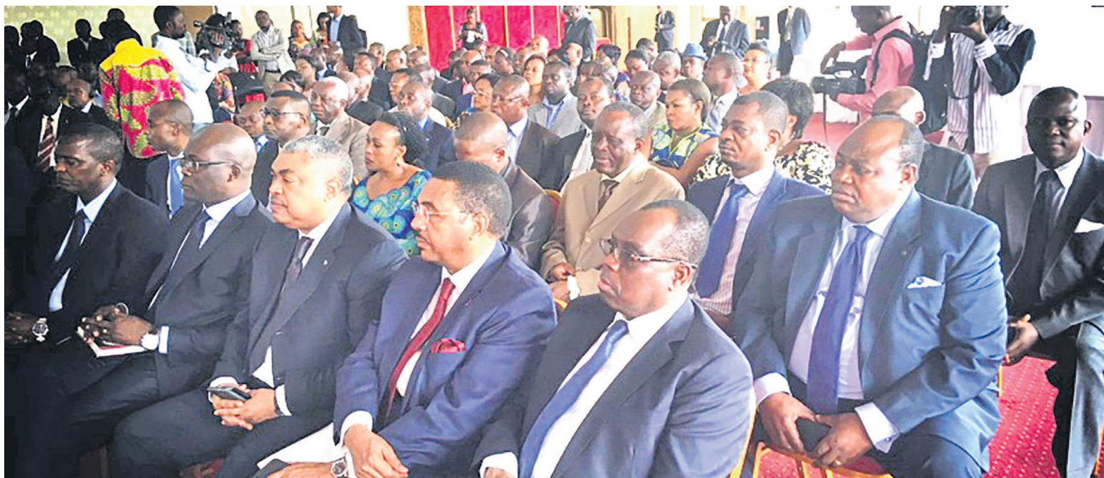
Les participants au comité préparatoire

Le dialogue devra-t-il débattre de l'organisation des élections qui pourront aboutir à l'alternance ou faire carrément de ce concept l'élément-clé des discussions ? C'est sur cette question que la réunion préparatoire a achevé,