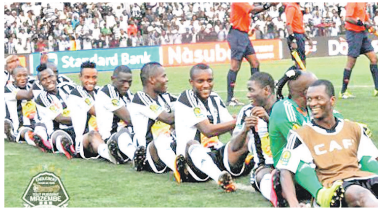
TP Mazembe de Lubumbashi