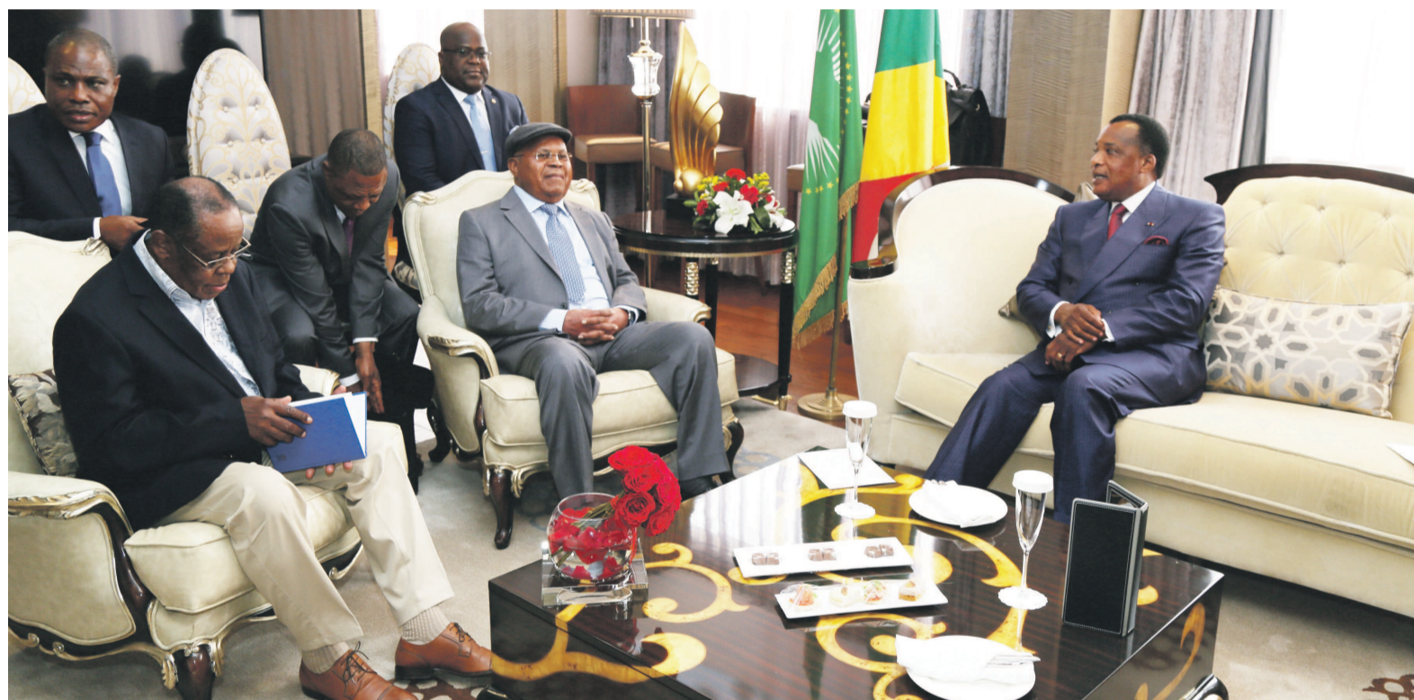
Audience avec les leaders des partis de l'opposition