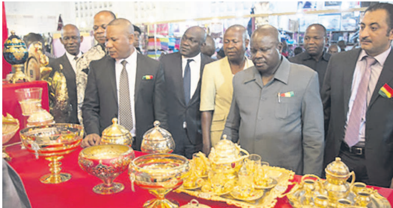
Visite des expositions par les responsables du ministère du Commerce

Des produits que les Congolais découvriront pendant un mois. Une occasion pour le Centre congolais du commerce extérieur d'inviter les opérateurs économiques à bénéficier de l'expérience syrienne dans l'organisation des fêtes foraines avec des produits diversifiés.