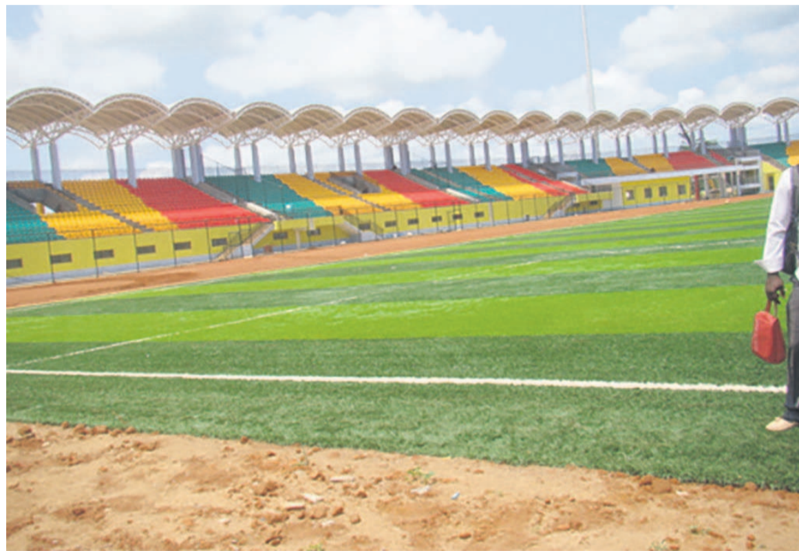
Le stade de Ouesso

so contre celle de Pokola. Mais là, il faut reconnaître que ce n'est pas facile. Il faut solliciter le ministère des Sports et de l'éducation physique qui doit