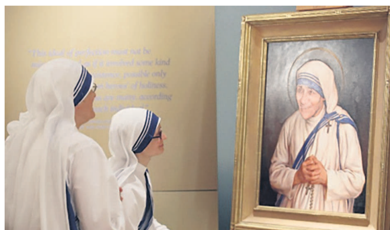
Mère Teresa a été canonisée, à Rome, par le Pape François

Dans le cas de Mère Teresa, il s'est agi de la guérison en 1998 d'une Indienne qui souffrait d'un