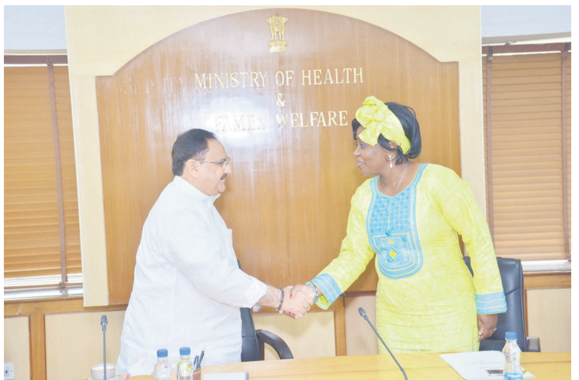
La ministre congolaise de la Santé avec son homologue indien