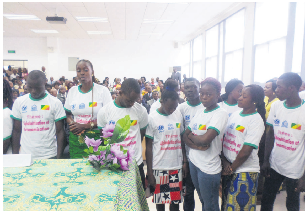
Un échantillon d'admis du secteur non formel au CEPE et au BEPC