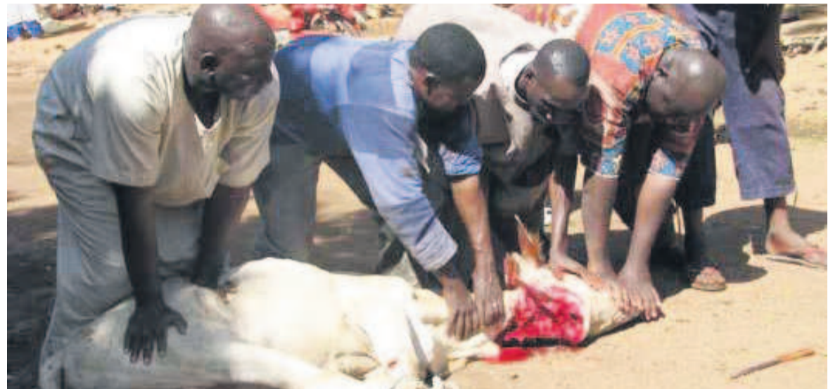
Des musulmans égorgeant un mouton

A en croire les statistiques des catholiques, cette pratique est respectée par près de 452 000 musulmans selon le