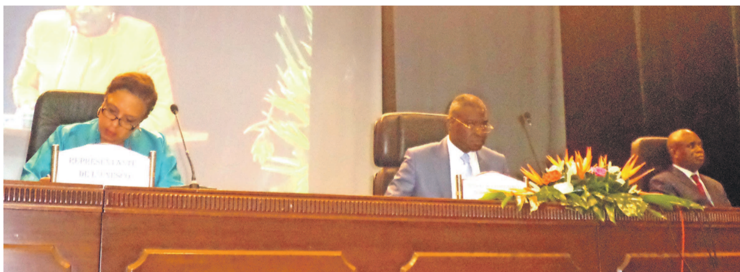
Le ministre Collinet Makosso (au centre), ouvrant la session du Conseil national

A une vingtaine de jours de la rentrée scolaire 2016-2017, le ministère de l'Enseignement primaire, secondaire et de l'alphabétisation évalue les forces et faiblesses de la formation initiale et continue des enseignants. Réunis en Conseil national, du 12 au 14 septembre, sur le thème « La formation initiale et continue des enseignants comme l'un des piliers de la stratégie sectorielle de l'éducation », les acteurs de l'éducation nationale entendent ainsi jeter les bases de la modernisation de l'ensemble du système éducatif, en vue d'améliorer les résultats scolaires.