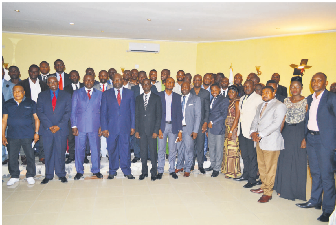
La photo de famille des membres de la JLC

Pour cela, a-t-il poursuivi, vous devez être une grande force de proposition sur les épineuses questions qui touchent à la vie de la nation. Vous devez toujours exalter les valeurs patriotiques et citoyennes, les valeurs de la République, de notre hymne national qui nous invite à être debout partout, de proclamer l'union de notre nation, d'oublier ce qui nous divise et d'être plus unis que jamais. En effet, a-t-il souligné, les relents ethnocentristes et ethnocentriques qui se manifestent dans notre société et avec plus d'acuité encore sur les réseaux sociaux doivent nous interpeller. Notons qu'au cours de cette assemblée générale, il a été procédé à la mise en place des instances dirigeantes de cette structure. Elles comprennent un bureau de