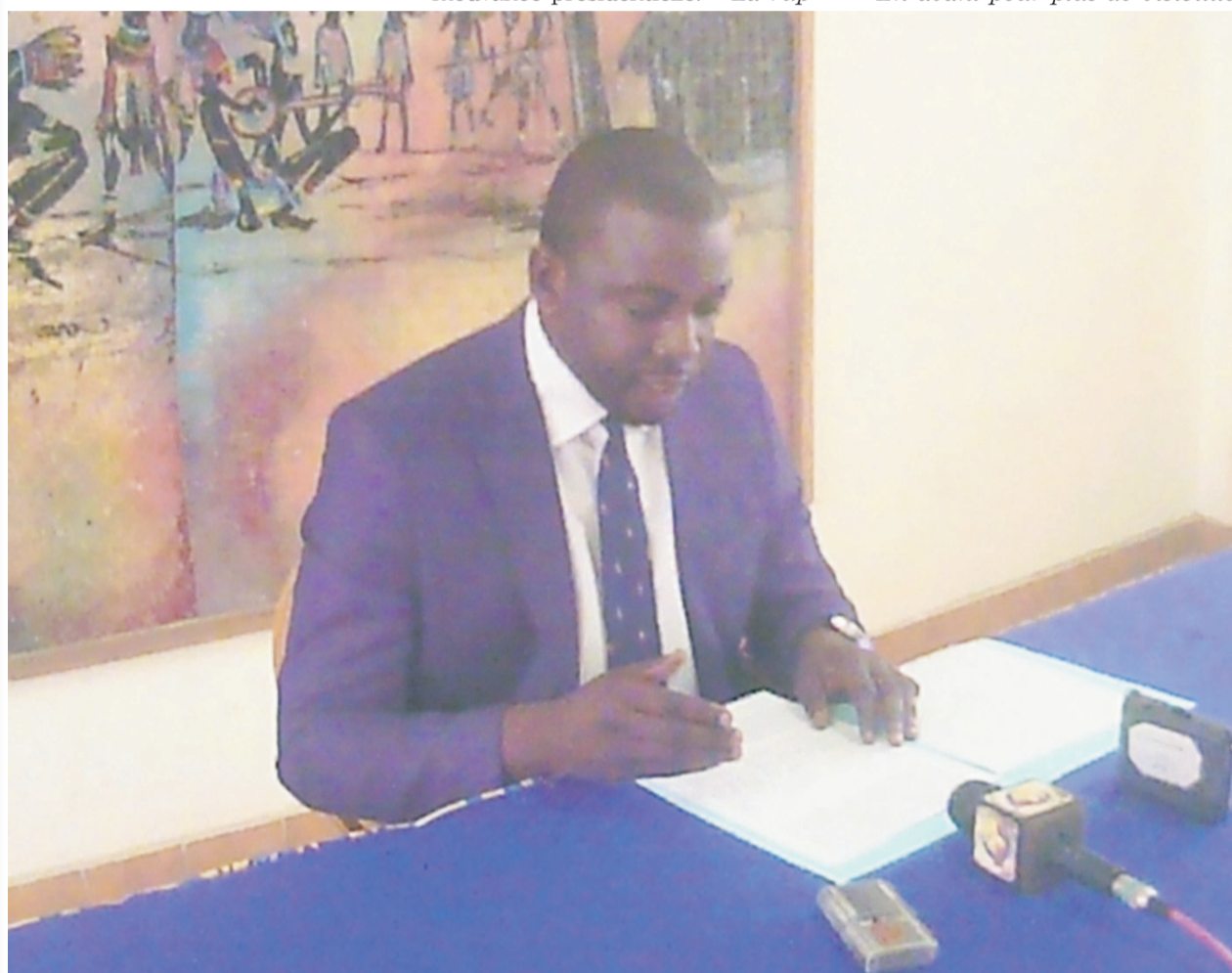
Prince Merveilleux Nsana Nsayi rendant la déclaration

Le parti a en outre annoncé la tenue dans les tout prochains jours de sa rentrée politique sous le thème : « En avant pour plus de visibilité,