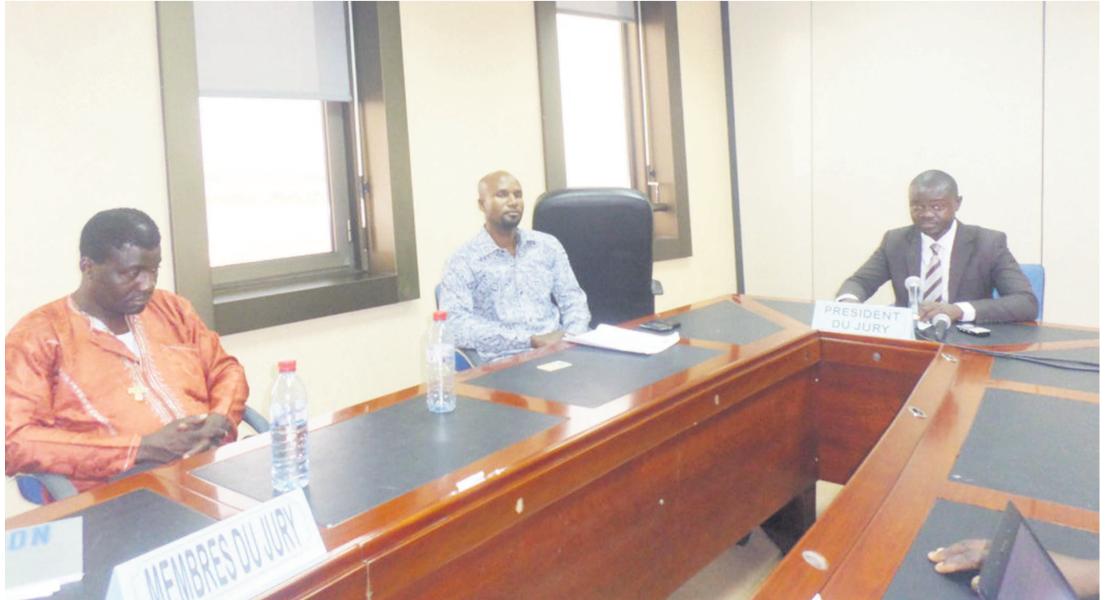
Trois des dix membres du jury pendant la délibération