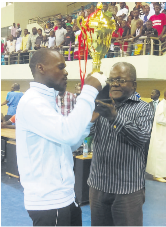
Le capitaine de Caïman brandissant le trophée