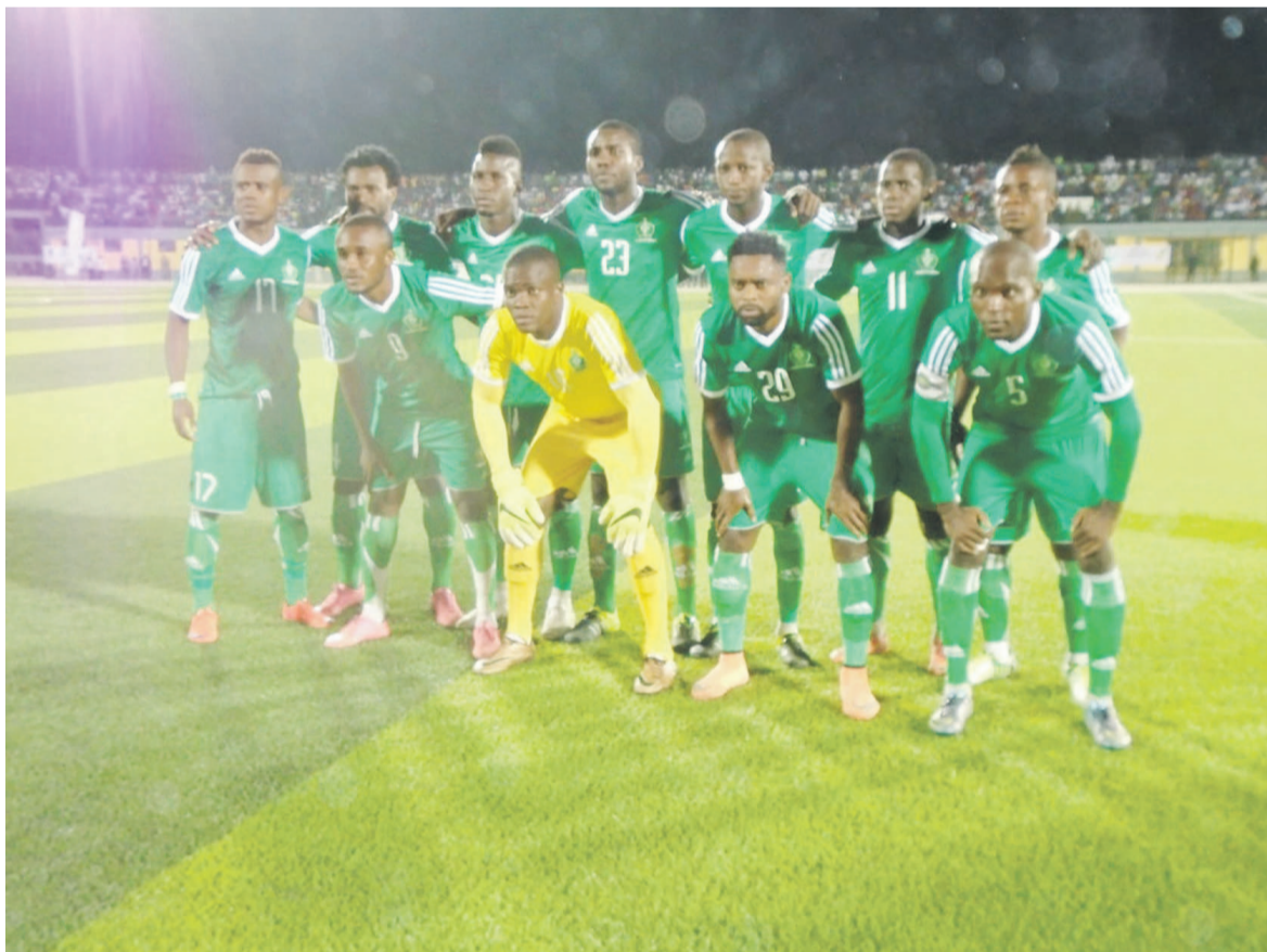
L'AC Léopards de Dolisie si près du but

qui avait délivré les siens dans les ultimes minutes de la finale de la Coupe du Congo à Madingou. Le but qu'il marque deux minutes après le penalty manqué par son coéquipier, a fait du bien aux vainqueurs de la coupe du Congo. Il a amélioré leur compteur à 76 points en trente matches disputés puis a renforcé leurs chances de réaliser cette saison un doublé. Quatre succès d'affilée respectivement contre l'Interclub (34 e journée), l'ASK (35 e journée), l'ASP (match en retard de la 28 e journée) et le FC Kondzo (36 e journée), l'objectif est atteint. Et puis, il ne lui restera qu'à poursuivre sur cette lancée les quatre matches restants pour établir un nouveau record : celui d'être la