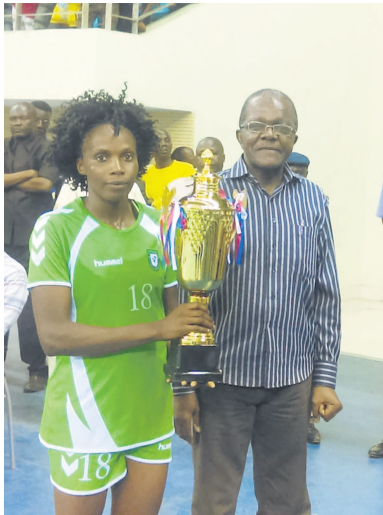
La capitaine d'Asel avec le président de la Fecohand crédit photo Adiac au Burkina Faso. En rappel, le titre remporté par Asel en seniors (hommes) et Caïman en seniors (dames) permet aux deux formations de se qualifier en compétitions africaines de clubs qui se disputeront dans un mois

L'équipe de l'AS Cheminots a remporté le titre de fair-play. Niche Ekambo de Patronage a été sacré meilleur buteur en hommes. En dames, c'est Clene Divoko, d'Asel qui a été la première des buteuses avec 41 réalisations. La même joueuse l'a été lors du championnat dé-