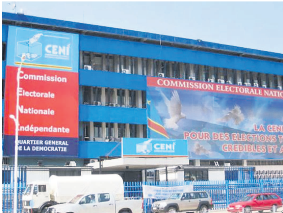
Siège de la Céni à Kinshasa (DR)

Comme prévu, le Rassemblement des forces politiques et sociales acquises au changement entend mettre toutes les bouchées doubles en ce mois de septembre pour contraindre la Céni à activer le processus électoral aux fins de l'organisation de la présidentielle au mois de novembre conformément à la Constitution. Cette plate-forme de l'opposition est plus que jamais déterminée à obtenir gain de cause dans sa volonté affichée de respecter les délais constitutionnels. Et tous les moyens sont bons pour parvenir au résultat, notamment la rue. C'est dans ce cadre qu'elle annonce, via la Dynamique de l'opposition, un regroupement