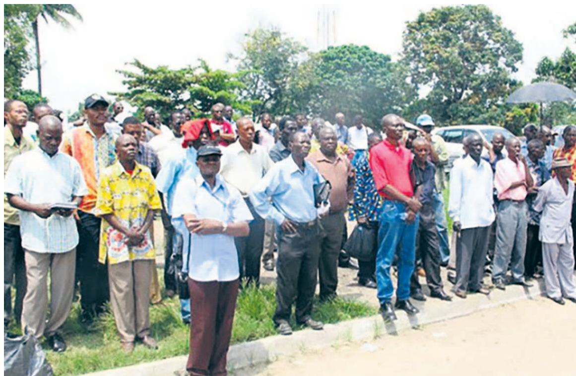
Un rassemblement des fonctionnaires

Alors que le ministre provincial de la Fonction publique du Haut-Katanga, par la note circulaire n°0013/CABMIN. PROV/FIN&FPP/2016 organisant une nouvelle répartition des ressources humaines dans les nouvelles provinces issues du démembrement, oblige certains fonctionnaires à quitter cette province démembrée, les concernés crient au tribalisme. Ces derniers, surpris par cette mesure, remettent en cause cette décision et décident d'engager un bras de fer avec l'autorité qui a pris cet arrêté, démontant point par point l'argumentaire qui soutient ladite décision. Selon les principaux concernés, en effet, ces affectations ne sont pas réalisées sur la base de leurs compétences ou de leur expertise, mais en fonction de leur origine. « Le rapport de la commission provinciale de démembrement et d'installation de nouvelles provinces n'avait jamais prévu une telle disposition et n'a donné mandat au ministre provincial de la Fonction publique pour agir ainsi. Cette prérogative serait dévolue à la commission interprovinciale à créer », ont-ils soutenu dans une lettre adressée au ministre de l'Intérieur du gouvernement central. Selon eux, ni le ministre provincial du Haut-Katanga, ni le gouvernement dont il est issu