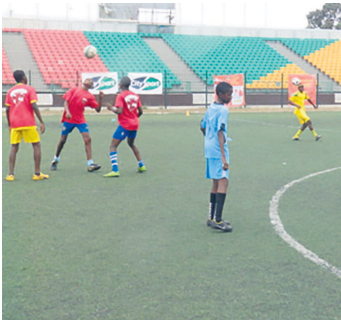
Quelques jeunes en formation

matches à effectifs réduits, des tournois et plusieurs autres activités ludiques