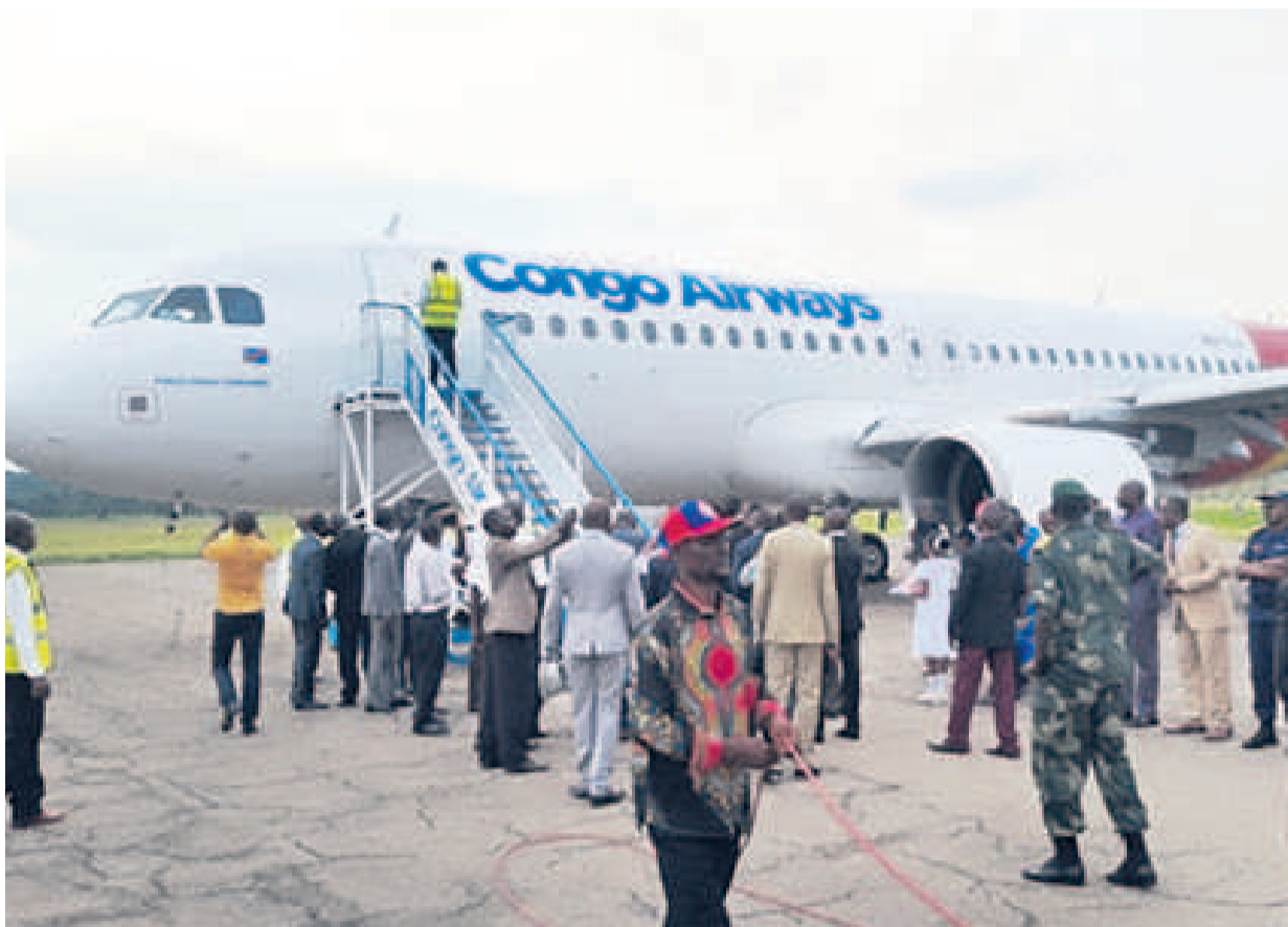
Un avion de Congo Airways en escale à Mbuyi Mayi

Dans sa politique de redynamisation de l'entreprise qui passe par la promotion des nouvelles méthodes de