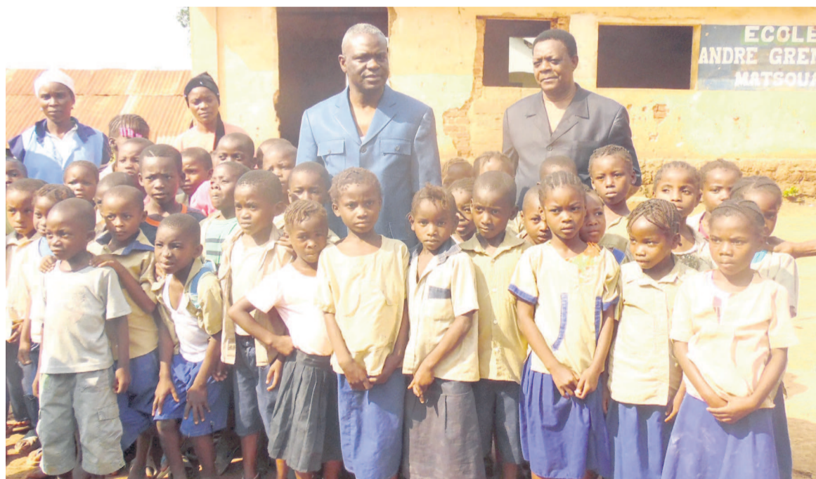
Le ministre Collinet Makosso avec les élèves de Mindouli, département du Pool

A quelques deux semaines de la rentrée des classes, le ministre de l'Enseignement primaire, secondaire et de l'alphabétisation a rappelé l'irrévocabilité de la décision gou-