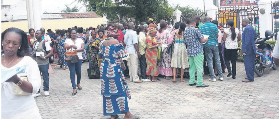
Une vue des déclarants à l'inspection divisionnaire des contributions de Moundali (DR)

Donnant ses impressions sur cette opération, un citoyen abordé à l'inspection des impôts de Moundali, a, quant à lui loué l'initiative. C'est une opération de routine sous d'autres cieux, a-t-il dit, déplorant l'absence des responsables tant administratifs que politiques dans cette opération de déclara-