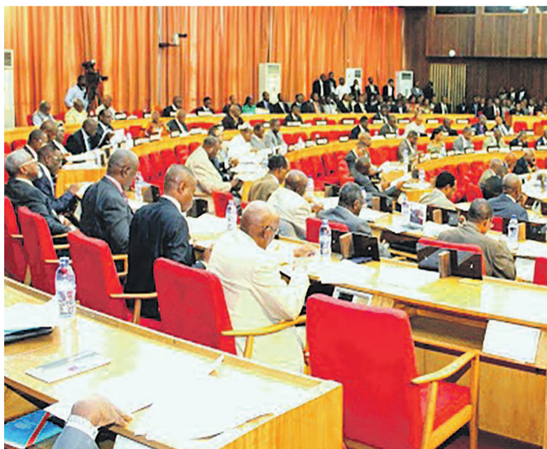
Une vue des sénateurs en plénière

Les deux chambres du Parlement ont renoué avec leurs travaux jeudi à la faveur de l'ouverture de la session ordinaire de septembre réputée essentiellement budgétaire. Cette journée inaugurale a été marquée par les allocutions des présidents de deux chambres législatives. Au Sénat, Léon Kengo Wa Dondo a stigmatisé la tendance à la baisse des principaux produits d'exportation tels que le cuivre et le cobalt, laquelle tendance assombrit davantage les perspectives économiques de la RDC. Le gouvernement, a-t-il déclaré, devra faire de la diversification de l'économie une véritable priorité plutôt que de continuer à se focaliser sur les industries extractives en vue d'en réduire la dépendance.