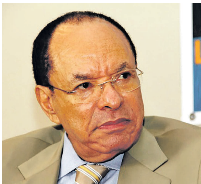
Léon Kengo Wa Dondo

« Qui pour succéder à Matata Ponyo au poste de Premier ministre ? ». Telle est la question principale ayant orienté le nouveau sondage initié par l'Institut Les Points en ce mois de septembre. Globalement, il se dégage 79% des sondés favorables à la mise en place d'une nouvelle équipe gouvernementale dirigée par une personnalité issue de l'opposition politique présente au dialogue contre 14% qui souhaitent que la prochaine équipe gouvernementale soit conduite par un cadre de la majorité présidentielle autre que Matata Ponyo. Léon Kengo Wa Dondo, comme chef du prochain gouvernement, bénéficie d'un taux de confiance de 68% à la suite notamment de son implication personnelle dans la résolution de la crise de janvier 2015 contrairement à Vital Kamerhe (crédité de 7% de confiance) dont la participation à ces assises n'a jamais cessé d'énerver l'opinion.