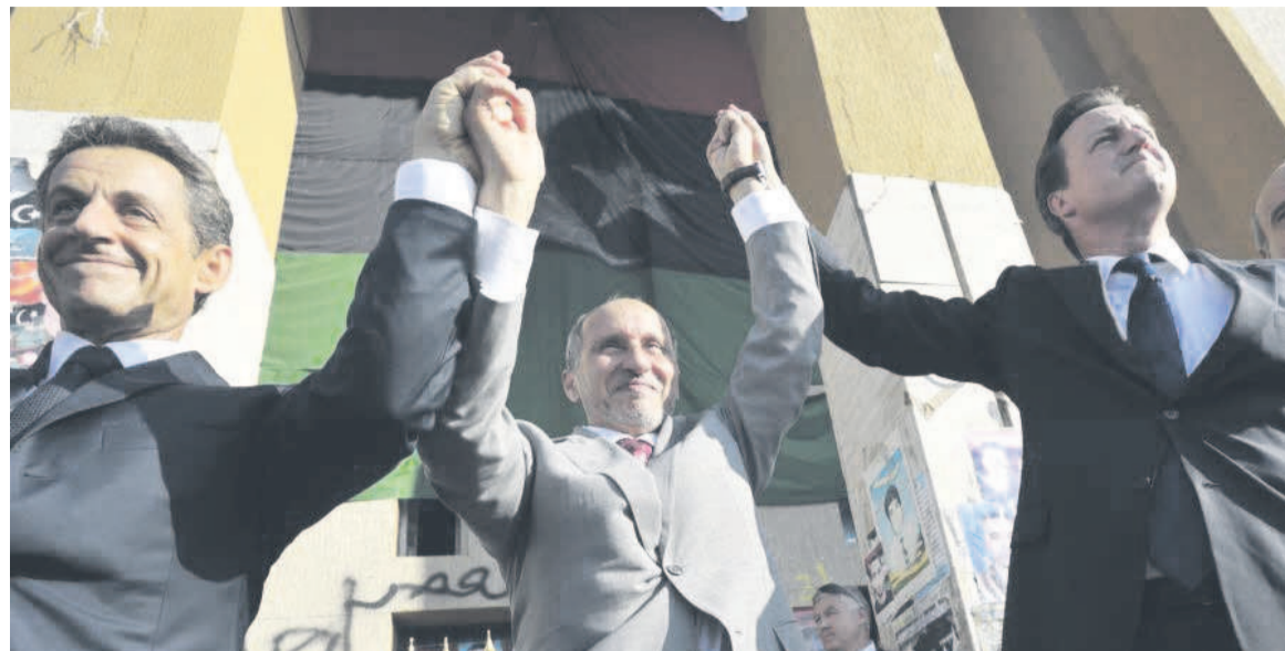
Nicolas Sarkozy, Mustafa Abdul Jalil et David Cameron

Il paraît important de répondre à la question posée au début de ce texte : à quoi peut en effet servir le rapport des parle-