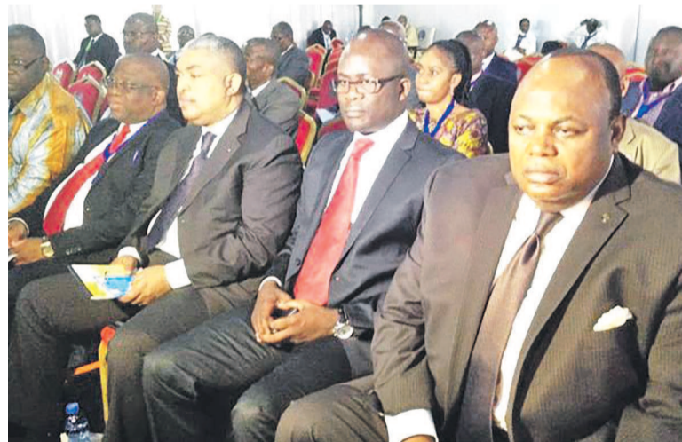
La délégation de l'opposition

« L'organisation des élections présidentielle, législatives nationales et provinciales en une séquence. Les élections locales sont organisées concomitamment avec les trois premières si les moyens techniques et financiers le permettent ». Tel est le libellé de l'accord qui a mis fin à la suspension des travaux au dialogue par l'opposition. Les deux parties ont convenu à ce que le calendrier électoral priorise la présidentielle couplée aux législatives et aux provinciales, quitte à la Ceni d'examiner si techniquement et financièrement, il serait possible d'organiser les locales en même temps que les trois autres. Forte de cet accord, l'opposition a finalement décidé de revenir sur la table de négociation. Ce document n'est certes pas l'accord politique mais plutôt un point qui ouvre des perspectives à la conclusion du futur accord politique.