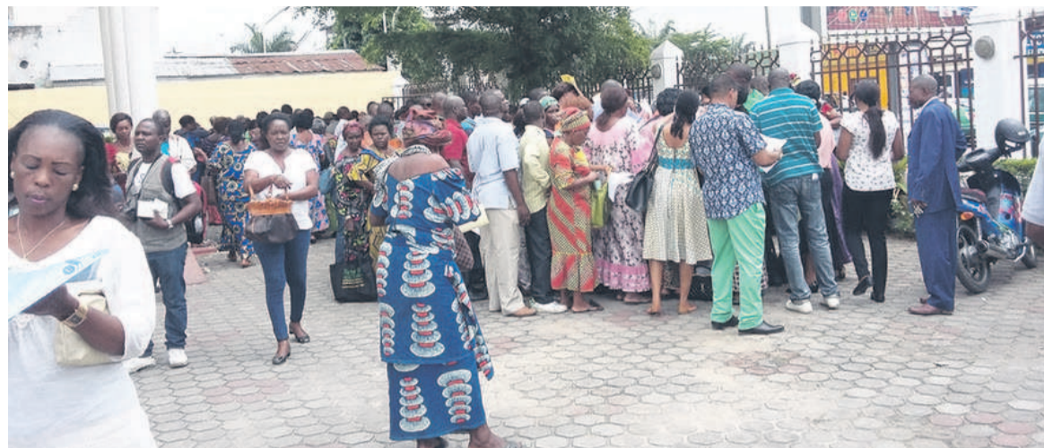
Une vue des déclarants à l'inspection divisionnaire des contributions de Mougali

Donnant ses impressions sur cette opération, un citoyen abordé à l'inspection des impôts de Mougali, a, quant à lui loué l'initiative. C'est une opération de routine sous d'autres cieux, a-t-il dit, déplorant l'absence des responsables tant administratifs que politiques dans cette opération de déclara-