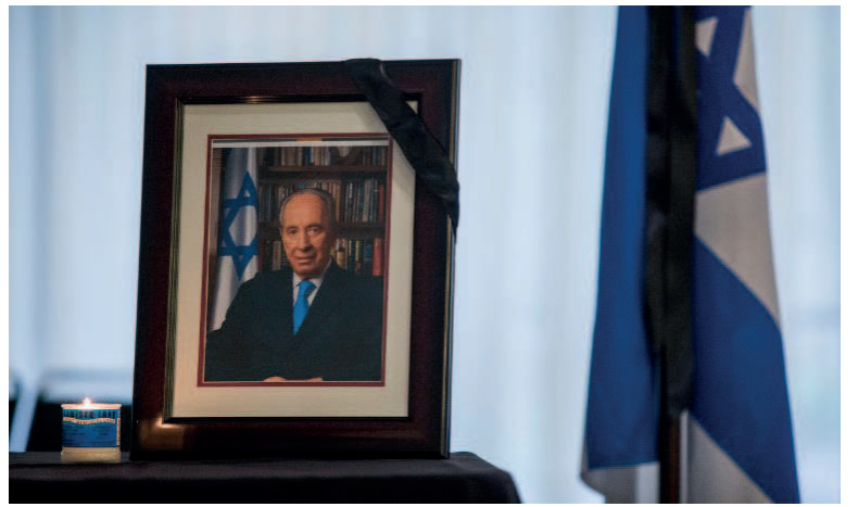
Portrait du premier ministre israélien Shimon Peres

À Jérusalem, Barack Obama et des dizaines de dirigeants du monde entier ont rendu vendredi un ultime hommage à l'ancien président israélien Shimon Peres, avec l'espoir que ses rêves de paix avec les Palestiniens ne soient pas enterrés avec lui.