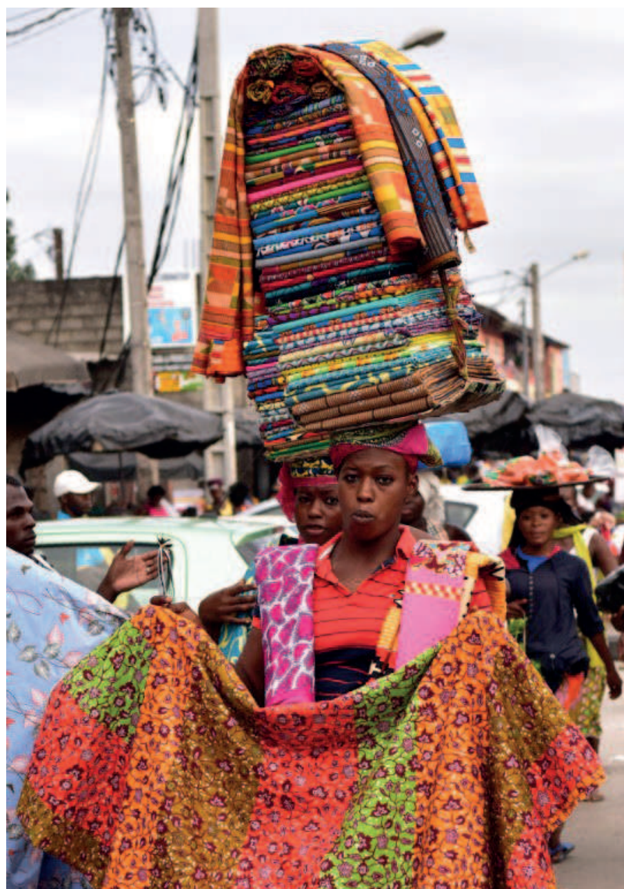
À Abidjan, une vendeuse de pagnes importées d'Asie

En 2015, Uniwax a été très rentable, dégagant un bénéfice net de 4 milliards de F CFA (6 millions d'euros) pour un chiffre d'affaires de 36 milliards de F CFA (55 millions d'euros), ce qui représente une confortable marge (11% net). L'entreprise, qui emploie 750 personnes, a ainsi pu lever, début septembre, 15 millions d'euros sur les marchés boursiers pour financer un plan d'investissement visant à augmenter la production de 70% sur 5 ans. Elle profite d'un marché en pleine expansion : le pagne intéresse désormais les artisans sur les marchés mais aussi des créateurs de mode, des accessoiristes ainsi que le monde du prêt-à-porter. Les imprimés et les couleurs africains commencent à attirer la clientèle européenne et américaine.