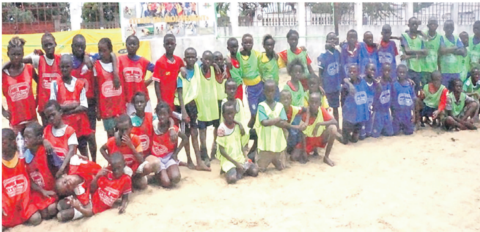
les enfants pendant l'édition de 2014