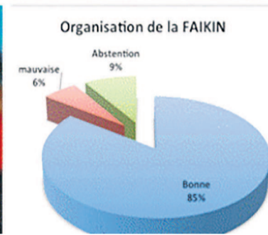
Des personnalités retenues dans le sondage