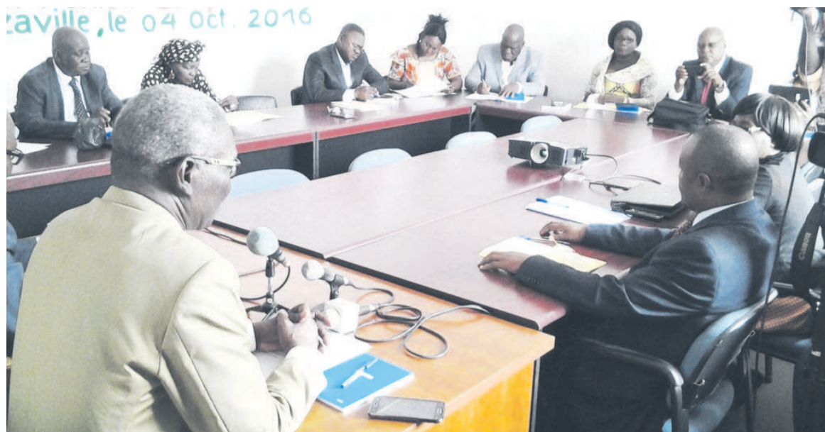
Une vue des participants à l'atelier d'information

Notons que la Communauté économique et monétaire de l'Afrique centrale (Cémac) est depuis quelques temps, en négociation avec l'UE en ce qui