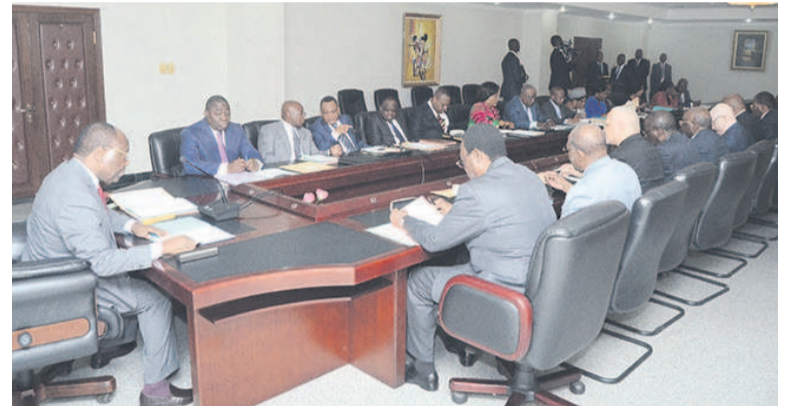
Une vue des ministres

Il faut relever, par ailleurs, qu'il n'y a pas une volonté de la Force publique de s'en prendre aux populations, a-t-il relevé. Au contraire, selon les informations provenant des experts et partagées au cours de cette réunion, a dit Mougalla, il est clairement indiqué que les personnes déplacées se dirigent