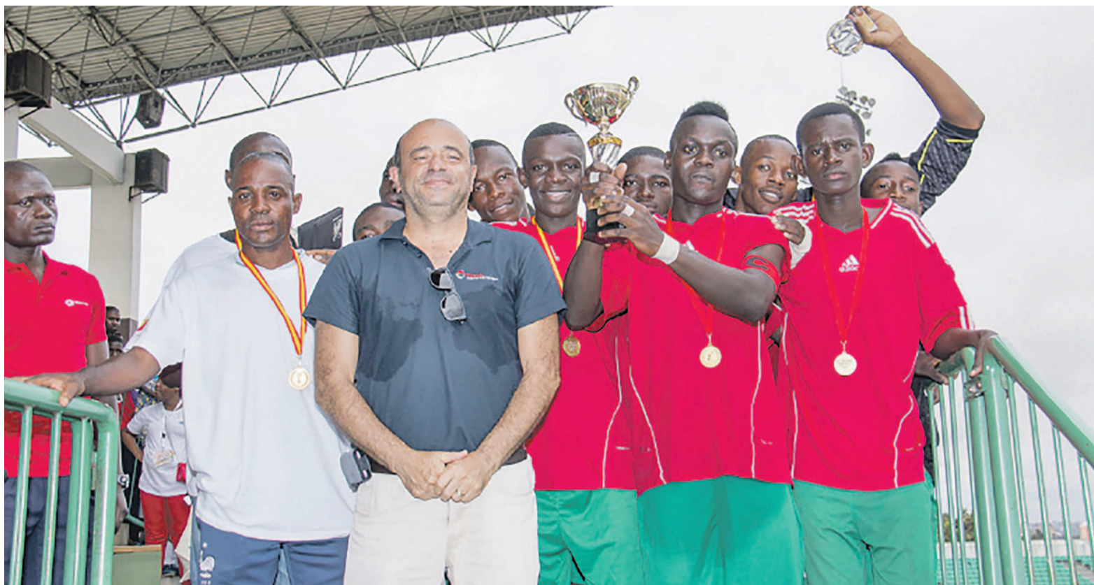
L'équipe championne du tournoi