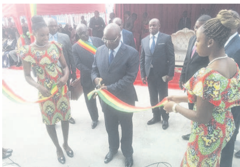
Coupe du ruban symbolique par le ministre du Travail

Cette nouvelle agence soulagera les assurés sociaux qui, autrefois, parcouraient de longues distances pour le