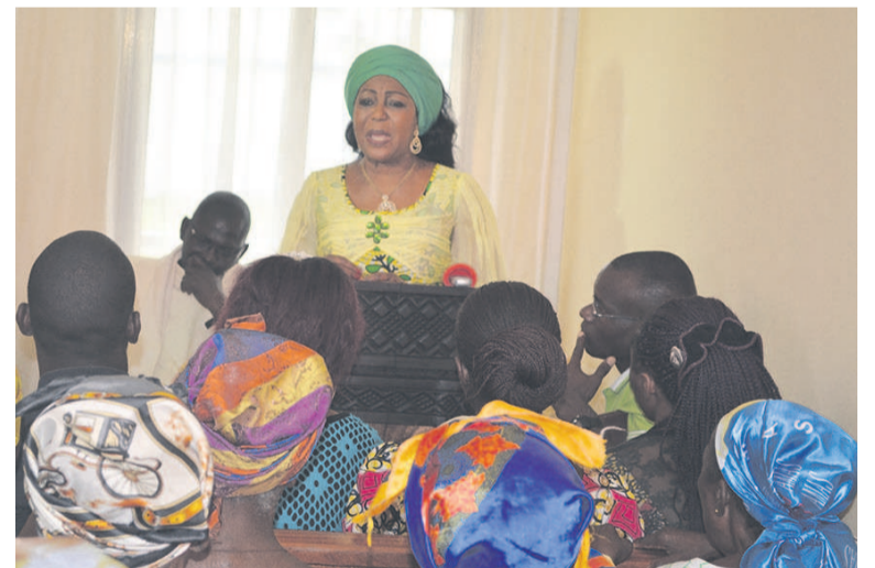
Antoinette Sassou N'Guesso s'adressant aux pensionnaires

l'épouse du chef de l'Etat. Dans les prochains jours, ils ont promis distribuer des couches jetables et des médicaments de