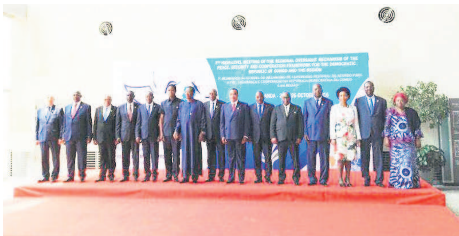
La photo de famille des chefs d'État ayant pris part au sommet de Luanda.

Le Rassemblement des forces politiques et sociales acquises au changement, qui espérait que les chefs d'États africains réunis mercredi à Luanda allaient encourager Joseph Kabila à aller plus loin dans son dialogue avec l'opposition, a dû déchanter face à la négation exprimée quant à la perspective d'un nouveau dialogue. Bien au contraire, le sommet a explicitement plébiscité Joseph Kabila qui en sort requinqué après validation, par ses pairs de la Cigrj et de la Sadc, des résolutions de l'accord politique issu du dialogue facilité par l'Union africaine. Vis-à-vis de cette opposition radicale, le sommet de Luanda y est allé avec des sermons tendant à la contraindre à la résignation. Entre-temps, au Rassemblement, on est plus que jamais convaincu que la rue demeure la seule alternative plausible qui reste pour se faire entendre et changer la donne politique. Page 12