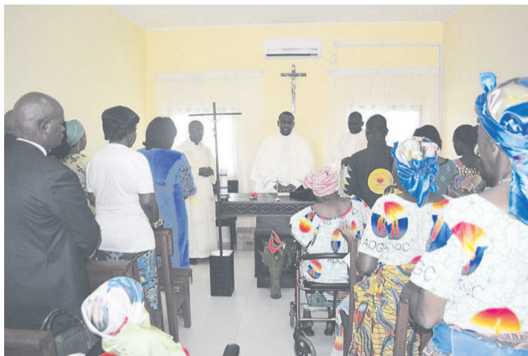
Cérémonie de bénédiction de la chapelle