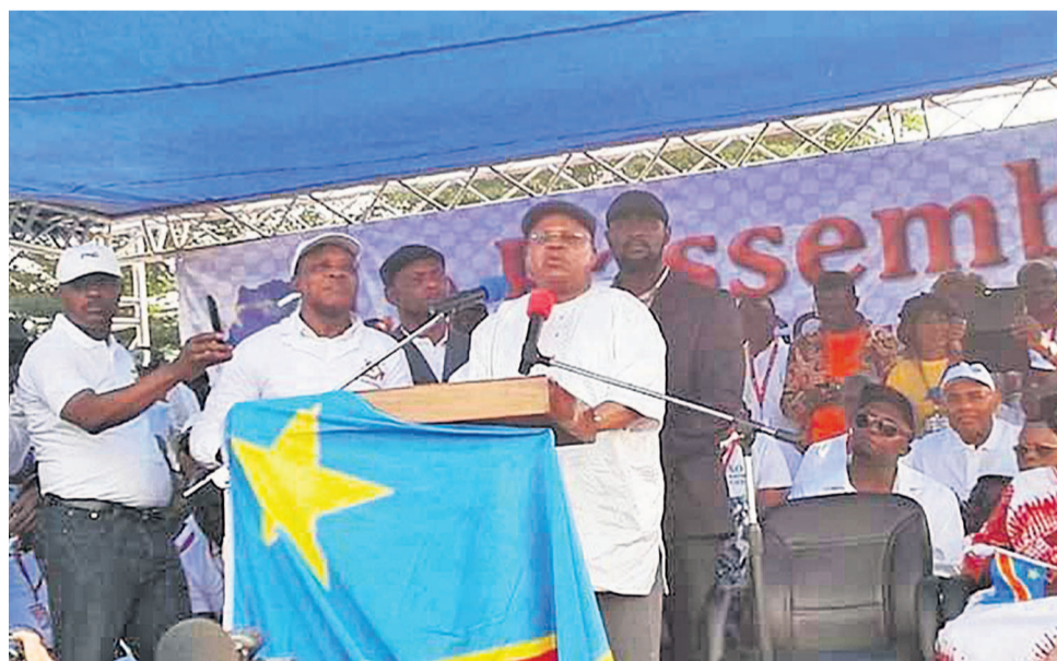
Étienne Tshisekedi lors d'un meeting du Rassemblement à Kinshasa

En apportant son soutien au dialogue, le sommet de Luanda s'est donc éloigné des positions tranchées de l'Union européenne et des États-Unis qui appellent à ce que le délai de la transition soit raccourci avec des élections au plus tard en 2017 et à plus de clarté sur les intentions de Joseph Kabila après la fin de son mandat le 19 décembre. Le ton était pour ainsi dire à la satisfaction par rapport aux négociations du camp Tshatshi qui, d'après José Edouardo Do Santos, hôte du sommet, « ont culminé avec succès et dans l'intérêt de tous ». Aucune demande n'a été faite dans le sens de rechercher plus d'inclusivité au grand