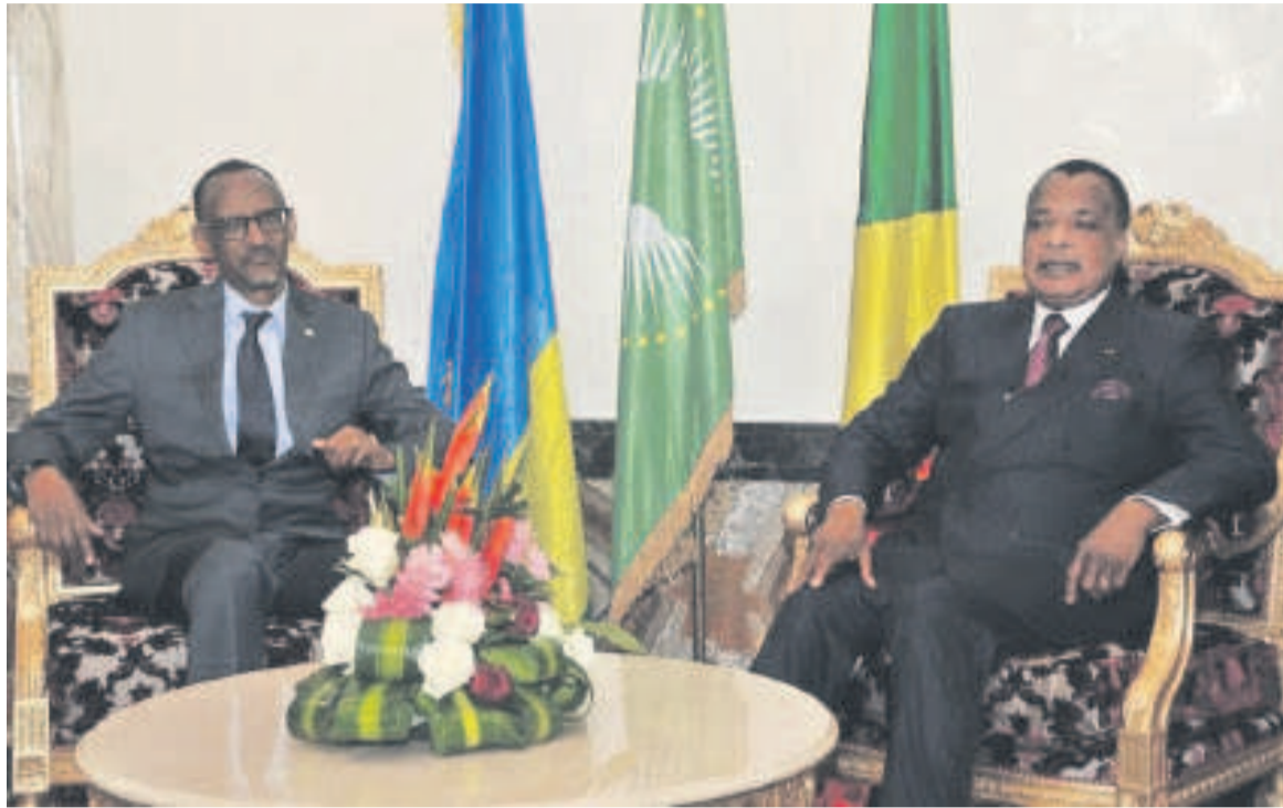
Paul Kagame et Denis Sassou N'Guesso à Brazzaville

Même si jusqu'au soir du même jour, aucune déclaration officielle n'a été faite, l'on sait que cette visite sera, une fois de plus, l'occasion d'élever le niveau de la coopération entre Brazzaville et Kigali. En témoignent les visites que les deux chefs d'État effectuent de temps à autre dans chacune de leurs capitales respectives, la nomination des ambassadeurs, des échanges diplomatiques, dont ceux entre les ministres chargés des Affaires étrangères du Rwanda et du Congo. À cela s'ajoute l'existence de plusieurs accords signés entre les deux parties lors des 3e et 4e commis-