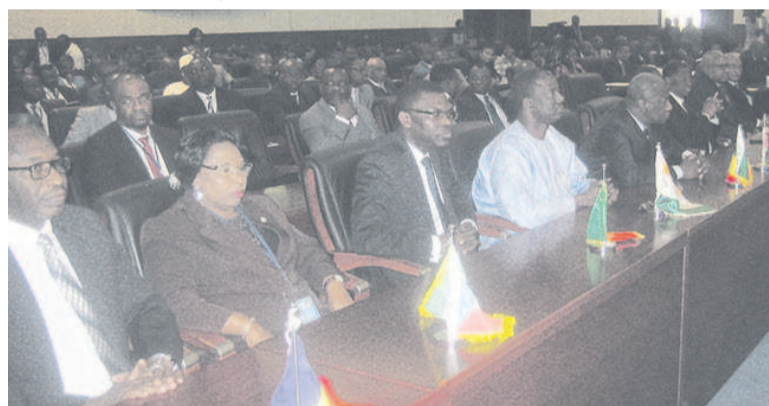
Une vue des participants

Le président en exercice du Conseil des ministres de l'Organisation pour l'harmonisation en Afrique du droit des affaires (Ohada), Pierre Mabiala, assure jusqu'au mois de décembre prochain la présidence de cette institution. Pour la présidence congolaise, l'exemplarité de la gouvernance doit être à la fois un principe et un référentiel de gestion quotidienne des institutions