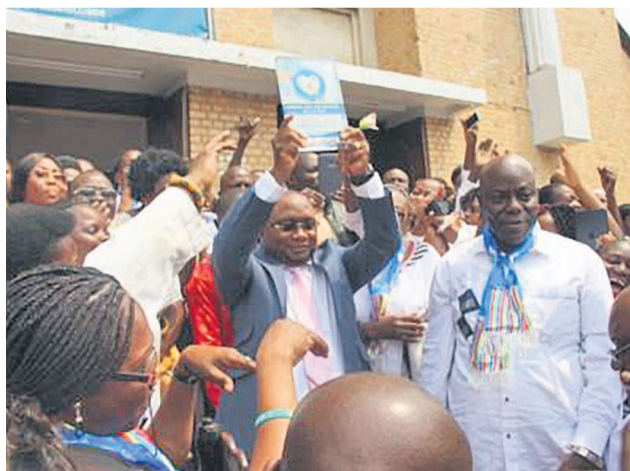
Le ministre Kabange Numbi présentant l'ordre des infirmiers

Dans la province du Kasai oriental, le président provincial de l'Ordre national des infirmiers, Symplice Kashala, annonce le démarrage bientôt de l'opération d'enregistrement au tableau de l'ordre national des infirmiers du Congo (Onic). Il l'a fait savoir au cours d'une séance de restitution des travaux