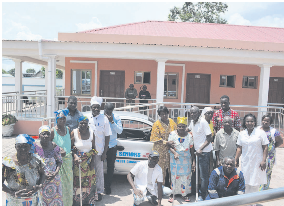
Des pensionnaires posant avec les jeunes de la diaspora et la directrice de l'hospice

Dans les prochains jours, ils ont prévu de nom-