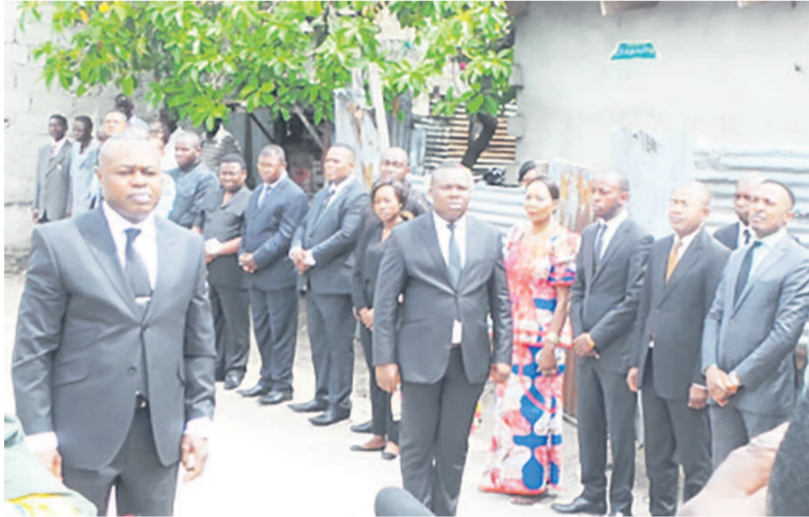
Le ministre des Postes et télécommunications s'inclinant devant la tombe

« La République doit honorer tous ses fils y compris les trépassés. Ici, nous sommes venus honorer nos frères et nos sœurs qui ont quitté ce monde, mais qui demeureront toujours des Congolais, donc des habitants de cette République, mais de l'autre côté. Le gouvernement de la République est solidaire, puisque nous sommes venus ici accomplir cet acte en son nom, au nom du chef de l'Etat », a déclaré Léon Juste Ibombo, après avoir déposé la gerbe de fleurs. Par ailleurs, le ministre des Postes et Télécommunications s'est indigné du comportement des concitoyens qui spolient le cimetière jour après jour. Le gouvernement, a-t-il ajouté, prendra des mesures nécessaires pour que cela cesse. « On