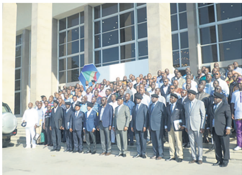
Le ministre de la Défense nationale entouré des AET

Une assemblée générale ordinaire et élective s'est tenue le 30 octobre au Palais des congrès à Brazzaville. Au terme des travaux, le Bureau exécutif (BEN) et la Commission de contrôle et d'évaluation (CCE) ont été reconduits pour un troisième mandat de trois ans.