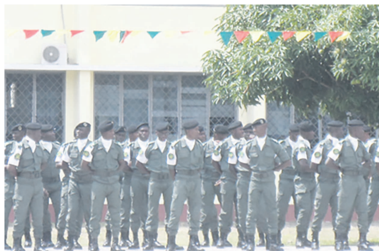
Les heureux promus

Alliant connaissances théoriques et pratiques, la 20 e promotion a