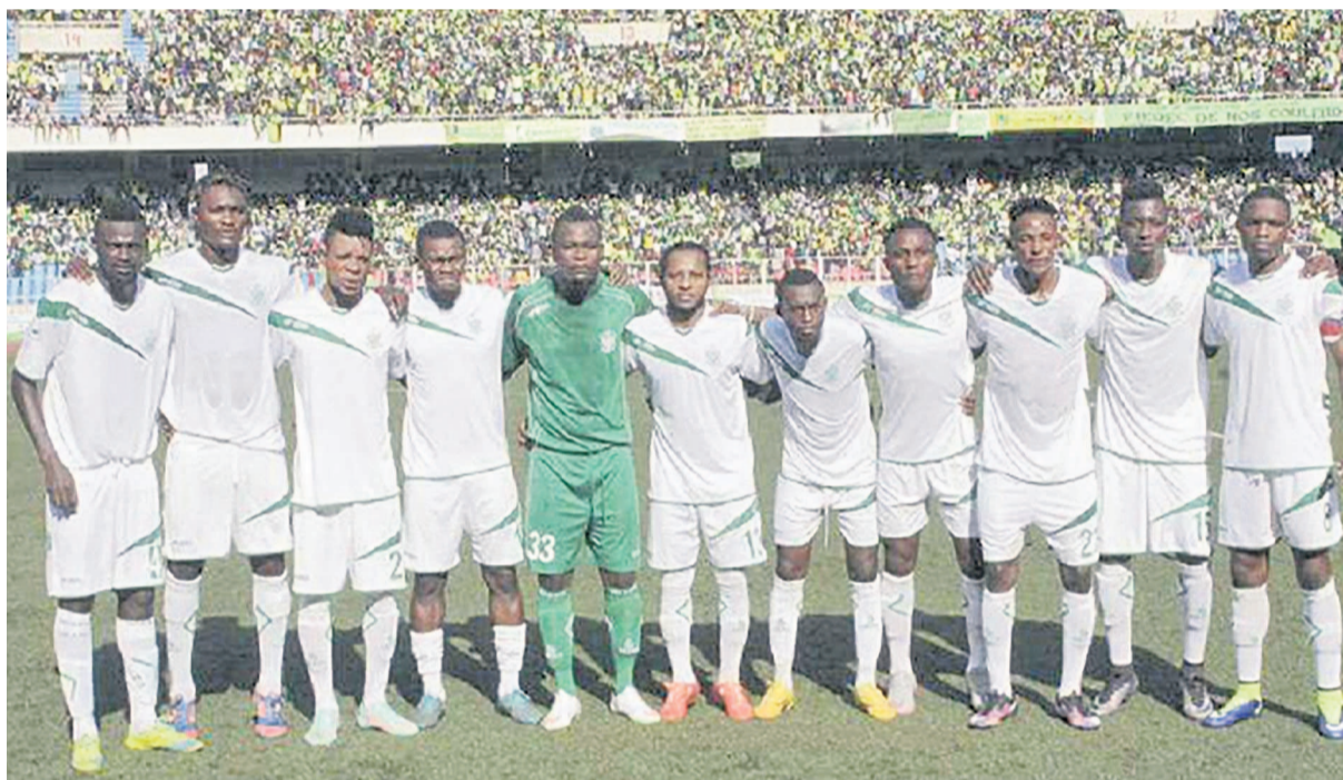
DCMP V.Club encaisse deux