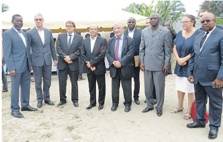
Photo de famille des responsables du Samusocial posant avec leurs partenaires «adiac»

Le président du conseil d'administration a, cependant, appelé les donateurs à réfléchir à la mise en place d'un dispositif pour la formation de ces jeunes qui demain deviendront des adultes. « Je voudrais me retourner encore vers les donateurs pour voir comment on peut initier une réflexion sur leur formation, trouver d'autres structures de relais pour former ses jeunes à des petits métiers pour leur permettre de se prendre en charge quand ils vont atteindre 18 ans, puisque le samusocial ne fait que la prise en charge sanitaire et psychosocial