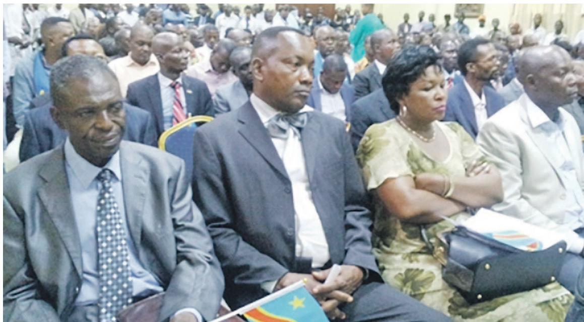
Une vue de l'assistance

Il n'est nullement question, de l'avis de ce