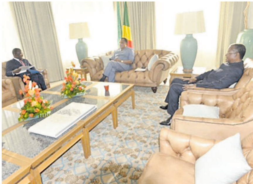
L'émissaire de Faure Gnassingbe reçu par Denis Sassou N'Gusso

Justement, il y a quelques jours, le 15 octobre dernier, il s'est tenu à Lomé, le sommet sur la sécurité maritime et le président Sassou N'Gusso a joué un rôle déterminant, dans la conduite des travaux et dans l'adoption de la charte sur la sûreté et la sécurité maritime. Même s'il était ici au Congo-Brazzaville il y a peu, le président Faure Gnassingbe a estimé qu'il était bon que je vienne ici réitérer cela à son grand frère et homologue Denis Sassou N'Gusso, sa gratitude et celle du peuple togolais pour la contribution particulière qu'il a apportée lors de ce sommet, mais