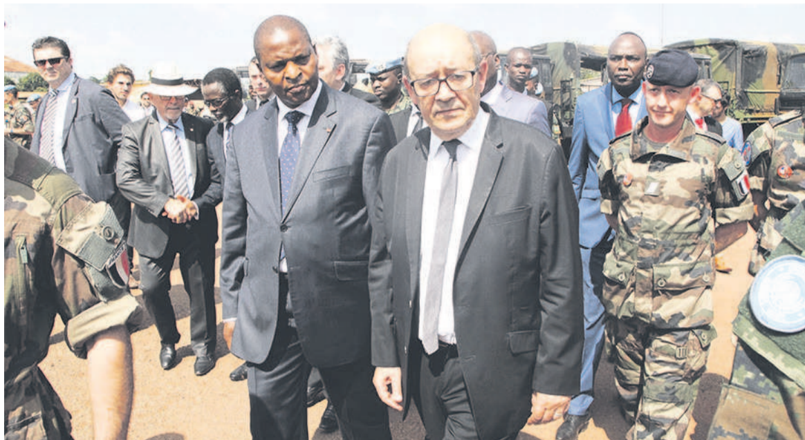
Le président de la République centrafricaine Faustin-Archange Touadéra et le ministre de la Défense Jean-Yves Le Drian à la base militaire de Mpoko à Bangui le 31 octobre 2016

Devant les Parlementaires centrafricains, Jean-Yves Le Drian a déclaré : « la force Sangaris a contribué de manière déterminante à la stabilisation du pays ; elle a enrayer les cycles d'exaction de masse, de représailles, de vengeances... ». Et rassurant, il a indiqué que si une nouvelle spirale de violence l'imposait, les dispositifs français présents au Gabon et au Tchad pourraient être dépêchés. La France, a-t-il ajouté, maintiendra sa contribution à la restructuration des Forces armées centrafricaines (Faca) sous le contrôle des forces de l'Union européenne de l'EUTM. Ce retrait « ne signifie pas la fin des relations militaires entre la France et la Centrafrique », l'armée française restera « certes moins visible mais présente, active et vigilante », a souligné le ministre. Du nom d'un papillon, Sangaris, l'opération a été lancée en décembre 2013 en vue de mettre fin à une escalade de violences entre des communautés ; plus de 2000 hommes ont pu être mobilisés au plus fort de la crise. Depuis juin dernier, les effectifs ont été ramenés à 350 soldats. Il passera à 300 hommes d'ici début 2017. Le relais est pris par 12 500 Casques bleus de la Minusca, avec l'appui de l'Union européenne.