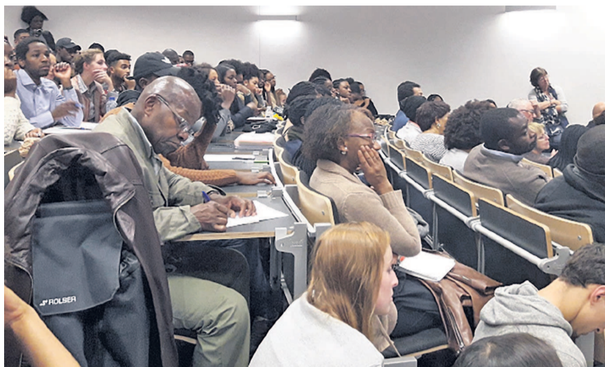
Vue d'une partie du public

À cet effet, a-t-elle indiqué, beaucoup d'enfants métis n'étaient pas reconnus, car seulement un papa sur dix reconnaissait un enfant métis. « Les Belges le faisaient moins contrairement aux grecs, aux portugais ou aux asiatiques. Les enfants non reconnus grandissaient avec la