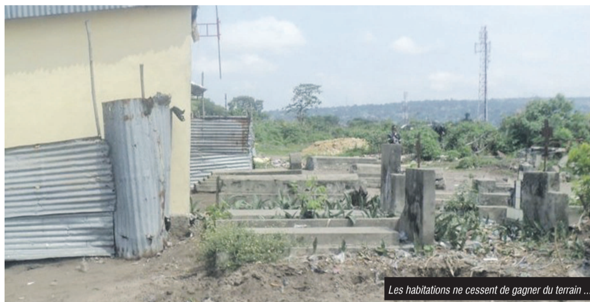
Les habitations ne cessent de gagner du terrain ...

La fête de Toussaint a encore donné, hier, l'occasion de faire le constat amer sur l'état des cimetières publics. À Brazzaville, où des membres du gouvernement se sont déployés pour honorer les morts, l'image d'Epinal a été le cimetière de la Tsiémé qui continue d'être spolié.