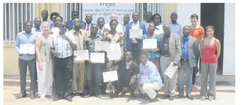
Photo de famille de vingt éducateurs et travailleurs sociaux au terme de leur formation

L'ONG Apprentis d'Auteuil et le Réseau des intervenants sur le phénomène des enfants en rupture (REIPER) ont clôturé, le 28 octobre à Brazzaville, une séance de formation des éducateurs et travailleurs sociaux intervenant auprès des jeunes vulnérables et des enfants en situation de rue.