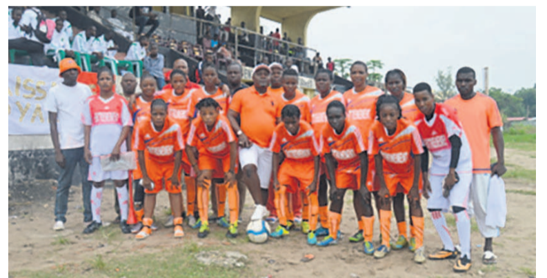
L'équipe Renaissance Royale du Congo