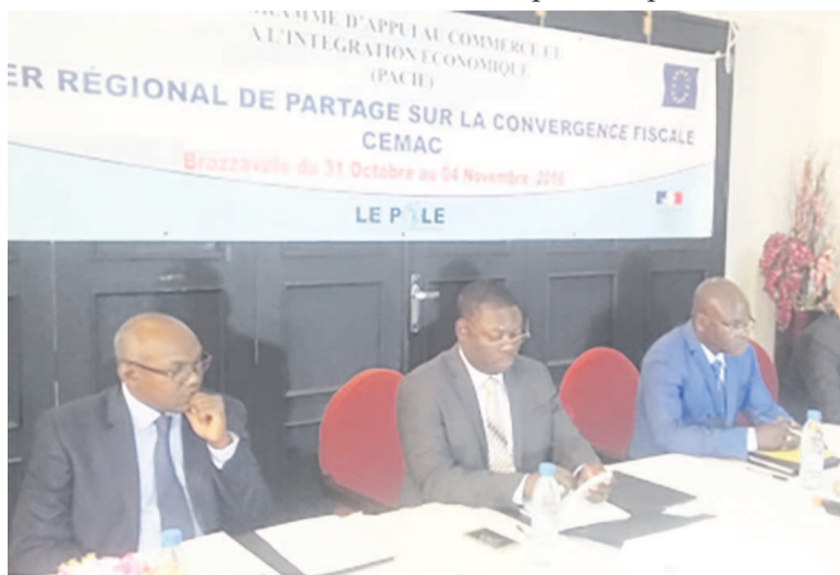
Le présidium des travaux

L'objectif visé : présenter le rapport synthèse sur la situation de la transposition des textes fiscaux communautaires dans chaque état membre de la Cémac; recenser les difficultés rencontrées ; proposer au besoin des réajustements de la norme pour en faciliter l'intégration dans les corpus nationaux. Des pistes de réflexion sur les nouvelles problématiques