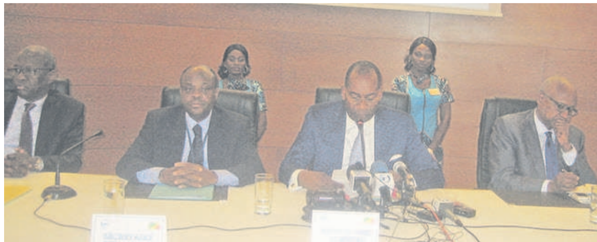
Le présidium lors de la clôture des travaux

« Par ces nouvelles décisions, nous avons poursuivi le renforcement de la gouvernance