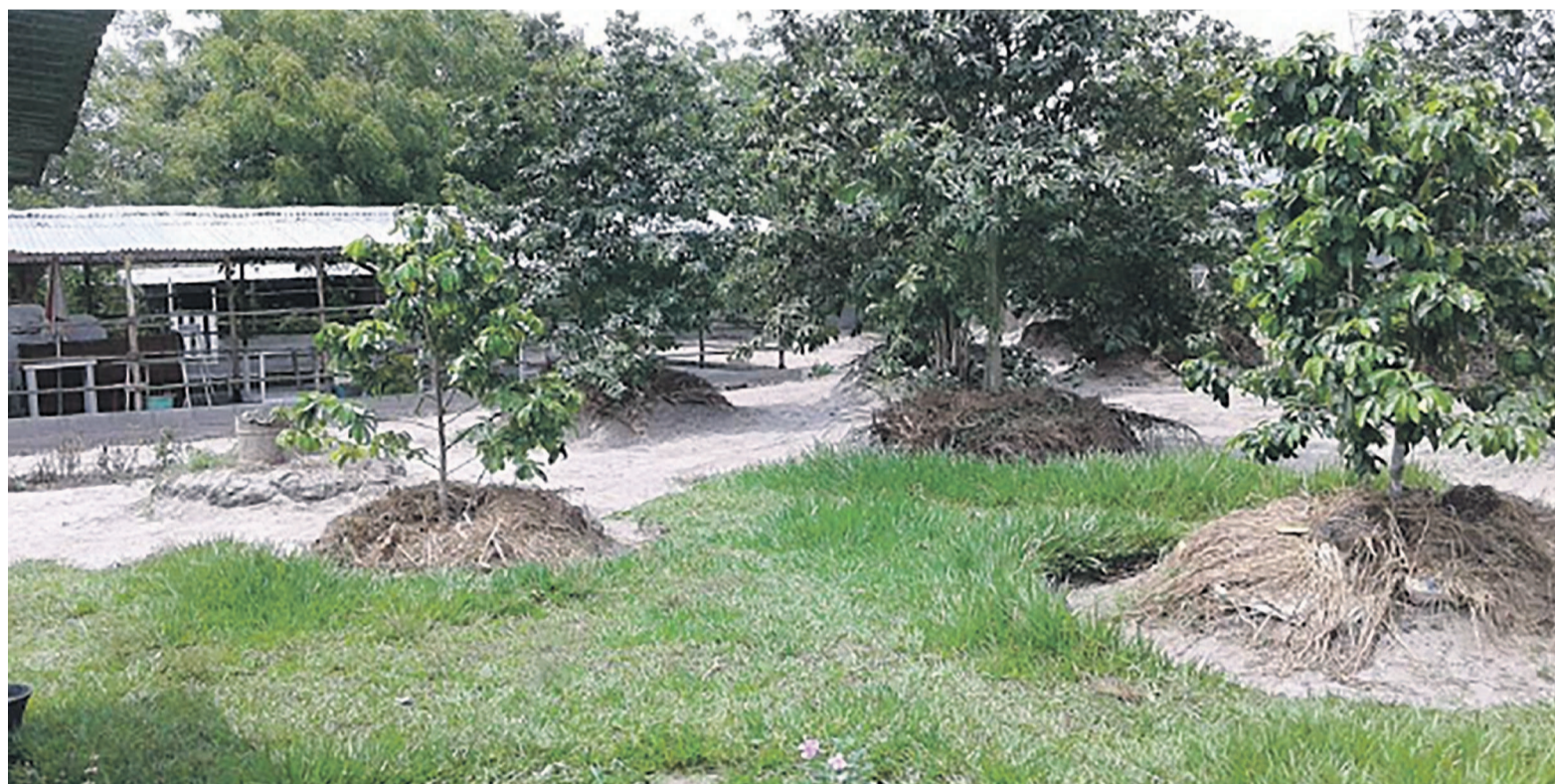
Une vue de la ferme Agrialoango

Les visites scolaires et familiales, avec possibilité de passer la journée à la ferme, se font à la demande avec le choix des thèmes. Cette année, la ferme propose des thèmes sur la culture du haricot vert sous abri (serre), l'irrigation au goutte à goutte, l'élevage de la poule locale, la découverte des métiers agricoles et de la ferme, la découverte du verger et l'apprentissage à l'entretien