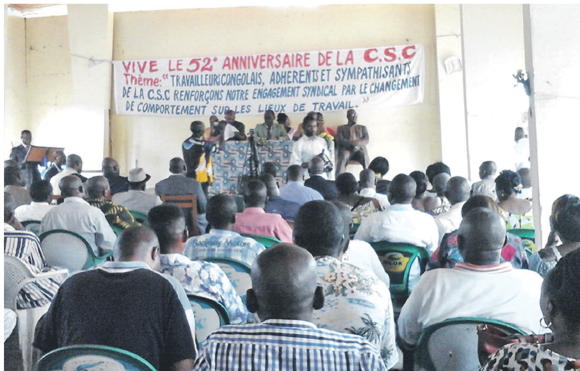
Une vue de la salle lors des festivités

de le répéter que nous sommes pour un syndicat de propositions. Face à la crise causée par la baisse du prix du baril de pétrole, la CSC invite le gouvernement, le patronat et les autres acteurs au développement à rechercher les solutions optimales pour garantir le travail décent, les salaires et autres accessoires», a dit le secrétariat confédéral qui a, par ailleurs, appelé à se mobiliser pour entre autres combattre les suppressions d'emploi, surtout dans la sous-traitance, les violations répétées des droits des travailleurs et condamner les employeurs qui ne reversent pas les cotisations sociales à la CNSS pour le compte des travailleurs. Le secrétariat a aussi invité les structures syndicales du pays à axer leurs activités sur la jeunesse : «Il faut désormais apporter des réponses syndicales aux besoins des jeunes ; cet objectif doit devenir un axe majeur de notre activité. Une grande partie de jeunes partagent les objectifs de la CSC. Avec les jeunes, la CSC est déterminé à relever le défi d'une activité syndicale qui favorise les solidarités intergénérationnelles pour permettre