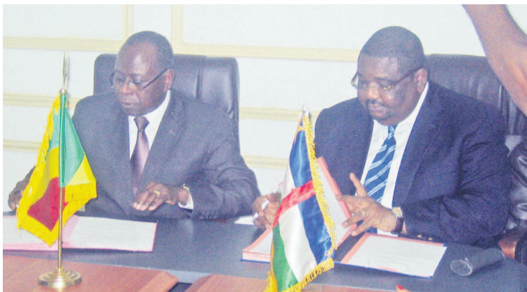
Les deux ministres signant le mémorandum d'entente

Pour la partie centrafricaine, en effet, compte tenu de l'évolution du contexte économique intervenue durant toutes ces années, il fallait réac-