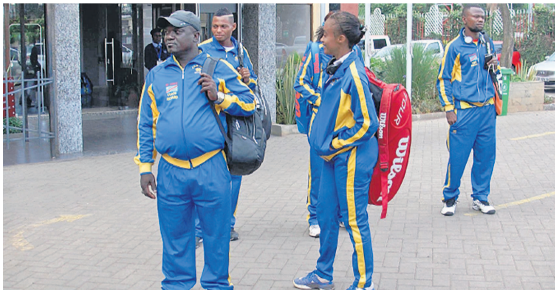
La délégation congolaise de tennis s'apprêtant à s'envoler pour Nairobi au 14 e championnat d'Afrique

Les Léopards tennis de la RDC prennent part à la 14 e édition du Championnat d'Afrique des nations de tennis.