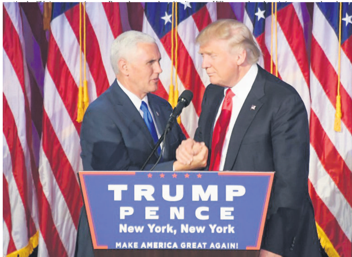
Donald Trump, à New York, au côté de Mike Pence, candidat au poste de vice-président, après l'annonce de sa victoire face à Hillary Clinton

Ce milliardaire imprévisible, que personne n'avait vu venir, avait promis lundi un «Brexit puissance trois», référence au vote surprise des Britanniques pour