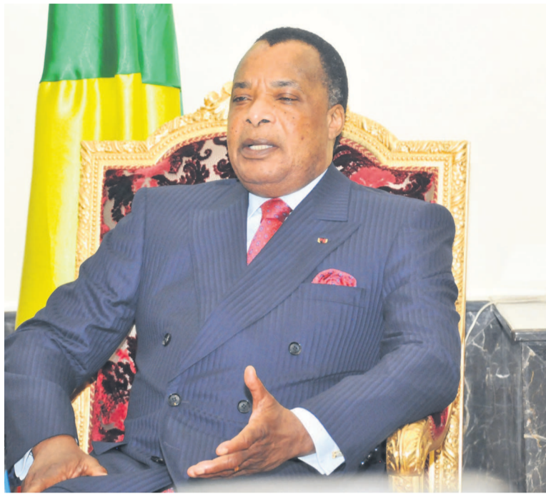
Denis Sassou N'Guesso

S'adressant toujours aux populations et dirigeants politiques du Pool, le président de la République a souligné qu'« au lieu de fuir, d'avoir peur, ils ne peuvent pas jouer double jeu. Ils doivent prendre position clairement. Qu'ils se mettent avec le