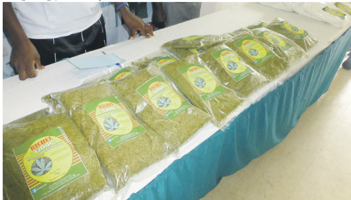
Les produits de Rachetée Rachel Kombela