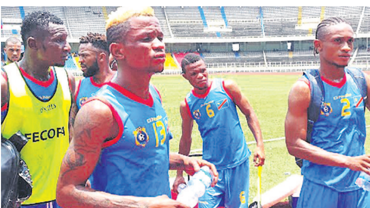
Les Léopards en séance d'entraînement