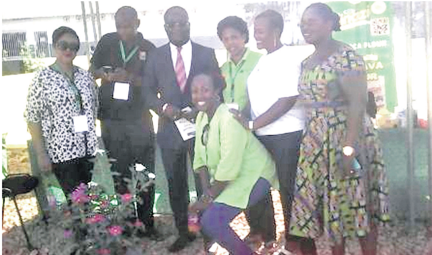
L'ambassadeur Guy Nestor Itoua avec les exposants rwandais.

Pour le cas du Congo et du Rwanda, les représentations diplomatiques des deux pays sont résolument engagées à accompagner les commerçants rwandais et congolais dans la facilitation des formalités administratives et consulaires. Le commerce interrégional ne représente que 2 % du total des échanges de la Communauté économique des États de l'Afrique centrale (CEEAC) que vient de réintégrer le Rwanda, soit environ 1,5 milliard de dollars. Ces chiffres très bas sont en deçà du potentiel de la sous-région. La CEEAC regroupe 11 pays avec un marché d'environ 160 millions de consommateurs. «La promotion du commerce intra-africain est un thème très cher à nos deux chefs d'État, à savoir Denis Sassou N'Guesso du Congo et Paul Kagame du Rwanda qui l'ont réaffirmé lors de leur récente rencontre à l'occasion de la visite de travail effectuée