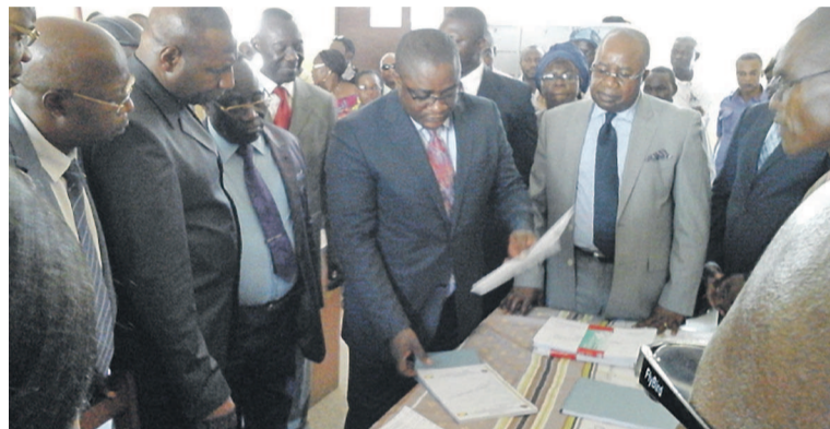
Ange Aimé Bininga expliquant les étapes du recensement lors de la descente au lycée Victor-Augagneur

Débutée à Brazzaville il y a deux semaines, l'opération de contrôle physique des agents de l'État a été lancée les 14 et 15 novembre dans les départements de Pointe-Noire et du Kouilou par Ange Aimé Bininga, ministre de la Fonction publique et de la Réforme de l'État, qui a ensuite effectué des descentes dans certaines structures publiques en vue de se rendre compte de l'effectivité et du bon déroulement de l'activité.