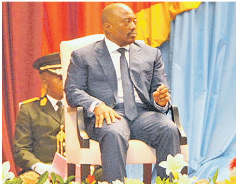
Joseph Kabila devant le Congrès

Tout en affirmant que l'alternative comme option de bon sens tel que prôné par cette frange de l'opposition était simplement inacceptable et dont l'effet suicidaire serait de replonger le pays dans le chaos à l'instar d'autres États du continent. Et d'ailleurs, Joseph Kabila a tranché sèchement. « Soucieux de ma responsabilité de garant du fonctionnement des institutions, je ne peux permettre que la RDC soit prise en otage par une frange de sa classe politique », a-t-il déclaré