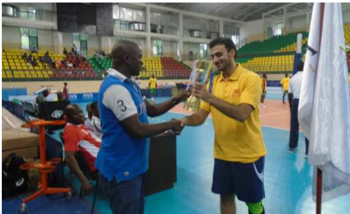
La coupe est revenue à l'organisateur parce que l'objectif n'était pas de gagner

eu ni vainqueur ni vaincu puisque la coupe est revenue à l'organisateur, parce que l'objectif n'était pas de gagner. Pour la transmission du relais à la nouvelle génération, les jeunes cadettes se sont affrontées en ouverture du challenge. « Il y a eu dans la politique de développement de la fédération, nous avons eu à lancer nos jeunes cadettes. Il y a six équipes cadettes que nous allons lancer pendant le championnat national. Avec l'autorisation de l'organisateur, ces jeunes ont eu à jouer en ouver-