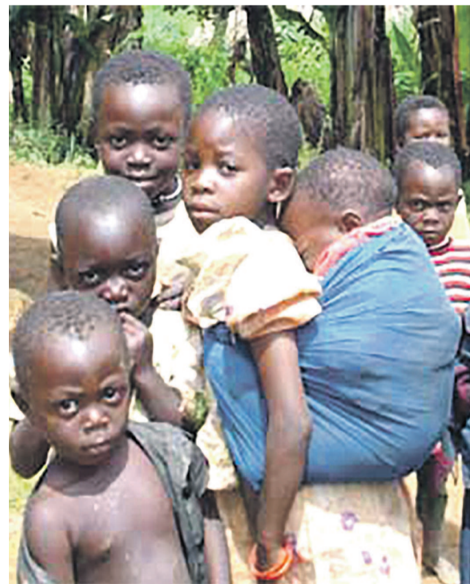
La pneumonie demeure l'une des principales causes de décès des enfants

Fatoumata Ndiaye, directrice générale adjointe de l'Unicef pense que la pollution atmosphérique liée aux changements climatiques affecte la santé et le développement des enfants en entraînant des pneumonies et d'autres infections respiratoires. « Deux milliards d'enfants vivent dans des zones où la pollution de l'air extérieur est supérieure aux recommandations internationales, et beaucoup d'entre eux tombent malades et meurent à cause de cette