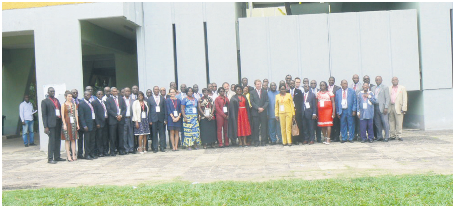
La photo de famille des acteurs de la CicosAdiac

naux, des ONG, des organisations de la société civile, des usagers de l'eau et des repré-