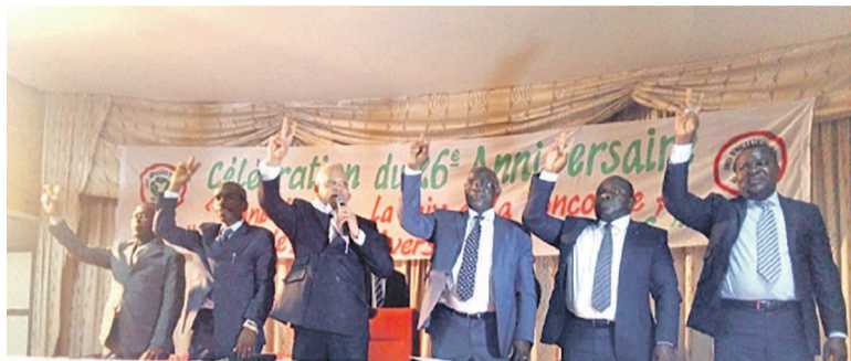
Jean-Marc Thystère Tchicaya entouré des membres de son parti

Les festivités se sont déroulées, le 13 novembre, dans la ville océane sous la férule de son président Jean-Marc Thystère Tchicaya accompagné d'autres membres des départements de Pointe-Noire et du Kouilou.