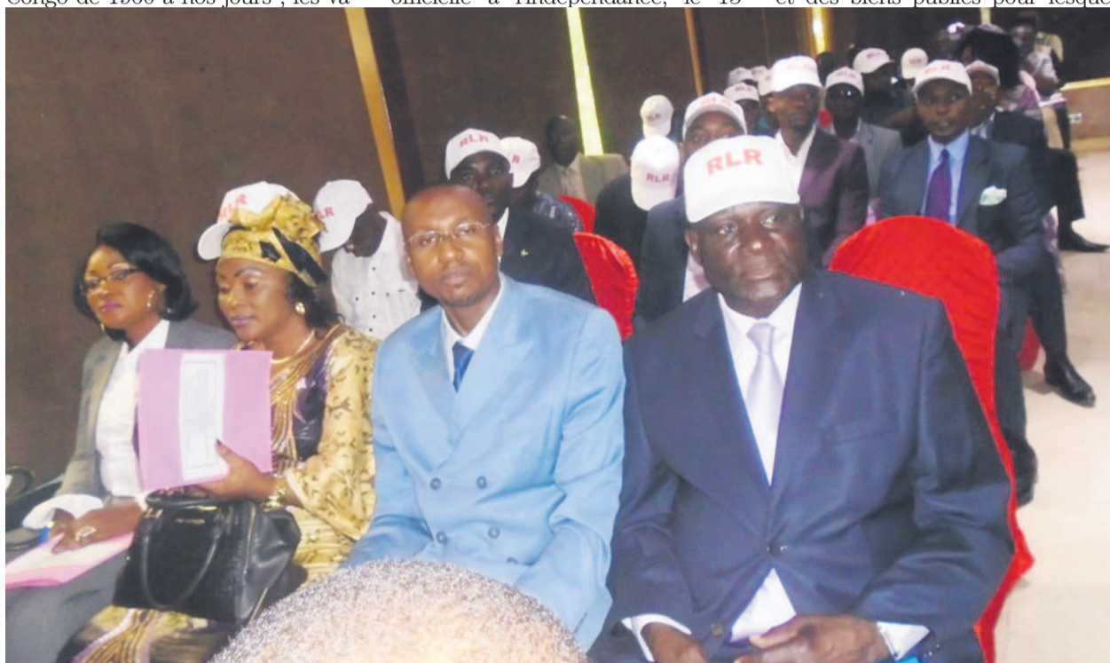
Une vue des membres du RLR lors du séminaire Adiac

Il s'agit entre autres des valeurs de paix, d'unité, de dialogue, d'amour de la patrie ; respect des autorités et des biens publics pour lesquels