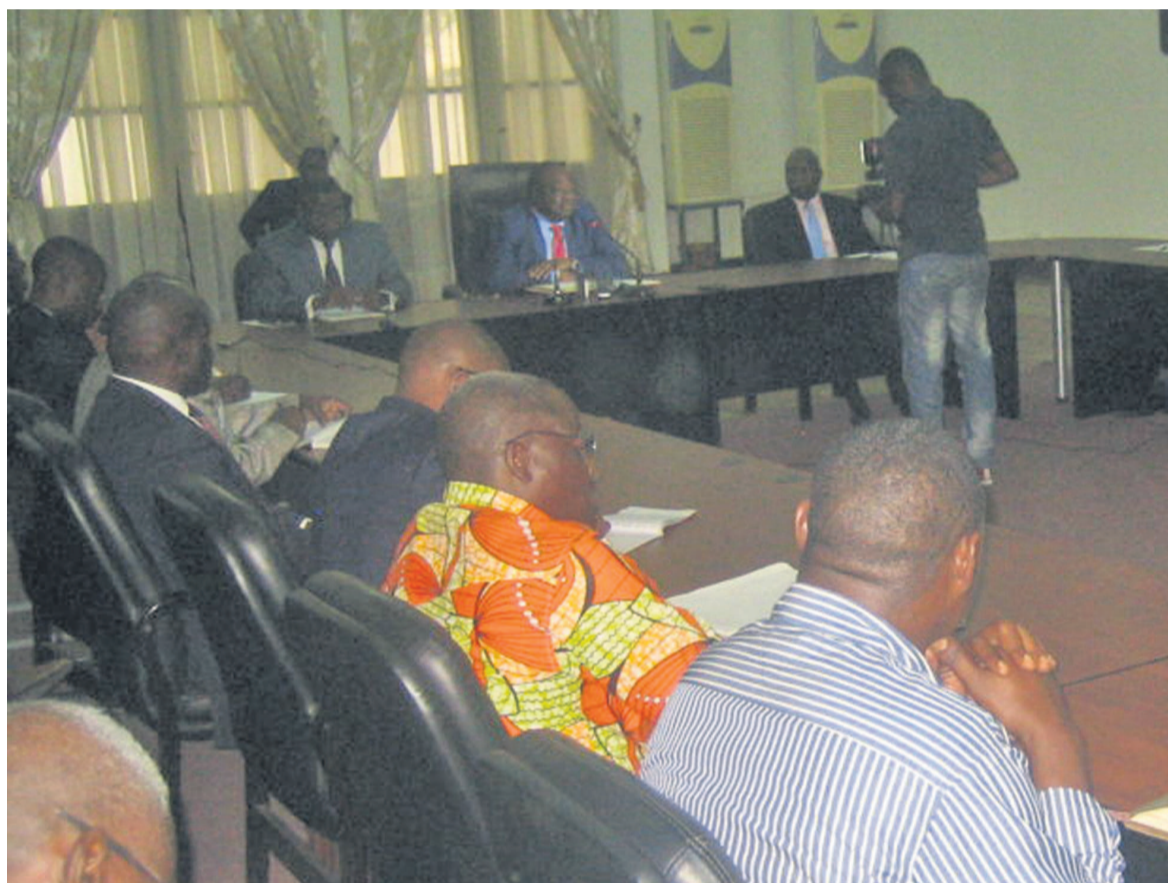
Le ministre Euloge Landry recevant des commerçants