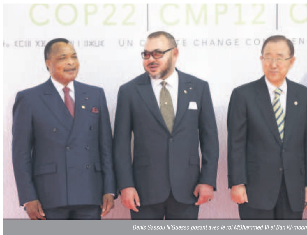
Denis Sassou N'Guesso posant avec le roi MOhammed VI et Ban Ki-moon