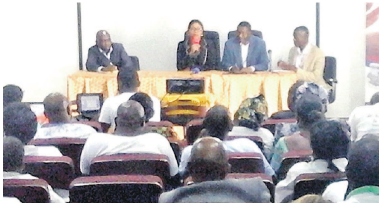
Une vue de la salle lors de la rencontre

Les orateurs ont aussi signalé que l'hérédité est le premier facteur de cette maladie, précisément du diabète de type 1, et le diabète de type 2 peut être évité ou retardé