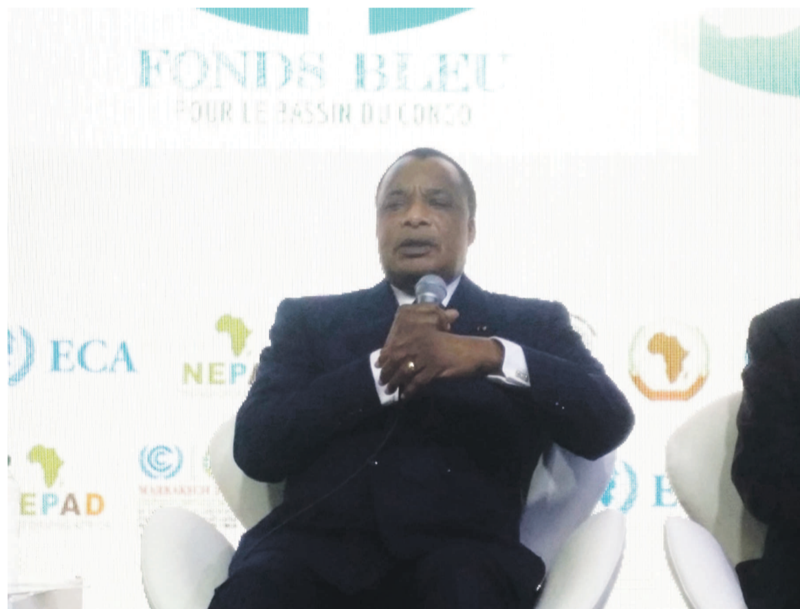
Le président Denis Sassou N'Guesso présentant le Fonds bleu à la tribune de la COP22

réchauffement climatique dans la région.