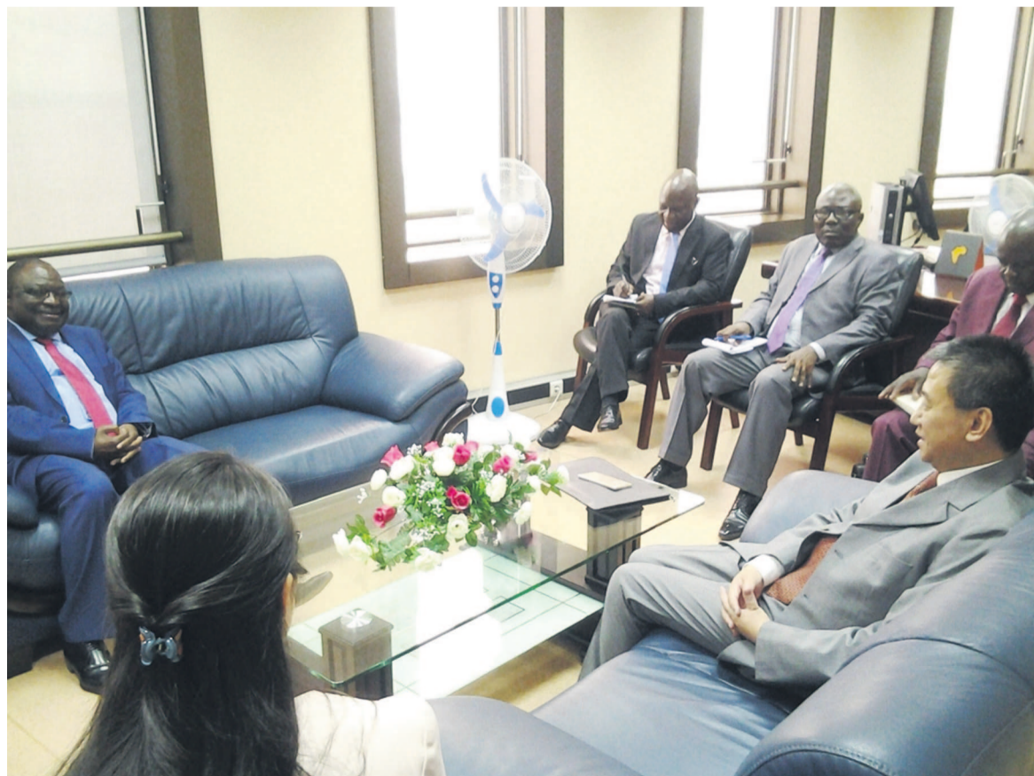
Vue de la salle lors de l'audience