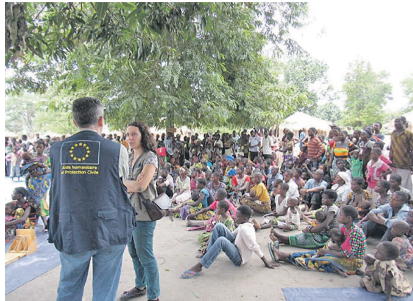
Des déplacés attendant l'aide d'Echo

Il est, en effet, rappelé que la crise humanitaire en RDC est une des plus longues et complexes qui soient. Des conflits récurrents ont entraîné des déplacements massifs de populations et une crise