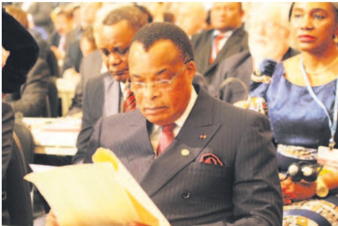
Le président Denis Sassou N'Guesso lors de la conférence

Le président français François Hollande s'est posé plutôt en grand défenseur de l'accord de Paris en mettant en garde les USA qui: «doivent respecter les termes de l'accord de Paris sur le climat et le président Trump doit s'y conformer. Cet accord est irréversible dans les lois, dans les faits et dans l'esprit». Le président français est convaincu que la vingt-deuxième conférence de l'ONU sur le climat marque un tournant décisif dans le passage des grandes intentions aux actions concrètes: «la COP22 doit être celle des solutions». Ainsi, sa volonté est de rendre l'accord de Paris opérationnel et accélérer l'action climatique avant 2020 tout en respectant les droits humains.