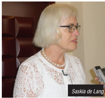
Saskia de Lang

La représentante de l'Union européenne au Congo, Saskia de Lang, a échangé avec le ministre de la Justice et des droits humains, Pierre Mabiala avec qui elle a évoqué les préparatifs des festivités liées à la Journée internationale des droits de l'Homme célébrée le 10 décembre de chaque année.