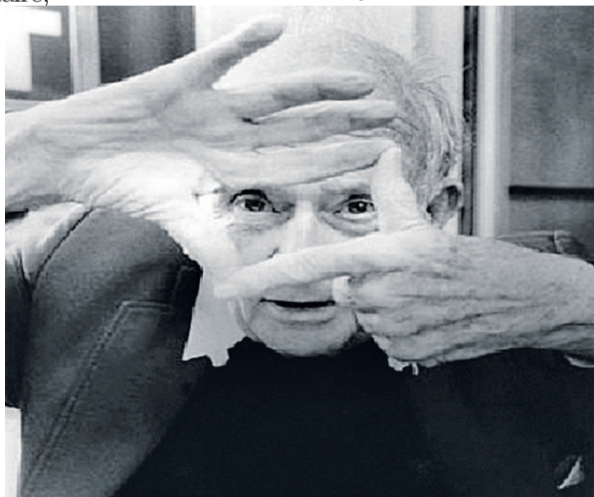
Jean Rouch

qui a été plusieurs fois récompensée à Venise, Cannes et Berlin se compose de documentaires ethnographiques (Maîtres fous ; Sigui synthèse), sociologiques (Chronique d'un été) et de fictions (Moi, un Noir ; Cocorico Monsieur Poulet). Jean Rouch fut également directeur de la cinémathèque française, directeur de re-