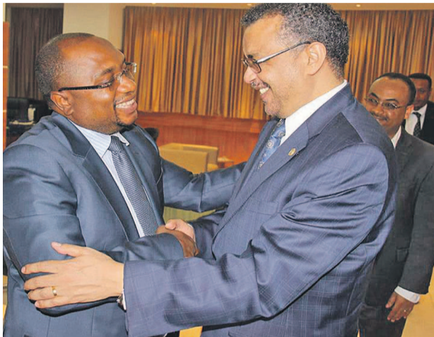
Le ministre de la Santé recevant dans son cabinet le ministre éthiopien des Affaires étrangères

Avec la bénédiction de l'Union africaine (UA), le ministre éthiopien des Affaires étrangères, le Dr Tedros Adhanom Ghebreyesus, est candidat au poste de directeur général de l'Organisation mondiale de la santé (OMS).