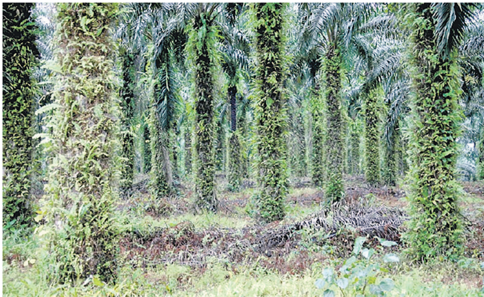
Une palmeraie

Cette Déclaration de Marrakech, a noté l'ONG internationale, résulte d'efforts actuels consentis par les représentants du secteur privé, public et de la société civile des pays concernés sous l'égide de l'Alliance pour les forêts tropicales 2020 (TFA 2020). « Elle signifie la reconnaissance aux yeux de tous du fait que l'investissement dans la filière du palmier à huile en Afrique, dont on espère les retombées économiques dans la région, comporte aussi le risque d'importantes répercussions négatives sur le plan social et environnemental : déboisement, conflits fonciers, violation des droits de l'homme et destruction des hautes valeurs de conservation, notamment », a souligné le WWF. À l'en croire, la Déclaration de Marrakech est l'aboutissement du travail mené par les partenaires en Afrique centrale et de l'Ouest, en collaboration avec l'Alliance pour les forêts