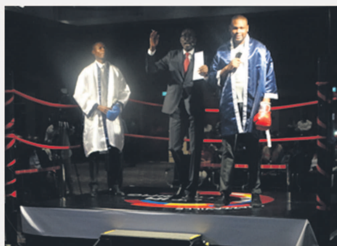
WINGU en blanc, BE & Co en bleu.