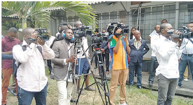
Les cameramen lors d'une activité

Selon ces assises, cet arrêté viole les dispositions de l'« Acte uni-