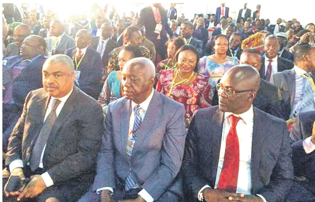
Les délégués de l'opposition présents à la Cité de l'UA