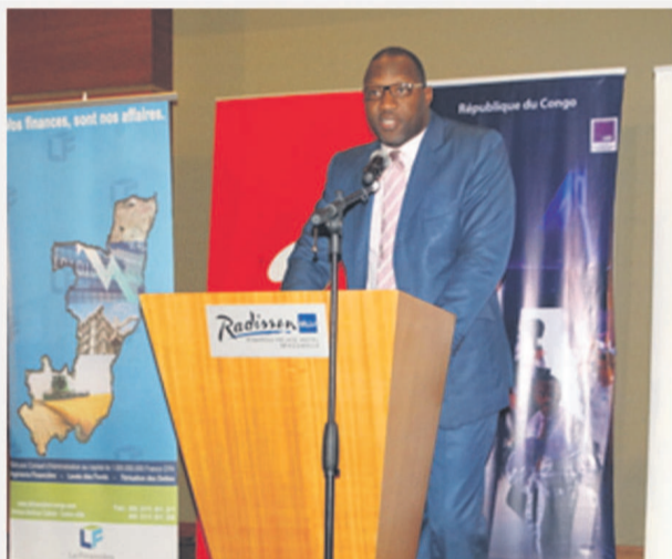
Le Directeur Général Airtel Congo

Jeudi 17 Octobre à 16h à l'hôtel Radisson Blu de Brazzaville a eu lieu la première Edition du concours de présentation de plans d'affaires ou pitching Battle compétition destiné aux start-up, des jeunes entrepreneurs locaux en quête d'opportunités d'affaires.