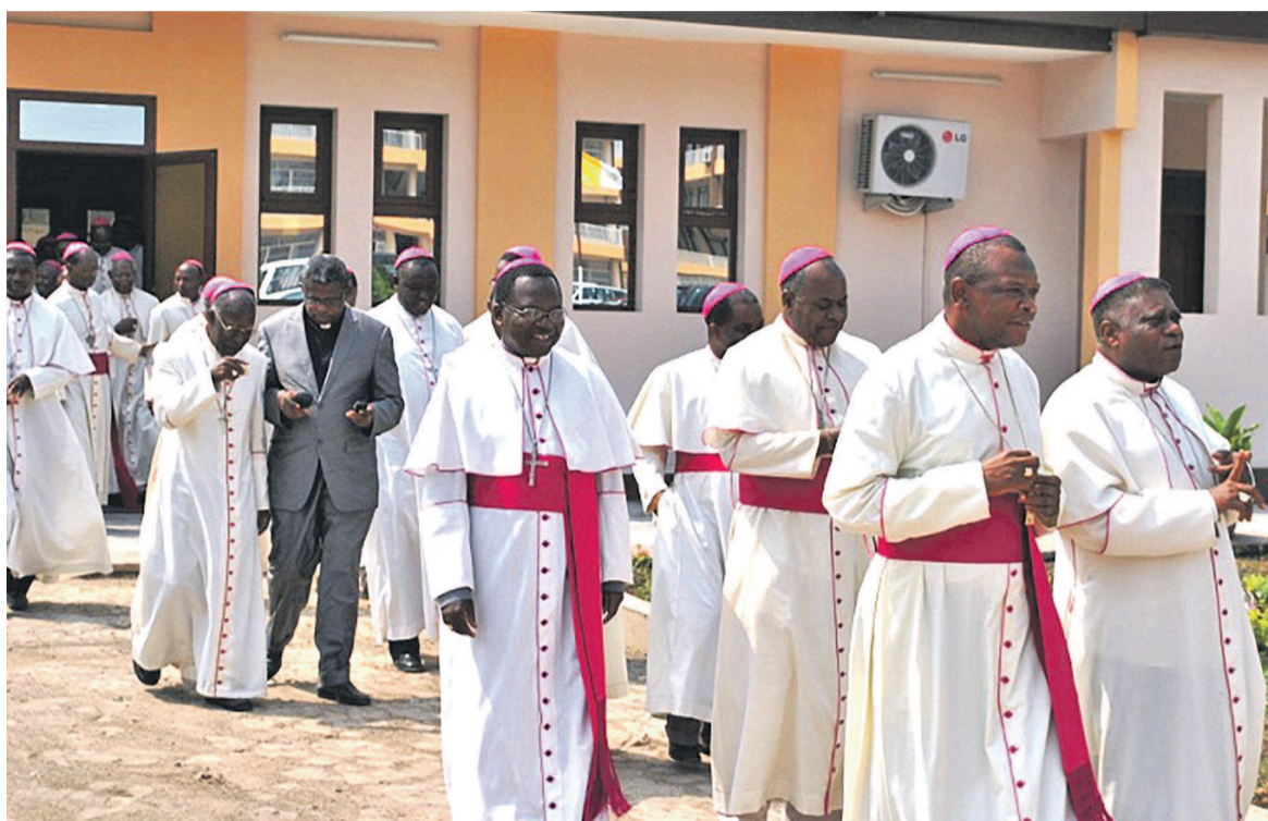
Les évêques catholiques membres de la Céncó