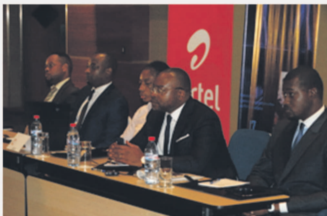
Les membres du jury

Rendez-vous est donc pris pour la deuxième Edition.