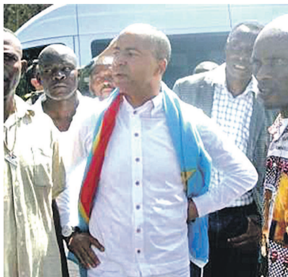
Moïse Katumbi au milieu de ses partisans