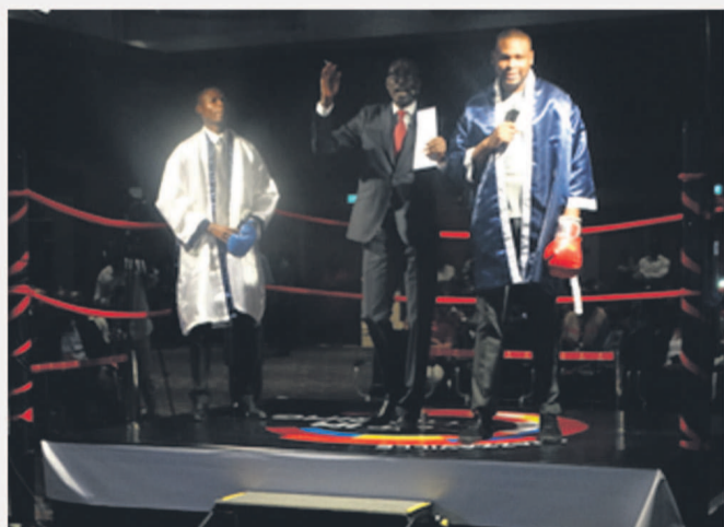
WINGU en blanc, BE & Co en bleu.