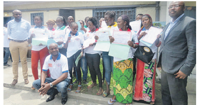
Les jeunes filles formées présentant leurs diplômes

de remise de diplômes aux bénéficiaires, les directeurs départementaux, des Affaires sociales et de l'Artisanat ont félicité l'ONG ASI et ses partenaires pour cette formation en faveur des jeunes filles mineures en détresse. « Les filles sont les plus nombreuses à vivre dans la rue, elles sont peut-être moins visibles que les garçons mais elles sont souvent à la merci de la violence, de l'agression sexuelle, de la prostitution qui est devenue une véritable plaie de société. Cette formation que vient de donner ASI leur permet de rebondir