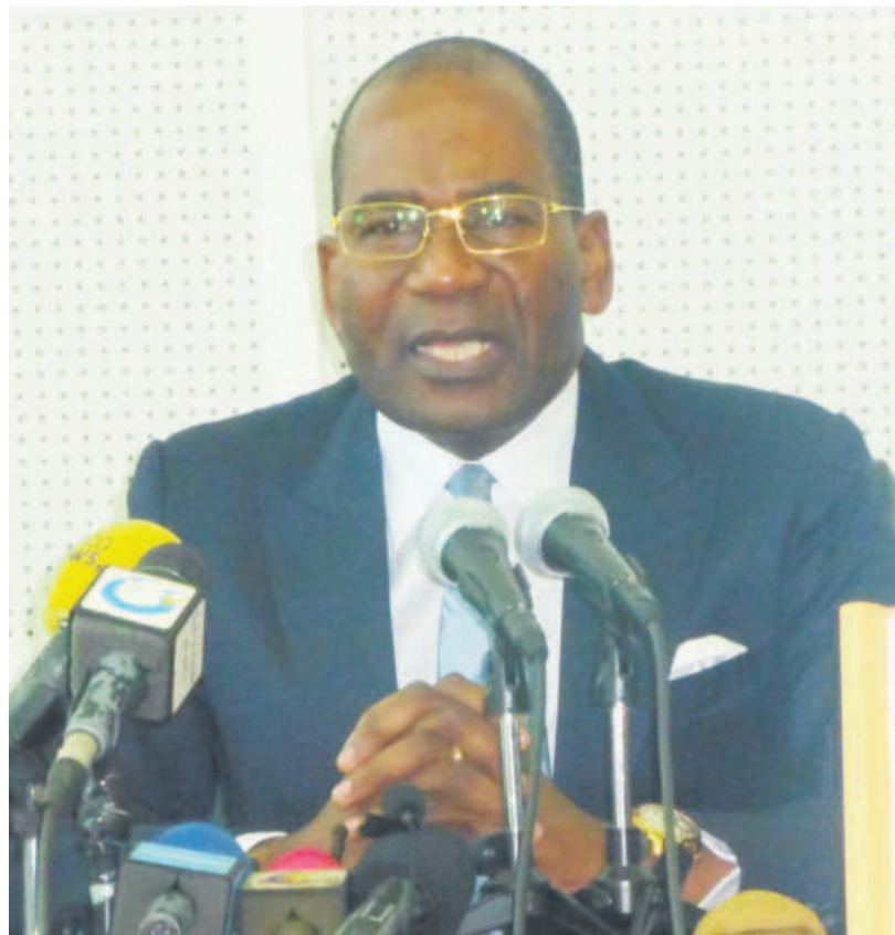
Le ministre Pierre Mabiala lisant le mot liminaire

Il est important de rappeler, a affirmé le ministre, que la société Commisimpex a fait l'objet de deux décisions de justice rendues par la Cour commune de justice et d'arbitrage de l'Ohada, confirmatives de celles rendues par la justice congolaise prononçant sa faillite et sa liquidation.