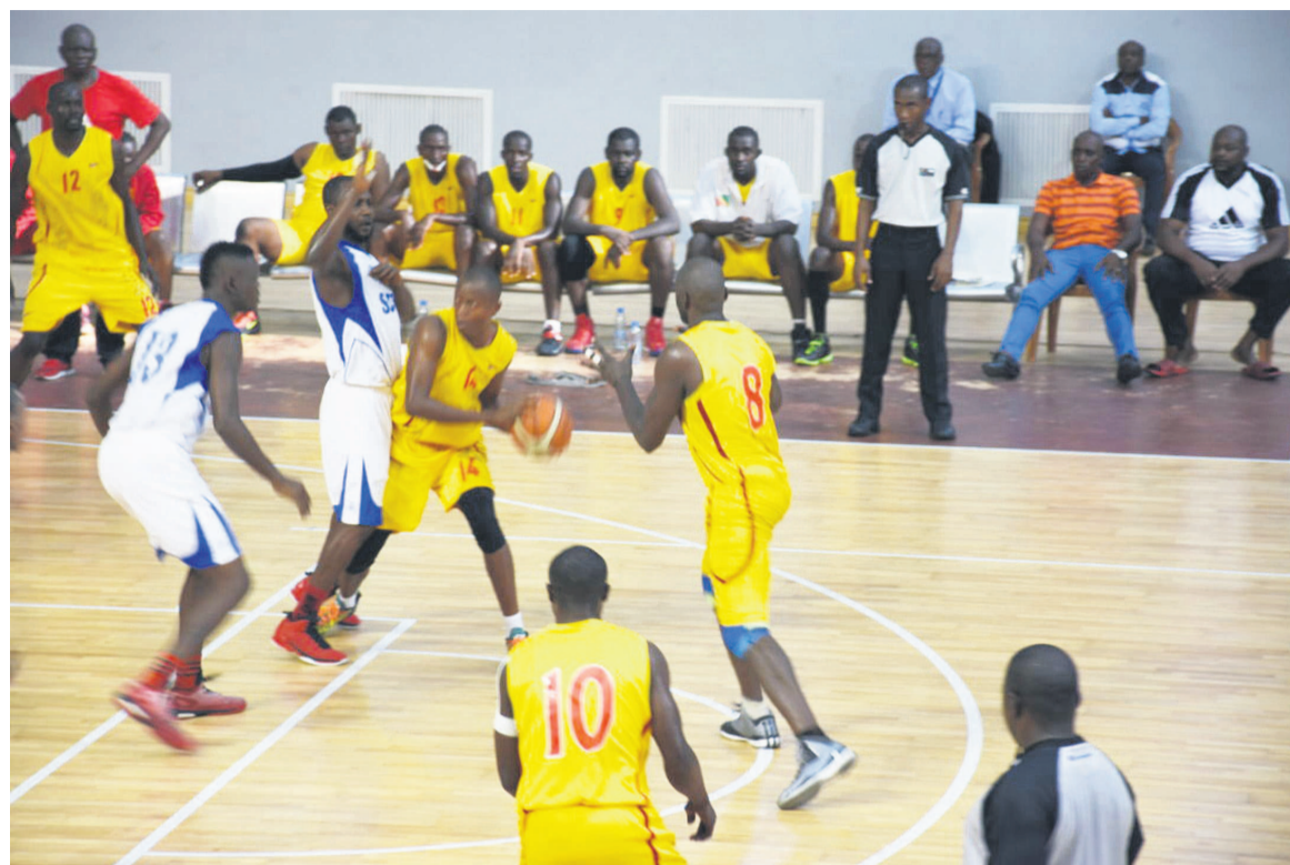
Interclub aligné sa quatrième victoire en dominant SCTP

Patronage a, en effet, chuté face au BC Mazembe 72 paniers contre 81 avant de s'incliner face à l'Inter et devant SCTP 51 paniers contre 91. Cette formation a perdu son