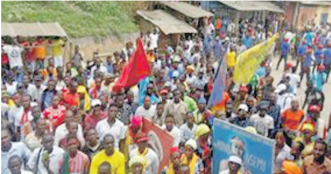
Une vue des manifestants lors de la marche

La population de cette partie de la RDC, conduite par certaines personnalités provinciales, accuse l'incompétence du gouverneur dans la gestion de la province.