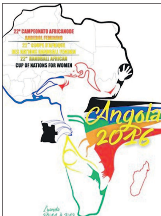
Logo de la 22e CAN seniors dames de handball en Angola