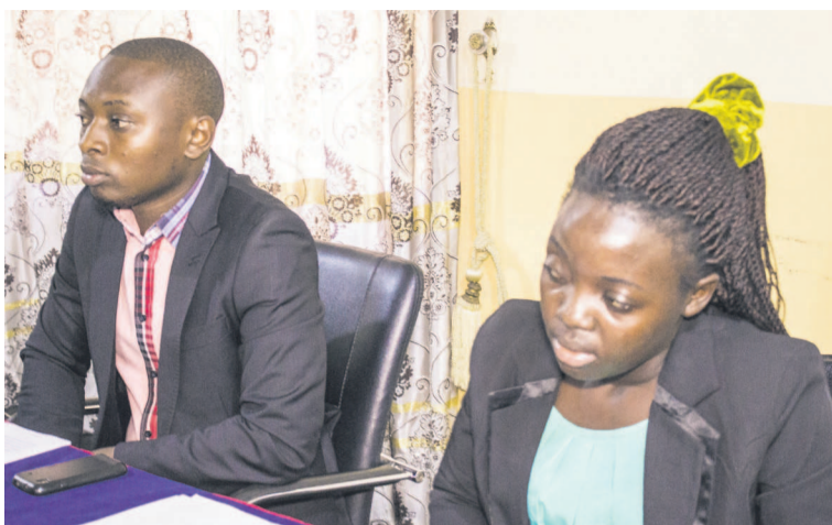
Les membres de l'association répondant aux questions des journalistes 2013. Au cours de la première, les dirigeants démontrent comment la cessation du statut de réfugiés rwandais représente « une injustice par rapport à la situation desdits réfugiés ». Ils ont insisté sur le fait que ce programme de cessation de statut aura peu de valeur, « s'il n'est pas régi par un cadre stratégique et politique

Le document mentionne les conclusions tirées lors des différentes conférences tenues respectivement en novembre 2011, et juin