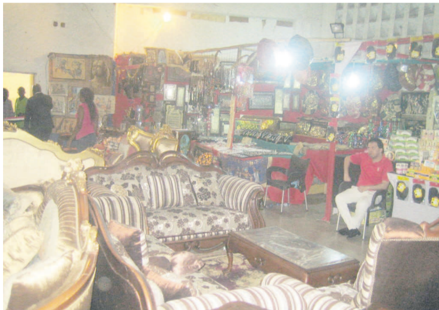
Les articles exposés

Le lancement officiel de la foire égyptienne exposant des mobiliers modernes à la Maison commune de Poto-Poto s'est réalisé le 21 novembre à Brazzaville, en présence des autorités départementales, du maire de l'arrondissement, ainsi que des diplomates malien et égyptien.