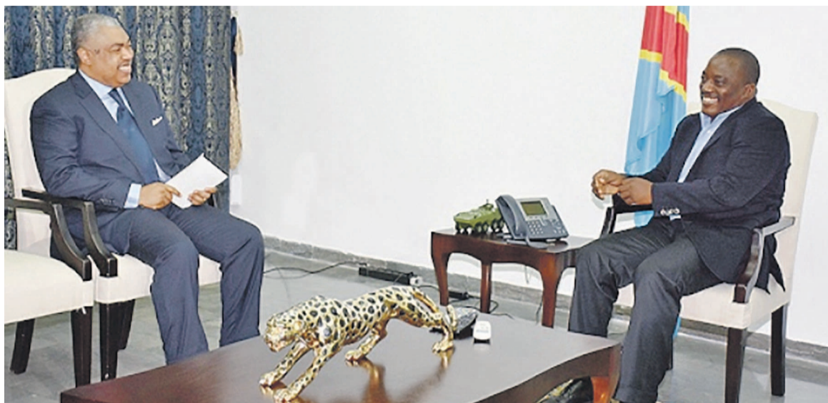
Joseph Kabila et Samy Badibanga

Entre-temps, les pourparlers vont bon train entre les acteurs politiques et sociaux ayant pris