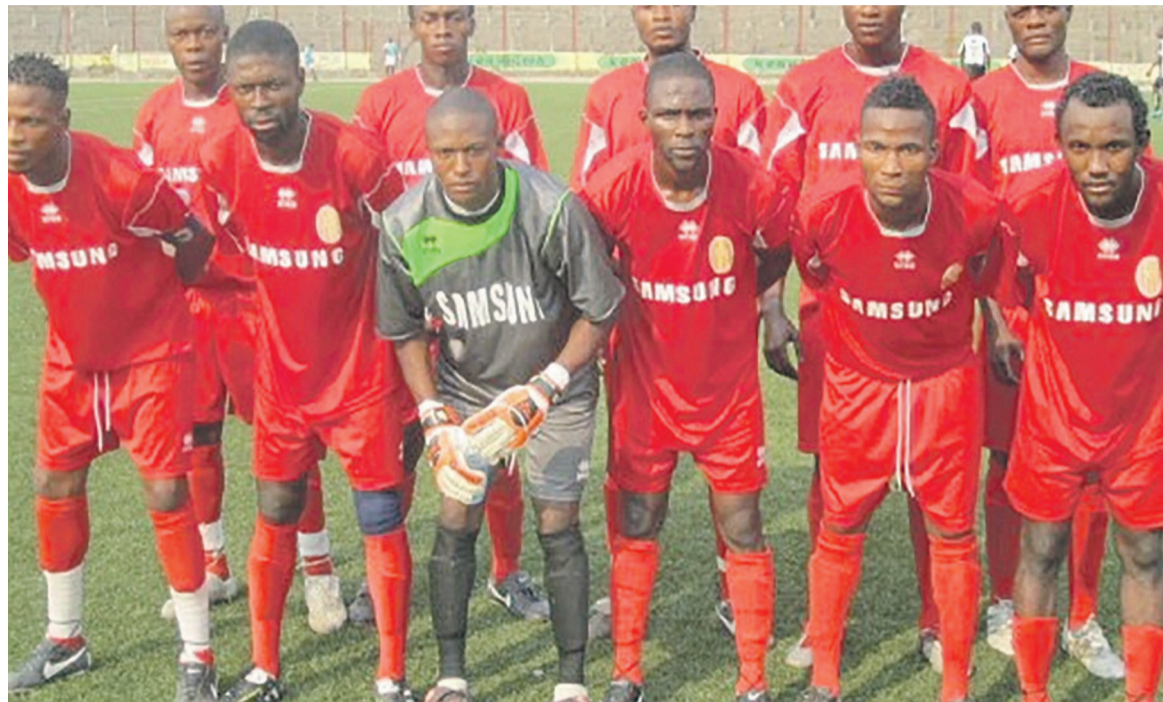
FC MK de Kinshasa