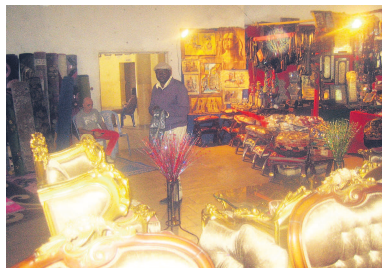
Une vue de l'exposition

Congolais. Un accent particulier est mis sur la décoration intérieure avec des salons modernes dessinés par des artisans égyptiens, des tableaux, des pots de fleurs, des tapis-salons et biens d'autres objets d'art. L'exposition a également renforcé le côté ustensile de cuisine avec des produits adaptés au contexte local, explique Karim Megahed, directeur général adjoint de l'exposition. Il se réjouit de la promotion que vient de lancer la foire. « Pendant les jours ouvrables, les produits sont vendus avec une réduction de 15%. Le week-end, il y a une réduction de 25% sur les prix », a indiqué Karim Megahed. Comme lors de toutes les expositions de « La maison moderne », le couloir destiné à la vente des