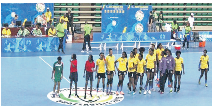
Les Léopards dames handball de la RDC

La RDC a perdu son match d'entrée de la 22 e Coupe d'Afrique des nations de handball féminin face au Sénégal. La compétition se joue en Angola et met en compétition neuf nations après le forfait déclaré par l'Égypte.