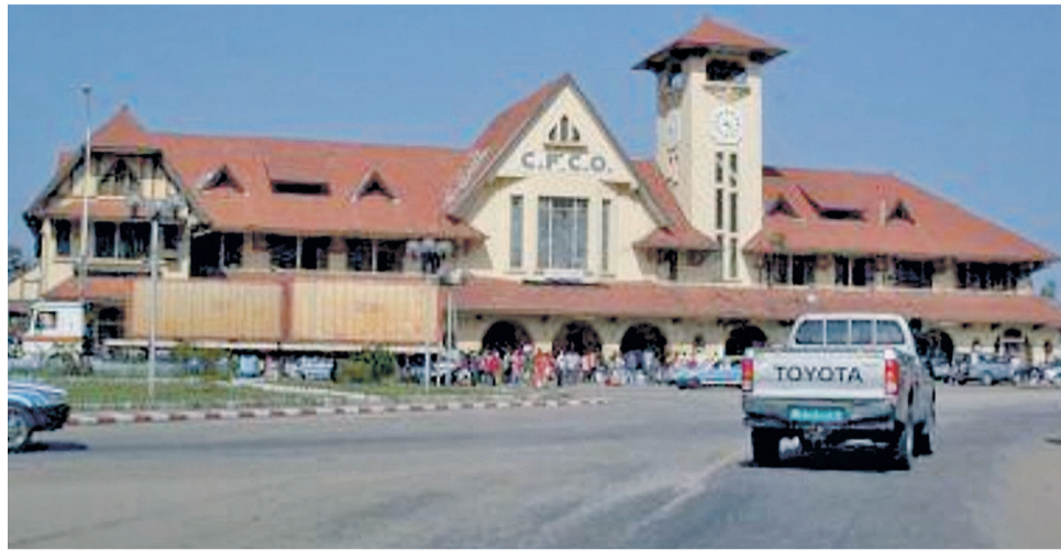
<Sans données à partir du lien>

C'est en cela que l'Unesco a toujours considéré comme priorité parmi ses actions la lutte contre le risque d'infection et la vulnérabilité élevée des adolescents, en particulier des jeunes filles dont l'âge oscille autour de 24 ans. C'est pour quoi la directrice générale de l'Unesco Irina Bokova pense à juste titre que « pendant plus de vingt ans, l'Unesco a aidé des pays à avancer dans leurs programmes de prévention par le biais d'actions visant à promouvoir l'éducation sexuelle complète, ainsi qu'à travers d'autres questions de santé majeures,