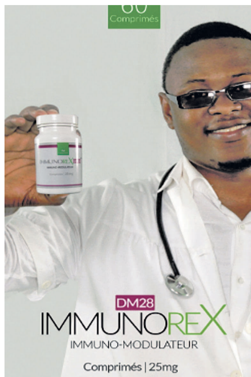
Un échantillon d'Immunorex-DM28

Que faut-il finalement retenir du nouveau médicament Immunorex-DM28 ? Il s'agit, d'après les spécialistes, d'un immuno-modulateur (booster du système immunitaire) qui, dans le cadre de l'épidémie du sida, est la première et unique cible du virus VIH. Élaboré par le Pr Donatien Mavoungou, chercheur africain, biochimiste et directeur du Centre de recherche des pathologies hormonales (CRPH) de Libreville au Gabon, le médicament présente diverses propriétés. Outre le renforcement et la restauration du système immunitaire, la molécule intervient également dans le blocage de la réplication du virus. Il a également des propriétés à interagir dans les cas des résistances aux antirétroviraux. La thérapie se présente sous trois formes, à savoir en comprimé de 25mg, en gélule et sous forme injectable. Indépendamment du HIV, le médicament a aussi donné d'excellents résultats sur diverses maladies opportunistes, telles que la tuberculose, l'hypertension artérielle, le diabète, la dé-