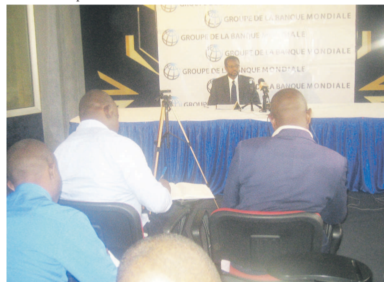
Djibrilla Issa face à la presse congolaise ce mercredi

République du Congo, le groupe de la Banque mondiale tient des réunions périodiques pour évaluer la situation financière et structurelle du pays, en fonction des projets qu'il cofinance, afin de formuler des propositions.