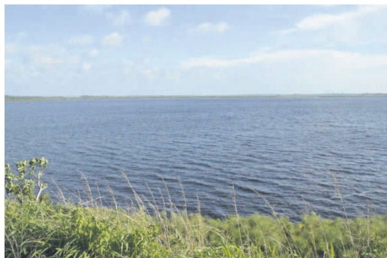
Le lac Nanga

Déjà, sur des berges et un îlot aménagé avec des moyens de bord, les visiteurs prennent du plaisir à déguster du jus de noix de coco et du vin de