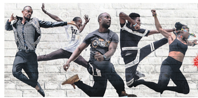
L'affiche de la soirée Sidance