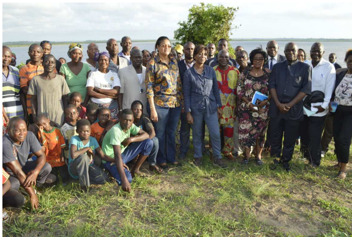
La photo de famille avec un échantillon des habitants du quartier Nanga

« Nous avons déjà des structures implantées (des bungalows, du personnel qui entretient). C'est pourquoi, en collaboration avec madame le maire, le chef de quartier, les habitants de cet arrondissement, tous ceux qui résident et travaillent ici au quotidien, nous allons faire des appels d'offres restreints pour avoir des partenaires auxquels nous allons transmettre les attentes qui sont les nôtres dans ce qu'on appelle un cahier de charges afin qu'il y