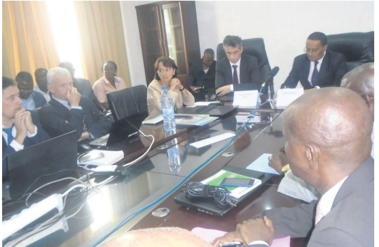
Une vue de participants à la réunion de sensibilisation