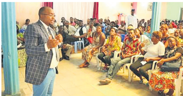
Le Dr Felix Kabange Numbi prônant la paix

Dans l'après-midi du 2 décembre, le ministre de la Santé publique et le vice-ministre de la justice se sont donné rendez-vous avec les habitants de Masina à Petro Congo dans la salle Thalassa pour parler de la paix et des décisions du dialogue national.