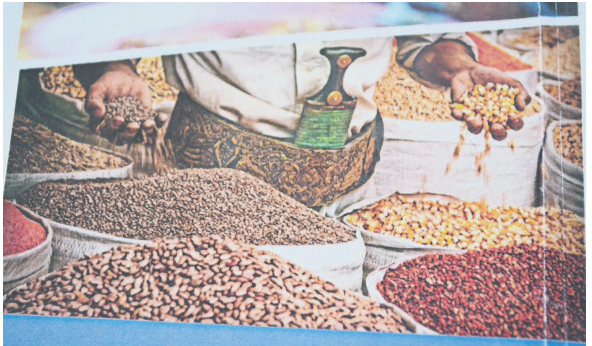
Une vue des différentes légumineuses

patrimoine culinaire, haricots, pois chiches et lentilles n'ont pas toujours bonne réputation. Malgré des qualités nutritionnelles reconnues. Composés de fibres et plébiscités dans la prévention des maladies cardiovasculaires, de certains cancers, de surpoids et de l'obésité, ces légumes secs sont assimilables aux protéines s'ils sont accompagnés de céréales.