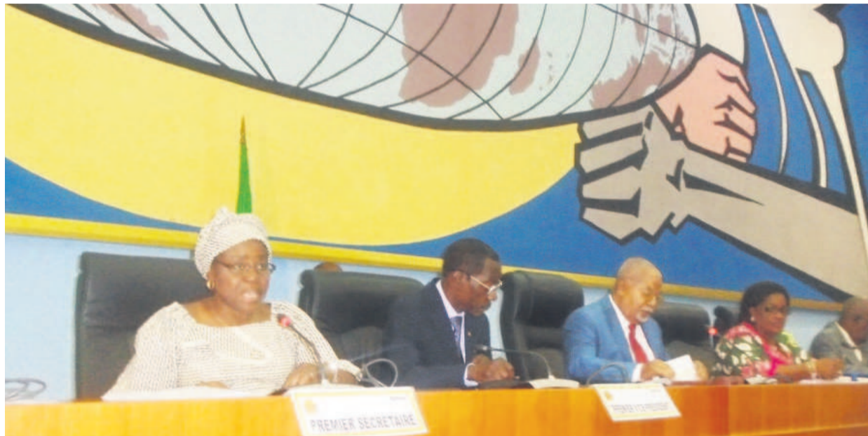
Quelques membres du bureau du Sénat lors de la séance plénière

de renforcer les capacités de conception et de mise en œuvre des politiques de gestion au sein des Etats membres ; la gestion des réserves mais aussi et sur-