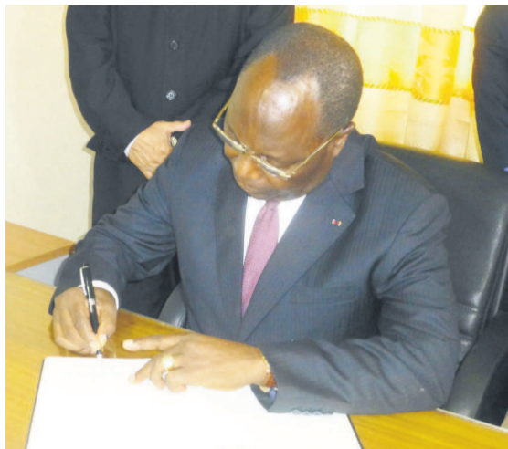
Le Premier ministre, Clément Mouamba, signant le livre de condoléances

Le Premier ministre, Clément Mouamba, a signé le 2 décembre à Brazzaville, le livre de condoléances ouvert à l'ambassade de Cuba au Congo, suite au décès de Fidel Castro.