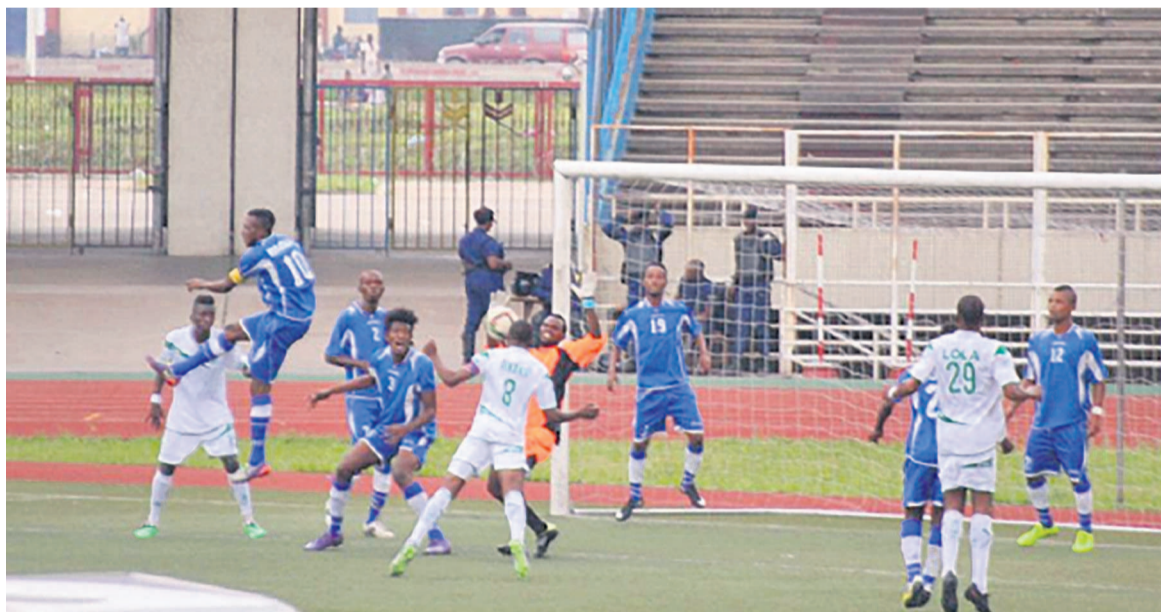
Vue du match DCMP contre Rojulu du 30 novembre 2016