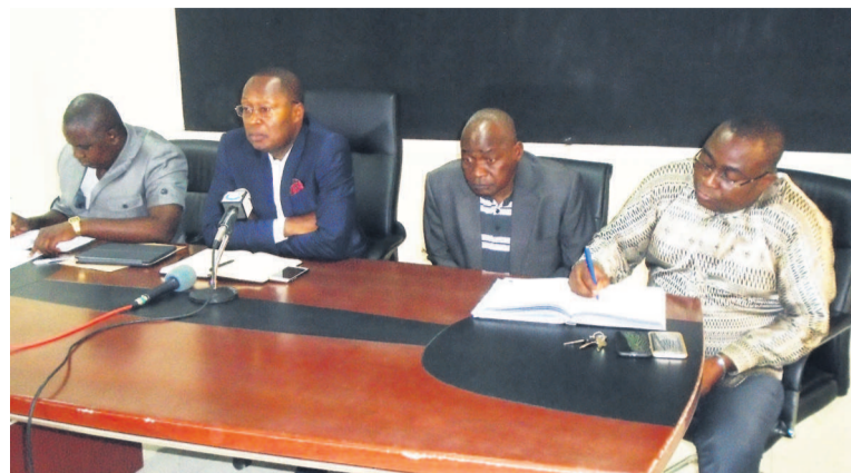
La Fécofoot échangeant avec les représentants des clubs/Adiac

Toujours dans la recherche de l'efficacité, la Fécofoot a partagé avec les représentants des clubs sa vision d'organiser un tournoi de mise en jambe en vue d'aider les quatre clubs qualifiés en compétitions africaines ( AC Léopards de Dolisie et Diabes noirs en Ligue des champions puis l'Étoile du Congo et Cara en coupe