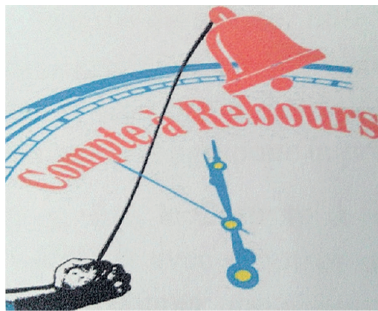
Le logo du mouvement Compte à Rebours

Ce combat s'active également sur une bataille civique pour la construction positive et efficiente de l'homme/femme congolais. Ici, l'action du Compte à Rebours s'inscrit aussi dans une logique anthropocentrique, en ce sens que le mouvement placerait l'homme au cœur de toutes ses préoccupations. Dans ce cadre précis, a noté le coordonnateur de Compte à Rebours, il sera mené des actions rationnelles et cohérentes de civisme à l'effet de transformer l'homme/femme congolais en citoyen(ne) modèle. Car dans la conception du Compte à Rebours, a-t-il précisé, la démocratie ne se mesure pas seulement par rapport aux règles et aux valeurs y afférentes mais elle se mesure aussi et surtout à l'aune du nombre d'hommes