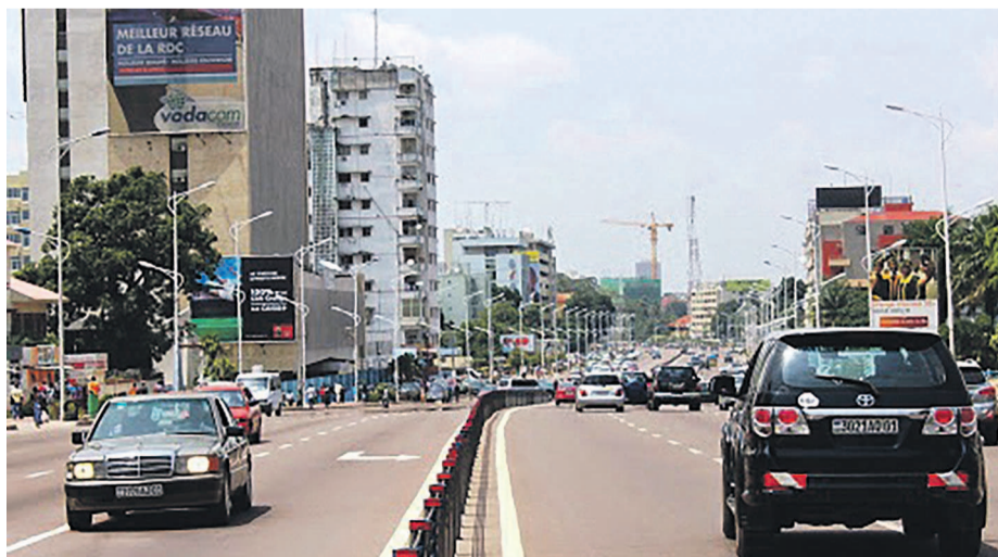
Le centre-ville à Kinshasa

Dans la dernière étude du cabinet spécialisé ECA international pour l'année 2016, la capitale congolaise vient à la deuxième position du top africain, après la ville angolaise de Luanda. À l'échelle mondiale, Kinshasa ferme le top dix. Les auteurs de l'étude ont ciblé un total de 450 villes à travers le monde. Plusieurs facteurs ont contribué à établir ce classement. Parmi ceux-ci, l'on cite, par exemple, le niveau de l'inflation et la convertibilité de la monnaie nationale. Dans l'ensemble, le cabinet ECA a réalisé des calculs de coût sur la base d'un panier de biens de consommation courante. Il s'agit, par exemple, de la nourriture, des articles ménagers, des services de loisirs, des vêtements, des prix de restaurants, de l'alcool et du tabac. Pour information, les calculs sont réalisés en dollars américains pour faciliter la comparaison.