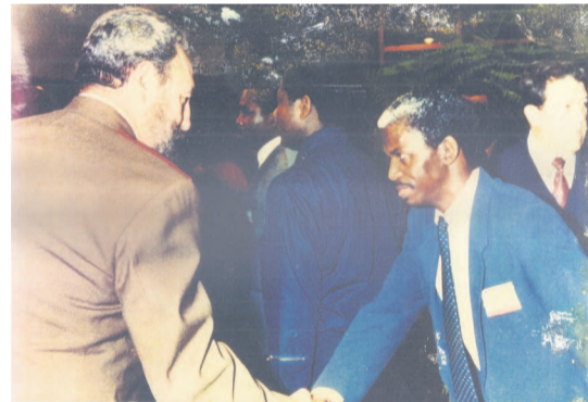
Poignée de main entre Fidel Castro et Marcel Bavoueza-Guinot, le 13 avril 1988 à la Havane (Cuba)

L'année 2016 s'achève avec des événements majeurs qui marqueront à jamais l'histoire contemporaine de la planète : de l'élection à la tête des États-Unis d'Amérique de Donald Trup au renoncement du président François Hollande à se représenter à l'élection présidentielle de mai 2017 en passant par le décès du chef de la révolution cubaine, Fidel Castro, survenu le 25 novembre