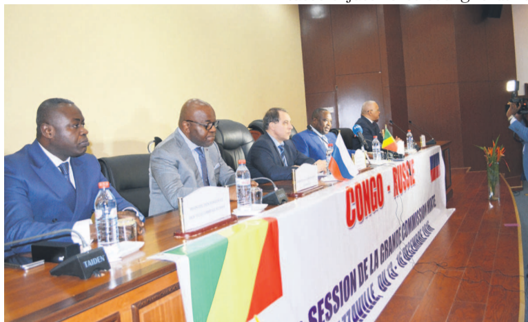
Les deux parties lors de la grande commission mixte

Pour sa part, le secrétaire d'Etat Russe a justifié et souligné dans