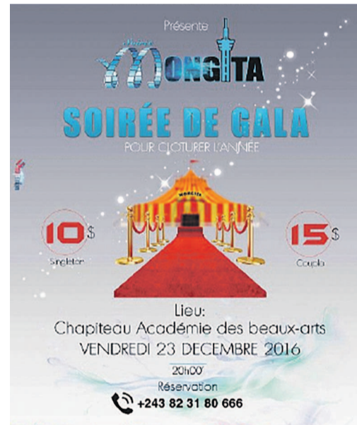
L'affiche de la Soirée Mongita

La Soirée et le Trophée Mongita se rapportent à feu Albert Mongita. La salle du théâtre national de Kinshasa déjà baptisée en son nom est peut-être la seule chose que les Kinnois connaissent à pro-