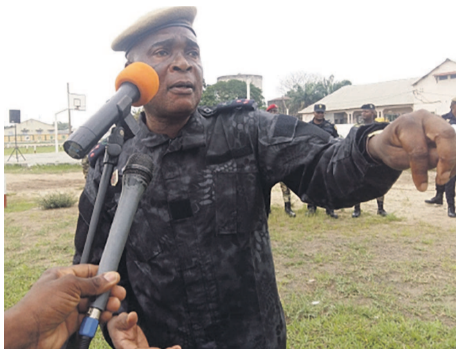
Le colonel Serge Pépin Itoua Poto

S'adressant au personnel de la force publique impliqué dans l'opération Uppercut Plus 2016, Serge Pépin Itoua Poto a expliqué que cette opération se déroulera en deux phases, notamment celle du 14 au 22 décembre 2016 basée sur la stérilisation de l'ensemble des quartiers de la ville avec implication de tous les éléments engagés et la seconde phase partira du 23 décembre au 2 janvier prochain. Elle sera spécialement basée sur la sécurisation des fêtes. L'orateur a aussi insisté sur quelques consignes à observer par le personnel impliqué en vue de la réussite de cette opération, à savoir le port d'un brassard spécial portant les écrits « police contrôle ». « Nous avons fait dans le passé des opérations qui ont réussi. Nous tenons absolument à la réussite de celle-ci. Quelle que soit l'unité à laquelle vous appartenez, tous les agents concernés par l'opération porteront chacun son brassard. Cela permettra de mieux vous distinguer sur le terrain et éviter évidemment toute éventuelle confusion. Cette opération s'effectuera sans aucune faille. Au contraire, il sera question au cours de celle-ci de durcir les positions, c'est-à-dire appliquer la fermeté dans la légalité en sachant ce que nous avons à faire dans toute la quiétude », a-t-il signifié. Dans son allocution, le colonel Serge Pépin Itoua Poto a mis en garde certains agents de la police administrative qui sont parfois en mission sans se munir de leurs ordres de