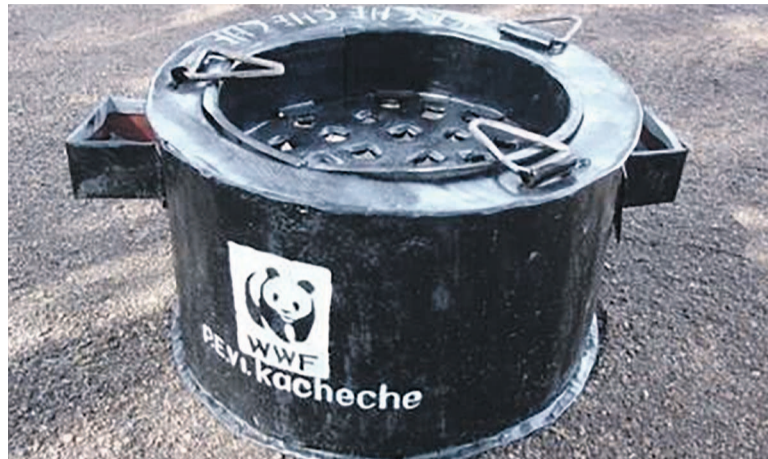
Un échantillon du type de foyers améliorés produits par le WWF

Cette campagne s'effectue dans le cadre du projet Conservation des écosystèmes forestiers en Afrique centrale (Cafec), avec l'appui financier et technique de l'Usaid, du Programme régional de l'environnement en Afrique centrale (Carpe) et du ministère norvégien du Climat et de l'En-