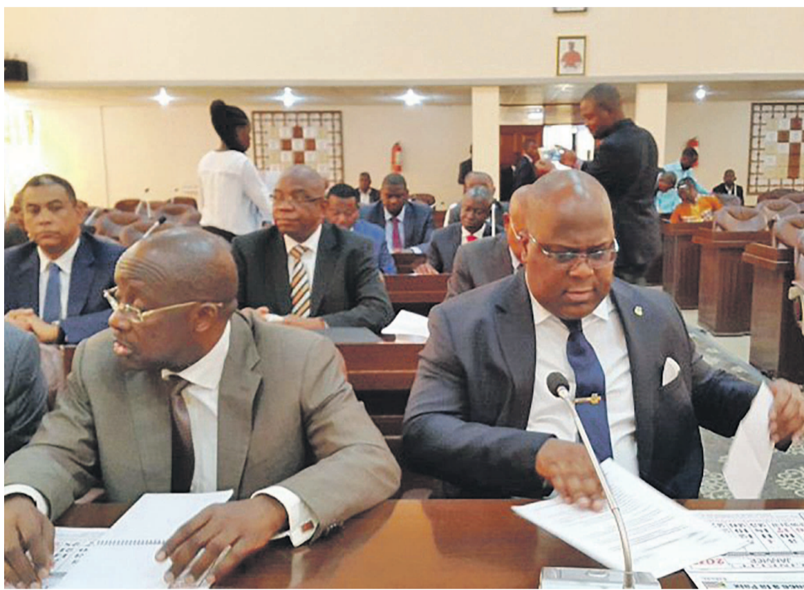
Vue des participants au dialogue du Centre interdiocésain