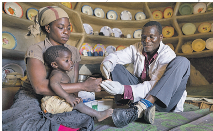
Lancement de SMS for Life 2.0 au Nigeria pour aider à améliorer l'accès aux médicaments essentiels

traitements contre le VIH, la tuberculose et la lèpre, et d'envoyer des notifications aux responsables médicaux de district lorsque ces niveaux sont bas. Le programme permettra également de suivre les paramètres de surveillance du paludisme, des décès maternels et infan-