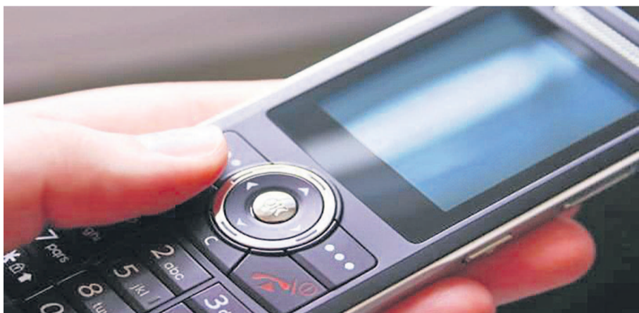
Un téléphone portable