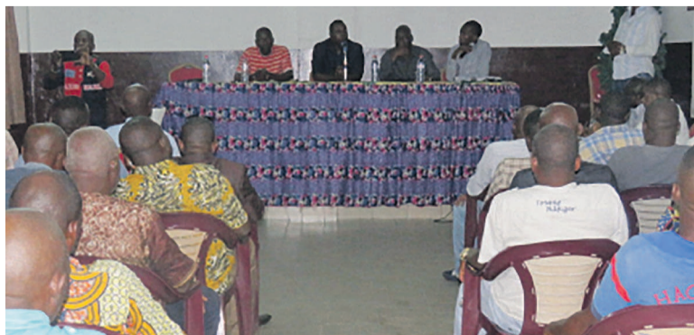
Une vue des participants à l'assemblée générale «Adiac»

La présence de tous est vivement souhaitée