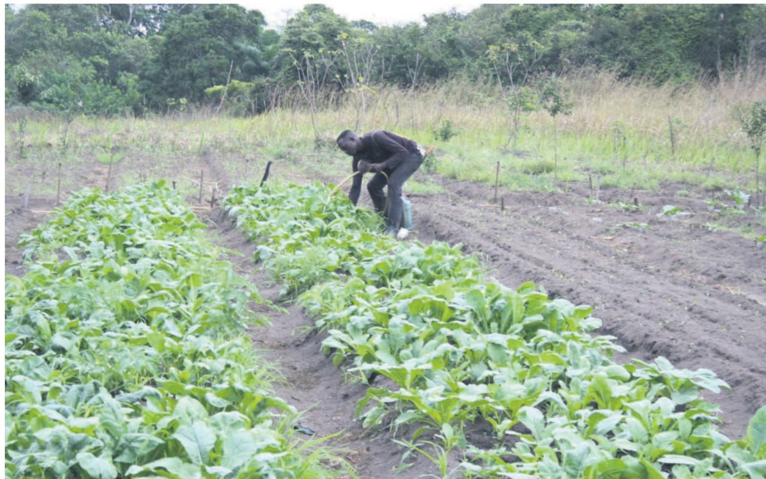
Le secteur agricole attend sa véritable impulsion, Crédit Adiac

Le Congo réunit des conditions favorables au développement des activités agricoles. Il possède 10 millions d'hectares de terres arables dont 3% seulement sont utilisées. Dans le passé, l'agriculture contribuait à 30% au Produit intérieur brut (PIB) du pays contre 3% à ce jour, d'après le bureau de