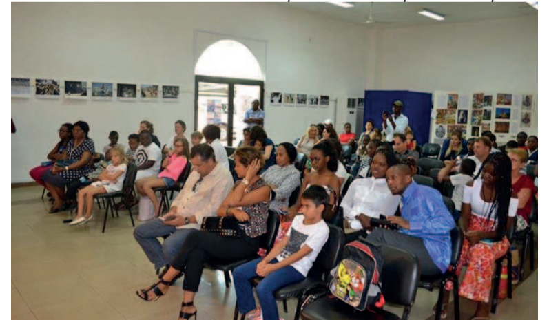
Le public venu suivre le concert des enfants

il y a 3 ans, pour d'autres il y a 2 ans, 1 an, et d'autres encore il y a à peine 3 mois. Cette matinée musicale a débuté par le mot du directeur du Centre culturel russe (CCR),