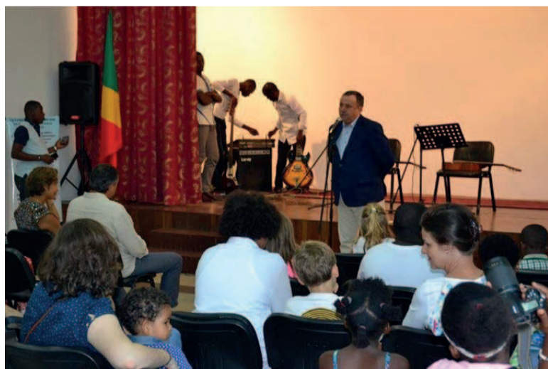
Le directeur du CCR prononçant son mot de bienvenu

concert a porté sur les cours d'éducation musicale qui se déroulent au CCR. Ils ont fait la pratique instrumentale, à l'instar du piano, de la guitare. Je suis très satisfait de la prestation des enfants et en profite pour annoncer que les inscriptions