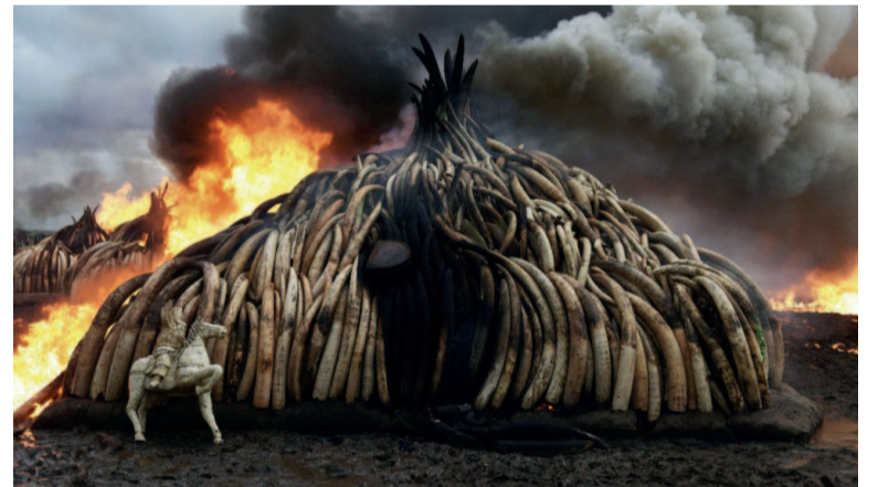
Un stock de défenses d'éléphants en ivoire et cornes de rhinocéros brûlé au Nairobi National Park le 30 avril 2016...

Selon l'Union internationale pour la conservation de la nature (UICN), la population des éléphants d'Afrique vient d'enregistrer sa plus importante chute depuis 25 ans: le continent compte environ 415.000 éléphants, soit 111.000 de moins que lors de la dernière décennie. Et le massacre continue au rythme vertigineux d'environ 30.000 éléphants par an. Quant aux rhinocéros, dont la corne utilisée dans la médecine traditionnelle chinoise ou vietnamienne se vend jusqu'à 60.000 dollars le kilo au marché noir, plus de 5.000 d'entre eux, le quart de leur population mondiale, ont été tués ces huit dernières années en Afrique du Sud, qui abrite 80% de ces mammifères encore en vie. La Cites estime que le tra-