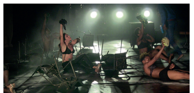
Le spectacle « Kalakuta Republic » de Serge Aimé Coulibaly