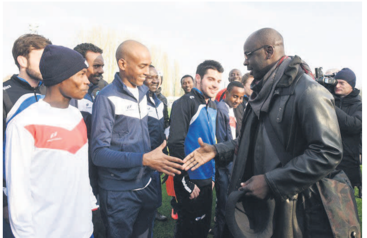
Lilian Thuram à la rencontre de 37 migrants de Croisilles au complexe sportif Daniel Percheron

Lilian Thuram qui a donné le coup d'envoi et a pu chausser ses crampons par la suite. S'exprimant à la presse, il a déclaré vivre des moments extraordinaires. « Des personnes qui ont fait un voyage dans de grandes difficultés se retrouvent dans un lieu où des mains leur sont tendues; ils s'entendent dire : venez partager un moment avec nous, nous allons jouer au foot ensemble; vous allez pouvoir vivre normalement: il y a des personnes qui vous aiment et qui s'engagent à prendre soin de vous. N'ayez pas