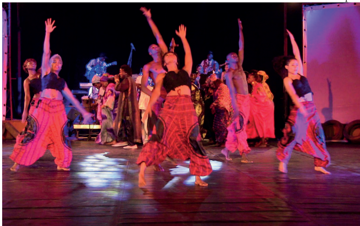
Le spectacle « Kombibissé » à l'ouverture de Danse l'Afrique danse à Ouagadougou