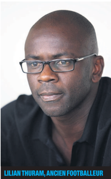
LILIAN THURAM, ANCIEN FOOTBALLEUR