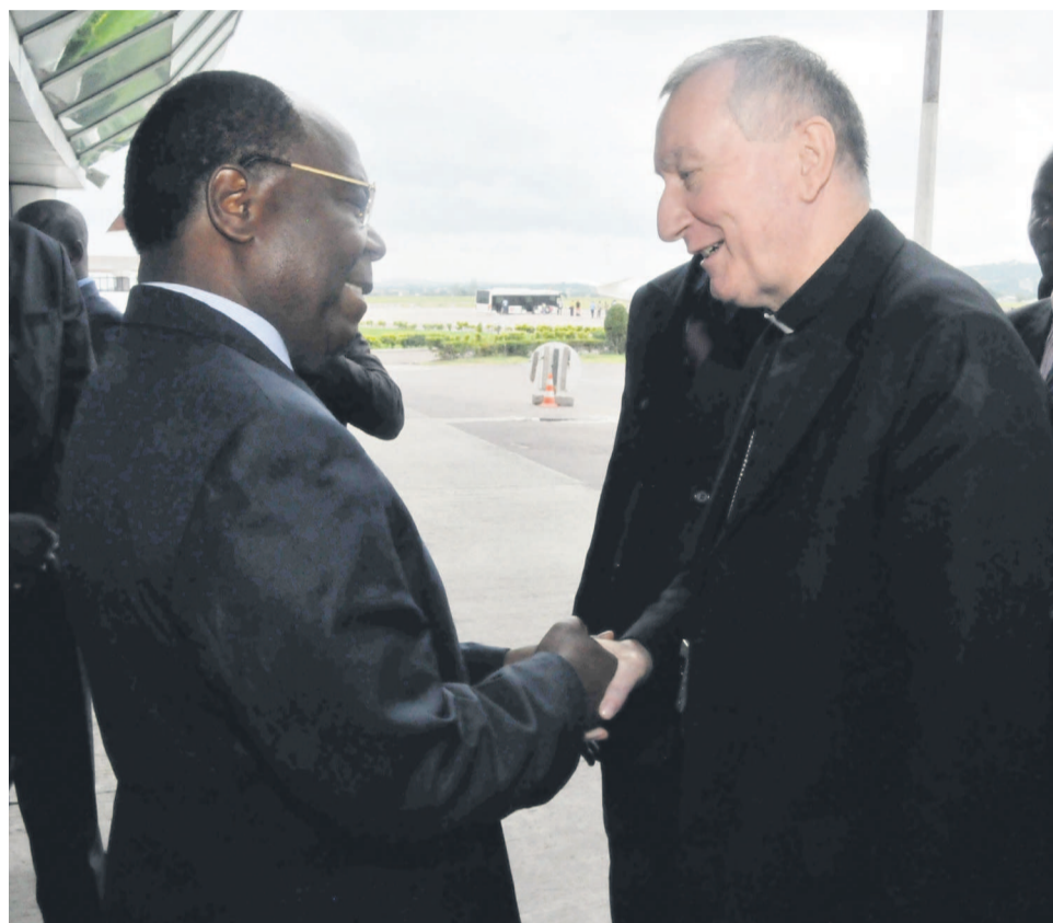
Le Cardinal Pietro Parolin accueilli par le Premier ministre

L'envoyé spécial du Pape François, le Cardinal Pietro Parolin, secrétaire d'État du Vatican, est arrivé à Brazzaville mercredi 1 er février, en milieu d'après-midi. Il a été accueilli à l'aéroport international Maya-Maya par le Premier ministre, Clément Mouamba.