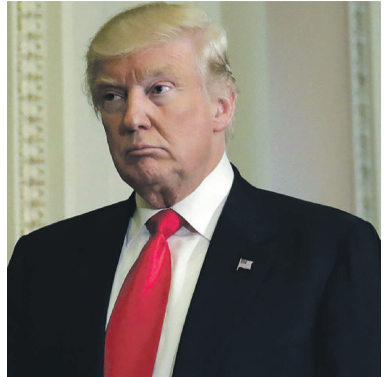
Donald Trump

La confirmation de cette venue dans la localité sicilienne s'est faite par un échange téléphonique avec le Premier ministre italien. La Maison Blanche a souligné que le président avait à cette occasion « réitéré l'engagement américain envers l'Otan et insisté sur l'importance que tous les alliés de l'Otan partagent le poids bud-