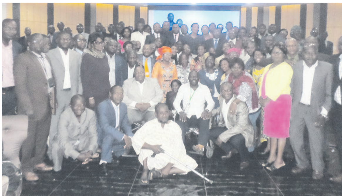
Antoinette Dingo Dzondo posant avec les participants

Clôturant les travaux, la ministre des Affaires sociales, de l'action humanitaire et de la solidarité, Antoinette Dingo Dzondo, a rappelé que les thématiques retenues leur ont permis de débattre, sérieusement et dans toute la