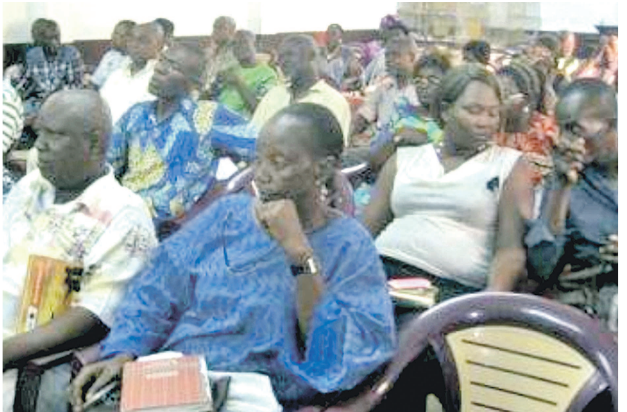
Les membres de l'association

bien la notion du vivre ensemble était précieuse pour tout le monde. « Nous devons aller de l'avant et, pour y arriver, la Dobe a besoin du dynamisme de tout le monde afin d'élargir nos horizons et de créer des activités génératrices de revenus pour le bien de tous les membres », a-t-il dit. Pour atteindre ses objectifs, la Dobe s'est fixé entre autres objectifs: rassembler les enfants de Ouénzé en vue de promouvoir le climat de paix, d'amour, de sociabilité, d'entraide, de vivre ensemble et de participer à l'action humanitaire; organiser des colloques historiques, éducatifs et culturels, des compétitions à caractère sportif; renforcer le brassage intercommunautaire par les excursions dans tous