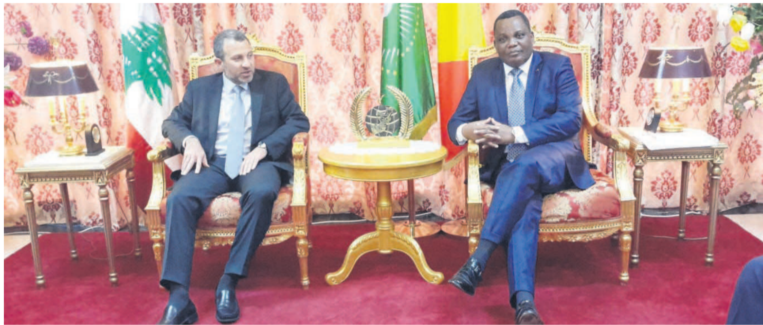
Le ministre Jean-Claude Gakosso s'entretenant avec Gibran Bassil

Cette visite s'inscrit dans le cadre des efforts de redynamisation des relations diplomatiques entre les deux pays établies depuis 2001. Elle a surtout été « une opportunité d'explorer d'autres axes de coopération » entre Brazzaville et Beyrouth, a indiqué le ministère des Affaires étrangères dans un communiqué. Page 3