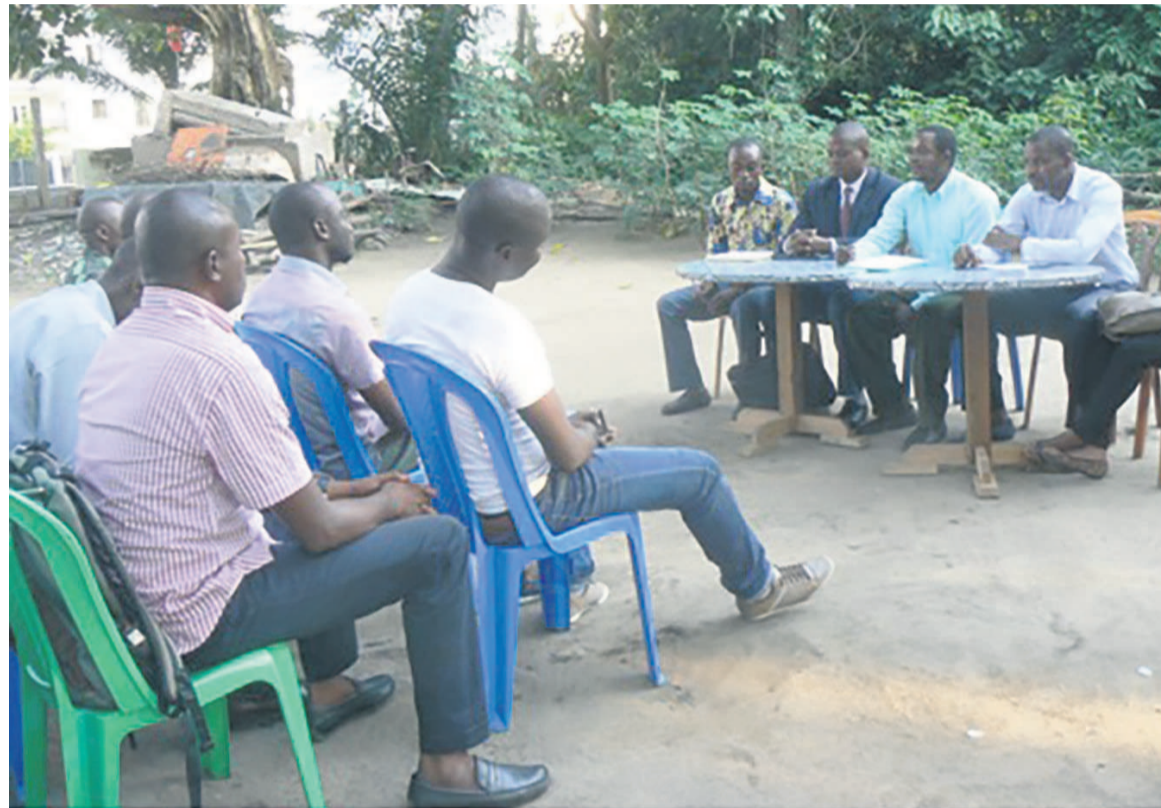
Face aux membres des deux bureaux, une poignée des finalistes des écoles professionnelles

ou plus sans travailler. Ils sont pères de famille et même locataires de maison, et ils crou-pissent tous dans la misère »,