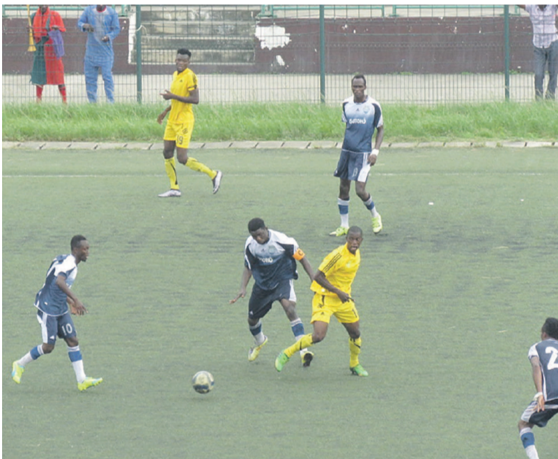
Un extrait du match la Mancha contre AS Otoho