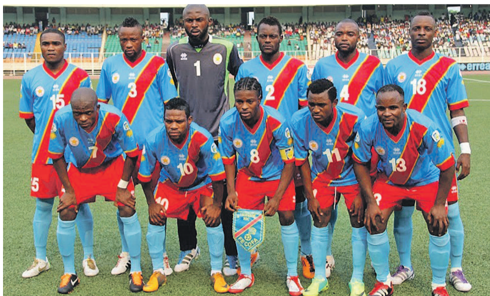
Les Léopards de la RDC

Vert, de la Centrafrique, de l'Érythrée, du Tchad et de la Tunisie. La CAF a donc tiré au sort les pays selon sa répartition des pays en zones géographiques. Comme pour les éditions précédentes, chaque zone géographique a obtenu un quota de places qualificatives pour la phase finale : deux pour le nord, cinq pour l'ouest, trois pour le centre, deux pour le centre-est et