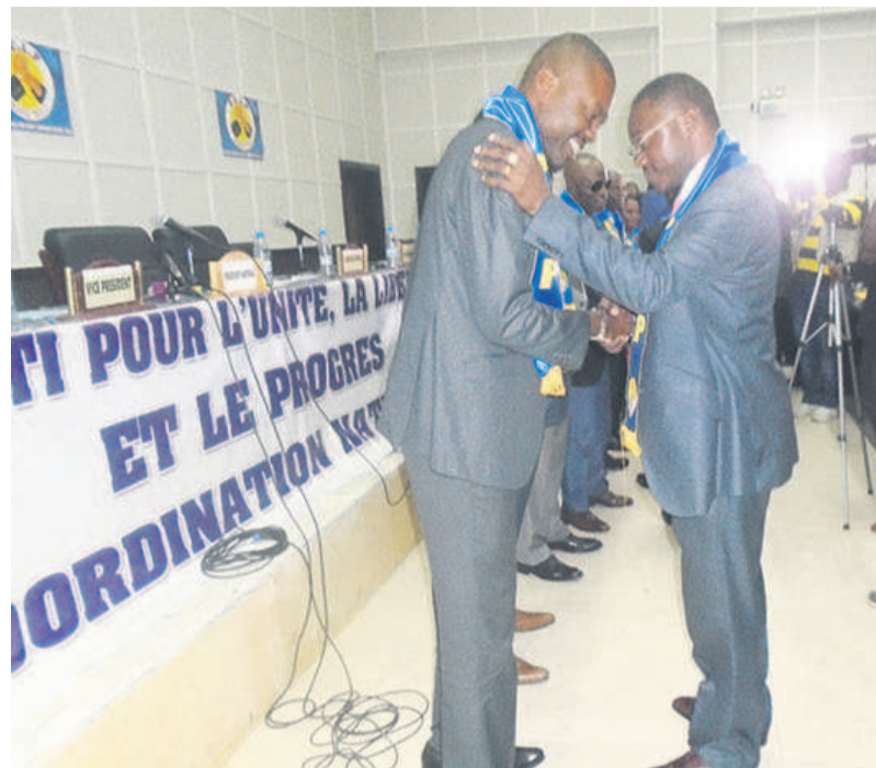
Le secrétaire général du Pulp saluant le nouveau bureau