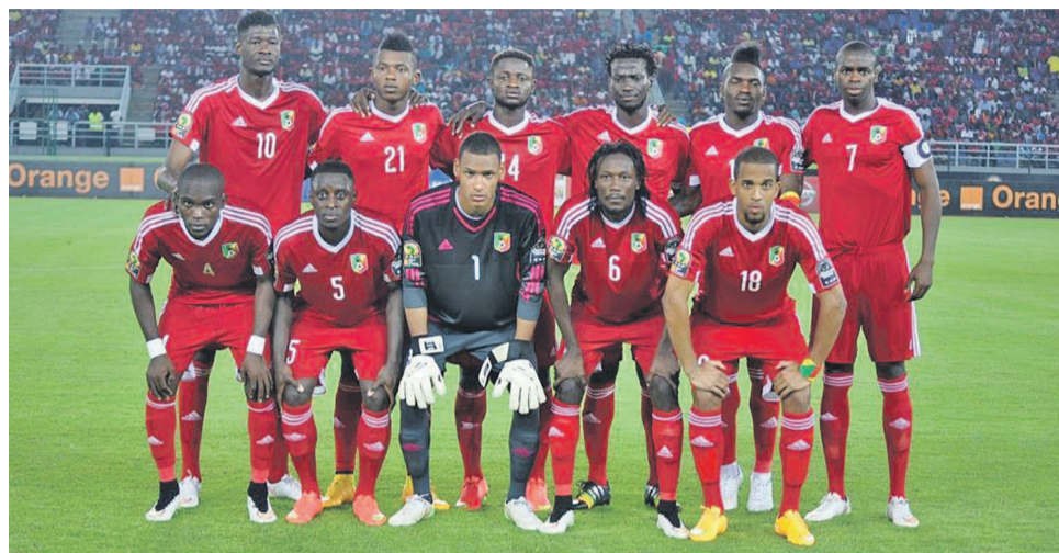
Les Diables rouges du Congo Brazzaville

Dans la zone centre d'où sortiront trois qualifiés, la Guinée Équatoriale s'opposera au Gabon, le Sao Tomé et Príncipe au Cameroun et la RDC au Congo Brazzaville. Dans la zone nord d'où seront issus deux qualifiés, l'Égypte affrontera le Maroc et l'Algérie s'expliquera avec la Libye. Dans la zone ouest A, on aura deux qualifiés qui