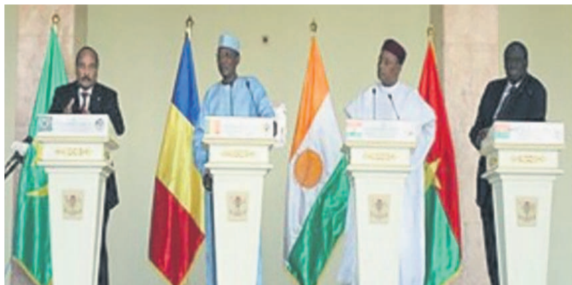
Les chefs d'État du G5 du Sahel (Burkina Faso, Niger, Tchad, Mali, Mauritanie)

Prenant la parole, le président du G5 Sahel, le malien, Ibrahim Boubacar Kéita, a souligné l'importance de la réunion de Bamako au cours de laquelle les pays membres ont réaffirmé leur détermination à instaurer la paix dans l'espace commun. Pour cela, une lutte implacable sera menée contre les différents groupes terroristes qui écument la zone Sahel (Al Mourabitoune, Boko Haram, Al Qaeda au Maghreb islamique, etc.). « Nous voulons un monde de paix, un monde dédié aux seuls défis qui importent que sont le développement, la lutte contre les maladies, etc. Le G5 Sahel doit être une opportunité de développement pour nos pays », a-t-il déclaré. « Le plus important pour nous est de mutualiser les moyens pour concrétiser les actions de développement au sein du G5 Sahel », a ajouté le président Keita. Il a, par exemple, cité le projet de création de « Air Sahel » pour développer le