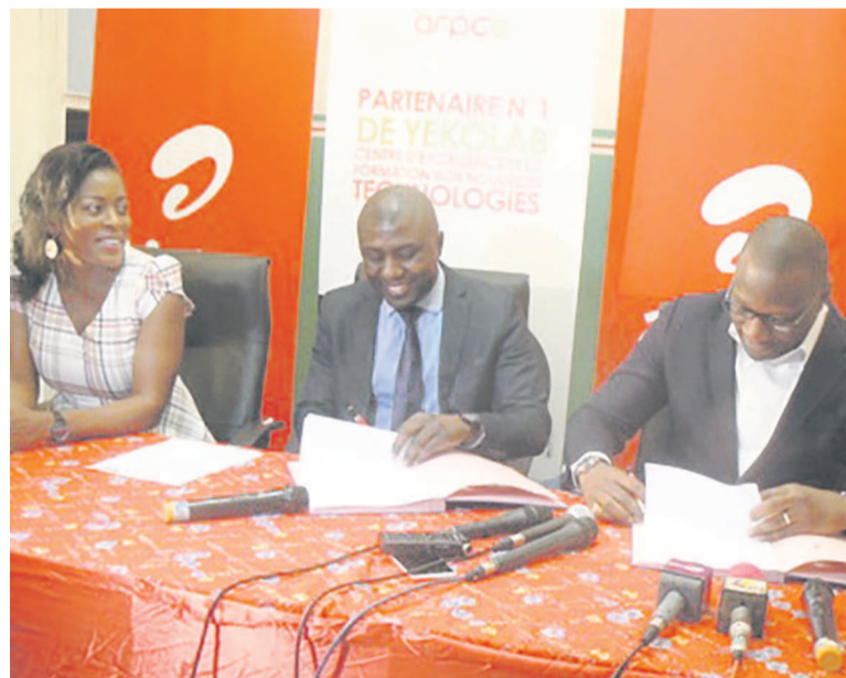
Seance de signature du contrat

trepreneuriat juvénile à travers les technologies de l'information et de la communication (Tic), l'ONG Yekolab contribue à la réduction du taux de chômage, à l'émancipation et à l'épanouissement des jeunes au Congo et en Afrique.