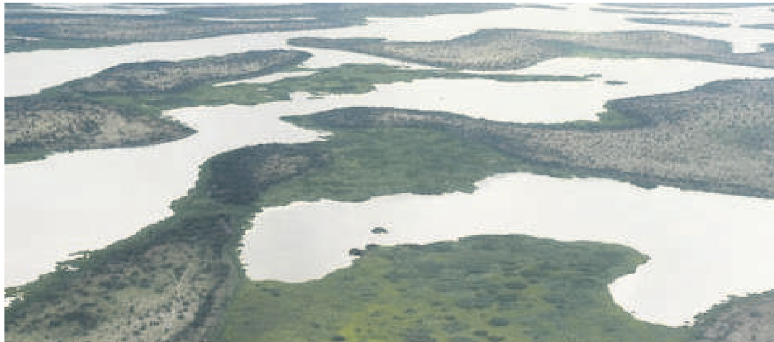
Une vue aérienne du lac Tchad

Le reboisement et la gestion forestière : ce projet contribuera à restaurer le couvert forestier des régions dégradées sur une superficie de 4 000 ha avec la participation active des communautés villageoises en s'appuyant sur les femmes. L'appui aux