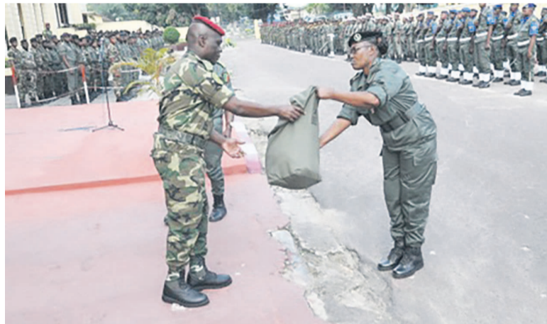
Remise du paquetage au chef d'état-major général des FAC ( ce paquetage contient entre autres, la tenue de combat, la tenue claire et le PMK).