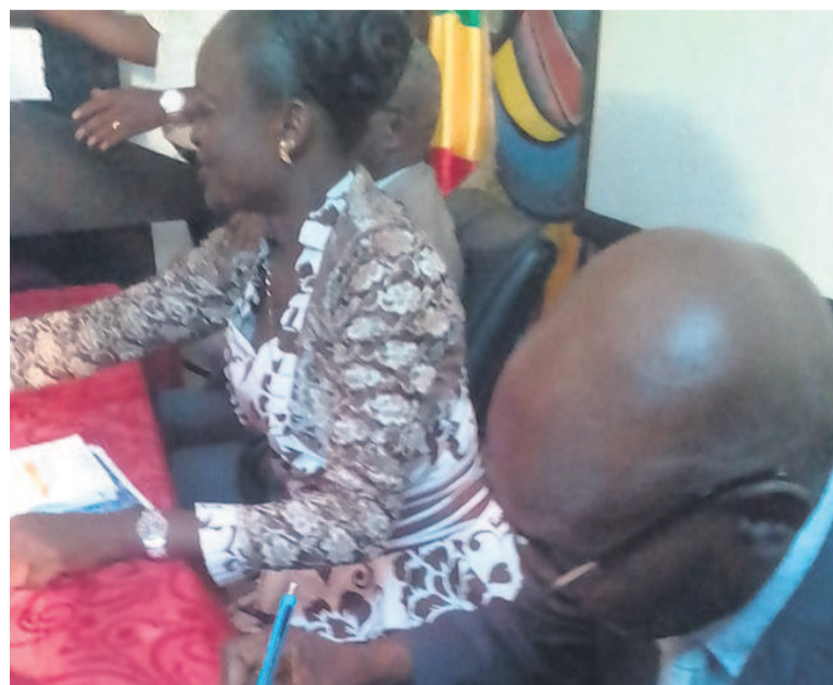
L'auteur dédicant son recueil