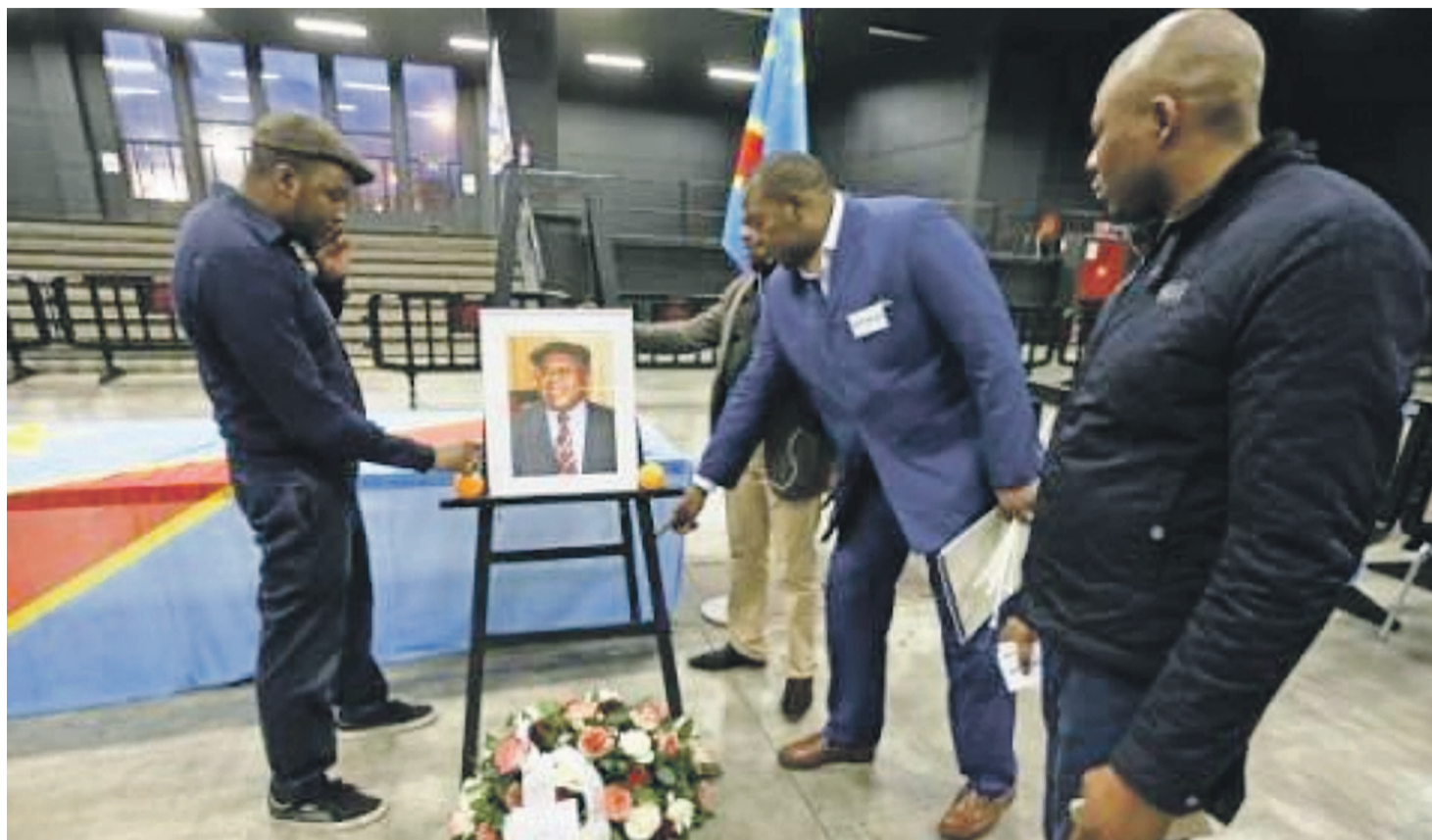
Des congolais de la diaspora s'inclinent devant la dépouille d'Étienne Tshisekedi

On s'attend donc à une affluence monstre des officiels, des militants de l'UDPS et d'autres formations politiques, de la population, mais aussi des représentants des pays amis. Les obsèques attendues à Kinshasa constituent le prolongement de la première phase qui s'est tenue dans la capitale belge et qui a vu les Congolais de la diaspora rendre au père de la démocratie congolaise un hommage digne de ce nom. C'est aux fins de préparer cet événement grandiose qui implique une organisation sérieuse que le gouvernement représenté par le ministre de l'Intérieur et la délégation mixte constituée par la famille biolo-