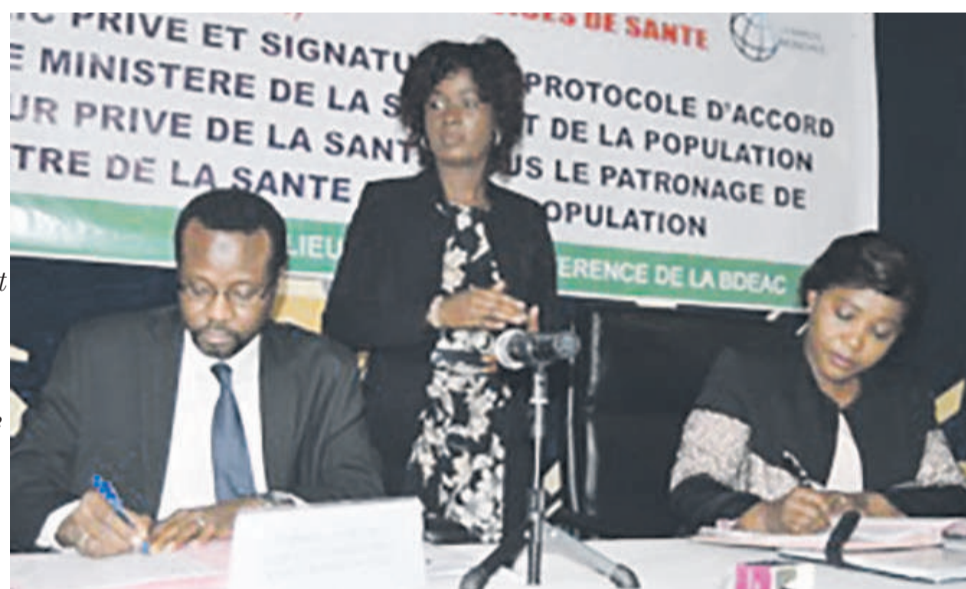
Signature du protocole d'accord

Après la signature de ce protocole d'accord, un atelier du dialogue public-privé s'en est suivi. En rappel, de nombreuses études réalisées par le Groupe Santé de la Banque mondiale ont prouvé que le manque de relation dynamique entre le secteur public et privé fait partie des faiblesses du système de