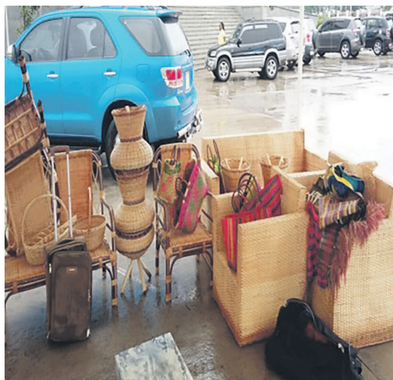
Une vue des objets en liane qui seront exposés Les chapiteaux détruits