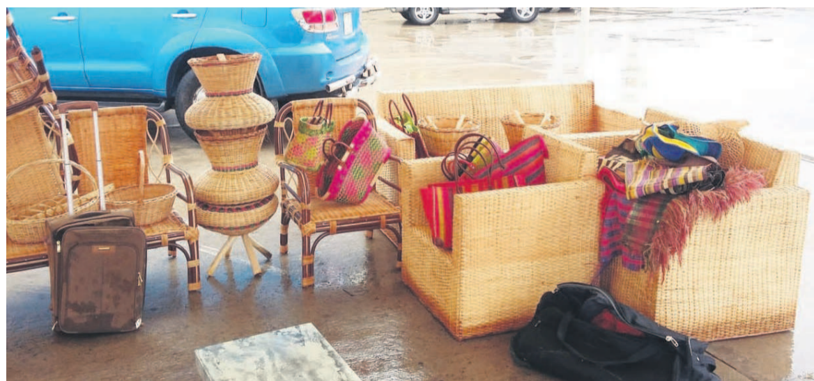
Une vue des objets en liane qui seront exposés

Initialement prévue le 7 février à la Préfecture de Brazzaville, l'ouverture de la première édition du Salon des métiers du bois a été reportée à la fin de cette semaine. Un changement de date qui s'explique notamment par la pluie d'hier qui a laissé quelques dégâts sur les installations de cette manifestation.