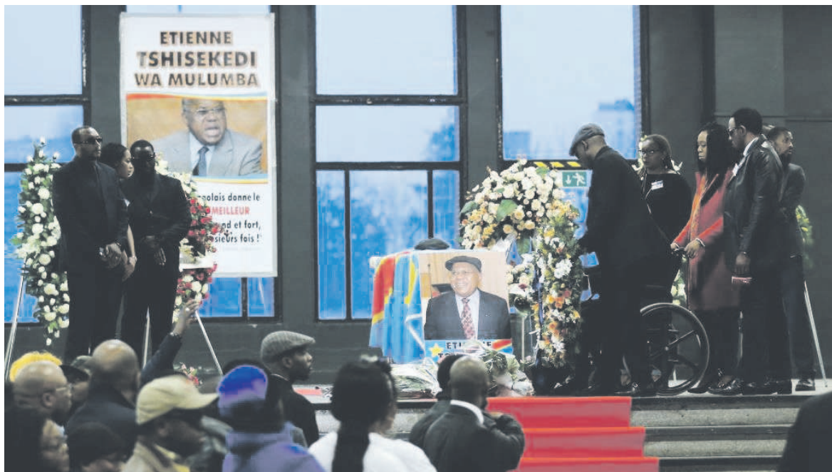
La chapelle dressée à Limete pour le recueillement

La conférence de presse tenue le 8 février au siège de l'UDPS à Limete a permis à cette formation politique de donner sa position officielle et celle de la famille biologique d'Étienne Tshisekedi quant au rapatriement de la dépouille de l'illustre disparu.