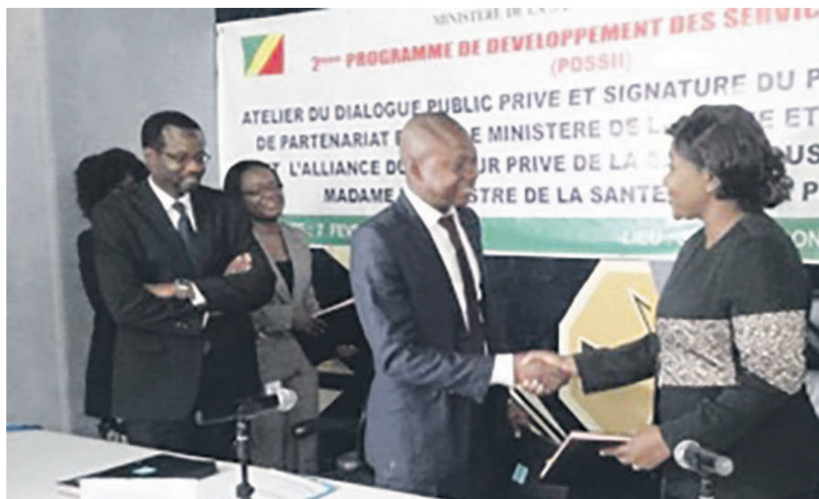
Le représentant du président Auguste Valairy Loko saluant la ministre de la Santé

« Après sept années d'échanges à la direction de la coopération du ministère de la Santé, l'AASDPAC à travers ce protocole efficace sur le terrain aux côtés des personnes âgées et retraitées entre 2010, une nouvelle page plus ambitieuse de nos activités au bénéfice des personnes âgées de 60 ans et plus du Congo s'ouvre aujourd'hui. À la vue des enjeux, le schéma stratégique de déploiement à l'échelle nationale élaboré lors de la tournée dans les 12 départements du Congo, réalisée du 16 juillet au 18 août 2016, va être soumis aux instances du ministère de la Santé pour validation », a dit Auguste Valairy Loko.