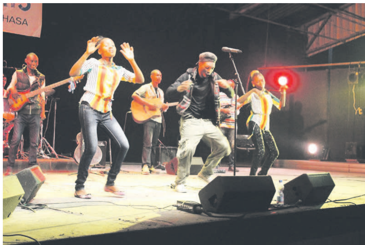
Le groupe Gba Gba en concert

Après Gba Gba, place au jazz le vendredi 17 février avec le groupe New Concept. Cette seconde soirée musicale s'annonce aussi palpitante que la première. Du reste, elle sera