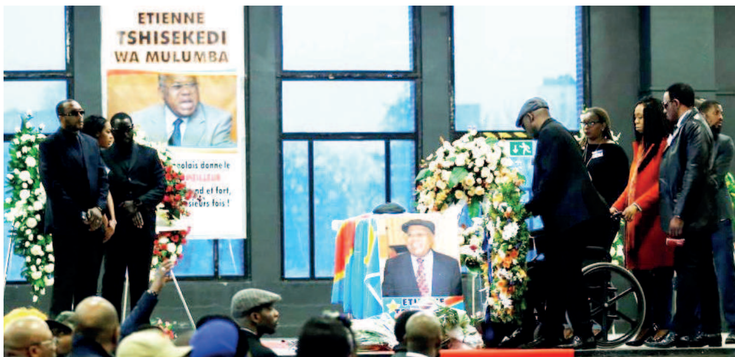
La chapelle dressée à Limete pour le recueillement