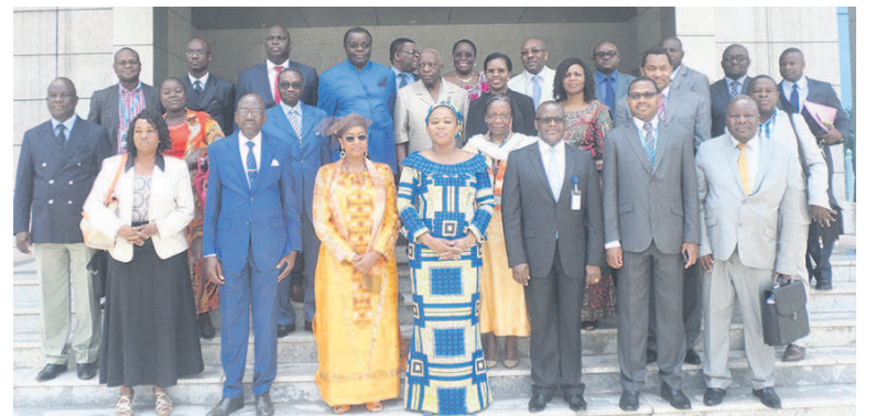
La ministre de la Santé posant avec les officiels ; une vue de la salle

Nous fondons notre espoir qu'ils vont procéder à une analyse très approfondie de ce rapport et s'accorder sur la meilleure articulation le rapport, première ébauche de la stratégie intégrée de la santé de la mère, de l'enfant et de l'adolescent 2017-2021 », a souligné Diallo Fatoumata Binta Tidiane.