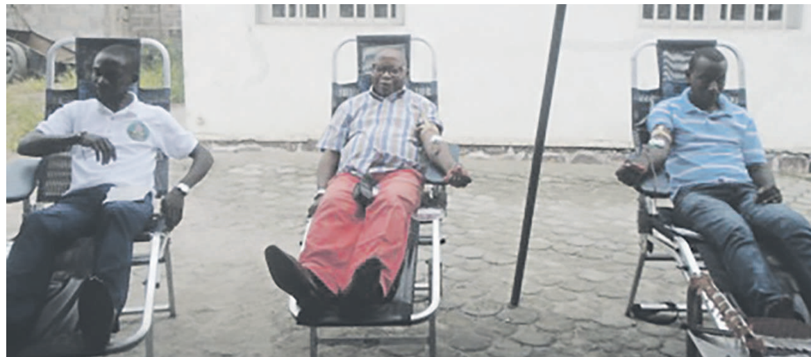
Des anciens de Cuba enrichissent la banque de sang

Plusieurs membres de cette association ont participé à cette opération de collecte de sang, organisée de concert avec le Centre national de transfusion sanguine (CNTS). A la fin de la collecte, quelques dizaines de poches de sang ont pu être rassemblées. Ce sang sera distribué dans les hôpitaux de la place, afin non seulement de prévenir d'éventuels cas d'urgence, mais surtout de sauver la vie des personnes déjà vulnérables et qui souvent meurent d'hémorragie.