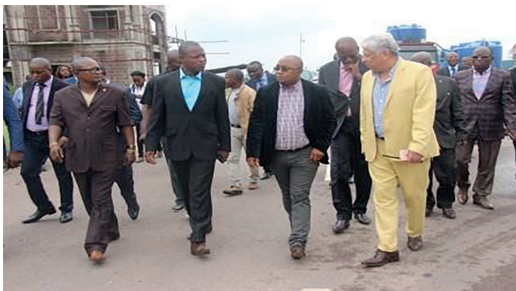
Félix Kabange visitant la cité du Fleuve

Par ailleurs, Félix Kabange Numbi a pris l'option de placer son mandat sous le signe de résolution à l'amiable des conflits fonciers. En outre, il a prié les cadres et agents de son ministère à privilégier l'intérêt du peuple en vue de mettre, tant que faire se peut, un terme aux conflits fonciers. Page 12