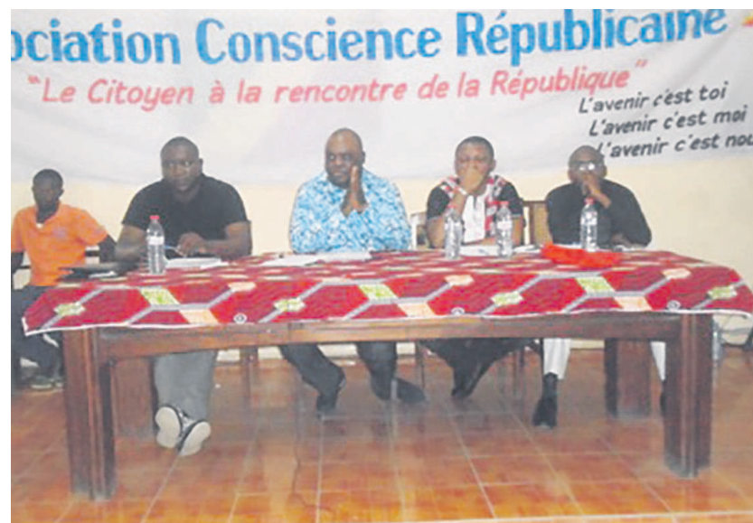
Les responsables du CR lors de la conférence débat à la mairie de Bacongo

Elle est aussi, ajoute-t-il, le fait pour un individu, une famille ou un groupe d'être officiellement reconnu comme membre d'une ville ayant un statut de cité ou encore