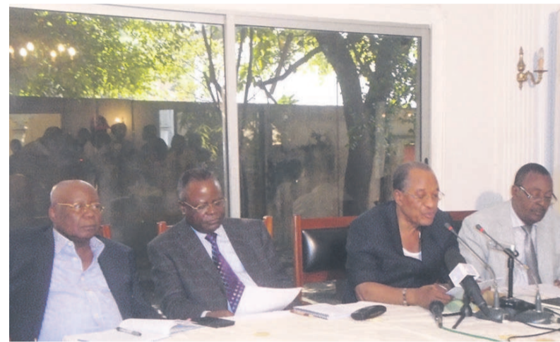
Le présidium des travaux

Selon les opposants, n'ayant pas été associés à la concertation politique de Ouesso, ils refusent de participer aux prochaines élections. Ils excluent cette fois une autre concertation alternative, à l'image du dialogue de Diata, qu'ils