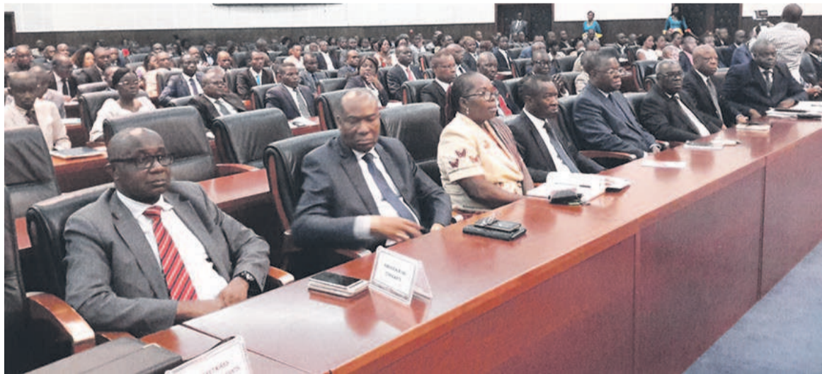
Une vue des participants (DR)

Durant la période retenue pour la formation, le personnel va cogiter, entre autres, sur les questions de paix et de sécurité, la bonne gouvernance, la coopération internationale et le développement durable. L'initiative vise