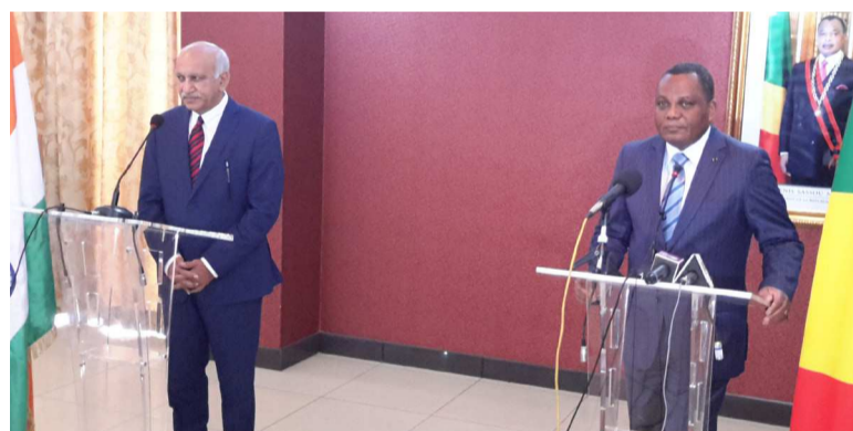
Les deux ministres lors d'une conférence de presse

Le ministre délégué aux relations extérieures de la République de l'Inde, Mabashar Jawed Akbar et le ministre des Affaires étrangères, de la Coopération et des Congolais de l'étranger, Jean-Claude Gakosso, ont passé en revue, hier, les projets bilatéraux entre les deux pays. Ils entendent donner une nouvelle impulsion à cette coopération en s'appuyant sur des projets identifiés. Page 9