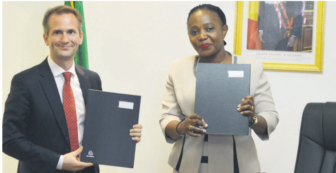
Jacqueline Lydia Mikolo et

Dans le cadre du Programme de développement des services de santé (PDSS II), la ministre de la Santé et de la population, Jacqueline Lydia Mikolo a lancé hier, le ciblage des ménages les