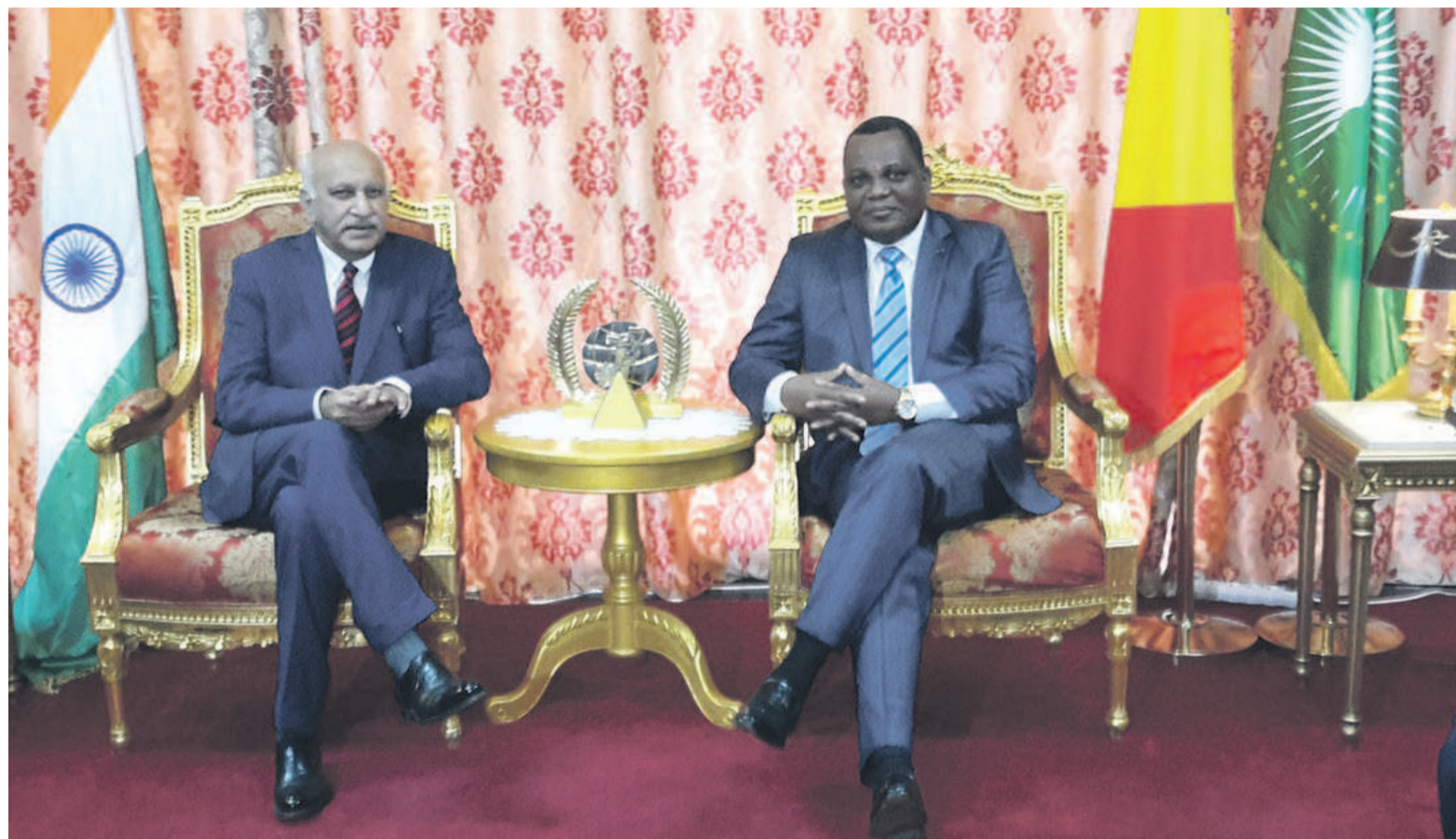
Mabashar Jawed Akbar et Jean-Claude Gakosso

Le chef de la délégation indienne n'a pas caché son optimisme quant à la concrétisation imminente des projets de coopération existants. « Nous reconnaissons le leadership du Congo, celui du président Denis Sassou N'Gusso. Et nous pensons que sous la direction du chef de l'Etat congolais et celle de notre Premier ministre, le partenariat Congo-Inde connaîtra des avancées significatives », a-t-il souligné. Mabashar Jawed Akbar a, par ailleurs, indiqué que les questions économiques, celles liées à l'investissement et les questions internationales, notamment les crises qui secouent le monde ont été au centre de leur préoccupation. Il a également évoqué la question du terrorisme. « Nous sommes convenus qu'il n'y a pas de bon terrorisme ou de mauvais terrorisme, le terrorisme est mauvais en soi », a noté le ministre indien.