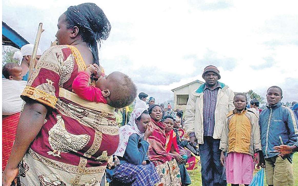
Quelques déplacés dans leur lieu de refuge

C'est une véritable tragédie que vivent depuis près de six mois les populations de l'ex-province du Kasai aujourd'hui éclatée en trois entités autonomes à la suite du dernier découpage territorial. Les affrontements entre les forces loyalistes et la milice Kamuina Nsapu en verve dans la région ont non seulement causé d'innombrables victimes mais aussi entraîné des dégâts collatéraux énormes avec, à la clé, le déplacement de plusieurs familles obligées de vivre au petit bonheur dans la brousse, loin des bruits des canons. N'ayant accès ni à l'eau potable, ni à la nourriture de base, encore moins aux services de santé, ces déplacés affectés par les circonstances de la belligérance imposée à leurs villages luttent pour leur survie dans des sites de fortune qui leur servent de lieu de refuge.