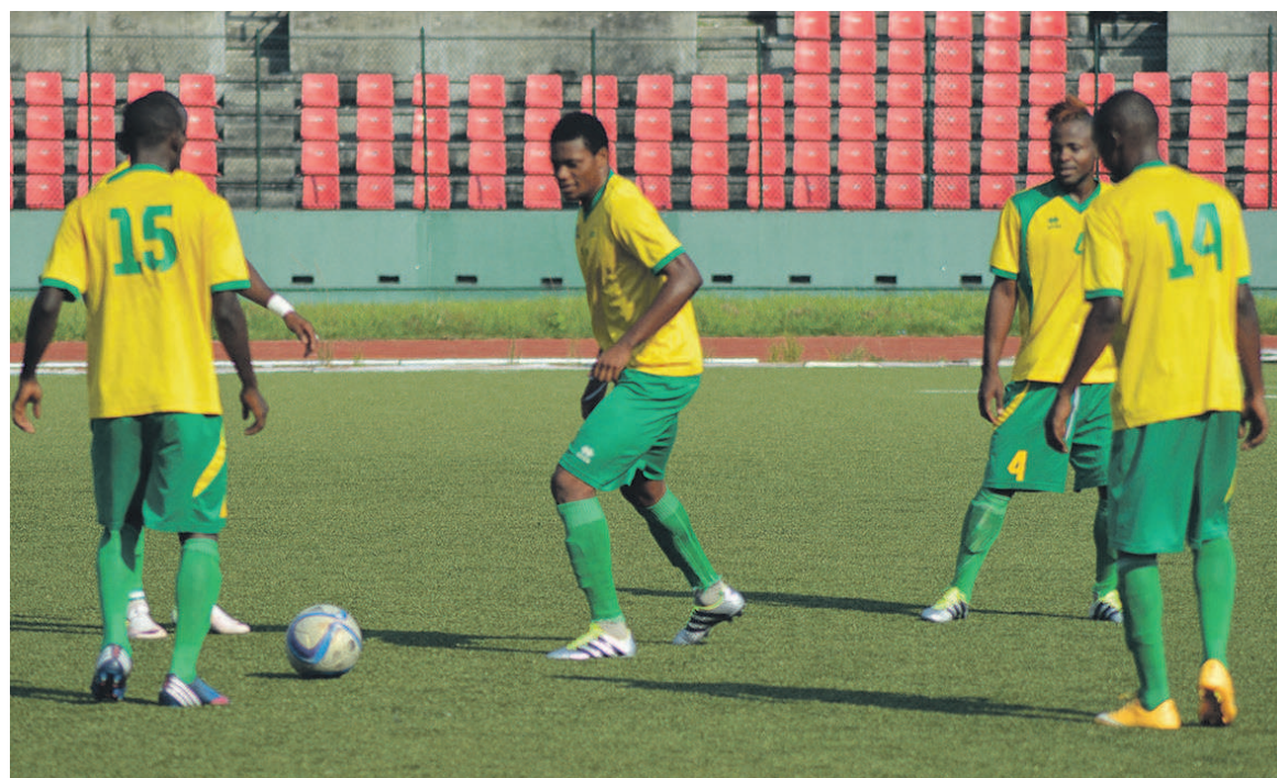
Etoile du Congo seule sur l'aire de jeu

Avant d'affronter l'Etoile du Congo, les Diablies noirs s'étaient rendus à Pointe-Noire pour y affronter La Mancha dans le cadre de la 9e journée. Les Diablotins ont été sévèrement battus (0-4) par le club ponténégrin. Après, il s'est posé le problème de non-paiement des primes, a-t-on appris. Les joueurs des Diablies noirs