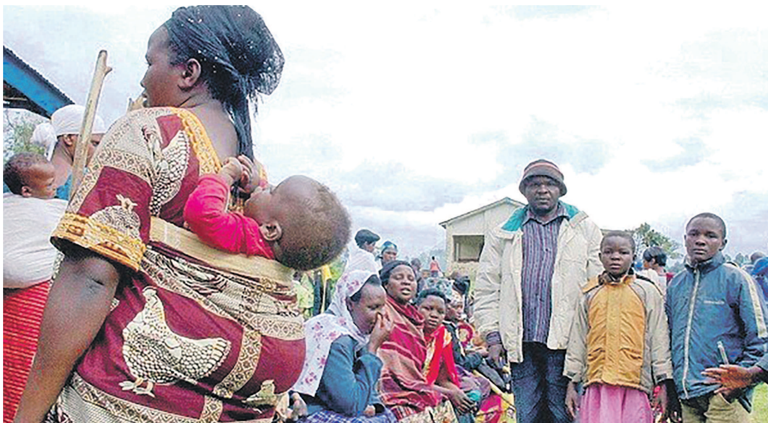
Quelques déplacés dans leur lieu de refuge

Le Bureau de coordination des affaires humanitaires de l'ONU en RDC (Ocha) a annoncé avoir alloué cinq millions de dollars en faveur des personnes affectées par la crise humanitaire née de la rébellion de Kamuina Nsapu qui secoue l'ex-province du Kasai, laquelle rébellion a entraîné deux