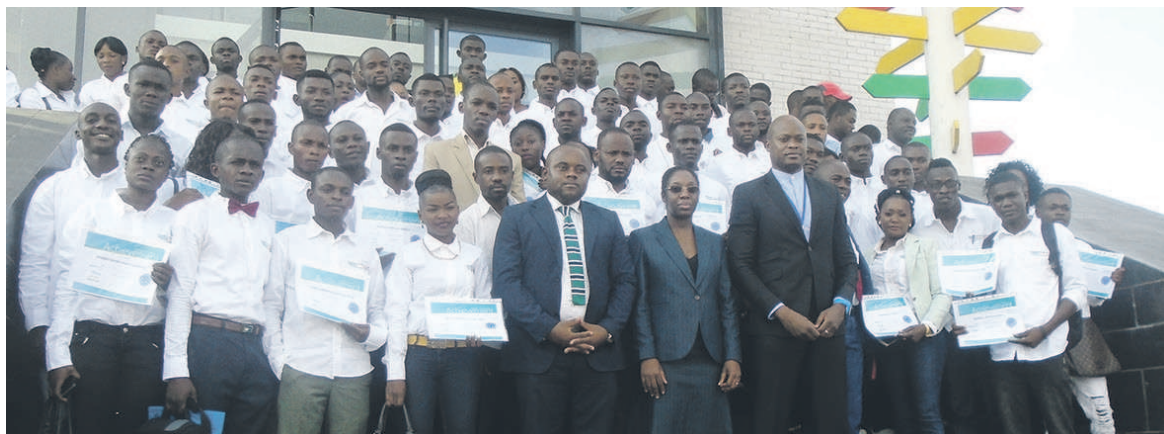
Les participants entourant les encadreurs

« Je résume cette formation en un mot : alphabétisation numérique. Parmi ces jeunes, il y avait certains qui ne connaissaient même pas utiliser le clavier ; aujourd'hui, ils sont aptes dans le traitement de texte.