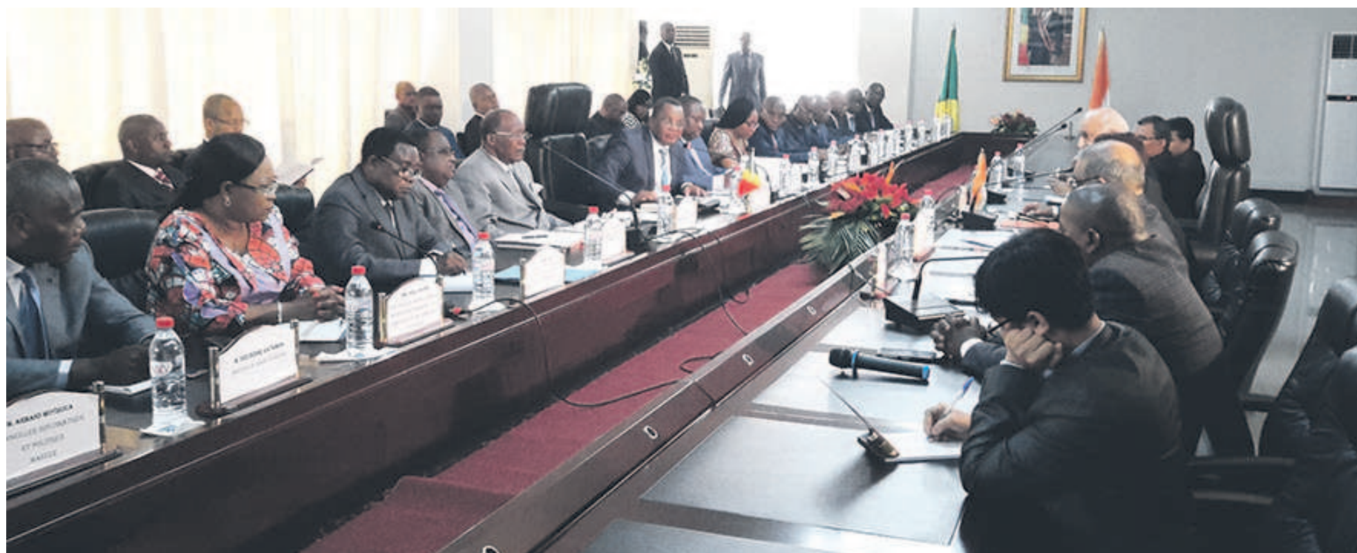
Séance de travail entre les deux parties (Adiac)