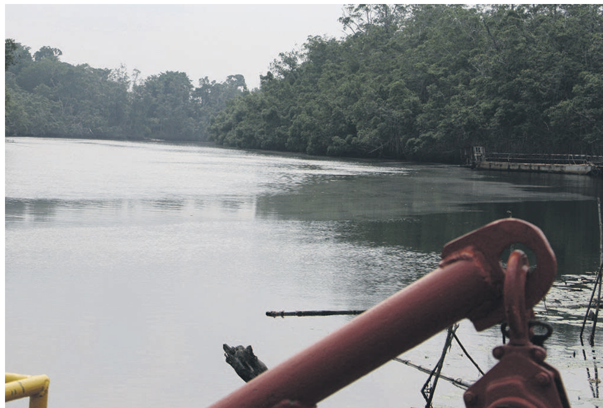
Une vue du fleuve Congo (DR)

L'accord relatif au Fonds Bleu pour le Bassin du Congo sera signé en marge d'une conférence qui se tient du 8 au 9 mars 2017 à Oyo, au Nord Congo, regroupant les ministres en charge des eaux et forêts d'une douzaine de pays d'Afrique.