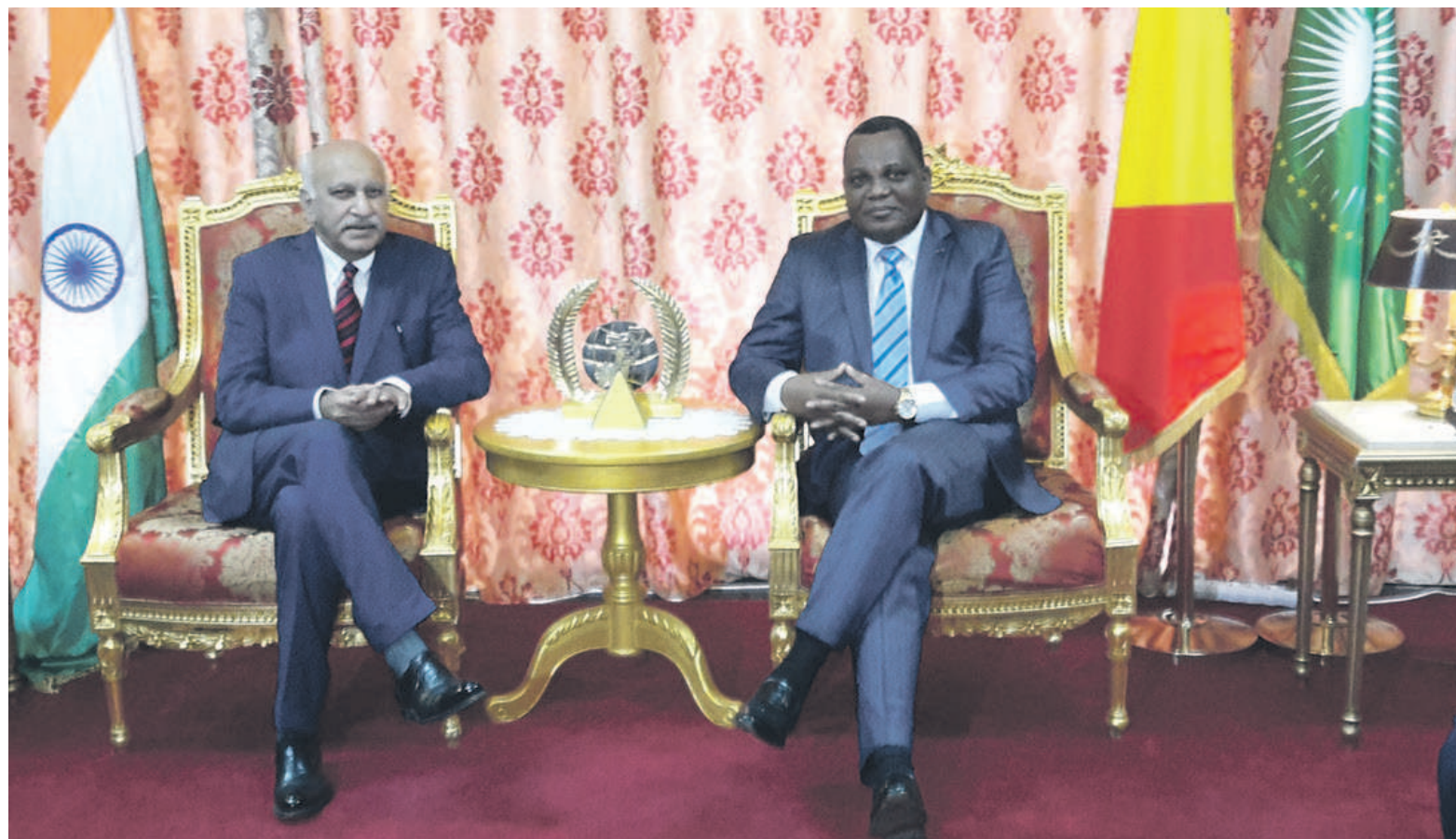
Mabashar Jawed Akbar et Jean-Claude Gakosso

Le chef de la délégation indienne n'a pas caché son optimisme quant à la concrétisation imminente des projets de coopération existants. « Nous reconnaissons le leadership du Congo, celui du président Denis Sassou N'Gusso. Et nous pensons que sous la direction du chef de l'Etat congolais et celle de notre Premier ministre, le partenariat Congo-Inde connaîtra des avancées significatives », a-t-il souligné. Mabashar Jawed Akbar a, par ailleurs, indiqué que les questions économiques, celles liées à l'investissement et les questions internationales, notamment les crises qui secouent le monde ont été au centre de leur préoccupation. Il a également évoqué la question du terrorisme. « Nous sommes convenus qu'il n'y a pas de bon terrorisme ou de mauvais terrorisme, le terrorisme est mauvais en soi », a noté le ministre indien.