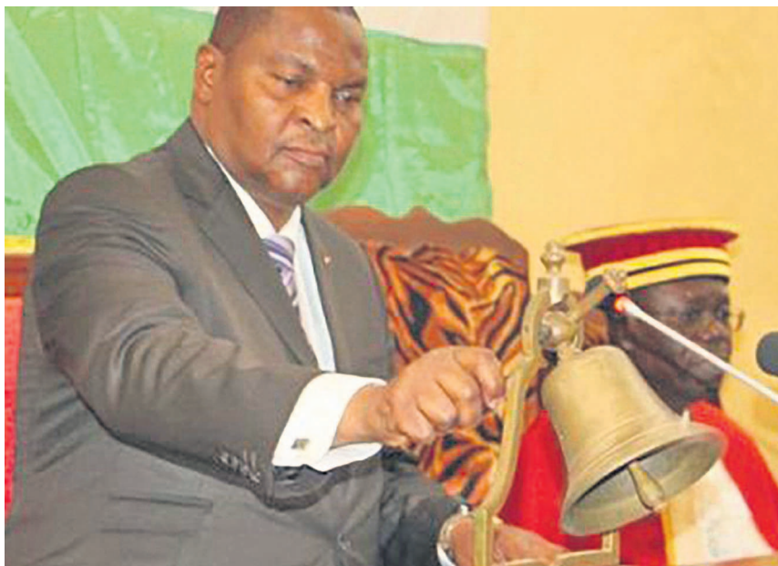
< Sans données à partir du lien >

général près la Cour des comptes, Nestor Sylvain Sanzé, a appelé le gouvernement à aider la Cour des comptes qui est sur plusieurs dossiers relatifs à la gestion de la transition afin de bien aboutir les enquêtes.