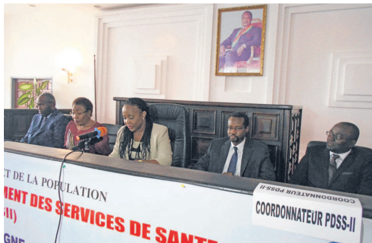
La ministre lançant l'identification

Il a, par ailleurs, expliqué la notion de ménage comme un