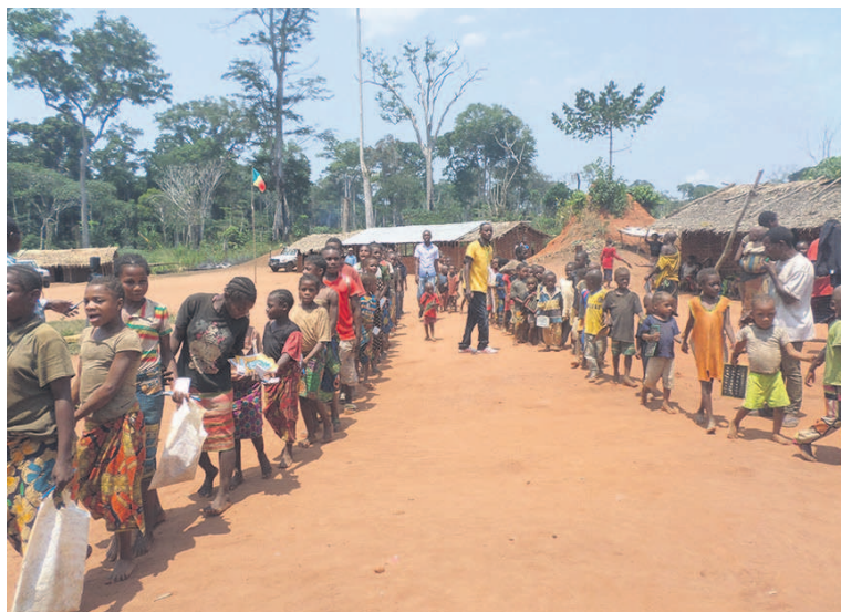
Les cantines scolaires après l'école

« Quand ils vont dans le système classique, ils tiennent. S'il est vrai qu'il y a encore du travail à faire, les efforts actuels ne sont pas vains : plus de 350 enfants ex-ORA ont intégré le système éducatif formel et sont suivis régulièrement. Au vu des effectifs grandissants d'année en