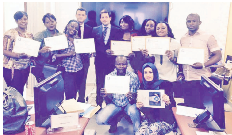
Les premiers candidats certifiés de la Sales Academy en RDC