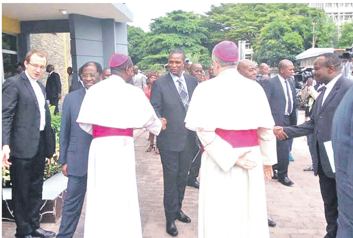
Des évêques saluant quelques participants à l'ouverture des travaux du Centre interdiocésain