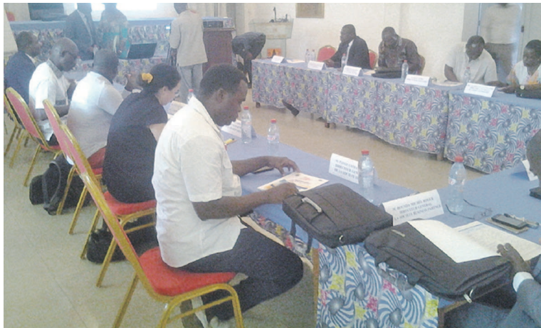
Une vue de la salle pendant la formation sur le Parcours de l'entrepreneur

Le dispositif « Parcours de l'entrepreneur » est la réponse aux difficultés qui entravent l'essor des entreprises congolaises. Elles vont de l'absence d'une vision au défaut d'un management efficace des équipes en passant par une mauvaise qualité du dialogue avec les banques ou les donneurs d'ordres. « Le dispositif Parcours de l'entrepreneur s'est voulu donc une réponse à ces problématiques parce qu'il ambitionne de favoriser une montée en compétences de ces dirigeants dans les domaines de la