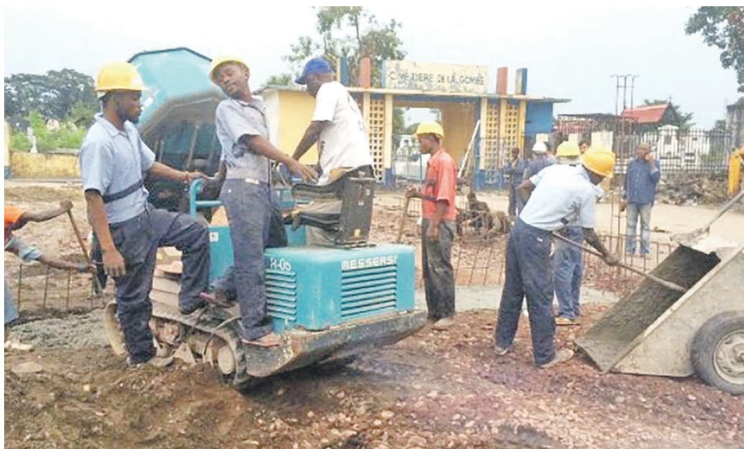
Arrêt des travaux d'aménagement du lieu de sépulture au cimetière de la Gombe