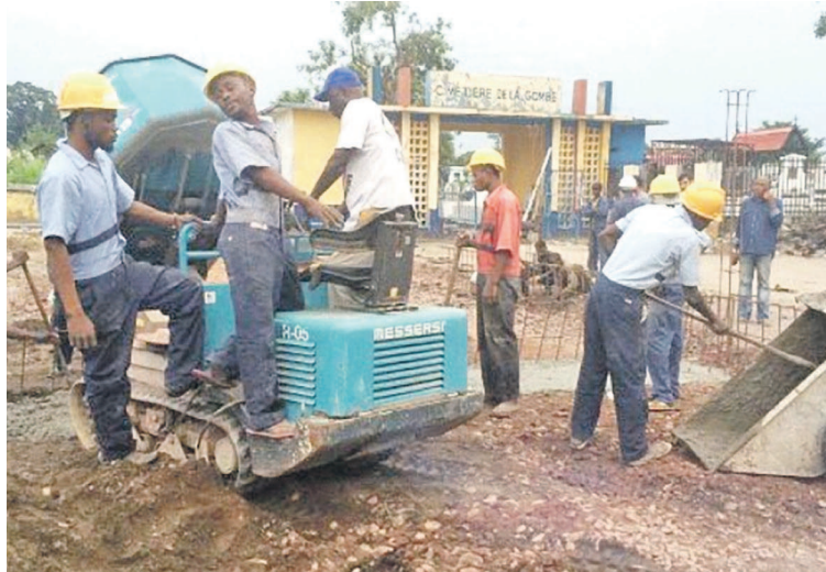
Arrêt des travaux d'aménagement du site au cimetière de la Gombe

Une façon pour la ville de répondre à la demande de la famille qui a fait état du report sine die de l'arrivée à Kinshasa de la dépouille de l'illustre disparu et de son refus de voir le leader de l'UDPS être enterré dans un carré spécial au cimetière de la Gombe. L'autorité urbaine a toutefois déploré les sacrifices matériels et financiers « largement consentis pour l'aménagement des lieux en rapport avec l'accord formel de ladite famille préalablement donné ». Quant au gouvernement, il a pris acte de ce dernier développement tout en maintenant son offre de facilitation d'inhumation sur le territoire de la République démocratique du Congo conformément aux