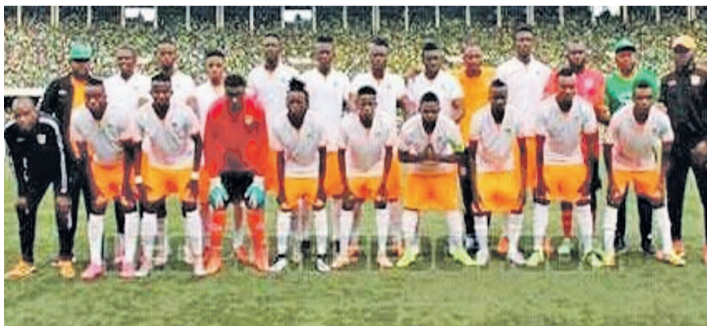
FC Renaissance du Congo

Le club orange tuteurée par l'évêque pasteur Pascal Mukuna a été battu, le 10 mars, au stade du 5 juillet d'Alger par Mouloudia Club d'Alger par deux buts à zéro. C'était en match aller des seizièmes de finale de la Coupe de la Confédération. Après avoir éliminé assez laborieusement le FC Akanda du Gabon au tour préliminaire de cette C2 africaine, Renaissance