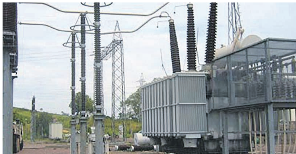
Un transformateur de la Snél à Kinshasa

Dans l'ensemble du réseau, il a été enregistré ce mois de février un déficit de pluviométrie en amont de Kinshasa avec, comme conséquence, des eaux qui ont baissé de moitié, à comparer à la même période l'année dernière.