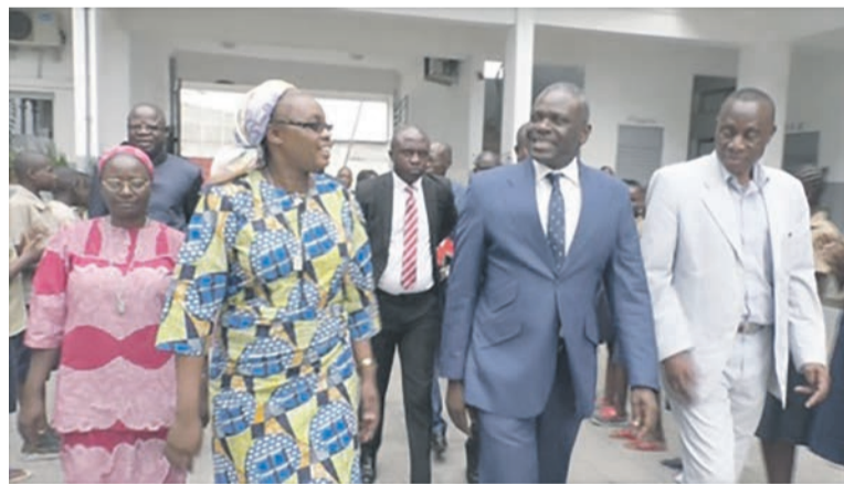
Collinet Makosso (au centre) lors de la descente dans une école privée

Le ministre de l'Enseignement primaire, secondaire et de l'alphabétisation, Anatole Collinet Makosso, a visité le 07 mars à Brazzaville, certaines écoles privées pour se rassurer de l'applicabilité de la pédagogie scolaire et des conditions d'apprentissage des élèves.