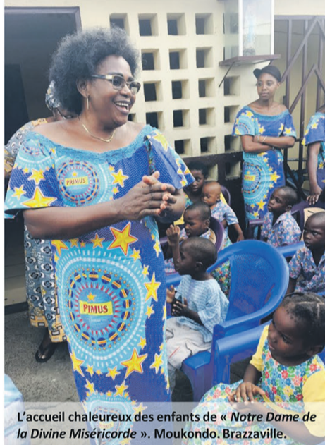
L'accueil chaleureux des enfants de « Notre Dame de la Divine Miséricorde ». Moukondo. Brazzaville.

Traditionnellement dédiée à une journée de réflexion sur l'évolution des droits des femmes dans le monde, le 8 mars a été l'occasion pour les dames des Brasseries du Congo d'apporter leur aide aux héroïnes du quotidien qui se consacrent à l'éducation des orphelins.