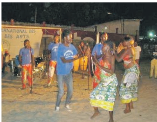
Le groupe Solution Musica lors de son spectacle au stade Kokolo Kopa

Le groupe Sanisina a donné un concert gospel exceptionnel. Il a emballé le public par ses rythmes et ses mélodies, l'auditoire a accompagné toute la soirée l'ensemble vocal et les solistes par ses claquements de mains sur des airs connus de gospel classiques et modernes. Pour sa part, le groupe Solution Musica a fait ces deux spectacles comme si c'était les derniers concerts qu'il donnait. Ses danseuses ont exécuté en toute délicatesse le Kibur'kiri, une