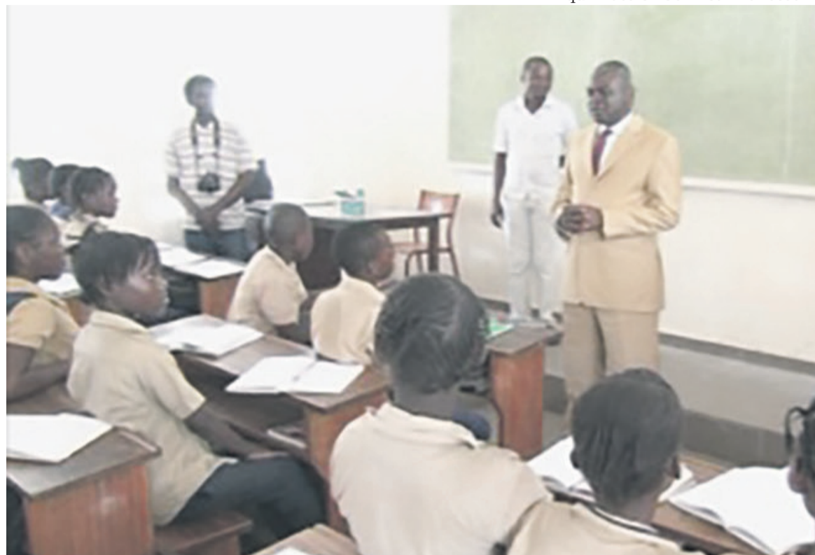
Anatole Collinet Makosso s'adressant aux élèves

En effet, ces échauffourées qui se sont poursuivies jusque dans les salles de classe ont occasionné l'étouffement de 59 élèves. Ceux-ci ont été vite admis à l'hôpital régional des armées de Pointe-Noire. Selon le ministre de l'Enseignement primaire, secondaire et de l'alphabétisation qui s'est