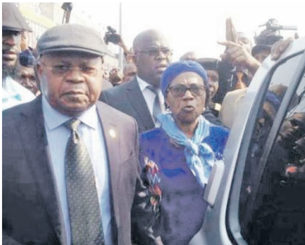
Étienne Tshisekedi (de son vivant) en compagnie de son épouse à son retour à Kinshasa

Une option rejetée par l'exécutif national