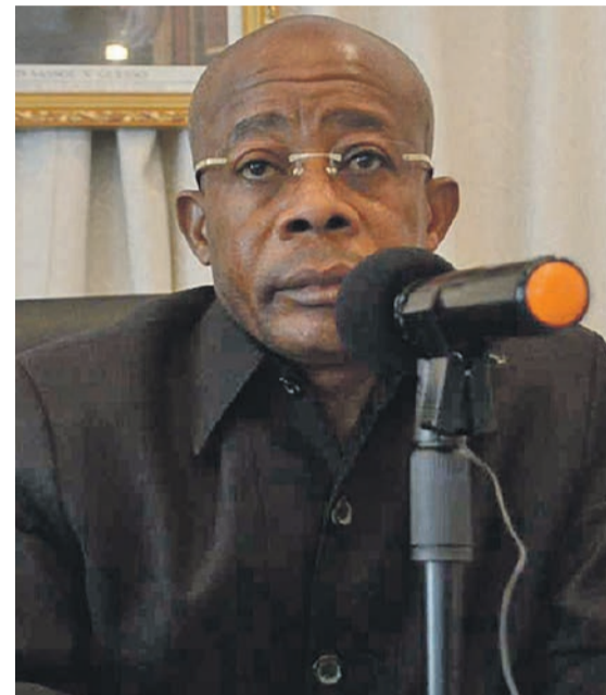
Martin Parfait Aimé Coussoud-Mavoungou, ministre des Affaires foncières et du Domaine public

La commission d'enquête préalable et parcellaire de la Zone économique spéciale (ZES) de Pointe-Noire a rendu public à Loango, dans le département du Kouilou, le rapport sur ces opérations après un mois de travail acharné et méticuleux. Ce, en présence Martin Parfait Aimé Coussoud-Mavoungou, ministre des Affaires foncières et du Domaine public et des autorités des départements de Pointe-Noire et du Kouilou.