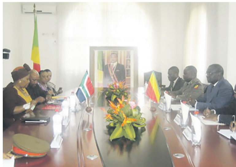
La rencontre entre les deux délégations

Il s'agit des questions liées à la formation, au suivi et aux échanges en matière des renseignements. « Comme vous le savez, il y a un Mémoire d'entente qui avait été signé entre la République du Congo et la République sud-africaine en matière de défense. Et par rapport au Mémoire qui existe, il a aussi été établi un comité conjoint de défense qui aura la mission de regarder