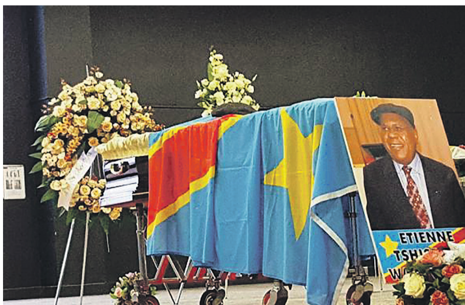
La dépouille d'Étienne Tshisekedi

À la suite du désaccord avec le gouvernement quant au lieu de sépulture du leader de l'UDPS décédé à Bruxelles le 1er février, la famille biologique de l'illustre disparu envisage de plus en plus son enterrement dans la capitale belge. Lors de son dernier conseil des ministres tenu le vendredi 10 mars, le gouvernement a réitéré sa décision excluant toute possibilité d'enterrer le vieil opposant dans un site urbanisé habité pour ne pas violer les textes règlementant l'organisation des funérailles en RDC.