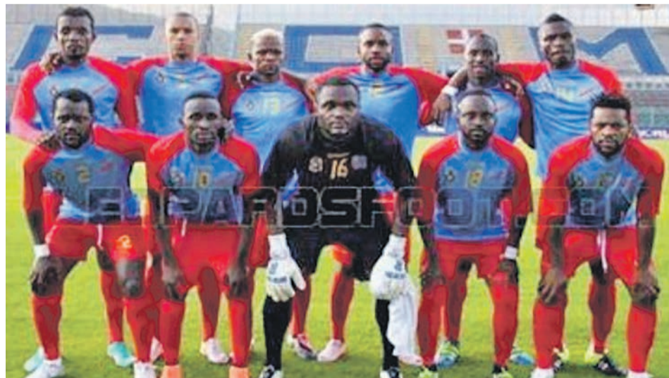
Les Léopards de la RDC

Le fait, pour les Léopards de la RDC de s'arrêter en quart de finale de cette compétition, éliminés par les Black Stars du Ghana, a certainement influé sur classement, avec la perte d'une case en mars. Les Léopards de la RDC jouent le 26 mars courant à Nairobi, un match amical de date Fifa contre les Harambee Stars du