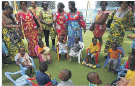
Les 11 pensionnaires de l'orphelinat « Jean Baba ». Rond-Point le Gorille. Pointe-Noire.