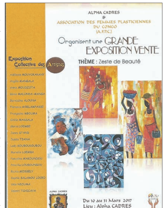
L'affiche de l'exposition