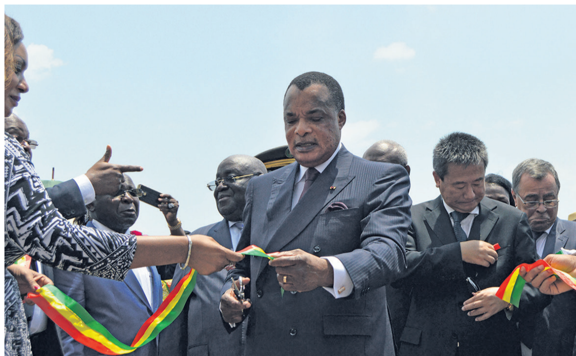
Le président de la République coupant le ruban symbolique.

En matière d'offre de soins, en effet, HGELBO est doté d'un plateau technique de deux niveaux : soins secondaires et tertiaires. Les premiers comprennent les services cliniques. Les Urgences médico-chirurgicales, les Consultations externes et spécialisées, la Médecine générale, la Gynécologie obstétrique, la Pédiatrie générale, l'Ophthalmologie, la Stomatologie, la Néphrologie-Hémodialyse, la Néonatalogie, la Réanimation, l'inféctiologie et la Rééducation fonctionnelle. Les seconds par ailleurs, concernent la Cardiologie, la Pneumonie, la Neurologie, la Chirurgie cardiovasculaire et