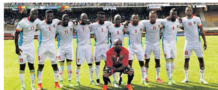
Les Léopards de la RDC

La Fifa a considéré quatre matchs internationaux disputés les semaines dernières pour