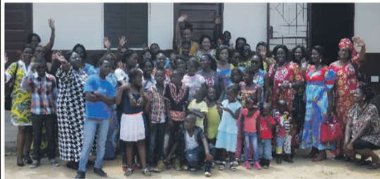
Photo de groupe des femmes de BRASCO avec les enfants de l'orphelinat « Amour de Dieu ». Côte Matève. Pointe-Noire.

Le mercredi 8 mars, les femmes des Brasseries du Congo ont décidé de consacrer leur journée à la réalisation d'activités sociales en faveur des plus démunis. A Brazzaville comme à Pointe-Noire, elles ont rendu visite à 4 orphelinats en tout, pour distribuer des dons financés par la Fondation BRASCO.