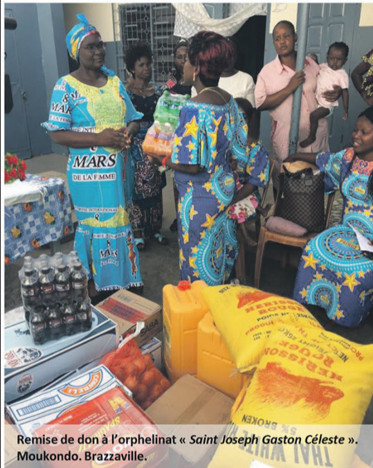
Remise de don à l'orphelinat « Saint Joseph Gaston Céleste ». Moukondo. Brazzaville.