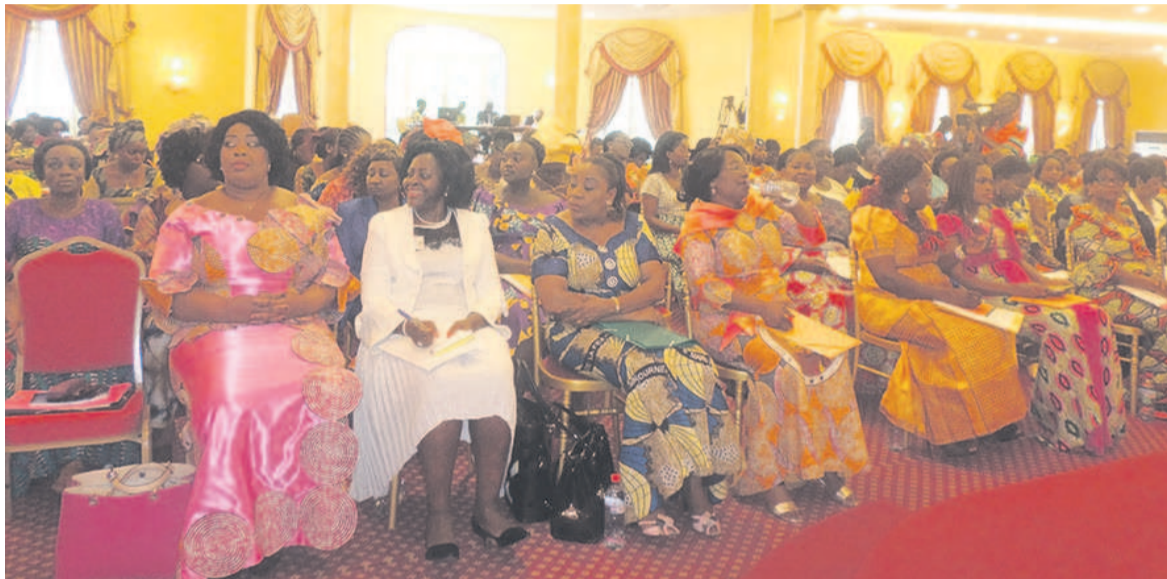
Les participantes ; crédit photo Adiac

à leurs proches les enseignements reçus. « Pour garantir le développement de notre pays, la femme congolaise doit occuper une place de choix dans la réalisation de la