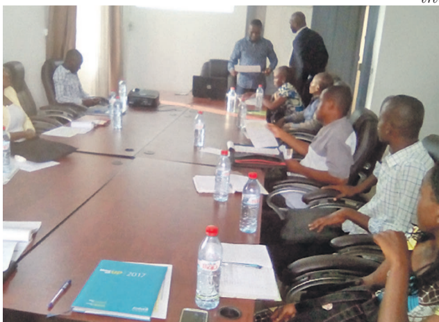
Une vue de la salle pendant la formation

Débutée le 26 mars, cette formation intitulée « Primo entrepreneur » destinée aux Très petites entreprises (TPE) et aux Petites entreprises (PE) prendra fin le 31 mars. L'activité se déroule à la chambre consulaire de la ville initiatrice de ladite formation.