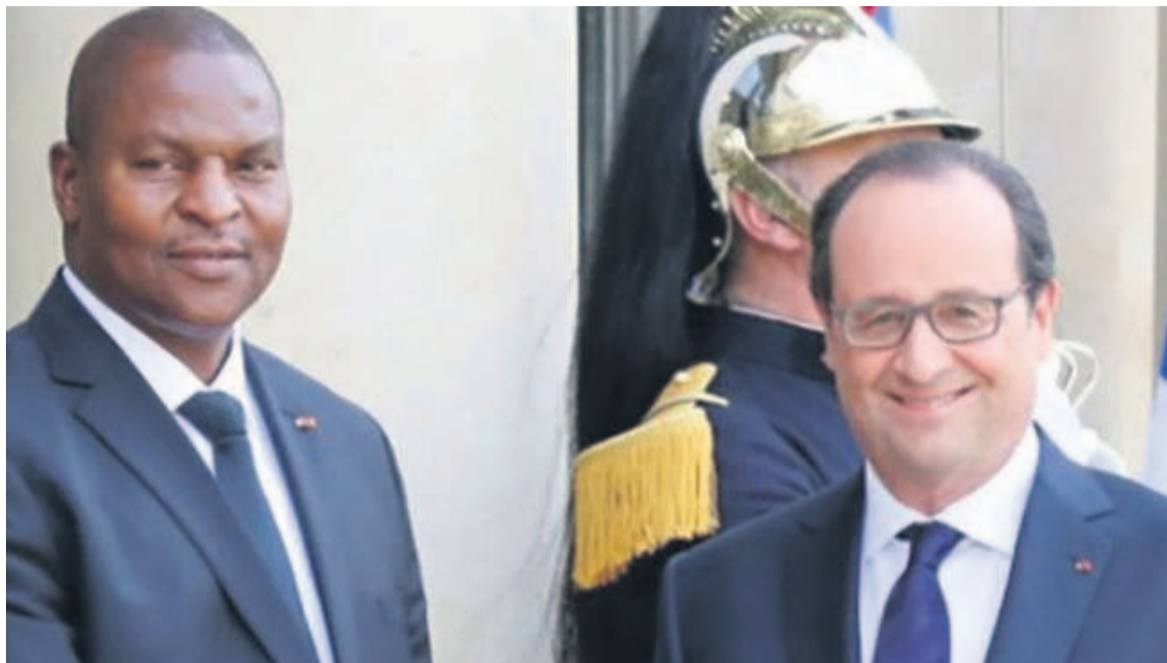
Les présidents François Hollande et Faustin-Archange Toudéra

Le président français François Hollande s'est réjoui des avancées du processus de consolidation de l'armée centrafricaine, avec l'apport de la mission européenne de formation EUTM, à l'issue d'un entretien. Il l'a fait savoir à son homologue centrafricain, Faustin-Archange Toudéra, qu'il a reçu à l'Élysée. Il s'est également félicité de la posture adoptée par la Mission multidimensionnelle intégrée de stabilisation des Nations en Centrafrique (Minusma) à Bam-