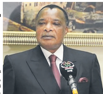
Denis Sassou N'Guesso à sa sortie d'audience avec Abdelaziz Bouteflika

Signés en marge du séjour de travail du président Denis Sassou N'Guesso, du 27 au 30 mars à Alger, ces accords sont le résultat de la 7 e réunion de la commission mixte entre les deux pays tenue les 25 et 26 mars dans la capitale algérienne.