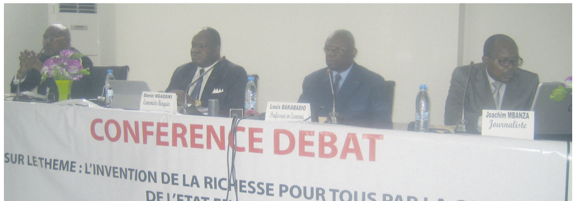
Le présidium de la conférence-débat

« Nous proposons à la communauté académique, à la classe politique et à la société civile une nouvelle politique économique conduisant à un nouveau modèle de société capitaliste, social-démocrate et républicain, marqué par l'élimination pure et parfaite de la pauvreté et des inégalités extrêmes mathématiquement établie », a-t-il déclaré rejetant toute idée d'une utopie de sa théorie basée sur des éléments qu'il estime concrets. Page 2