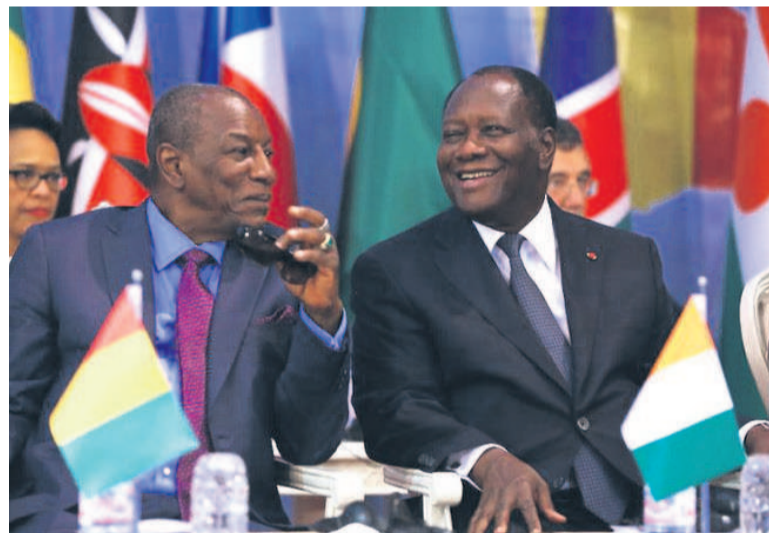
Les présidents, Alpha Condé et Alassane Ouattara

Pour sa part, le président ivoirien, Alassane Ouattara, a affirmé que