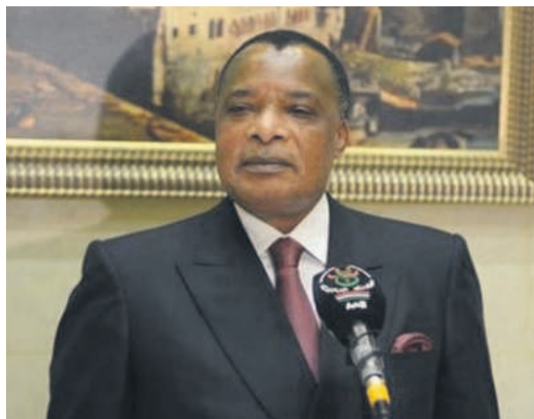
Denis Sassou N'Guesso à sa sortie d'audience avec Abdelaziz Bouteflika