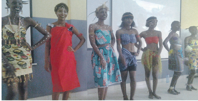
Une vue des miss université

Pourtant ces jeux universitaires ont bien commencé au CEG 5 février de Mpita, vendredi et samedi par des matchs de Nzango et de football. L'université de Loango vainqueur dans les deux disciplines a été sacrée championne. Les autres écoles telles Escic, Est-Le littoral, Hemip, ne sont contentées de leur côté que des places d'honneur.