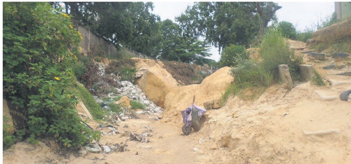
Une érosion qui rase des maisons à Massengo ; crédit photo Adiac

Il a également rappelé que l'objectif général de cet atelier est de démarrer le processus national de définition des cibles de la neutralité en matière de dégradation des terres. Spécifiquement, il s'agit de mettre en place une plateforme de négociation entre les parties prenantes ; examiner et approuver la feuille de route nationale pour la définition des cibles volontaires de neutralité en matière de dégradation des terres. Le dernier objectif consiste à valider le plan national d'effet de levier pour la définition des cibles de neutralité en ma-