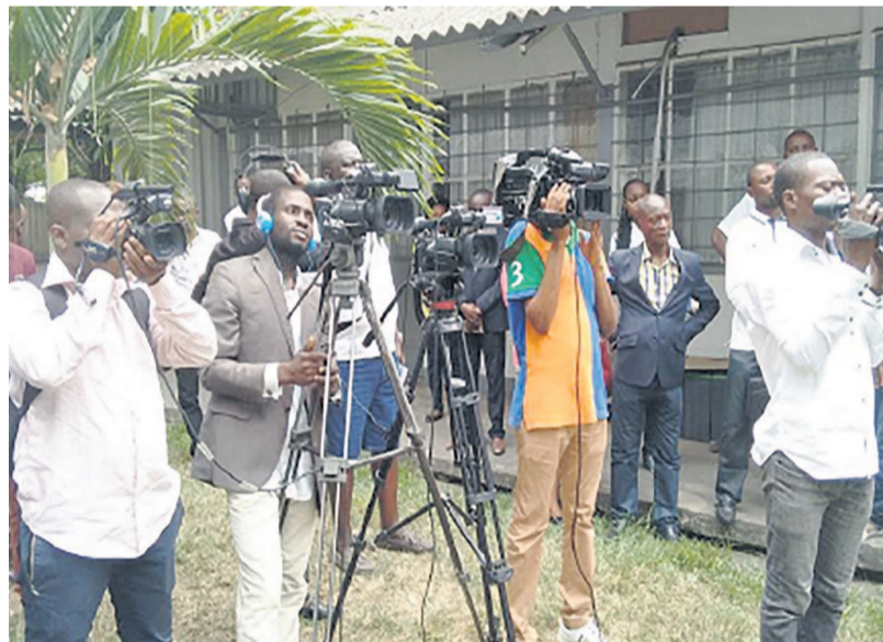
La presse, lors d'une activité à Kinshasa.