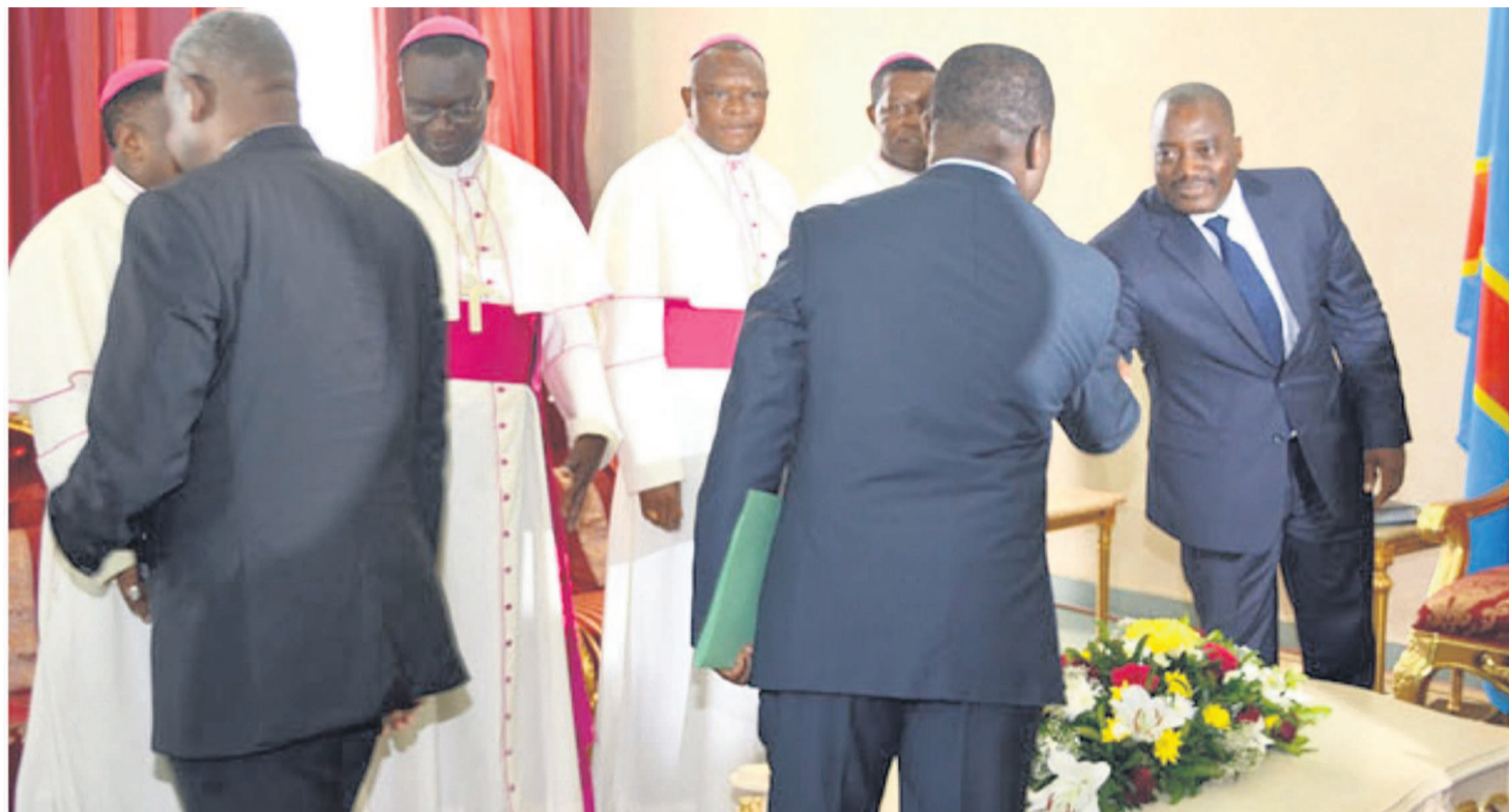
Joseph Kabila recevant les évêques catholiques

Les négociations directes entre Majorité et Opposition congolaise n'ont pas abouti le lundi 27 mars comme promis. Les évêques de la Conférence épiscopale nationale du Congo (Cenco) assurant la facilitation des travaux n'ont eu qu'à faire le constat d'échec de ces pourparlers qui ont pris trois mois sans qu'un consensus ne soit dégagé sur des matières essentielles. La signature des arrangements particuliers qui devait permettre l'application de l'accord de la Saint-Sylvestre, n'a pas eu lieu au grand désenchantement des évêques. Ces derniers étaient visiblement déçus de n'être pas parvenus à concilier les vues après les trois rounds de négociations sous leur égide et ils l'ont fait savoir. L'ambiance du lundi 27 mars au Centre interdiocésain censé abriter la cérémonie de signature des arrangements particuliers était plutôt très lourde et morose. Les délégués des composantes étaient quasi absents, preuve qu'ils n'avaient pas foi au dernier forcing entrepris par les évêques pour tenter de régler les quelques points en suspens. « A ce niveau, la Cenco porte à la connaissance de l'opinion tant nationale qu'internationale l'impasse politique de ces discussions qui traduit le manque de bonne volonté politique et l'incapacité des acteurs politiques et sociaux de trouver un compromis et mettant au premier