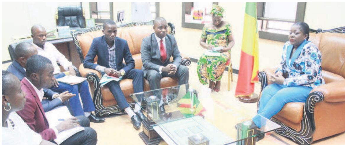
Mme la ministre s'entretenant avec la délégation de l'Uleeco

La ministre de la Jeunesse et de l'éducation, Destinée Hermella Doukaga, s'est entretenue, le 28 mars à Brazzaville, avec une délégation de l'Union libre des élèves et étudiants du Congo (Uleeco) conduite par son président, Rostand Ondongo, qui a présenté au ministre le nouveau bureau élu en date du 17 février 2017.