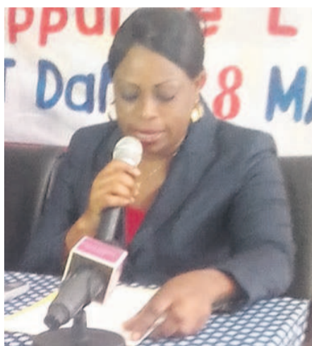
Nicole Mantsanga Bambi (Adiac)

La directrice des Musées, des monuments et sites historiques au ministère de la Culture et des arts, Nicole Mantsanga Bambi a relevé le 28 mars la nécessité de bien garder le patrimoine culturel immatériel, au profit des générations actuelles et futures. Un atelier de validation de l'inventaire de ce patrimoine a été organisé à cet effet à Brazzaville avec l'appui de l'Unesco pour examiner les résultats des enquêtes menées dans six départements du Congo.