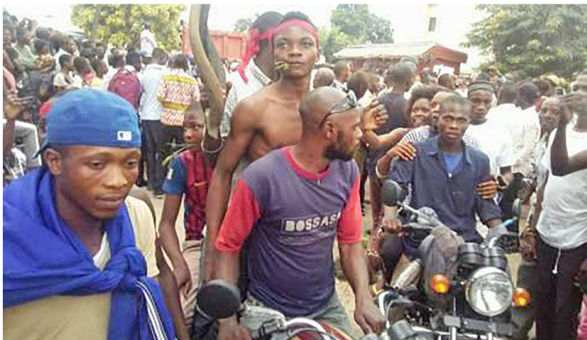
Des miliciens Kamuina Nsapu

Les faits remontent à vendredi 24 mars dernier. Une quarantaine de policiers sont tombés dans une embuscade tendue à leur convoi par les miliciens Kamuina Nsapu, alors qu'ils se rendaient à Kananaga en provenance de Tshikapa. L'incident se serait produit à Kamuesha, à environ 75 km au nord-est de Tshikapa, une ville du