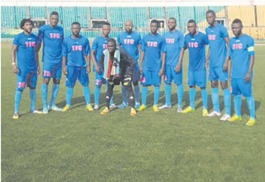
Tongo FC a compliqué la tâche à l'Étoile du Congo