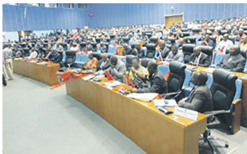
Une vue des membres du comité central du PCT

« De la justesse et la pertinence de ses délibérations, seront jugées la hauteur, la maturité et la capacité de dépassement des membres du comité central (...). Que chaque membre à quelque niveau où il se trouve devrait faire