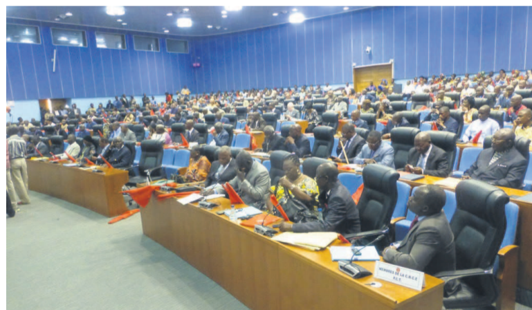
Une vue des membres du comité central du PCT

« Nous avons eu l'unique point phare à l'ordre du jour : la participation victorieuse du parti aux échéances électorales de 2017. Le bureau politique a donc examiné ce document que nous soumettrons à la prochaine réunion du comité central », a précisé