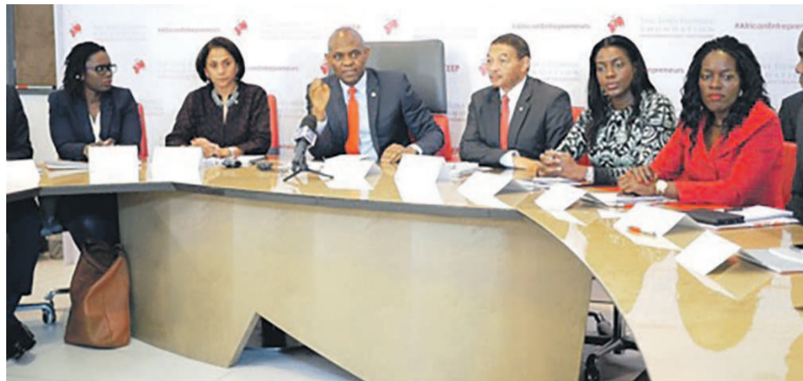
Les membres de la fondation Tony Elumelu

« Me tenir ici aujourd'hui pour annoncer les candidats retenus