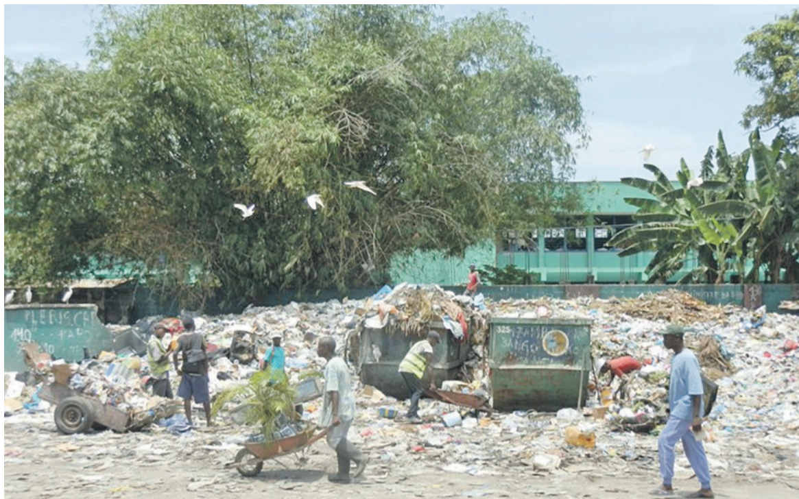
Une poubelle débordée, devant une école de Kinshasa

Les deux Asbl ont fait voir au PGR les conséquences néfastes et l'impact de l'environnement ainsi décrit dans les vies humaines, surtout que ces immondices sont stockées dans les endroits habités. De l'avis de SOS Kinshasa et ANJ, la population est ainsi exposée aux épidémies et maladies liées à la pollution de son environnement. « Le