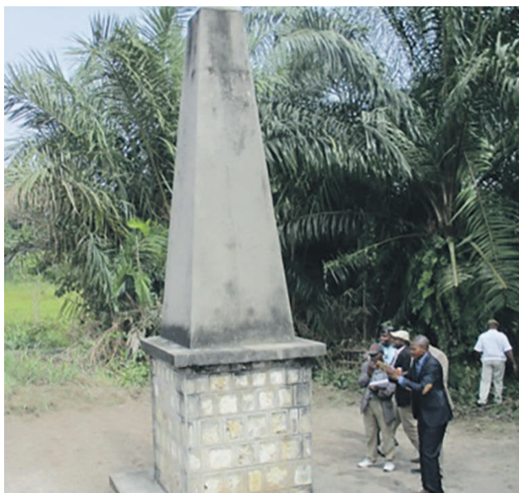
La ministre du Tourisme au pied du Mont Amaya-Mokini