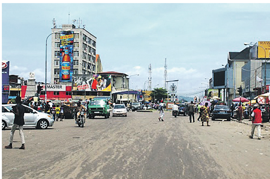
La place Victoire à Kinshasa

Personne ne sait le dire. Kinshasa est, comme qui dirait, plongée dans une sorte d'expectative, ou mieux, d'incertitudes d'avant le 31 décembre 2016. Le durcissement du ton de la part du Rassemblement qui tient mordicus à obtenir l'application de l'accord de la Saint sylvestre au prix des actions de rue, y est pour beaucoup. Parmi les signes qui ne trompent pas et qui trahissent cette situation quasi délétère que connaît la capitale, l'on peut citer l'absence d'embouteillages, la fermeture jusqu'à nouvel ordre de certains commerces et la psychose quasi permanente qu'entretient la présence des hommes en uniformes déployés sur certains sites. Les Kinois qui investissent les terrasses pour y boire un coup les quittent désormais un peu plus tôt. « Mboka eza bien té » (le pays va mal), raillent-ils, souvent avec dépit. L'échec des négociations directes Majorité-Opposition sous l'égide de la Cenco aura laissé amer l'arrière-goût d'inachevé et provoqué l'ire d'une population qui avait pourtant cru en cette démarche salutaire qui posait les bases d'une cogestion du pays pendant la transition en attendant l'organisation des scrutins en décembre. Déçus de leurs politiciens, plus ventriloques que patriotes, de nombreux Kinois vivent désormais en mode « qui-vive », n'écoulant que la voix de leur propre raison, loin des gesticulations des politiciens.