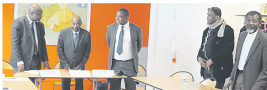
Des participants entonnant l'hymne national à Paris

Animés d'un fort désir d'éclairage face à la perplexité de la situation géographique de leur pays concernant le circuit de ces « produits sensibles », ils sont venus avec la même envie de comprendre un des facteurs déstabilisant du jour et voir comment un ancien ministre en charge de l'Energie et de l'hydraulique, durant la période transitoire allant du 23 janvier 2014 au 30 mars 2016, parlerait de l'approvisionnement en produits pétroliers d'un pays enclavé, lequel, malgré ses potentialités pétrolières