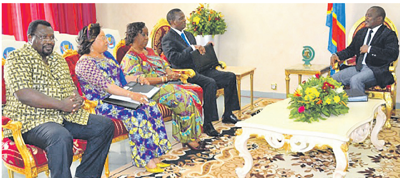
Joseph Kabila s'entretenant avec la délégation du RCD conduite par Azarias Ruberwa

Alors que la Majorité salue l'initiative présidentielle destinée à baliser la voie en prévision de l'application sans faille de l'accord du 31 décembre, le Rassemblement de l'opposition (Rassop) fait savoir que le chef de l'Etat qui selon lui est à l'origine de la crise actuelle, ne peut