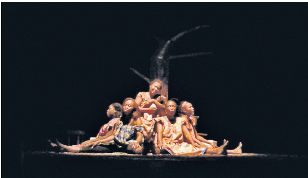
Un extrait de Trases infemales