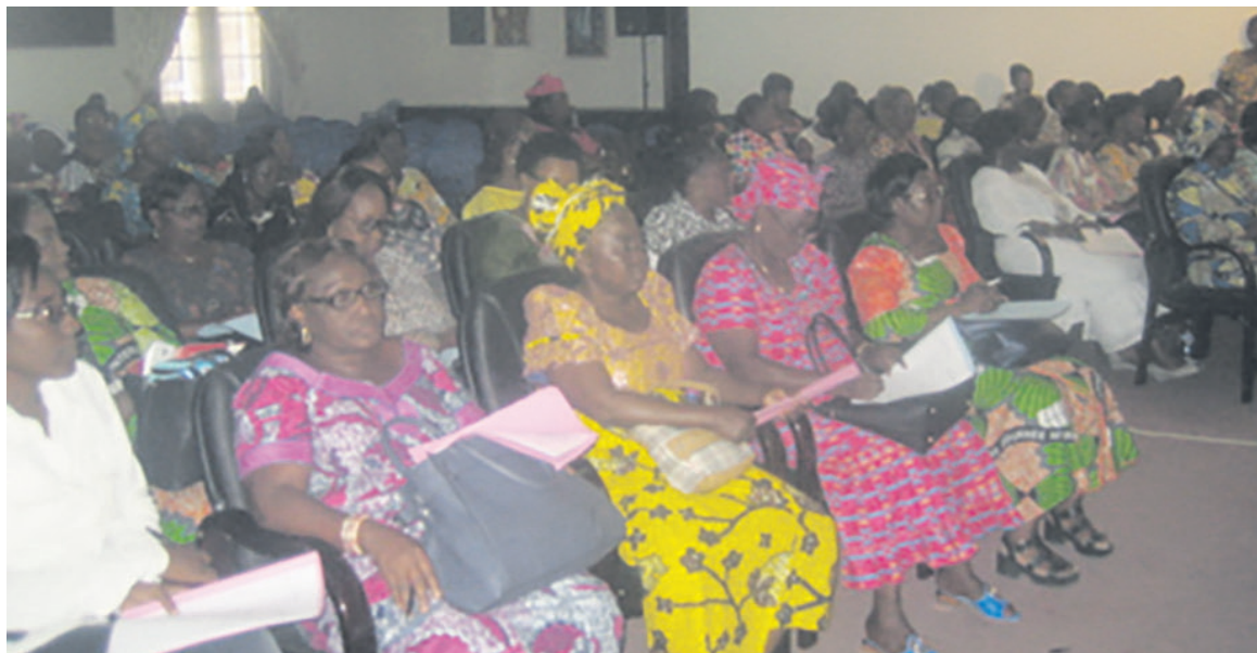
Les participants lors des échanges (Adiac)

cipantes ont salué les progrès réalisés par les femmes de ce secteur, notamment en matière d'autonomisation et de renforcement des capacités professionnelles. « Les femmes méritent donc d'être employées rationnellement à tous les niveaux de la hiérarchie. Les femmes de l'administration du commerce bien majori-