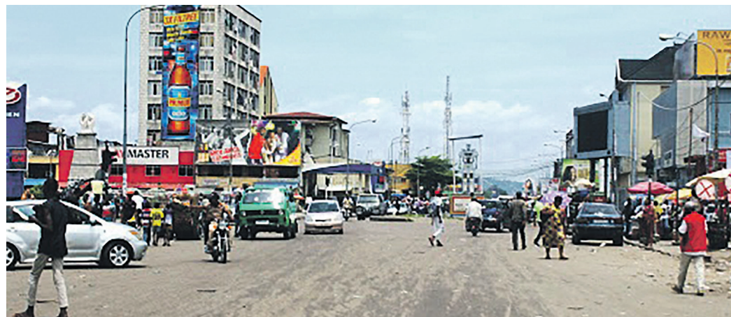
La place Victoire à Kinshasa

Le syndrome de l'indolence semble, depuis la ville-morte de lundi 3 avril, gagner les Kinois qui ne font plus montre d'empressement pour rejoindre leurs lieux de travail ou de négoce. Beaucoup ont déjà mis une croix sur une semaine présentée, d'ores et déjà, comme agitée du fait des actions de rue programmées par l'opposition. La semaine qui a mal commencé risque de mal se terminer lorsqu'on s'en tient à la détermination de l'opposition à en découdre