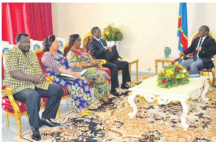
Joseph Kabila s'entretenant avec la délégation du RCD conduite par Azarias Ruberwa

forces politiques et sociales ont, quant à eux, répondu favorablement à la main tendue de Joseph Kabila, il n'en est pas le cas pour d'autres qui continuent à bouder l'initiative. C'est notamment le cas du Rassemblement des forces politiques et sociales acquises au changement (aile Félix Tshisekedi) qui y voit un piège. Cette coalition de l'opposition fait savoir que le président Kabila qui est « à l'origine de la crise actuelle », ne peut « s'ériger en arbitre ». Cette frange de l'opposition n'en-