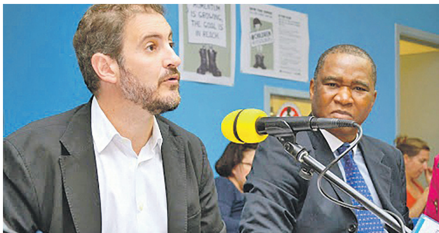
José Maria Aranaz, directeur du BCNUHD en RDC, s'exprimant lors d'un point de presse

Le nombre de ces sépultures de fortune est passé de dix à vingt-trois dans cette région du centre du pays où les affrontements entre les FARDC et les rebelles de Kamuina Nsapu ont déjà causé la mort d'au moins quatre-cents personnes. La révélation a été faite par le directeur du Bureau conjoint de l'ONU aux droits de l'Homme (BCNUHD) qui s'est appuyé sur les conclusions d'une récente enquête de