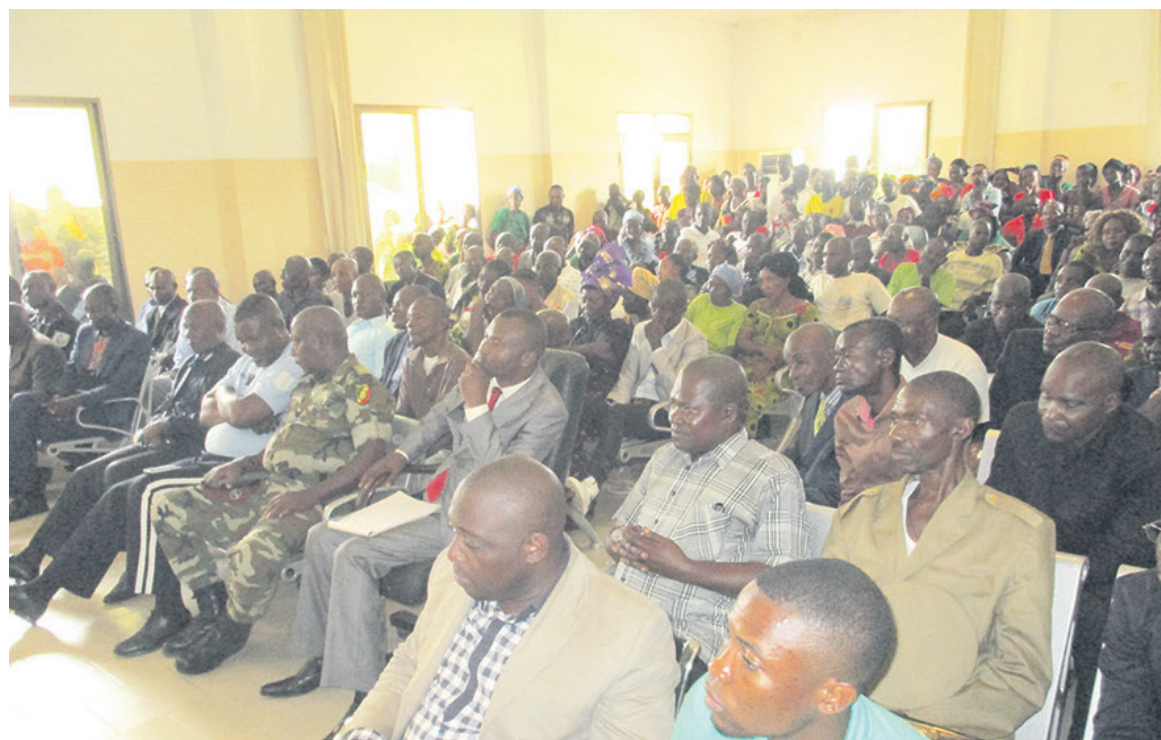
Une vue de la population de Mbama, lors de la rencontre avec la ministre du Tourisme