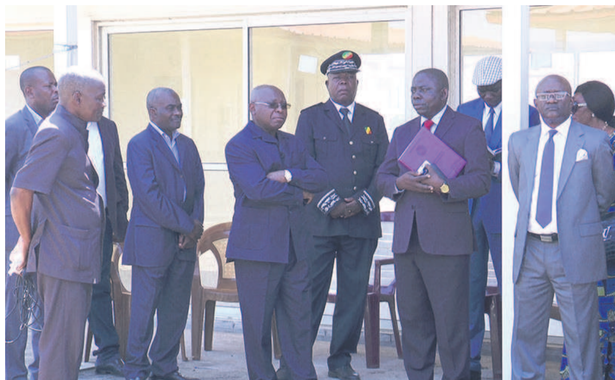
Raymond Zéphirin Mboulou et ses collaborateurs

Le ministre de l'Intérieur, de la décentralisation et du développement local, Raymond Zéphirin Mboulou, a effectué le 4 avril, le déplacement de Kintélé pour identifier parmi les mille logements sociaux, quelques locaux devant abriter provisoirement le siège social de la nouvelle commune, afin de la rendre fonctionnelle.