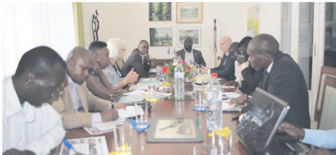
La séance de travail avec l'ambassadeur de l'Union européenne

une réunion des 27 Etats membres qui ont réaffirmé leur attachement aux principes de l'Union européenne. « La célébration de