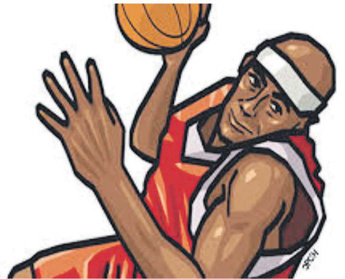
Illustration d'un basketteur

Notons que ce championnat qui s'inscrit dans le