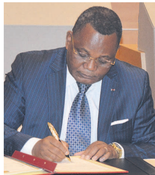
Jean Claude Gakosso

Pour manifester le regret qu'a l'Etat congolais suite à l'attentat meurtrier qui s'est produit à Saint-Petersbourg, en Russie occasionnant 14 morts, le ministre des Affaires étrangères, de la coopération et des Congolais de l'étranger, Jean Claude Gakosso, a adressé un message le mardi 4 avril, au nom de son pays dans le livre des condoléances de l'ambassade de la Russie en République du Congo.