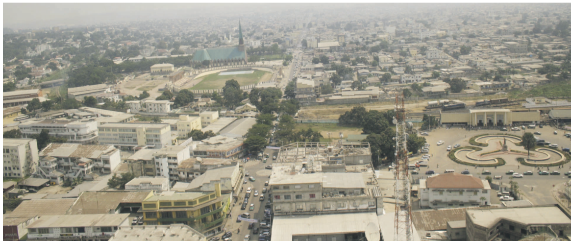
Une vue partielle de la ville de Brazzaville

Les deux principales villes du Congo, Brazzaville et Pointe-Noire qui hébergent environ 70% de la population congolaise, estimée à 4,5 millions d'habitants, ploient dans un état de précarité représentant près de 60% de leur superficie respective.