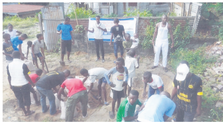
Des jeunes à l'oeuvre