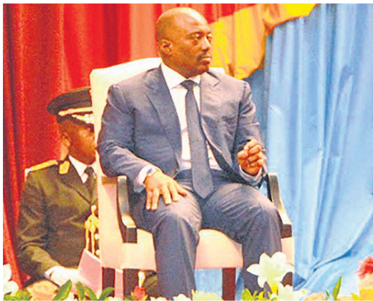
Joseph Kabila Kabange

Concernant la présidence du CNSA, Joseph Kabila a exhorté les deux chambres du Parlement