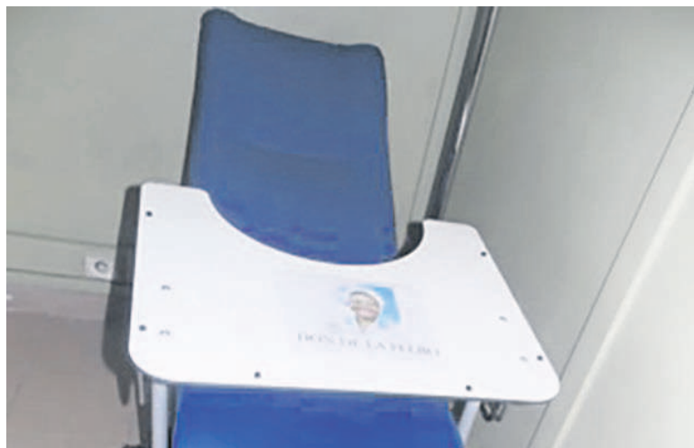
Un fauteuil de chimiothérapie

Huit fauteuils de chimiothérapie et une hotte à flux lumineux horizontal pour le service de cancérologie du Centre hospitalier universitaire (CHU) de Brazzaville ont suscité la joie des responsables de cette unité de soins.