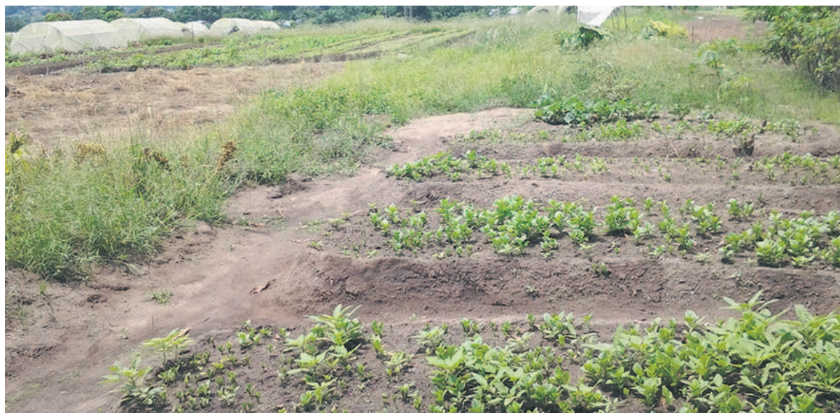
Les sites de Nsougui et d'Agri-Congo à Madibou

Afin de permettre notamment aux maraichers évoluant sur les sites de Nsougui et d'Agri-Congo à Madibou, dans le 8 e arrondissement de Brazzaville, de disposer de façon permanente de la matière organique pour le développement de leurs activités, le gouvernement devra construire sur ces différents sites agricoles, une unité de production du fumier.