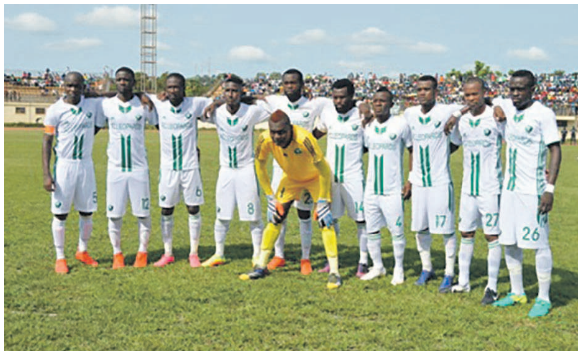
L'AC Léopards de Dolisie (Adiac)

C'est pour la 4e fois en effet que les vainqueurs de la 9e édition de la Coupe de la