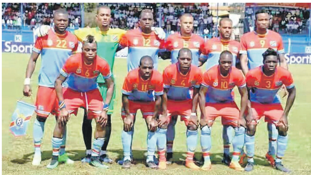
Les Léopards de la RDC à Nairobi avant le match contre les Harambee Stars du Kenya

La RDC perd deux places au classement Fifa, c'est ce qu'indique le classement mensuel de l'instance mondiale du ballon rond, publié le 6 avril en son siège à Zurich en Suisse.