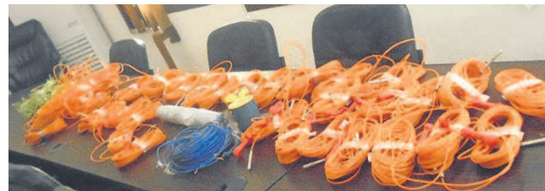
Du matériel saisi, prêts à l'emploi