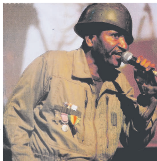
L'affiche du concert de Zao à l'IFC

Deux activités sont prévues le samedi 8 avril, d'abord à 10h par le samedi des petits avec : la planète