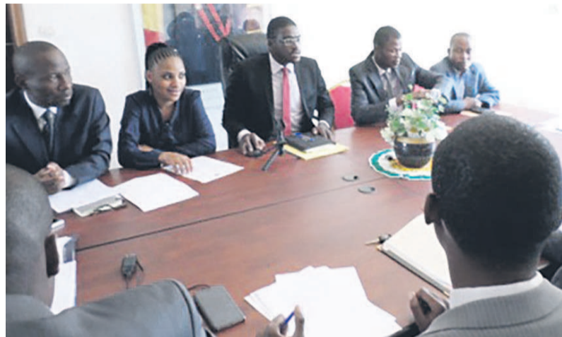
Les membres du secrétariat permanent de la FMC