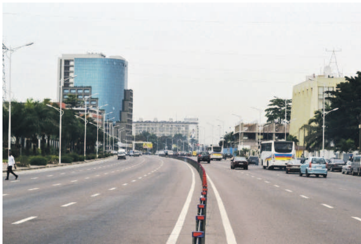
Le centre des affaires à Kinshasa

Dans son message à la nation, Joseph Kabila a présenté quelques chantiers qui l'attendent dès la mise en place du nouveau gouvernement. Sur le plan économique, le nouveau gouvernement devra fournir les efforts de mo-