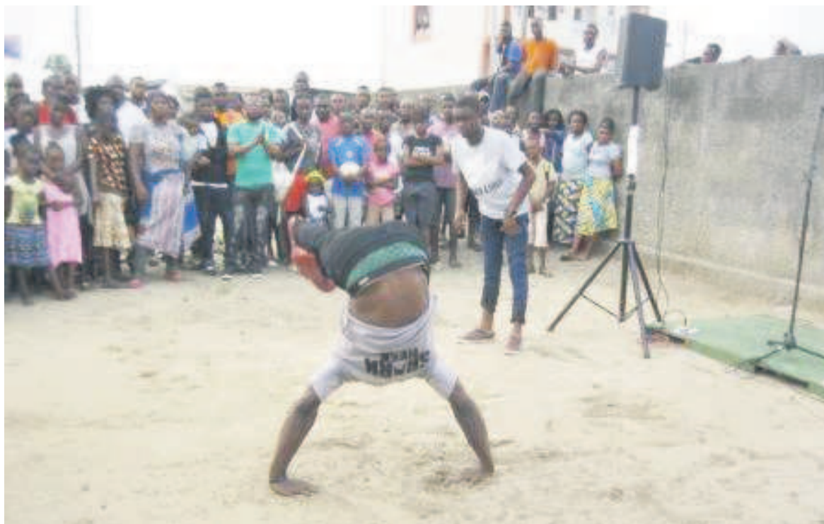
L'image d'un breakdance

chant et danse. Après plus d'une heure de compétition,