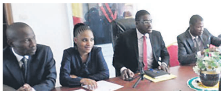
Les membres du bureau de la FMC

Le secrétariat permanent du comité central de la Force montante congolaise (FMC), jeunesse du Parti congolais du travail (PCT) veut tout mettre en œuvre pour une participation effective des jeunes aux prochaines élections qui pointent à l'horizon.