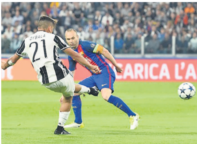
L'Argentin Dybala a précipité la chute du Barça de Messi et Iniesta avec un doublé

Après la démonstration des Italiens et de leur prodige argentin Dybala, auteur d'un doublé de classe, le sentiment est que cette fois, le Barça ne s'en remettra peut-être pas. Le PSG et le 6-1 du Camp Nou sont passés par là, bien sûr, et Messi, Neymar et les autres ont prouvé que l'impensable pouvait arriver. Qu'il arrive deux fois, cela semble invraisemblable. Et qu'il arrive face à des Italiens, cela paraît absolument impossible. Mais il reste un match retour à jouer et c'est quasiment le seul point positif pour les joueurs de Luis Enrique, dépassés par la qualité d'une Juventus sûre d'elle et de son projet européen, bien partie pour prendre sa revanche de la finale perdue contre les Blaugrana en 2015 (3-1). Les Turinois ont presque tous été très bons, de Buffon, qui n'a toujours pas encaissé de but de Messi et auteur d'un arrêt réflexe formidable face à Iniesta après une passe magique de l'Argentin (21e), à Dybala, bien sûr, qui a étalé aux yeux de l'Europe son immense talent. La «Joya» a frappé dès la 7e minute, d'une frappe enroulée du gauche après que Cuadrado a fixé Mathieu, qui a beaucoup