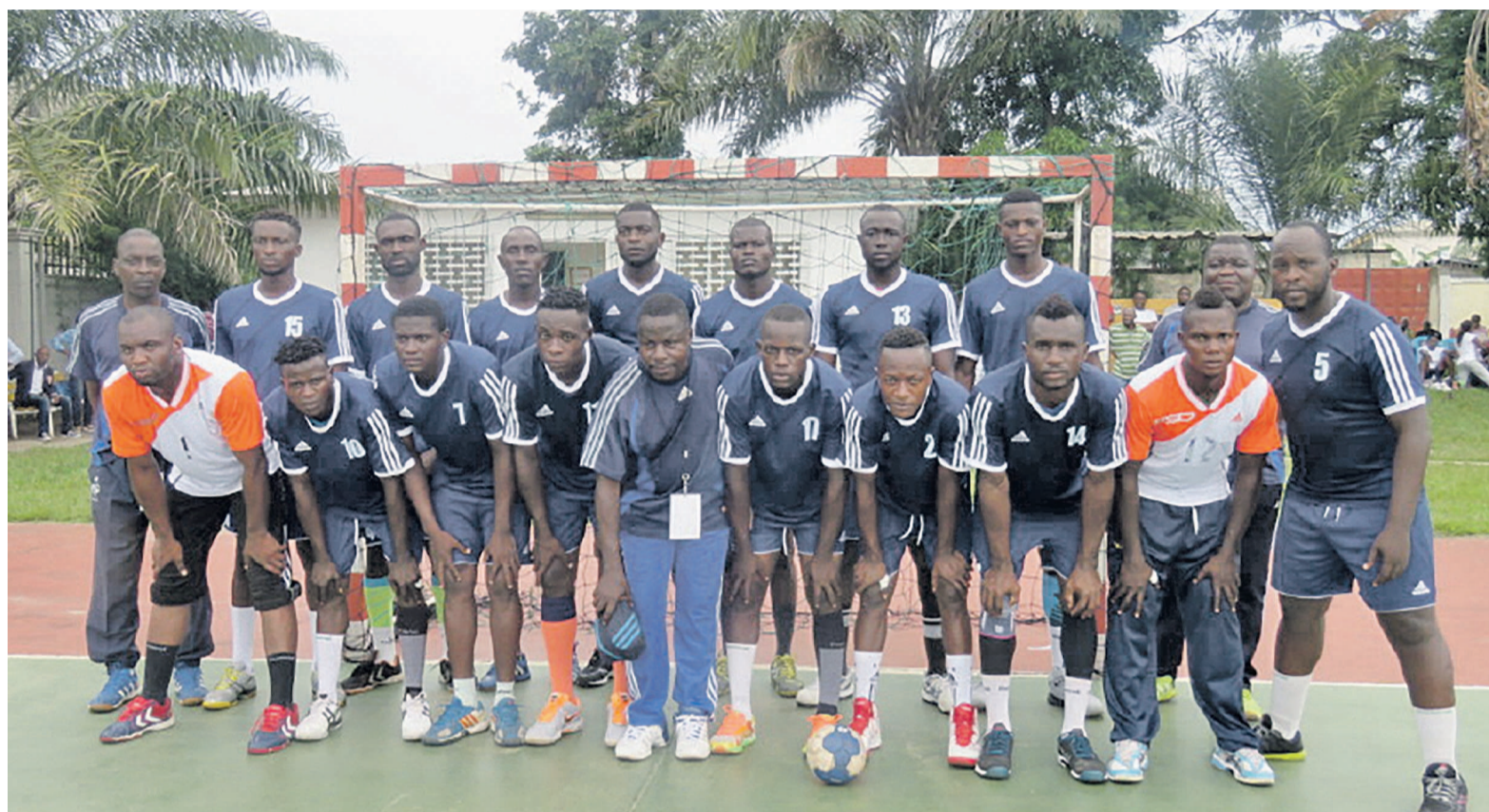
L'équipe de Patronage Sainte-Anne «Adiac»

Dix jours durant, ces clubs venus de 11 pays d'Afrique s'affronteront pour succéder à Zamalek SC d'Egypte, le grand absent de cette compétition. Le club ponténégrin participe au Championnat d'Afrique des clubs pour la troisième fois avec l'objectif d'améliorer son classement de 2014.