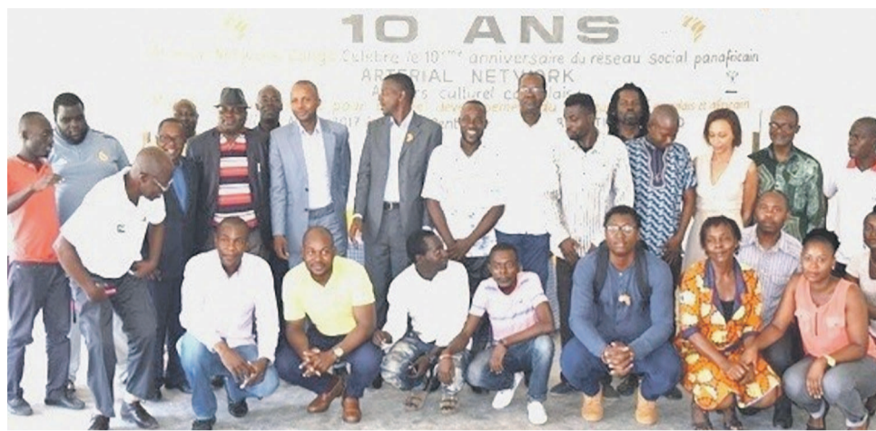
La photo de famille lors de la célébration des 10 ans Arterial Network Congo.

Au cours des échanges, les participants ont reconnu l'importance des actions du chapitre d'Arterial Network Congo en matière de mise en synergie des acteurs culturels, d'existence d'une diversité d'événements culturels à Pointe-Noire et au Congo d'opportunités de collaboration entre les différents acteurs, structures et événements culturels, d'opportunités de promotion et d'appui des initiatives cultu-