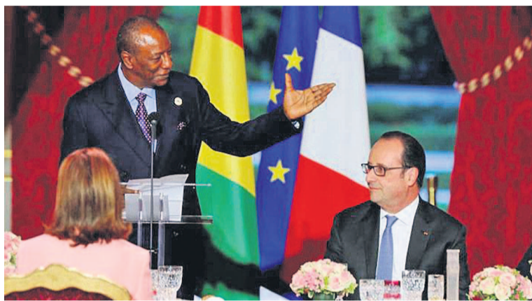
Alpha Condé et François Hollande

François Hollande et Alpha Condé ont, à la faveur d'une rencontre à Paris, laissé, dans leur raisonnement, croire à une probable nouvelle facilitation de l'Union africaine, en association avec la Conférence épiscopale nationale du Congo (CENCO), conformément à la Résolution 2348 pour les bons offices dans la crise politique congolaise.