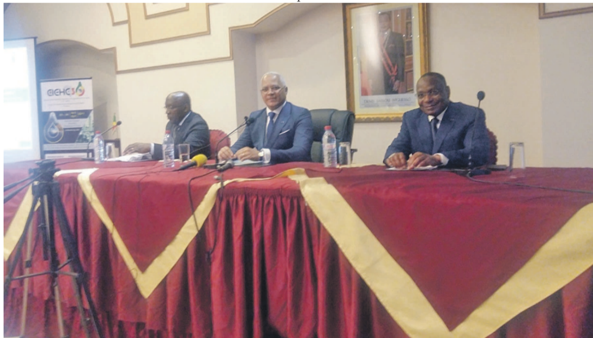
Le ministre Jean Marc Thystère Tchicaya au centre pendant le point de presse