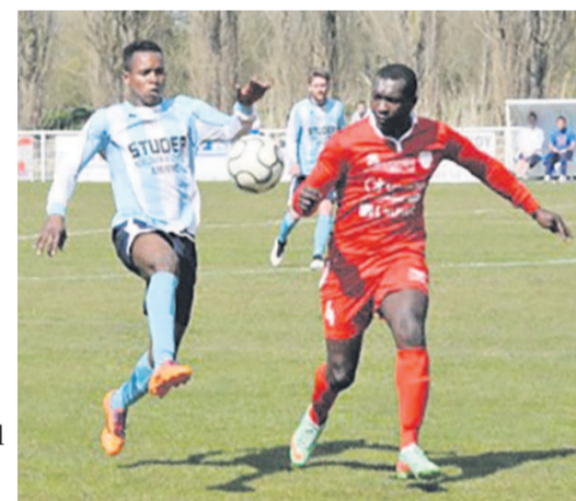
Double d'Ikouma Garcia qui permet à Ailly-sur-Somme de battre la réserve du Paris FC