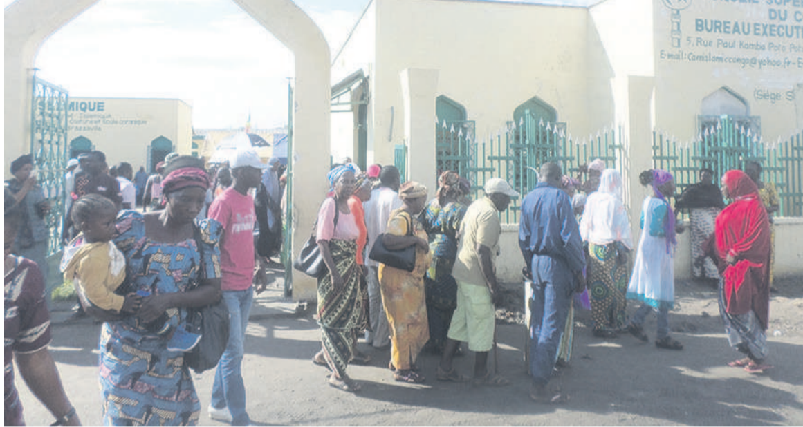
L'enregistrement des patients au siège du CSIC

la technicité de nos compagnons qui viennent nous aider. Ce que nous faisons c'est pour aider l'Etat congolais, chacun de