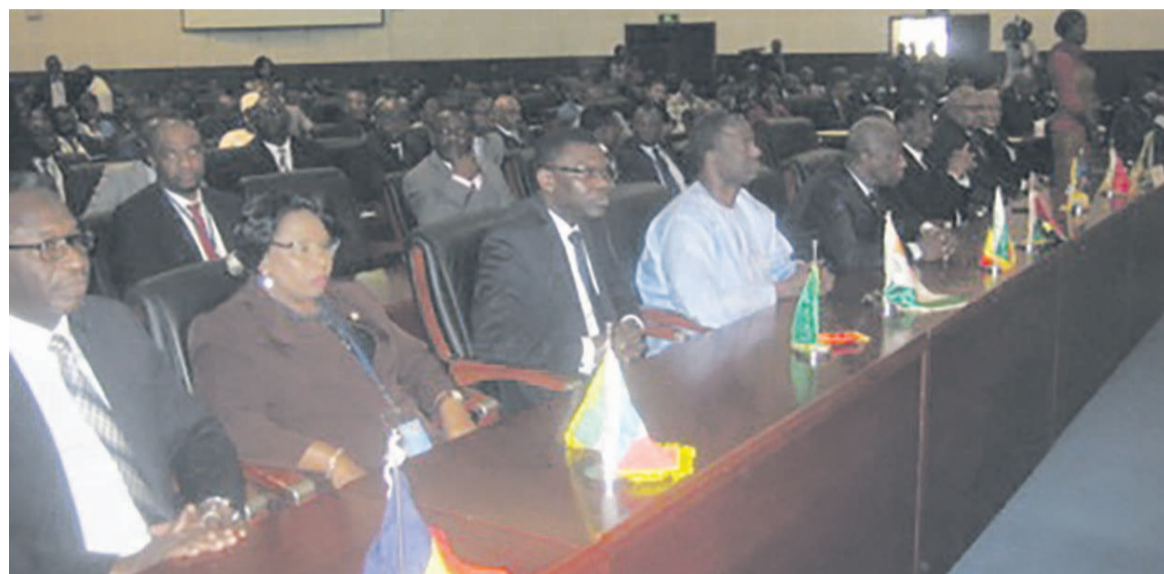
Les ministres des États membres réunis à Brazzaville

pages disponible depuis le 5 avril 2017, est un outil idéal pour regrouper des comptes en un seul document avant une assemblée ou pour tout autre lecteur des comptes. Si un diri-