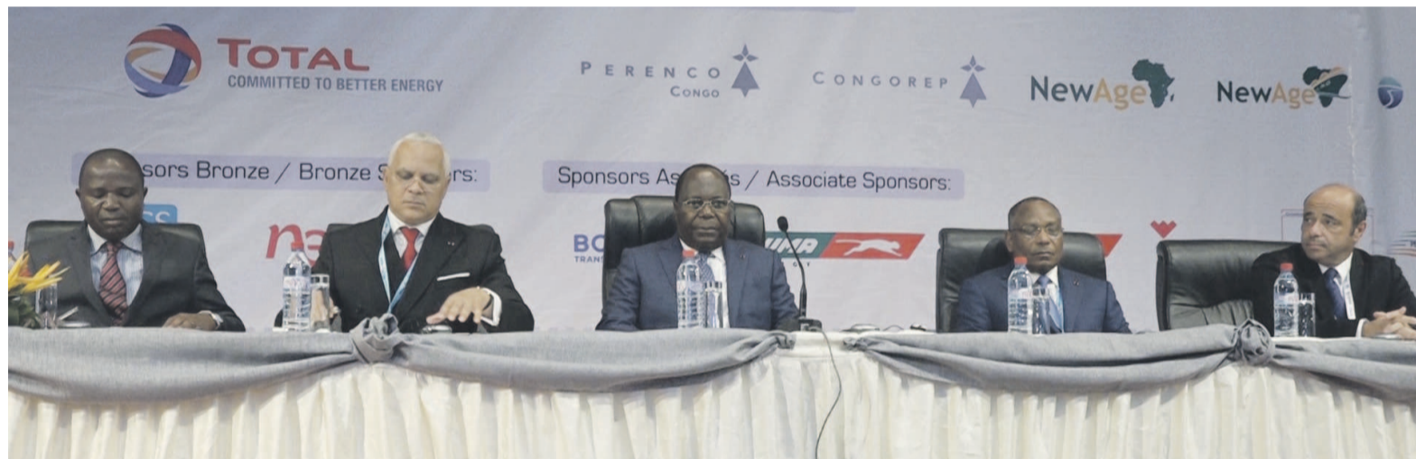
Le présidium à l'ouverture des travaux