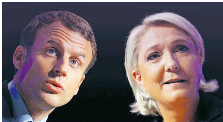
Emmanuel Macron et Marine Le Pen

Ce premier tour, marqué par une participation massive de près de