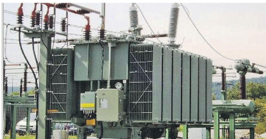
Un transformateur de la Snel