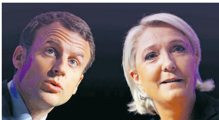
Emmanuel Macron et Marine Le Pen

Ce premier tour, marqué par une participation massive de près de