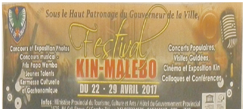
La banderole annonçant le Feskim

La population kinoise, qui vit cette activité festive jusqu'au 29 avril, a été appelée à s'approprier cet événement dont l'organisateur souhaite la pérennisation en vue de servir de miroir de la culture kinoise en particulier et congolaise en général.