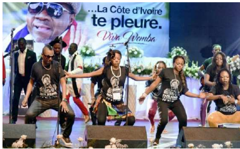
Viva La Musica lors des funérailles de Papa Wemba à Abidjan

de Bakala dia Kuba sur la scène du Femua a rendu mémorable l'événement qui, cette année, se veut plus grandiose. C'est à cet effet que la 10 e édition se tient sur sept jours. La manifestation qui tient absolument à gagner en importance entend proposer des concerts qui feront date à l'aide d'une affiche remarquable. Prennent donc part au Femua 2017, comme têtes d'affiches, une belle gamme de stars inter-