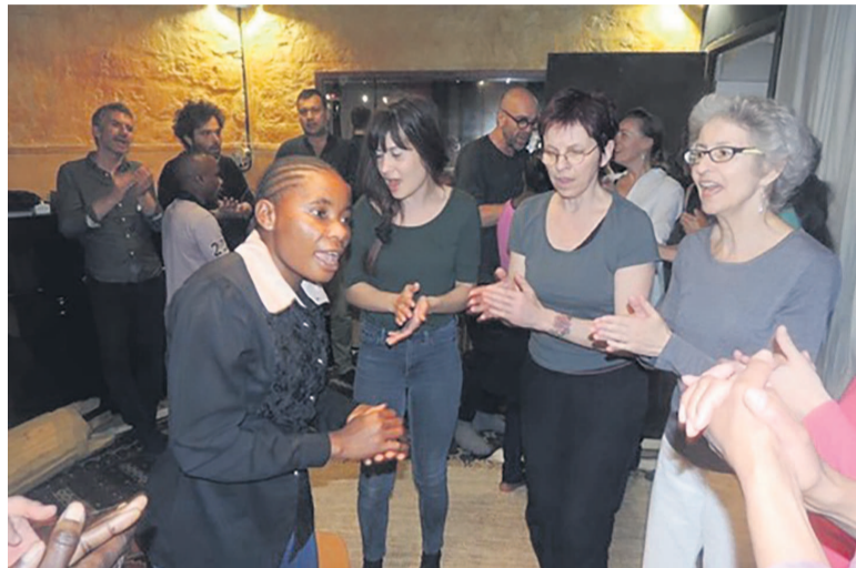
Aussitôt arrivé en France, le groupe Ndima Aka entame sa tournée par un stage de chansons polyphoniques à Paris.

Aussitôt arrivé à Paris, le groupe au grand complet a lancé, depuis dimanche 23 avril, sa nouvelle tournée de près d'un mois, qui le mènera de France en Suisse.