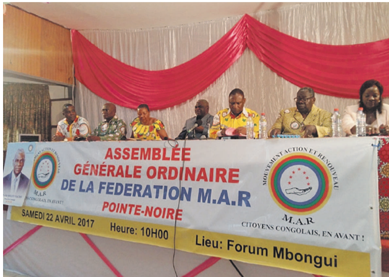
Tribune officielle de la réunion

Ouvrant les travaux, le représentant du président national du MAR a salué la tenue de cette assemblée. Il a aussi noté avec satisfaction la dextérité et le sérieux avec lesquels celle-ci a été préparée, il a invité l'ensemble des participants à examiner avec toute l'attention voulue les documents soumis à l'approbation de ces derniers. L'orateur a rappelé aux militants de ce parti la phrase de Jean Baptiste Tati Loutard, président fondateur de leur parti, à savoir : « Le MAR n'a pas été créé pour être mais