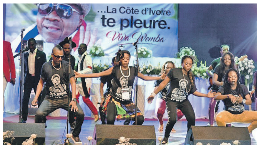
Viva-la-Musica au Femua