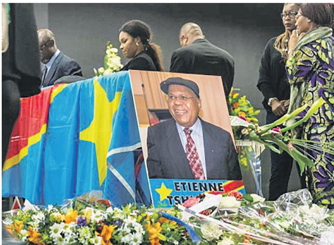
La dépouille d'Étienne Tshisekedi exposée lors des obsèques à Bruxelles