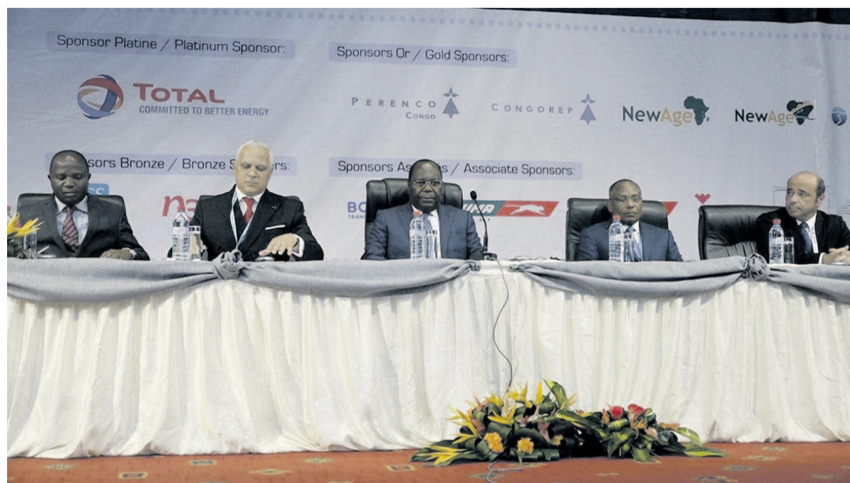
Le présidium des travaux

Les opportunités d'affaires qu'offre le secteur pétrolier au Congo sont mises en exergue au profit des potentiels investisseurs à travers la troisième édition de la conférence internationale et exposition sur les hydrocarbures au Congo (CIEHC), ouverte le 24 avril à Brazzaville par le Premier ministre, Clément Mouamba.