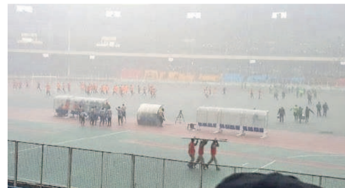
Grosse pluie lors du match V.Club - Renaissance du Congo le 23 avril 2017

A Mbuji-Mayi également, la météo n'a pas été propice, une grosse averse a rendu le terrain