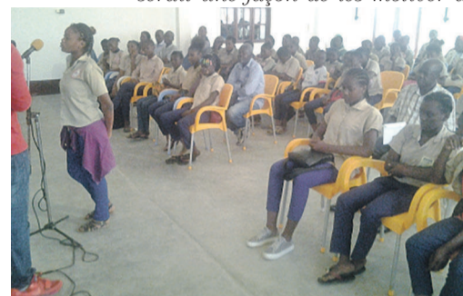
: Une élève épelant un mot

munications rapides, de textos et de courriels. À l'heure des réseaux sociaux où l'orthographe perd son importance, il est donc nécessaire de promouvoir la pratique de la bonne orthographe chez nos jeunes. Le concours d'épellation serait une façon de les motiver à