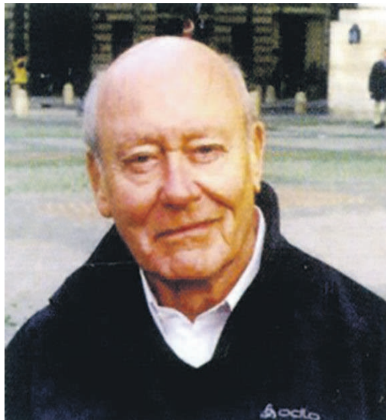
Philippe Chesnay (DR)

Mais c'est aussi et surtout l'histoire d'un enfant de six ans, amoureux d'une locomotive, et