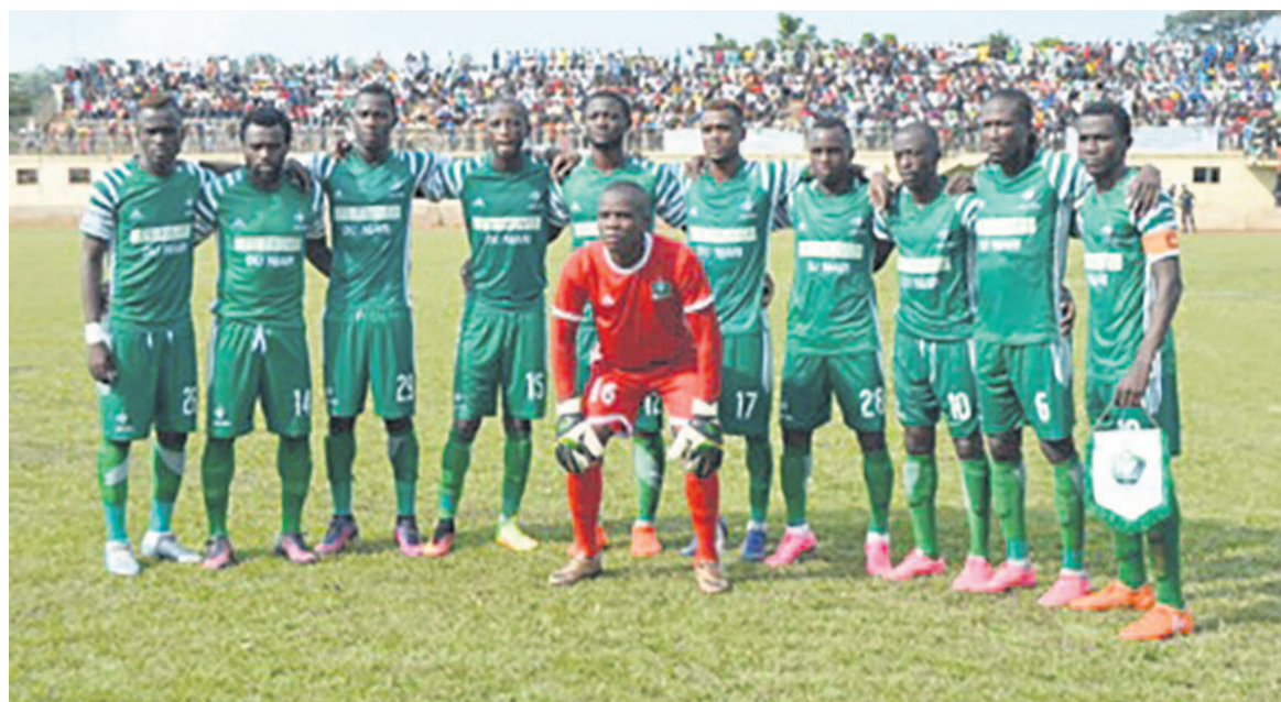
L'AC Léopards de Dolisie enchaîne

L'Athlétic club Léopards a battu Tongo football club le mercredi (2-0) en match en retard de la 6 e journée pour revenir à trois points du leader, le Club athlétique renaissance aiglon (Cara).