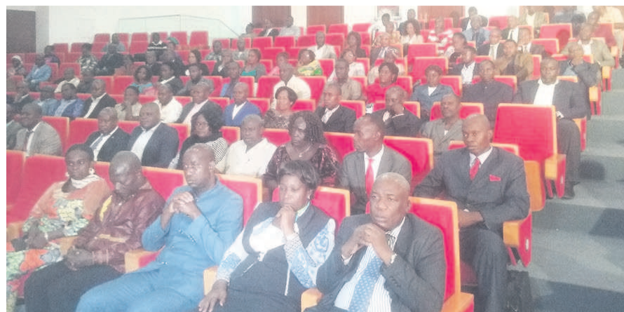
Les participants au séminaire atelier