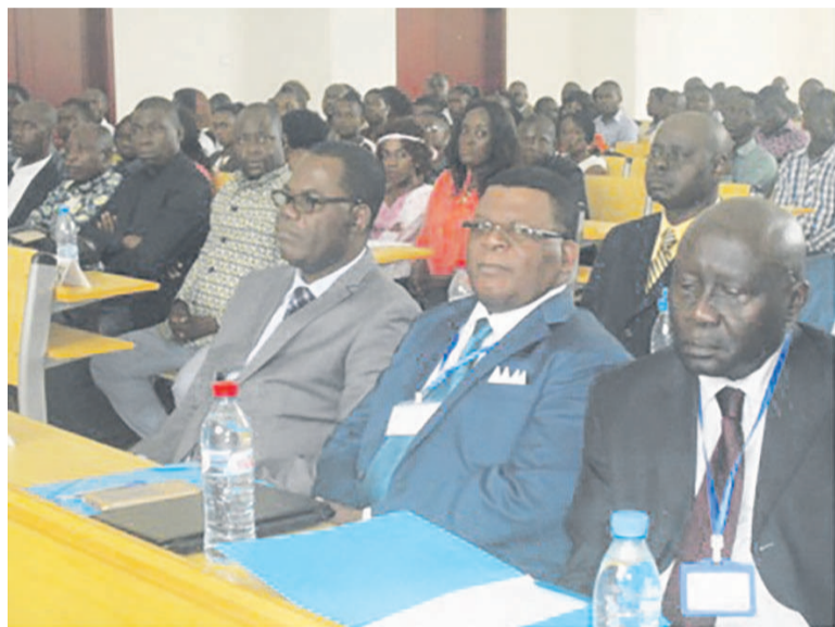
Les participants à la semaine scientifique