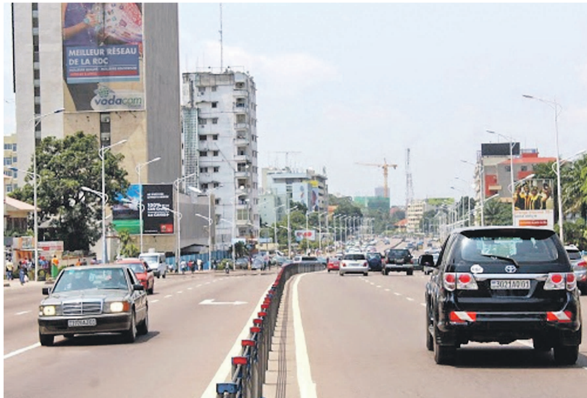
Le centre ville de Kinshasa

Depuis le 25 avril, date du lancement officiel de la campagne de contrôle des véhicules en circulation à Kinshasa, quelques perturbations sont constatées au niveau du trafic qui n'est plus intense dans la ville. Cette mesure vise essentiellement les taxis communément appelés « Ketches », (particulièrement ceux à volant à droite) qui, pour la plupart, ne répondent pas aux normes de la circulation routière en plus du fait que leurs propriétaires ne se conforment pas aux exigences légales en la matière. À en croire le ministre provincial chargé des Transports, la décision est plus que salutaire pour les usagers de la route, victimes de plusieurs abus causés par ces véhicules à la base de nombreux accidents de circulation. Bien plus, ces voitures sont, pour certains, utilisées par des inciviques qui les exploitent aux fins d'enlèvements, de vols et d'autres abus de nature à insécuriser davantage les populations. C'est justement pour mettre les Kinois à l'abri de ces tares qui assombrissent l'image des conducteurs de ces types de