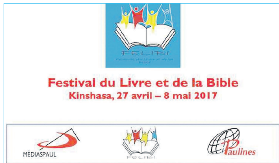
Le logo du Felibi

réalisé mercredi en fin de matinée à la salle Brel du Centre Wallonie-Bruxelles avec la presse, c'est la promotion de la lecture comme objectif primordial du Felibi. D'où l'accent mis sur l'exposition et la vente de livres considérées comme la priorité et le cœur du Felibi. Ce qui explique la visite guidée des stands des éditeurs et librairies exposants prévue à l'intention des élèves au lendemain de l'ouverture. Elle est censée être leur premier pôle d'attraction d'autant plus qu'il y sera question de découvrir « Comment un livre naît et vit », ainsi que l'indique le programme et l'a souligné le père Roberto. Et de l'expliquer de la sorte : « L'on va commencer assez tôt le matin pour accueillir les élèves des écoles de la ville. D'autres activités sont prévues pour rendre le festival plus vivant. Elles se