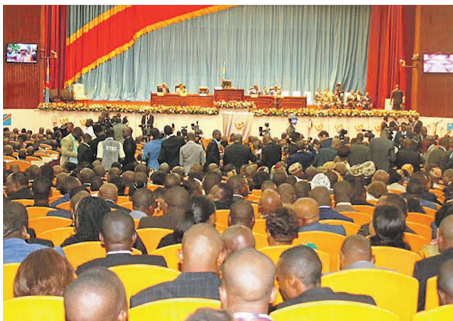
Vue de la salle des congrès du Palais du peuple

La signature proprement dite des documents d'arrangement particulier a été précédée par des discussions préliminaires entre