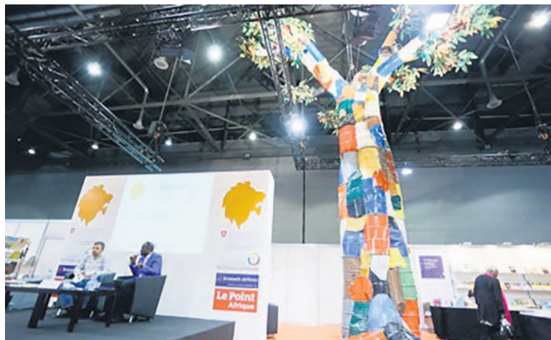
Salon du livre africain de Genève

À l'heure où Conakry célèbre les 72 h du livre, Genève entame sa 31 ème édition du Salon du livre et de la presse en célébrant à la fois sa place de choix sur la scène du livre francophone internationale et l'importance de ses liens avec le monde des médias.