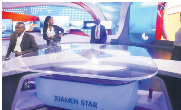
Une télévision à Xiamen

Face aux avancées atteintes par le pays sur le plan des nouveaux médias, la République populaire de Chine n'entend pas laisser le continent africain en marge de cette mutation.