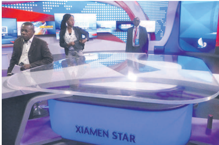
Une télévision à Xiamen (adiac)

En effet, les séminaristes ont noté que la majorité des médias installés à Beijing et à Xiamen, où ils ont visité, possèdent en leur sein aussi bien des médias classiques ou traditionnels que des nouveaux médias. Quelques journalistes chinois abordés à ce sujet affirment que ce doublage obéit à deux exigences, à savoir : la diversification des activités médiatiques et la prévention contre le déphasage ou la perte de l'audimat.