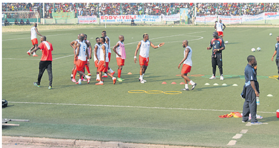
Les Léopards à l'entraînement

Le pays des Léopards occupe la 41e position au classement Fifa publié le jeudi 4 mai 2017 au siège de l'instance mondiale du football à Zurich en Suisse, place occupée lors du classement-Fifa précédent. Et la RDC se retrouve au top 5 sur le continent, alors que le Sénégal est en pole position, devant le Cameroun champion d'Afrique des nations en titre, le Burkina Faso, demi-finaliste et le Nigeria qui revient au premier plan du football après son absence à la CAN 2017, mais alignant des performances aux éliminatoires de la Coupe du monde. L'on rappelle que la RDC joue dans quelques mois contre la Tunisie en quatrième journée des éliminatoires de Mondial 2018.