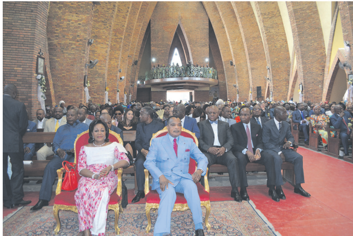
Le couple présidentiel

restons interpellés par cette question lancinante, qui devait retentir au fond de nos cœurs », a martelé l'homme de Dieu. « Au soir de notre vie, nous serons jugés sur l'amour. La question de l'amour dans la vie de la société ne doit pas être supplémentaire ou subsi-