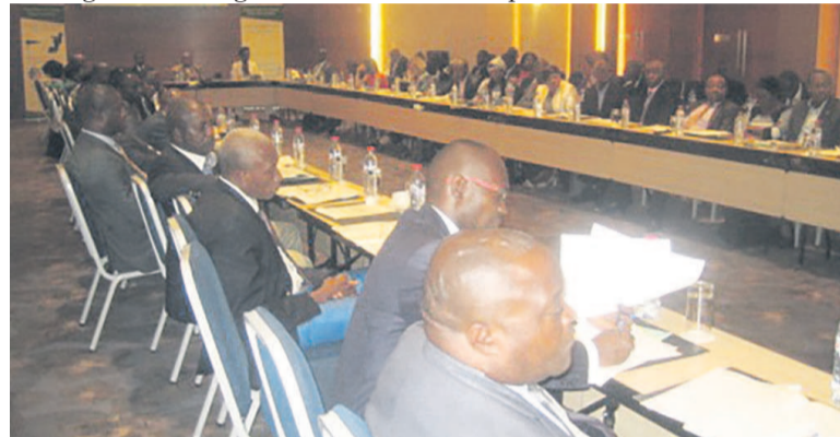
Les parties prenantes lors de la présentation du rapport de la Banque mondiale

Avec l'entrée en production en mars 2017 du site de Moho Nord, la production pétrolière du Congo va atteindre 350.000 barils par jour ; de même que les activités de la compagnie italienne, ENI, qui a commencé celles liées à l'exploitation de nouveaux gisements de gaz naturel.