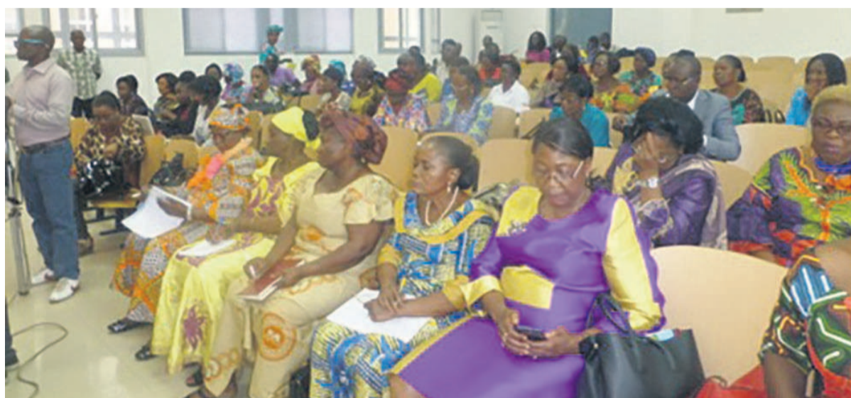
Une vue des femmes politiques congolaises

femmes politiques pendant et après le scrutin. Pendant le scrutin, la militante engagée doit sensibiliser la population au déroulement du vote. Les femmes affectées dans les bureaux de vote devraient être attentives et avoir des connaissances sur le déroulement du scrutin. Après le scrutin, les femmes doivent s'abstenir de propager des nouvelles qui perturbent la paix sociale ; sachant que les élections sont souvent source de conflits en Afrique, surtout. Elles doivent, en tant que mères, soutenir des démarches administratives orientées vers le recours aux voies lé-