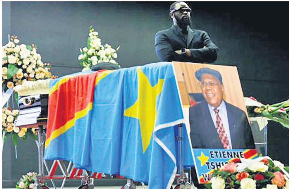
La dépouille d'Étienne Tshisekedi