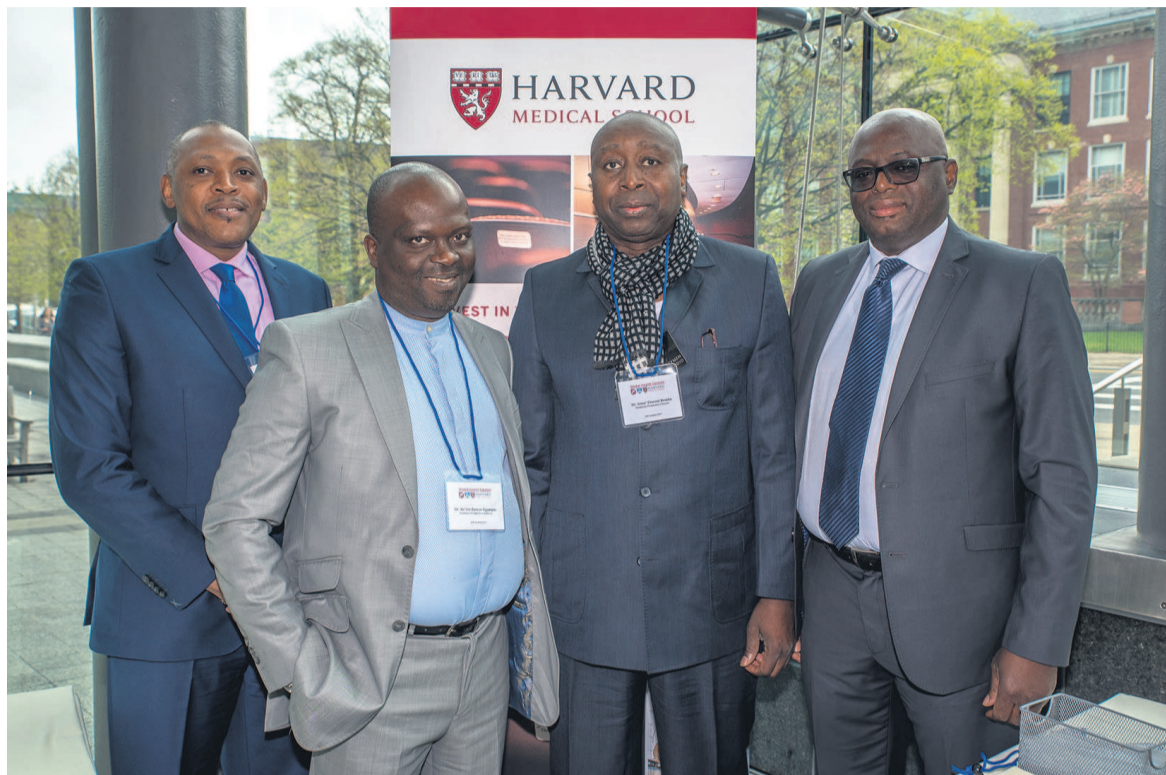
Les membres de la délégation de la FPA après le sommet ; crédit photo DRL

Sur invitation de Global Health Catalyst, une institution de Harvard Medical School, la plus prestigieuse école de médecine des Etats-Unis, la Fondation perspectives d'avenir (FPA) a participé au Sommet mondial de la santé, tenu du 28 au 30 avril dernier, à Boston