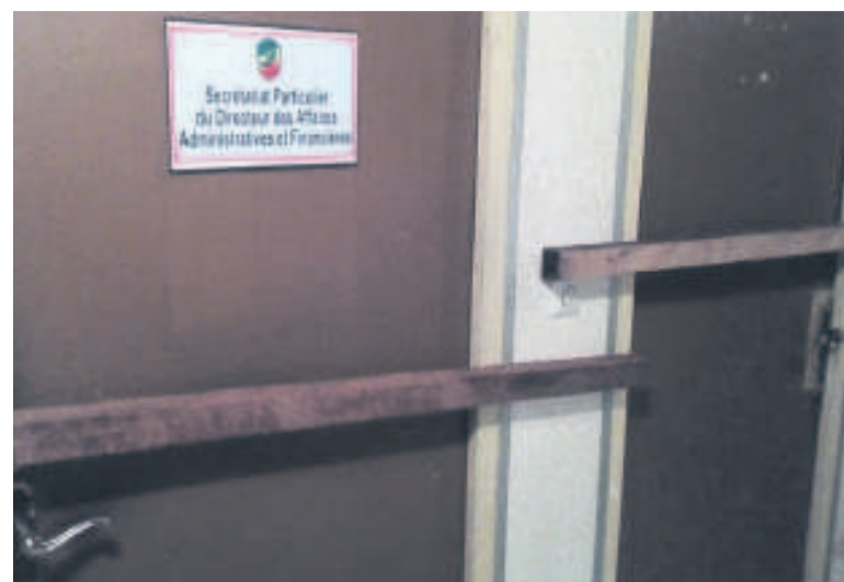
Des portes barricadées

S'agissant de la restitution de la Redevance informatique (RDI), les syndicats accusent les autorités compétentes de leur mener en bateau. « Considérant que la redevance informatique est un acquis pour l'administration des douanes conformément à la loi des finances de 2013, et le fait