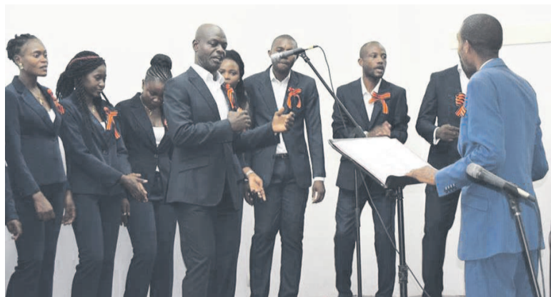
Les choristes de Chœur Sanctus

Chœur Sanctus a interprété cinq chansons au cours de ce concert dont une qui parle de la victoire : Dien pabiedy et une autre de la souffrance. Les autres chansons : S nami Bog ; Lacrymosa ; O fortuna ; Kumbaya ; O solo moi ; Let de weak ; La donna mobile ; Hlonofatsa ; Libiamo ; Shosholoza.