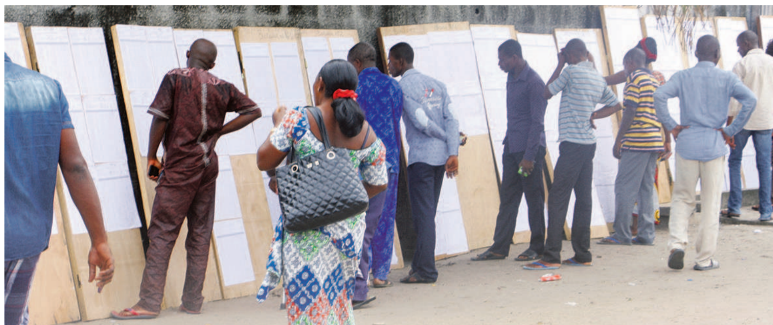
La révision des listes électorales a démarré le 10 mai