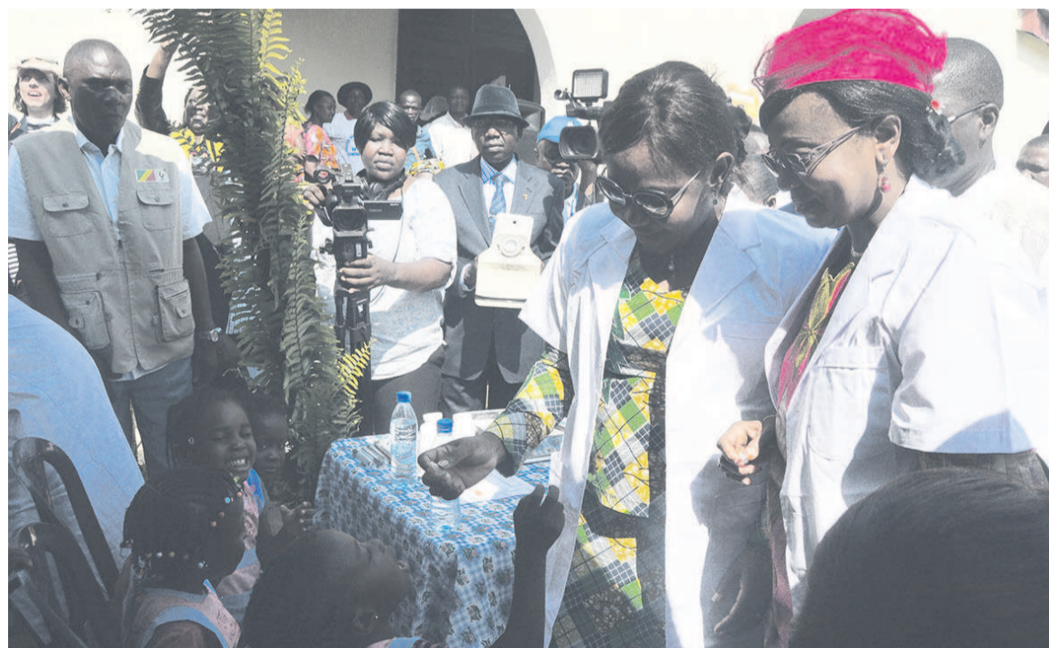
La ministre de la Santé et la représentante de l'OMS/Congo lançant la vaccination

« Des progrès ont été faits dans la lutte contre la poliomyélite. Il est mieux de poursuivre les efforts d'immunisation de nos enfants contre cette maladie handicapante, parfois mortelle », a déclaré la ministre de la Santé et de la Population, Jacqueline Lydia Mikolo, lors du lancement officiel de la campagne contre ladite pathologie. Les vaccinateurs seront déployés sur toute l'étendue du territoire national pour qu'aucun enfant ne soit oublié. « Dans les zones d'accès difficile, les équipes mobiles iront à moto, par véhicule et par pirogues motorisées dans les axes fluviaux », a expliqué la ministre. Selon elle, le gouvernement fait de son mieux