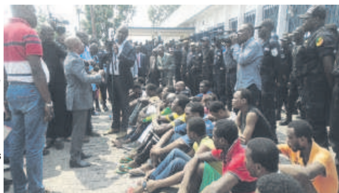
André Gakala Oko présentant un échantillon de « bébés noirs »

Le procureur de la République près le Tribunal de grande instance de Brazzaville, André Gakala Oko, a lancé le 11 mai une opération spéciale de police dénommée « patrouille judiciaire » destinée à traquer et interpellé tous les criminels dits « bébés noirs », qui sévissent à Brazzaville afin qu'ils répondent sévèrement de leurs actes ignobles.