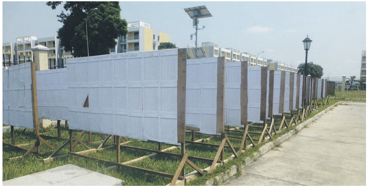
Une vue des listes électorales (Adiac)

L'opération de révision extraordinaire des listes électorales a commencé le 10 mai sur l'ensemble du territoire national. À Brazzaville comme à l'intérieur du pays, tous les bureaux d'enrôlement des futurs électeurs sont installés dans les sièges des mairies d'arrondissements et des sous-préfectures.