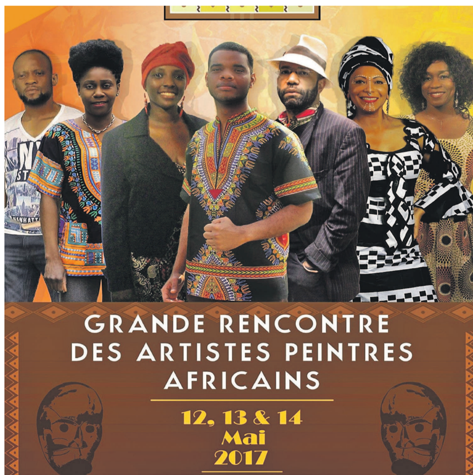
Une affiche de l'événement