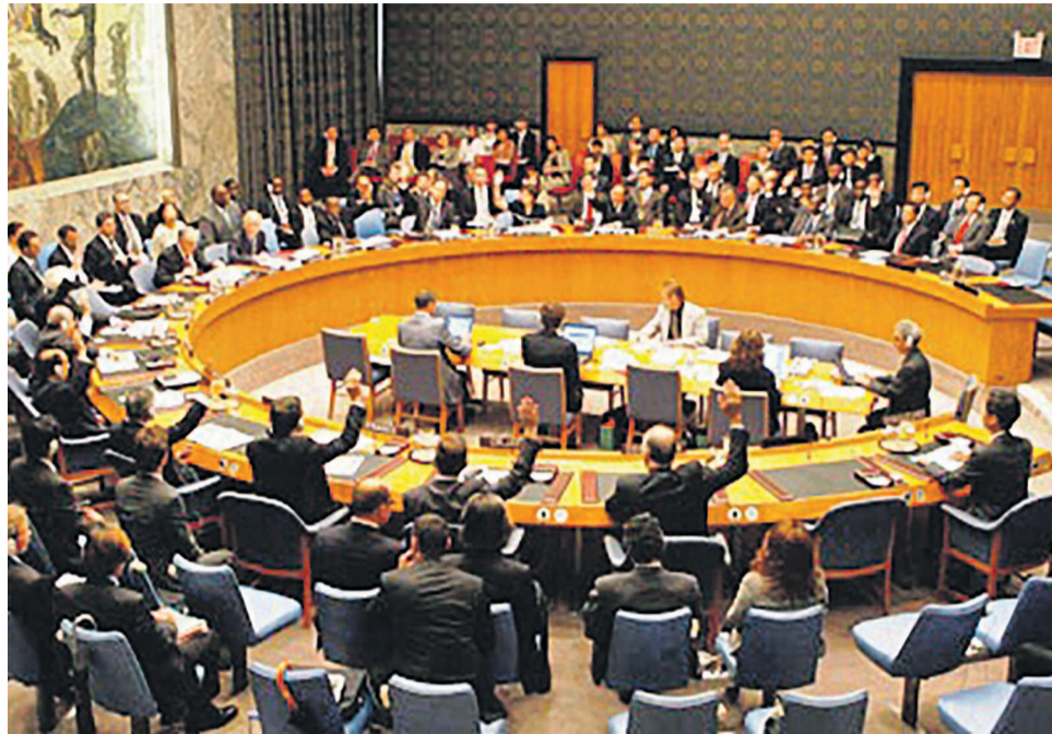
Le Conseil de sécurité de l'Onu

Pour l'Organisation des Nations unies, l'inclusivité n'est toujours pas de mise dans l'actuel gouvernement Tshibala publié le mercredi dernier. Cette donne n'a pas été prise en compte dans la composition de l'équipe gouvernementale, constate l'ONU via le Conseil de sécurité qui s'appuie notamment sur la marginalisation d'une frange de l'opposition congolaise constituée du Rassemblement/aile Félix Tshisekedi et du Front pour le respect de la Constitution. Ces deux plates-formes de l'opposition ne sont pas représentées dans ce gouvernement circonscrit essentiellement autour de la majorité présidentielle, de l'opposition signataire de l'accord du 18 octobre, du Rassemblement de l'opposition (aile Olenghankoy) et de la société civile. Pour l'ONU, ceci constitue une faiblesse qui risque d'handicaper la suite du processus électoral censé aboutir à la tenue des élections d'ici à décembre prochain. C'est dans un communiqué publié au