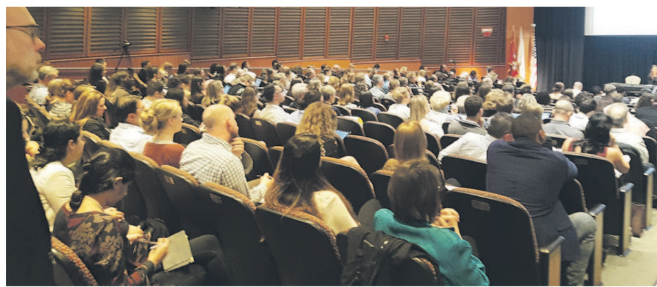
Les participants

La FPA partage son expérience au sommet mondial à Boston