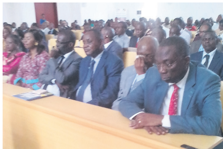
Le présidium

L'année dernière, plus de 240 congolais sont allés en Chine pour suivre les cycles de formation dans les différents secteurs. Avant la fin de cette année, 300 iront en Chine. L'ambassade souhaite une meilleure collaboration