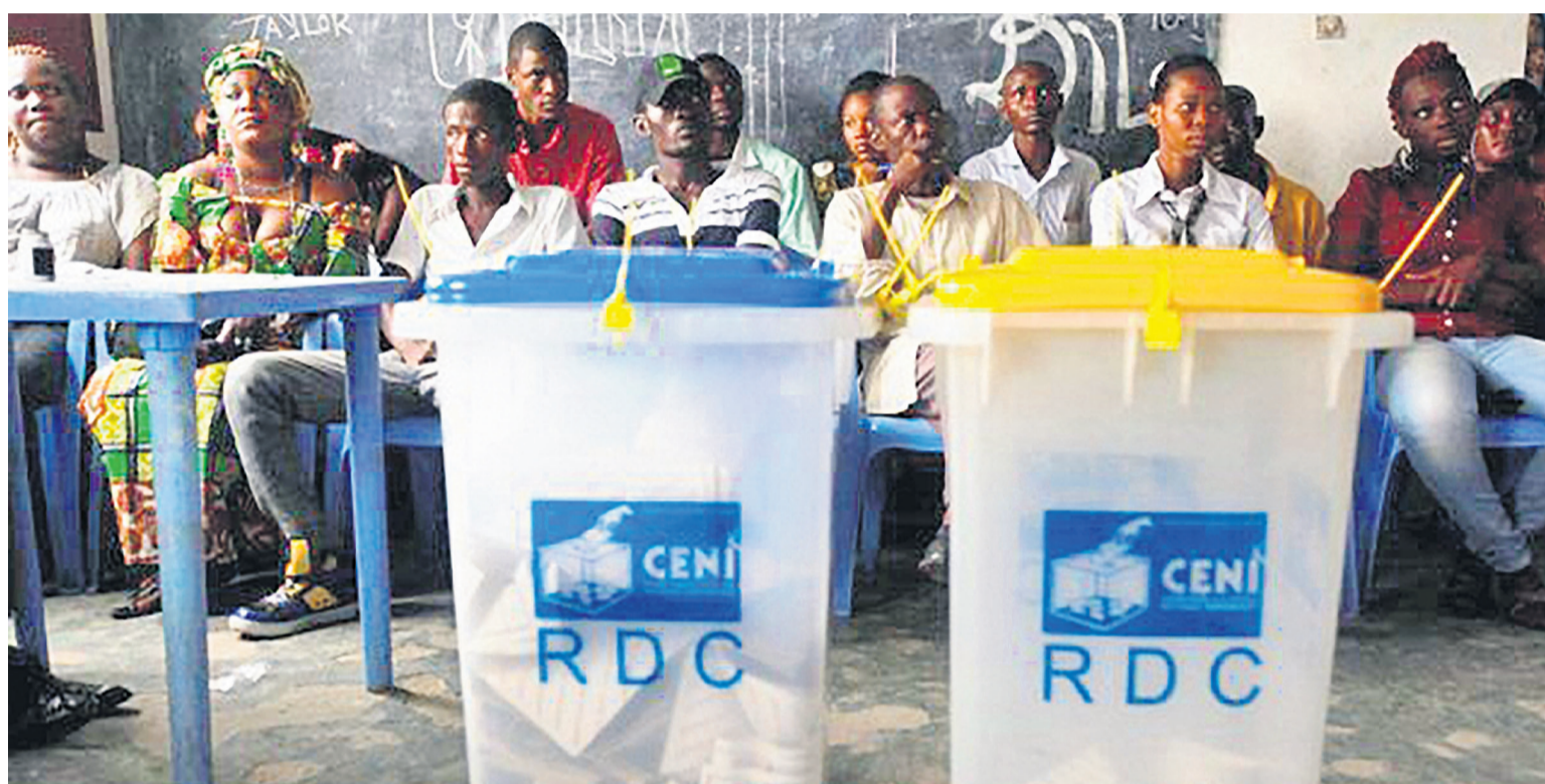
Ambiance dans un bureau de vote à Kinshasa