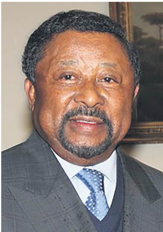
Jean Ping

Dans ce même élan, les femmes du CNR ont symboliquement déposé une bouteille remplie de sable devant l'ambassade de France à Libreville pour attirer l'attention d'Emmanuel Macron « sur les risques d'implosion de la société gabonaise ». Expliquant ce geste issu de la coutume locale, l'un des partisans