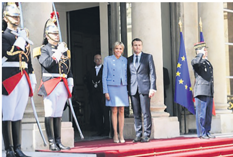
Le couple présidentiel

Pour gouverner et mettre en oeuvre son programme libéral, en économie comme sur les sujets de