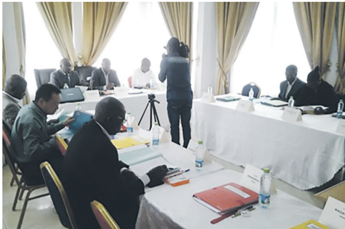
Des techniciens au comité de rédaction de la norme sur le ciment

Un comité technique composé des techniciens du ministère de l'Industrie, ceux en bâtiments et travaux publics, des chercheurs de l'Université Marien-N'Gouabi, les cimentiers ainsi que les associations des consommateurs, s'est réuni le 15 mai à Brazzaville. Objectif : élaborer un document de référence sur le ciment produit en République du Congo.