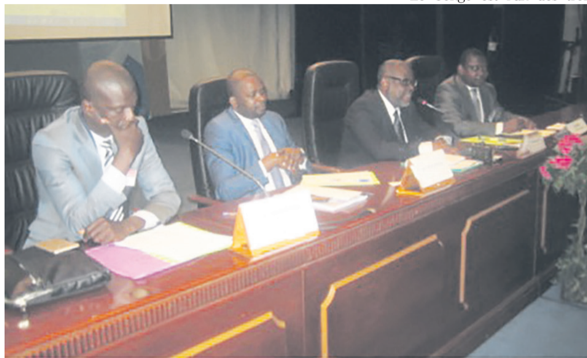
Le présidium de l'atelier

Initié par la Convention des Nations unies pour le commerce et le développement (Cnuced), à travers son groupe spécial sur les produits de base de 2015-2017, cet atelier réunit des experts, représentants du secteur public, acteurs de la société civile, associations des professionnels, universitaires et investisseurs. L'activité s'inscrit dans le cadre du projet de renforcement des capacités dans les secteurs pétrolier et minier dans les économies des pays de la Communauté économique des Etats de l'Afrique centrale (CEEAC). Celui-ci vise l'amélioration des effets structurants du secteur des ressources minières dans cette partie du continent africain. « La difficulté est que nous mettons sur le marché mondial des produits encore bruts, cela ne contribue pas assez à l'économie nationale en termes de création d'emplois et de richesse, de développement de