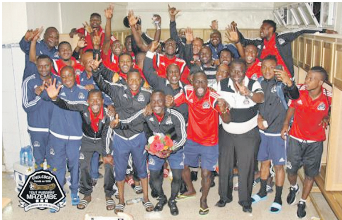
TP Mazembe de Lubumbashi

Dominateur dans le jeu, le TP Mazembe a également été dominateur au tableau d'affichage, le dimanche 14 mai 2017 dans son stade de la commune de Kamalondo à Lubumbashi, aux dépens de la formation du CF Mounana du Gabon.