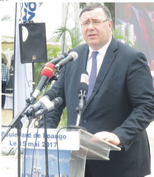
Patrick Pouyanné

« Ce projet n'a été rendu possible que grâce, aux multiples efforts déployés par des hommes et des femmes de toutes les équipes qui ont permis ce succès. Plus