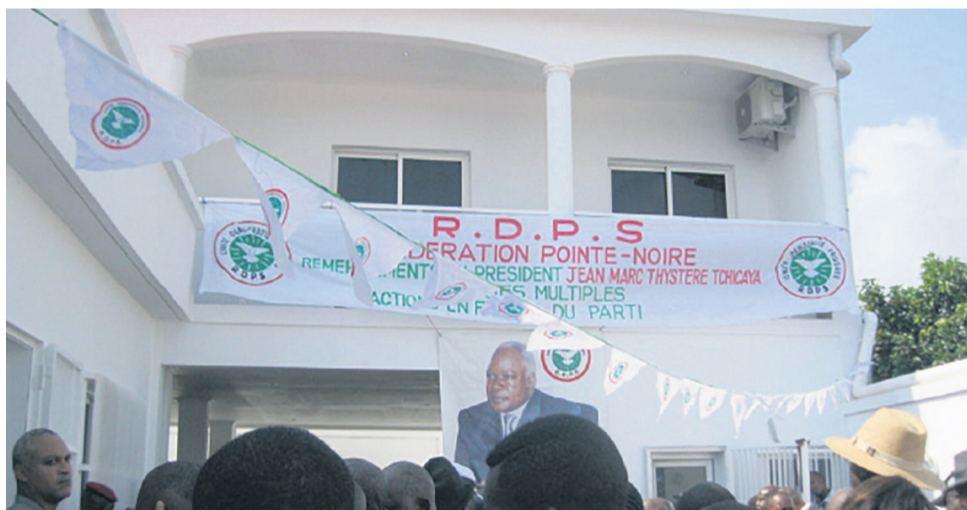
Siège interdépartemental du RDPS

Situé à Mvoumvou, dans le deuxième arrondissement, le nouveau bâtiment abritant le siège du RDPS pour les départements de Pointe-Noire et du Kouilou a été inauguré le 13 mai par Jean-Marc Thystère Tchicaya.