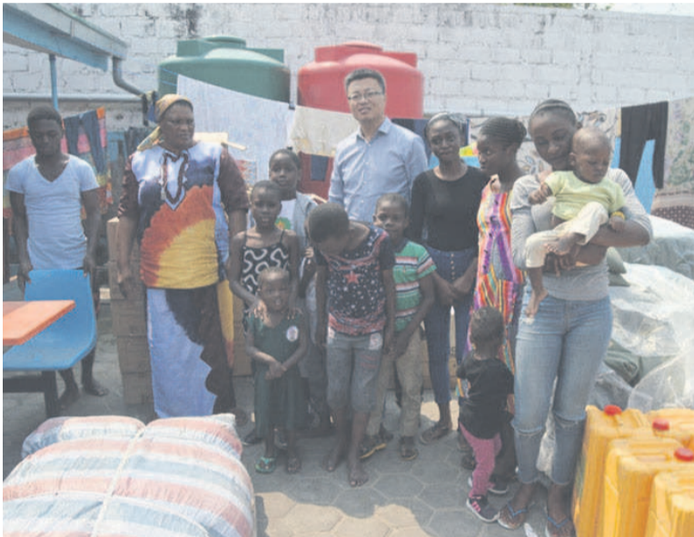
Don de la Société Zhengwei (Adiac)

En rappel, l'orphelinat « Yamba ngai » existe depuis 1987. Son premier site avait été érigé à Goma Tsé-Tsé dans le département du Pool avant d'être délocalisé à Brazzaville. Aujourd'hui, la structure prend soin de plus d'une cinquantaine d'enfants orphelins et ceux qui ne sont pas orphelins mais abandonnés par leurs parents après la naissance. La société chinoise a promis d'y refaire un tour pour une autre assistance.