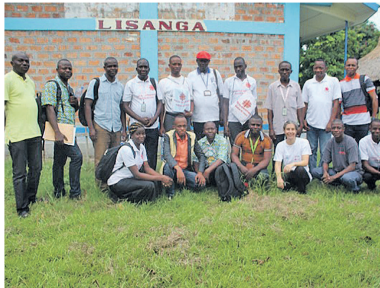
Les membres des comités locaux

ces équipes se sont engagées dans la « sensibilisation massive auprès des communautés de ce qu'est la réduction des risques des catastrophes. L'inondation et l'érosion, indique-t-elle, sont des menaces. Mais l'homme est en mesure, à travers ses capacités et ses ressources, de trouver des solutions pour