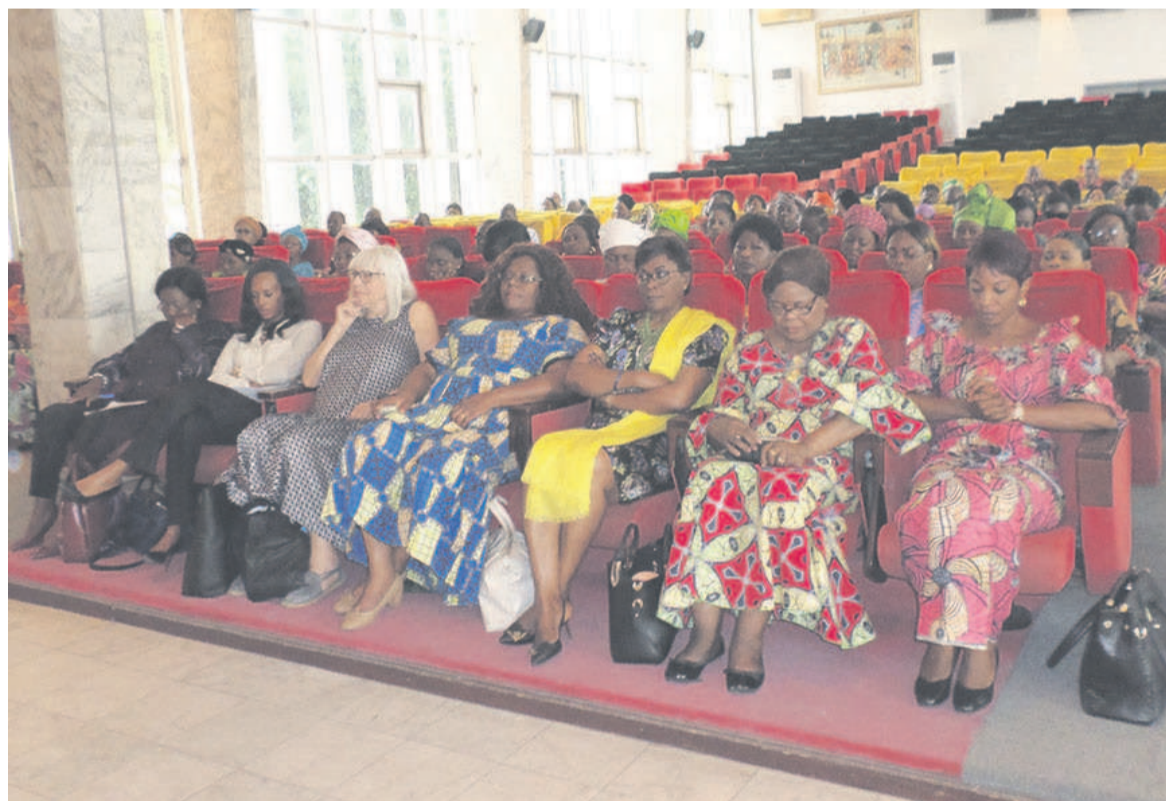
Des participantes

Cette session qui a lieu quelques jours après la tenue de la rencontre de sensibilisation sur l'existence de la politique nationale genre, vise également à renforcer les capacités des femmes à assumer leur participation aux élections du 16 juillet prochain. Actuellement, la représentation des femmes à l'Assemblée nationale n'est que de 7,4% et le Congo occupe la 167ème place dans le classement de l'Union inter parlementaire, ce qui sous-entend que le chemin