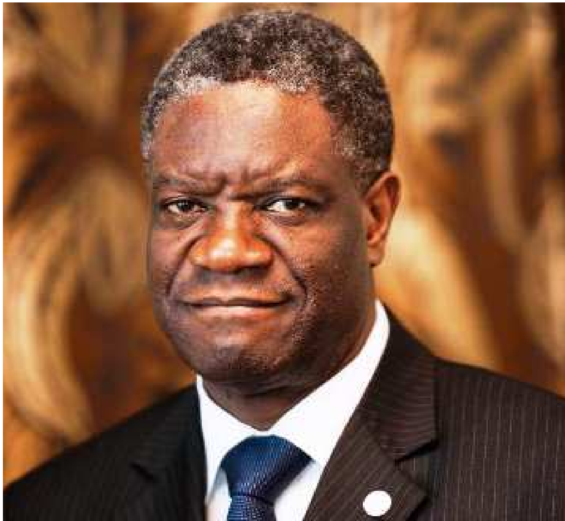
Dr Denis Mukwege

Cette multiplication des foyers de tension l'inquiète. Alors qu'on n'a pas encore fini avec le Kasai qui reste néanmoins une zone trouble malgré l'accalmie précaire de ces dernières heures, Dr Denis Mukwege ne s'explique pas qu'au même moment l'on annonce l'arrestation d'une dizaine de combattants burundais armés dans les montagnes d'Uvira au Sud-Kivu, précisément dans la localité de Lubarika. « Pourquoi sont-ils dans le plateau ? Que font-ils là ? De qui tiennent-ils leur mandat ? Pourquoi les députés de ce coin ne disent rien ? Pourquoi le gouvernement reste dans un silence qui ne dit pas son nom ? Le HCR en sait-il quelque chose ? », s'est-il interrogé. Il a stigmatisé par ailleurs le silence coupable du gouvernement estimant qu'il en serait pour quelque chose dans la dégradation de la situation sécuritaire notamment à Beni, Uvira, Fizi, Katanga ou au Kasai. « (...) Vous allez vous rendre compte qu'il y a toujours des personnes influentes du pouvoir ou très proches du pouvoir qui sont originaires de ces endroits. Tous ces massacres sont-ils des rites pour accéder au pouvoir ou des faits de hasard ? », a-t-il commenté. Sans ambages, il a tiré ses