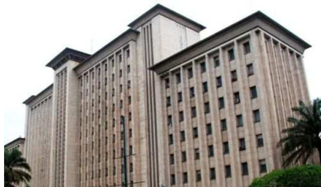
Siège de la Société commerciale des transports et des ports (SCTP)

Lewis Banguka, a eu des entretiens plutôt fructueux avec le Premier ministre, Bruno Tshibala, le 4 juillet. L'enjeu principal des pourparlers en cours concerne les arriérés qui s'accumulent de manière alarmante. La direction générale et l'intersyndicale espèrent une solution rapide