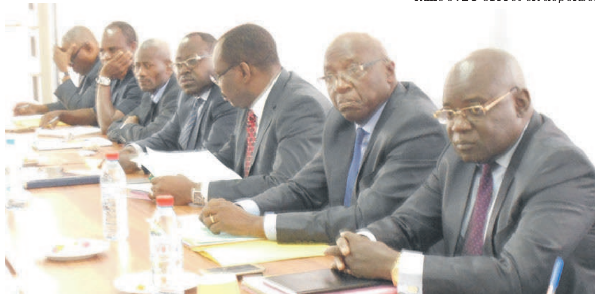
Des membres du comité de direction (Adiac)

A cet effet, le comité de direction a rappelé aux participants que tous les fonds de recherche, dons et legs obtenus des institutions par les enseignants-chercheurs de cet alma-mater doivent être