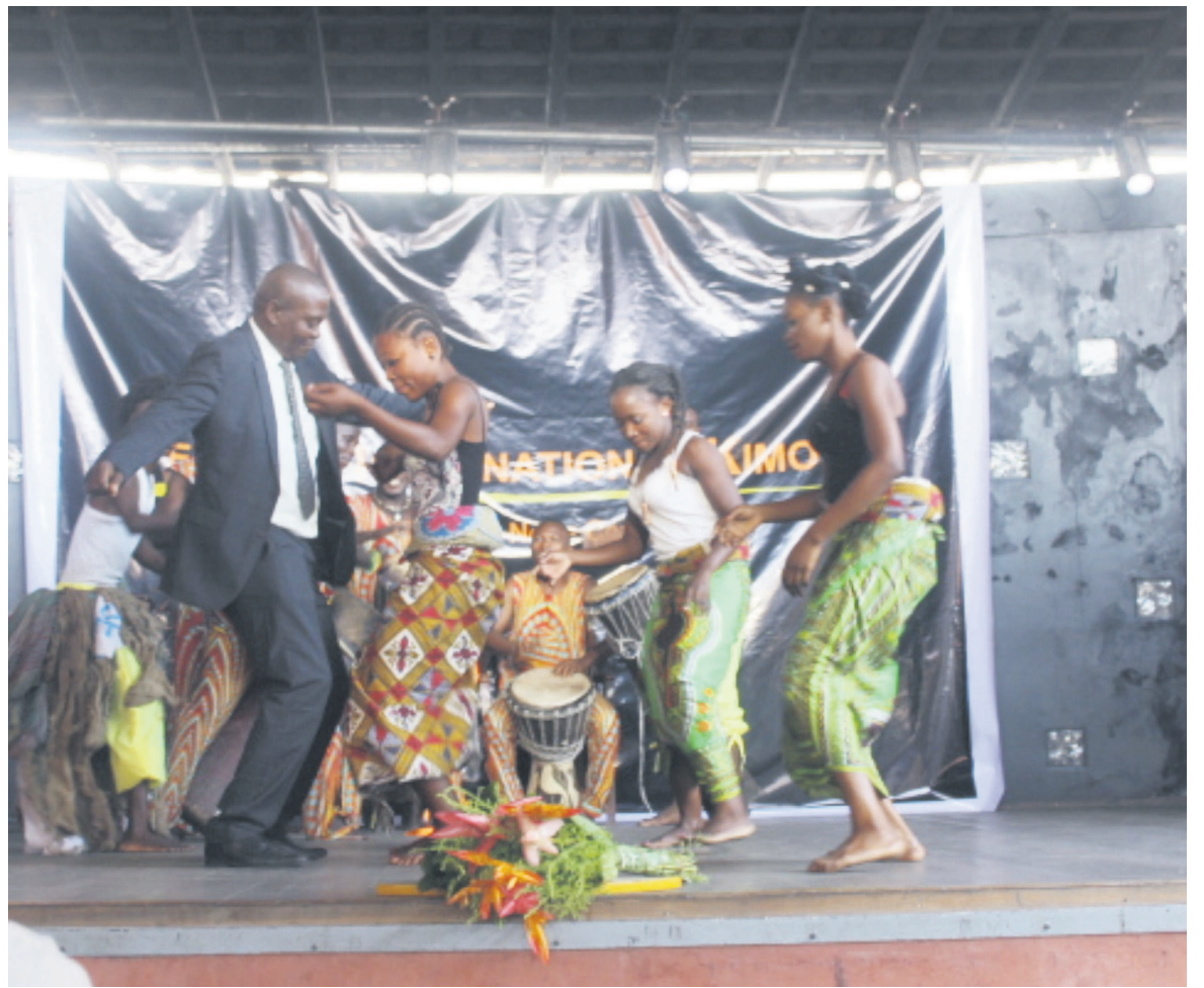
Des artistes sur la scène du festival Kimoko

Ce festival, qui a déjà reçu de grands artistes comme Michel Bohiri et David Nundi, est l'un des rares qui promeut les arts de la scène en Afrique. Il s'est ouvert à l'international dès