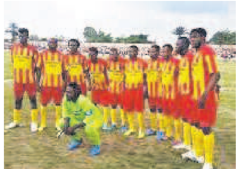
Sa Majesté Sanga Balende de Mbuji-Mayi

La Ligue nationale de football (Linafoot) a publié un calendrier réaménagé pour les derniers matchs du Play-Off. Pour le compte de la 11 e journée du Play-Off, l'OC Muungano accueillera, le 13 juillet, au stade de la Concorde de Bukavu, l'AS V.Club de Kinshasa. Toujours à Bukavu, Muungano recevra, le 16 juillet 2017, le TP Mazembe en match de la 13 e journée et V.Club s'expli-