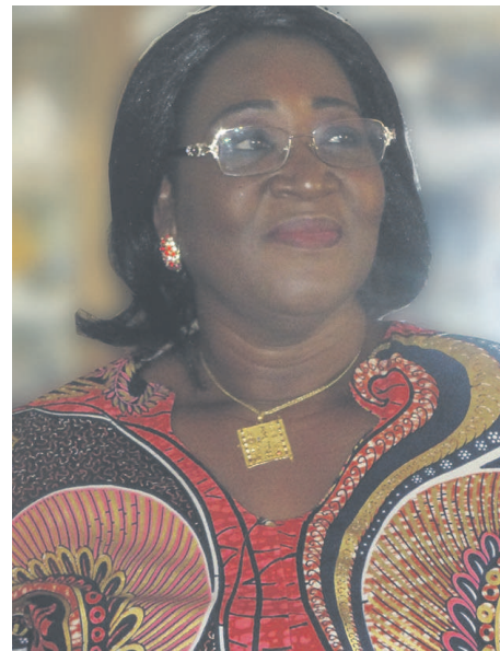
Thérèse N'dri-Yoman

L'ambassadeur de la Côte d'Ivoire au Congo, Mme Thérèse N'dri-Yoman, a visité le 4 juillet à Brazzaville la maison de solidarité de la communauté ivoirienne installée au Congo.