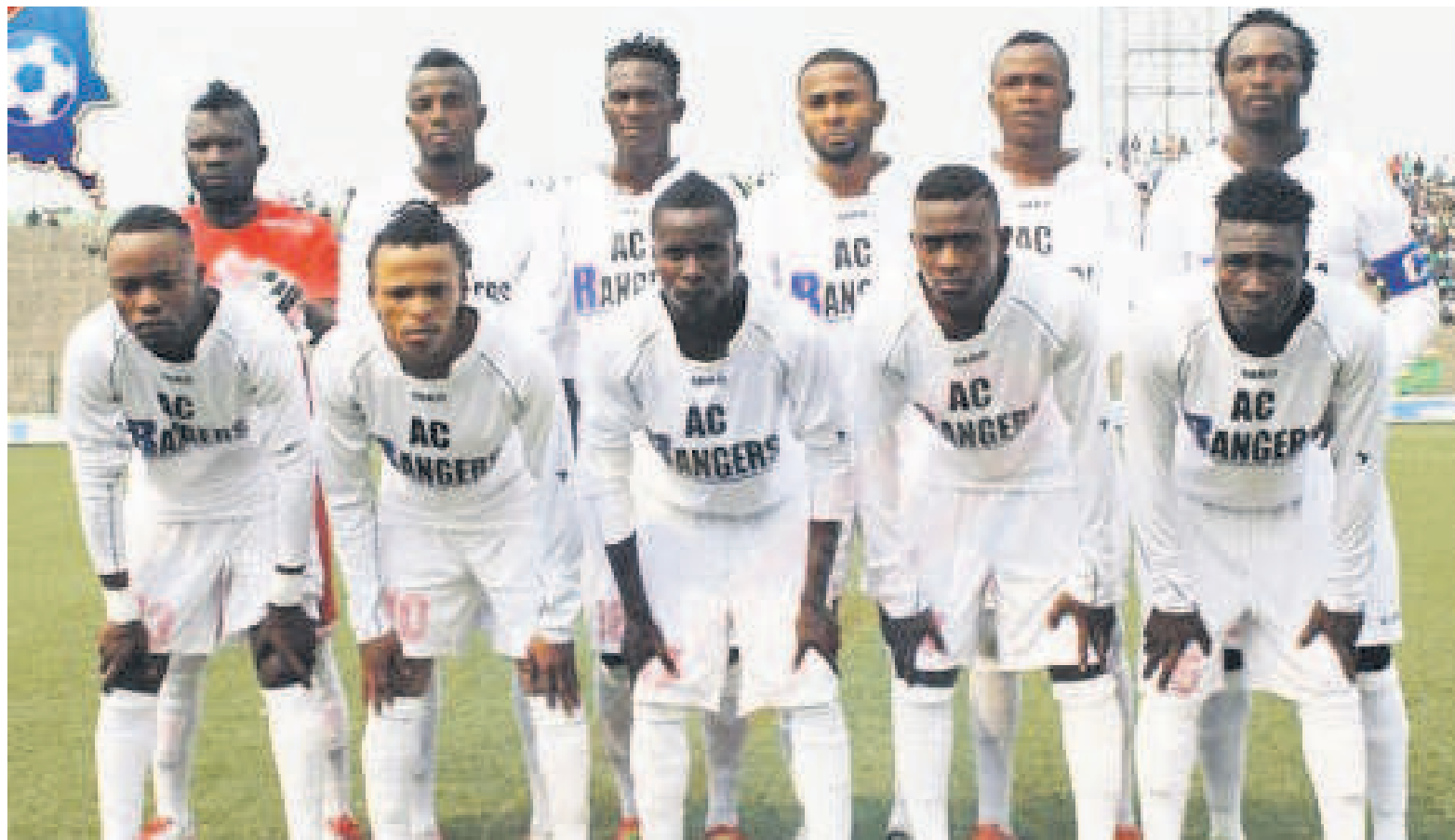
AC Rangers de Kinshasa