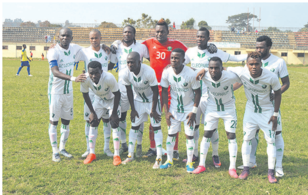
L'AC Léopards de Dolisie disputera la 9e demi-finale d'affilée (Adiac)

L'AC Léopards cadre la première frappe à la 20e minute sur le coup franc de Rozan Varel détourné en corner par le gardien de l'AS Otoho. Deux