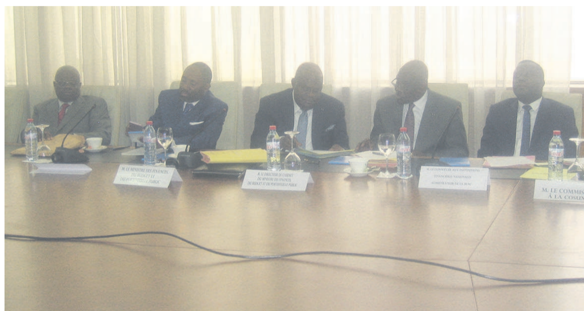
Le présidium