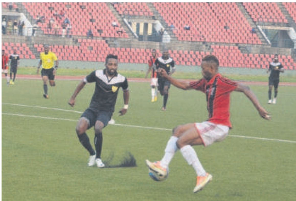
Une phase de jeu du match Cara-La Mancha

Le second match qui a opposé Cara à La Mancha s'est soldé sur un nul d'un but partout. Dès la 14ème minute