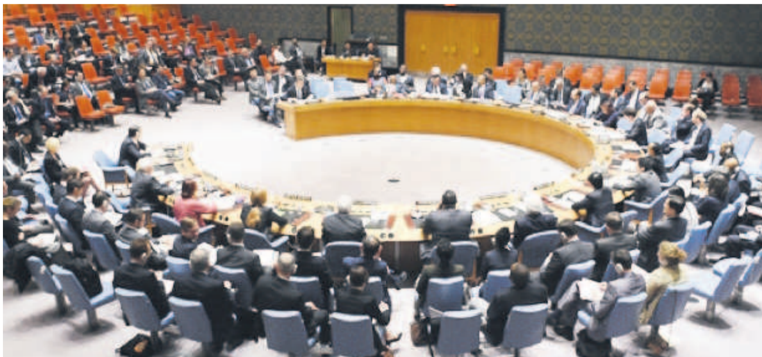
Une réunion du Conseil de sécurité de l'ONU.

Les États-Unis ont menacé, le 11 juillet, la République démocratique du Congo de sanctions si les élections ne se déroulaient pas comme prévu cette année. « Les retards sur les élections ne peuvent pas continuer », a tempêté l'ambassadrice adjointe des États-Unis devant le Conseil de sécurité tout en indiquant que son pays serait prêt à sanctionner tous ceux qui tentent d'entraver la première transition démocratique en RDC.