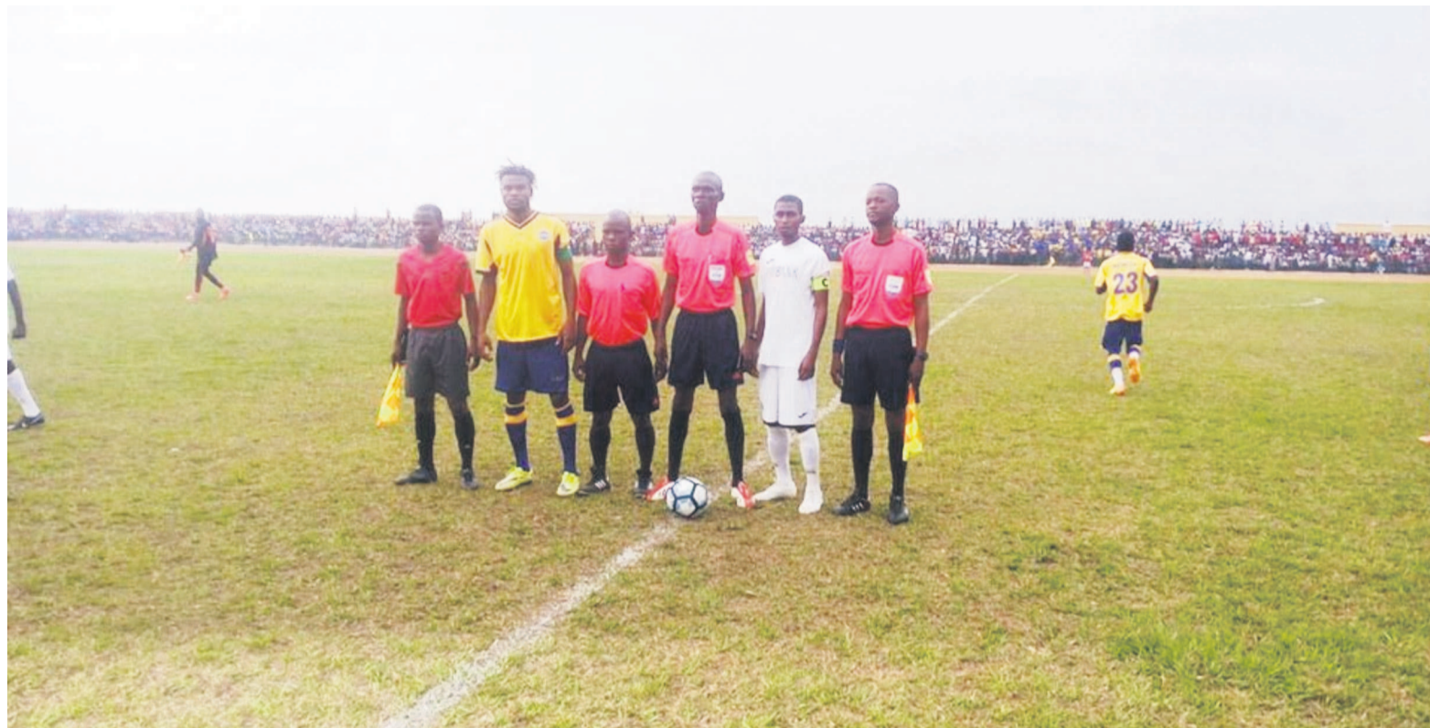
Les capitaines de Lupopo et RCK et le trio arbitral avant le coup d'envoi du match le mardi 11 juillet au stade Joseph-Kabila-Kabange de Kindu