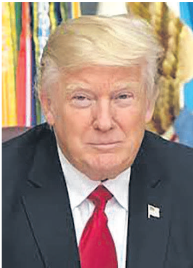
Donald Trump

En janvier dernier, soit dans les derniers jours de sa présidence, Barack Obama avait levé certaines sanctions frappant Khartoum, mais avec une période probatoire de