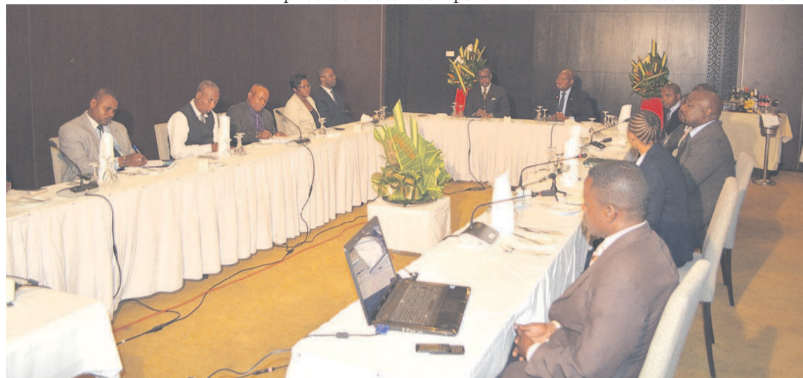
Séance de travail entre les deux parties.

« Nous voulons renforcer ce dont le Congo dispose en ce qui concerne les atouts et investissements ; reconstruire,