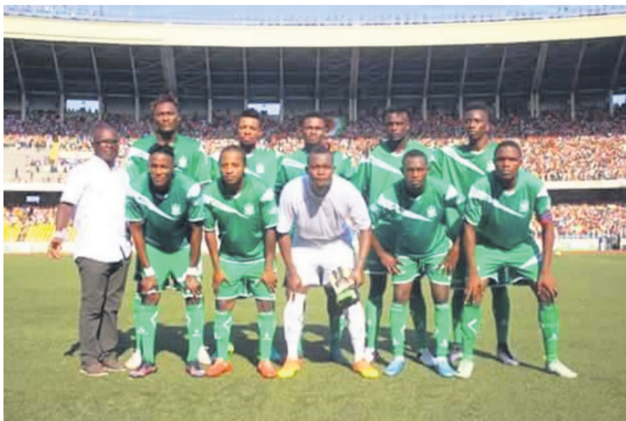
DCMP et V.Club s'affronteront...

C'est donc la veillée d'armes dans les deux camps. Les Immaculés,