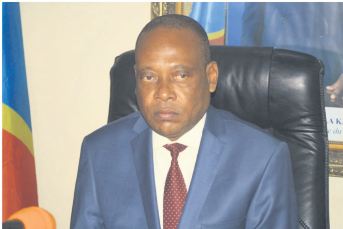
Le ministre Steve Mbikayi

Le ministre promet donc de frapper en fermant ces institutions non viables, notamment en retirant l'agrément à celles qui sont agréées mais qui ne répondent pas aux normes. « Je veux étudier au cas par cas et tout ce qui est non viable sera fermé. Ou alors, comme il y a beaucoup d'options sans infrastructures, on serait contraint de réduire le nombre », a prévenu Steve Mbikayi dans une intervention sur radiokapi.