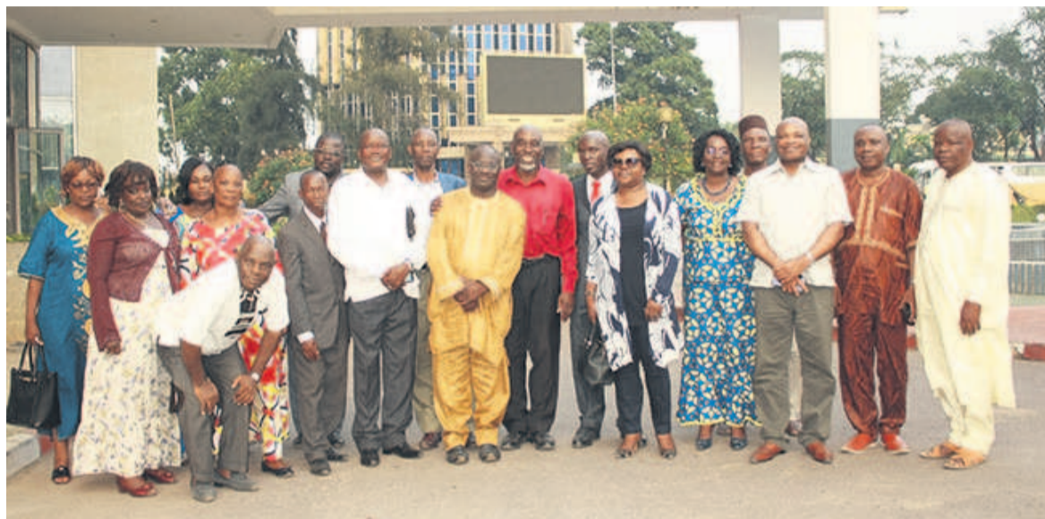
Les participants

dir pour définir concrètement le contour de ce partenariat. Ces interventions des membres du comité d'honneur ont été vivement encouragées par l'équipe dirigeante de Socio-Solidarité.