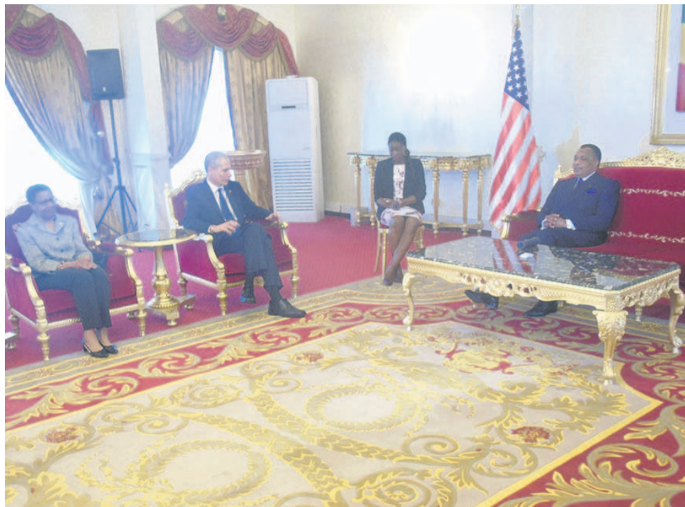
Denis Sassou N'Gusso s'entretenant avec Todd P. Haskell