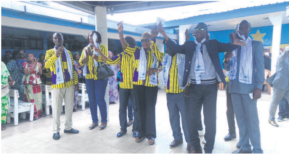
Une vue des colistiers de l'Association Vigilance Plus

Irma Bomboko a ensuite saisi cette occasion pour édifier ces mamans sur les différentes étapes à franchir avant, pendant et après l'acte de vote. Elle leur