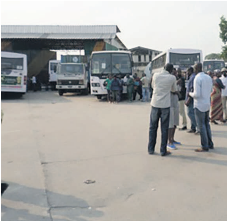
Quelques travailleurs dans la cour de l'entreprise

En attendant l'examen de leur cahier des charges déposé sur la table de la direction générale de l'entreprise, les agents de la Société des transports publics urbains (STPU) ont décidé le 12 juillet de suspendre leur grève décrétée le 26 juin dernier et de reprendre le travail ce 14 juillet.