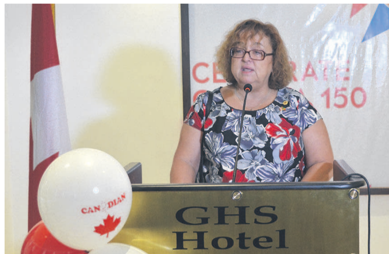
L'ambassadrice du Canada et les invités (Adiac)

tuation est également peu propice pour assurer le climat des affaires, qui permettra d'attirer