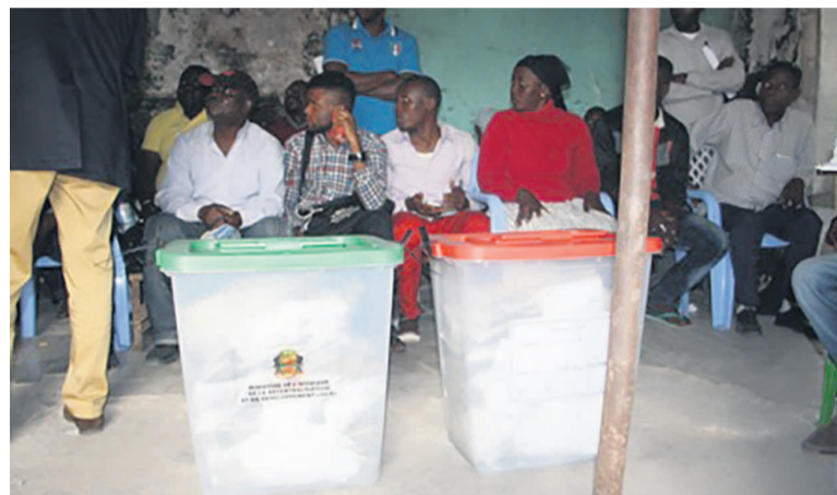
Des urnes quasiment pleines dans plusieurs bureaux de vote

Mais la ronde des centres de vote ne manque pas d'enseignement. Ici, l'on rencontrait des personnels électoraux visiblement dépassés face à des électeurs incapables d'être à la hauteur des exigences du double vote à bulletin unique. « Vous n'avez pas bien fait votre travail de sensibilisation et voilà, personne ne sait comment voter », tempêtait un président de bureau de vote face aux représentants des candidats qui s'agitaient, à l'Institut pédagogique La Boussole, à Makélékélé.