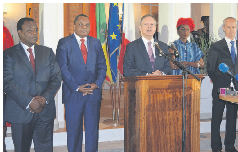
Bertrand Cochery délivrant son message.

Face à la crise financière que traverse le Congo suite à la chute des cours du pétrole, l'ambassadeur de France en République du Congo, Bertrand Cochery, a souhaité que la priorité soit donnée aux dépenses sociales.