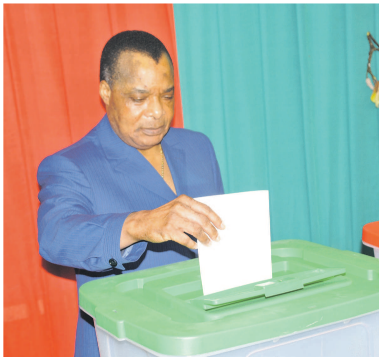
Le chef de l'Etat accomplissant son devoir civique

Le président Denis Sassou N'Guesso a placé son bulletin dans l'urne, le 16 juillet, peu avant midi dans l'un des bureaux de vote installés à la mairie de Ouenzé, le cinquième arrondissement de Brazzaville, dans le cadre des élections législatives et locales. Il a ensuite échangé avec le président de la CNEI (Commission nationale électorale indépendante), Henri Bouka, arrivé sur les lieux pour la circonstance. Une équipe des observateurs de l'Union africaine à la tête de laquelle se trouve l'ancien Premier ministre malien, Django Cissoko, était également de passage à Ouenzé.