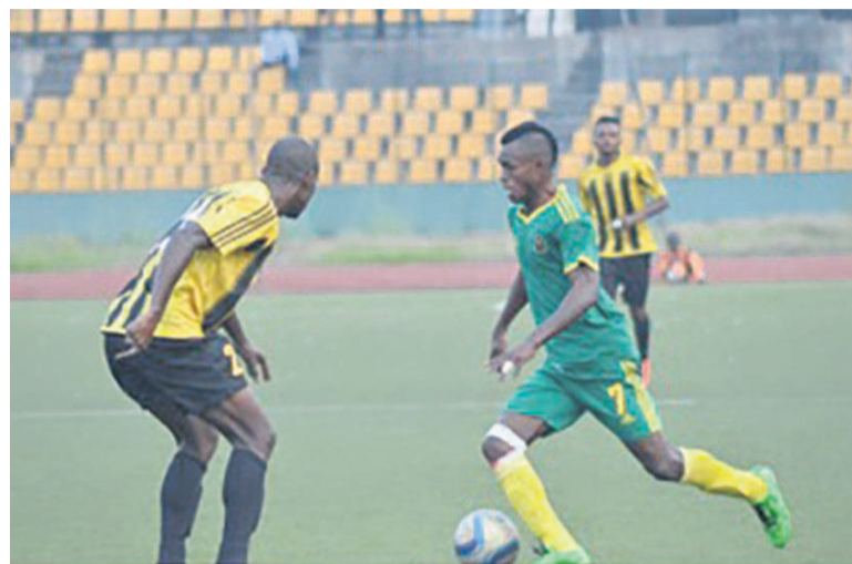
Diables noirs a tenu en échec l'étoile du Congo mais pourrait subir la même sanction que Cara/Adiac

Dans les autres rencontres, l'AC Léopards a validé sa première place en dominant AS Kimbonguela 3-1, confirmant son statut de leader avec 55 points. La Mancha a provisoi-