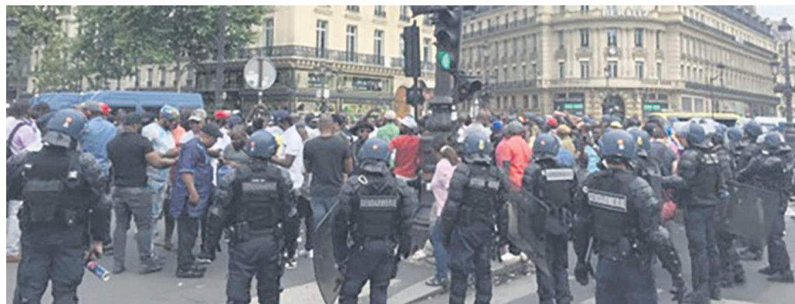
Concert annulé du chanteur Héritier Watanabe à Paris Olympia ici manifestants près de la salle de spectacle

Sur le très chic boulevard de la Madeleine, dans le huitième