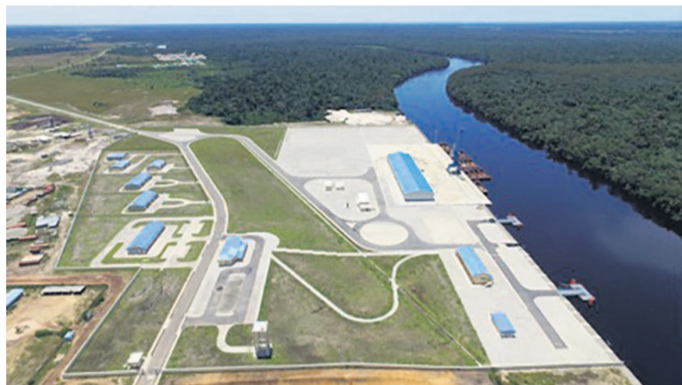
La maquette du nouveau port d'Oyo

Construit sur la rivière Alima, le nouveau débarcadère fluvial de la ville d'Oyo vient renforcer la mobilité des populations et des biens, ainsi que les échanges commerciaux entre le département de la Cuvette et d'autres horizons.