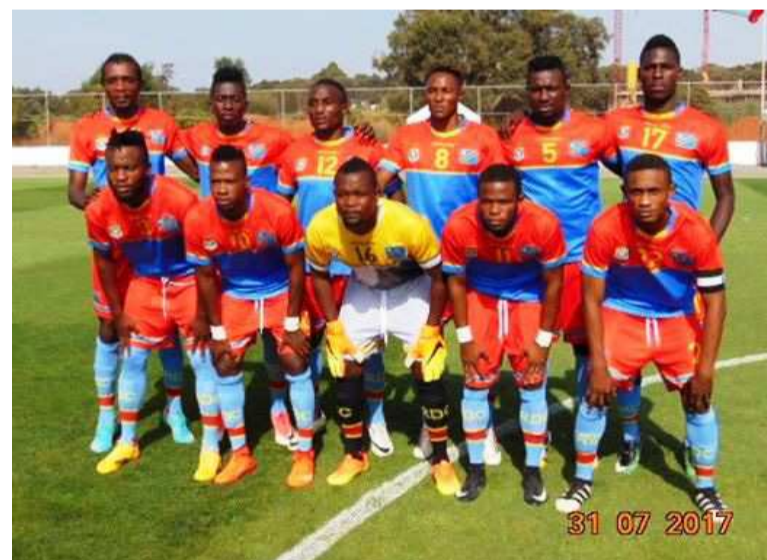
Les Léopards locaux avant le match amical contre les Lions d'Atlas locaux du Maroc à Rabat

En stage de préparation à Rabat au Maroc, les Léopards livrent leur dernier match amical le 4 août, avant d'affronter le 13 août à Brazzaville ou Pointe-Noire, les Diables rouges du Congo, aux éliminatoires de la cinquième édition du (Chan) prévu pour 2018 au Kenya. Vainqueur en 2009 en Côte d'Ivoire de la première édition, la