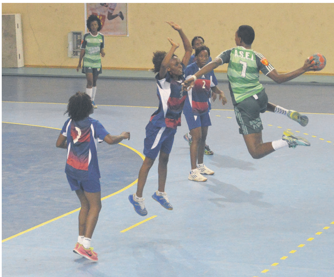
Une offensive d'Asel face à patronage