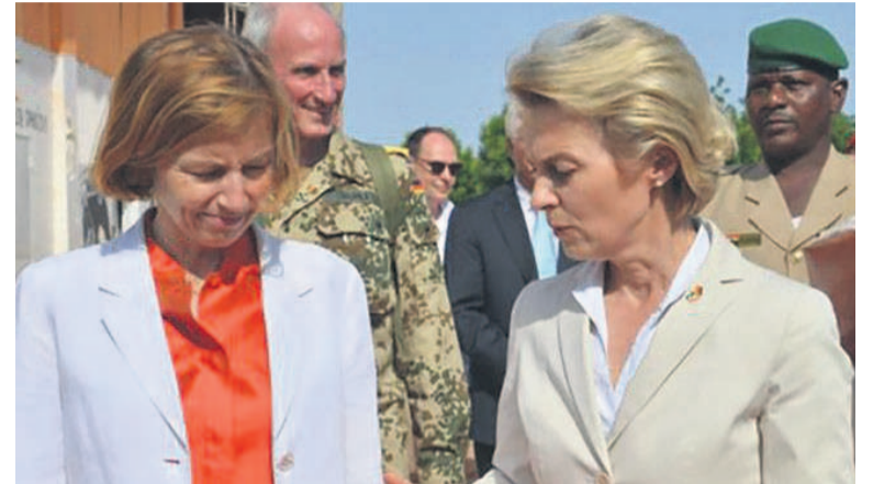
Florence Parly et Ursula von der Leyen

La ministre française des Armées, Florence Parly, et son homologue allemande, Ursula von Leyen, ont assuré mardi à Bamako que leurs pays vont intéresser d'autres pays européennes et des partenaires extérieurs à soutenir la force anti-djihadiste du G5 Sahel (Burkina Faso, Mali, Niger, Mauritanie, Tchad).