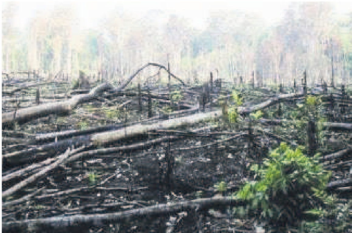
La déforestation en RDC

La déforestation en RDC a été de l'ordre de 0,34 % entre 1990 et 2010. Mais depuis ce taux est passé à 1 % dans ce pays qui est le plus grand du Bassin