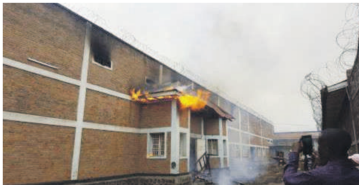
Une vue partielle de la prison de Munzenze

La série d'évasions que connaissent les prisons congolaises continue. Après Kinshasa, Beni, Kasangulu et d'autres centres pénitenciers qui ont vu leurs détenus prendre la tangente à la faveur des attaques ciblées, sans oublier plusieurs cachots des commissariats de police, c'est au tour de la prison de Munzenze de Goma de connaître ce travers. Ici, le tableau est tout autre. Il s'agirait plutôt, à en croire la version officielle, d'une tentative d'évasion qui a mal tourné. Un incendie de grande ampleur s'est, en effet, déclaré le 1er août dans l'enceinte de cette prison dévastant une partie du bâtiment. Très laconique, le porte-parole du gouvernement, Lambert Mende, s'est juste contenté d'expliquer que personne n'a