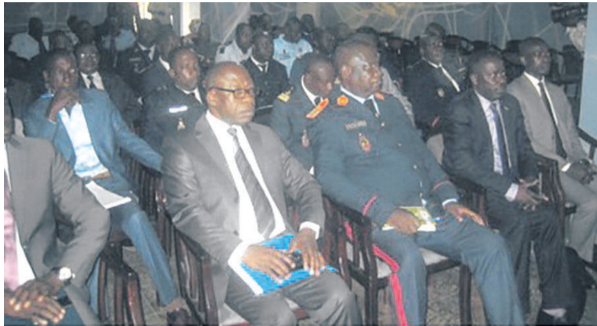
Les participants à la rencontre entre douaniers et opérateurs économiques à Ouesso

Le rôle de la BPC est crucial dans ce processus de modernisation des administrations