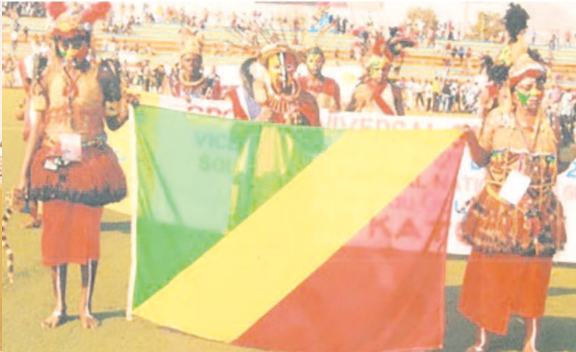
Les membres de la délégation du Congo Brazzaville (adiac)

pris part aux exposés magistraux, travaux en atelier par la mise en place de techniques de création des richesses, la culture traditionnelle et l'emploi de la jeunesse.