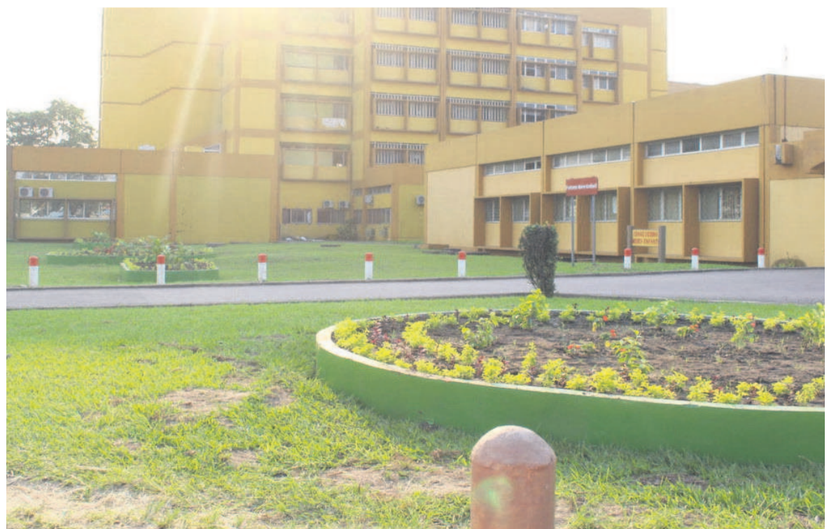
Le Centre hospitalier et universitaire de Brazzaville (CHU-B)

Le personnel du Centre hospitalier et universitaire (CHU) de Brazzaville sous la férule de l'intersyndicale des travailleurs a déclenché le 2 août, une grève générale illimitée, pour revendiquer le paiement de