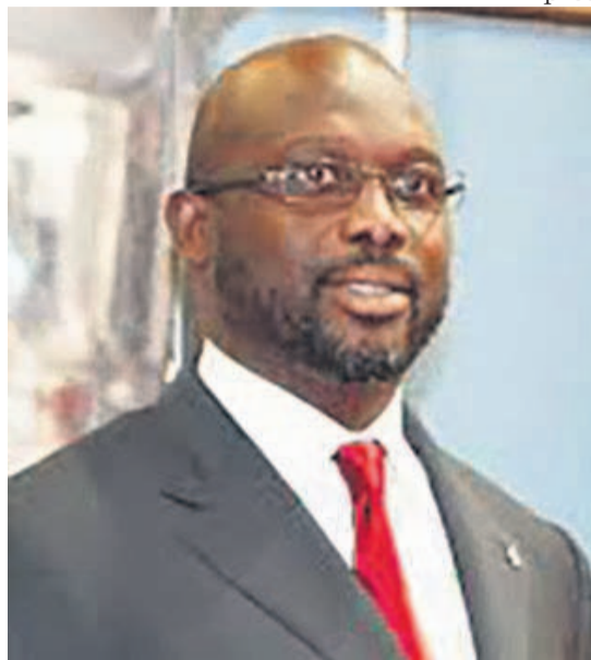
George Weah

L'opposant libérien et ex-star du football international, George Weah, s'est officiellement lancé dans la course à l'élection présidentielle d'octobre 2017, en se présentant comme un candidat de « l'espoir ».