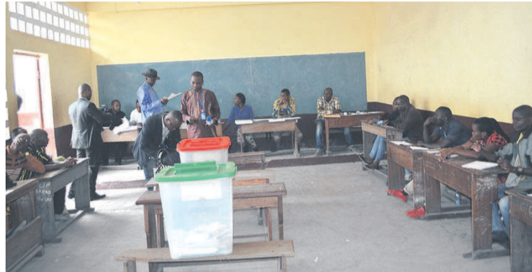
Vue d'un bureau de vote

Comme cela a été décidé précédemment, le secrétaire général du Parti congolais du travail, être entendus afin qu'ils soient sanctionnés, quel que soit leur statut, même ceux