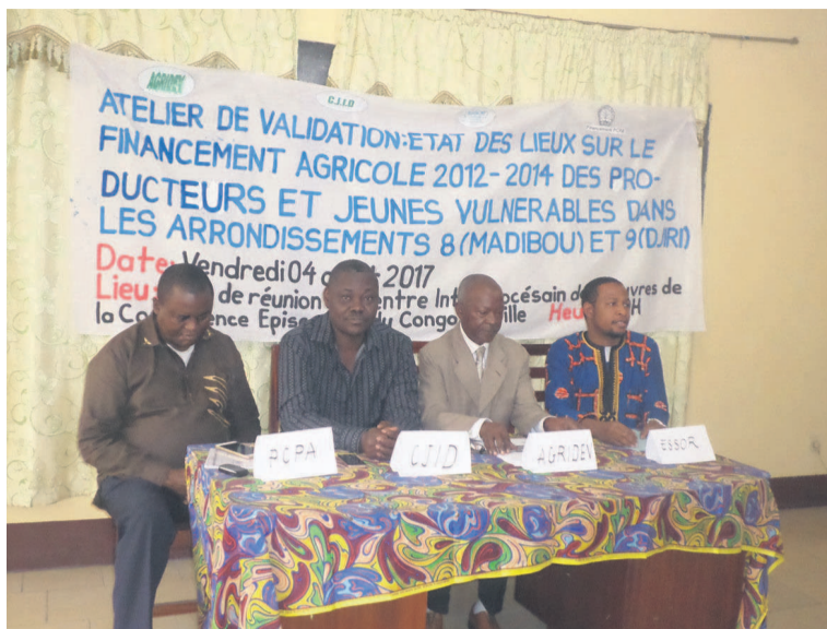
Le présidium