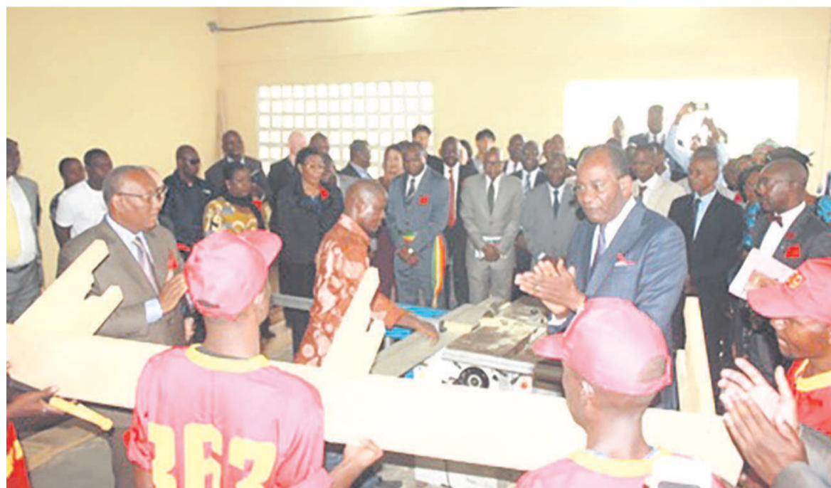
Une vue de l'atelier de menuiserie