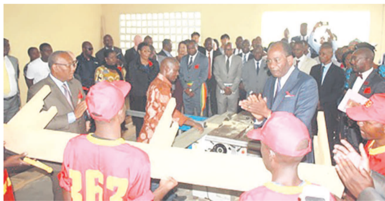
Visite de l'atelier de menuiserie (Adiac)

Les ministères en charge de la Justice et de la Formation qualifiante, en partenariat avec le PAREDA, ont réhabilité le centre de réinsertion sociale de la Maison d'arrêt et de correction de Brazzaville resté non opérationnel depuis 1997.