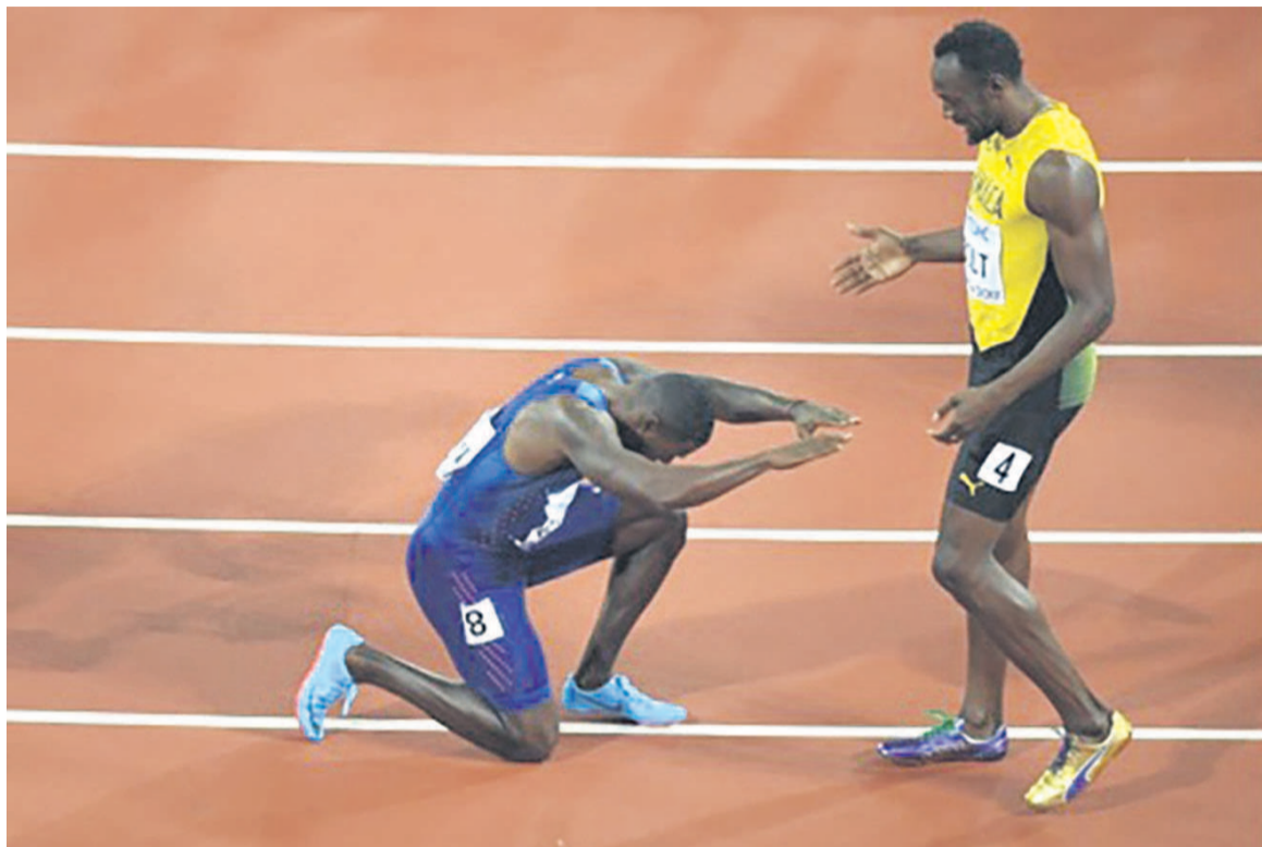
Justin Gatlin rend hommage à Bolt

Auteur d'un départ médiocre, l'octuple champion olympique n'a jamais vraiment maîtrisé la course et son retour a été trop tardif pour empêcher Gatlin de l'emporter de peu. L'homme le plus rapide du monde (9 sec 58 sur 100 m, 19 sec 19) craignait pour sa mise en action, après avoir pesté contre des starting-blocks pas assez fermes à son goût, la veille à l'issue des séries. Il n'a pas eu à trouver d'excuses après cet échec cruel mais finalement logique au vu de sa forme. Les craintes nées après son début de saison poussif (trois petits sorties seulement et un seul passage sous les 10 secondes), plus en forme de tournée d'adieux que d'une vraie préparation, se sont ainsi vérifiées au pire