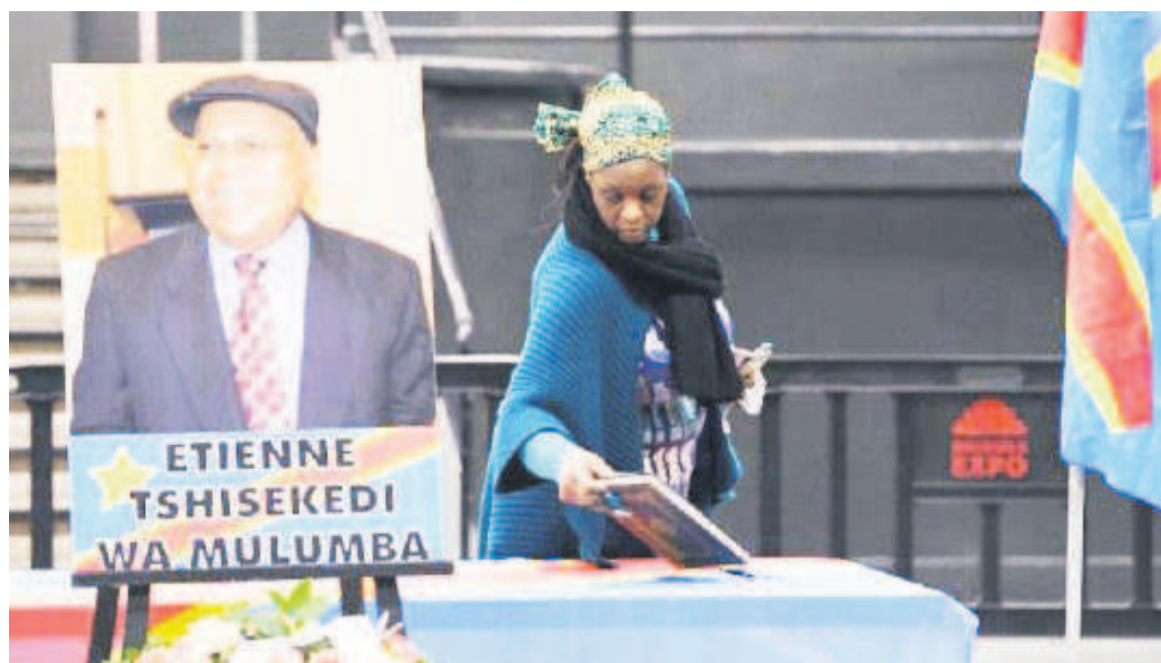
Hommage rendu à Etienne Tshisekedi à Bruxelles

Des jours et des mois continuent à s'égrener sans qu'une solution définitive ne soit trouvée quant au rapatriement à Kinshasa de la dépouille d'Étienne Tshisekedi en vue de son inhumation. Plus de six mois après le décès du « leader maximo » à Bruxelles, la situation n'a pas beaucoup évolué. Tous les espoirs suscités par les dernières tractations ayant mis autour d'une table les délégués du gouvernement d'un côté et de l'autre, les représentants de la famille biologique du disparu et du parti (UDPS), se diluent désormais dans les méandres des incertitudes. Tous ceux qui avaient salué le rapatriement imminent du corps de « Ya Tshitshi » à la lumière des conclusions ayant sanctionné cette fameuse Tripartite devront dorénavant déchanter. Le compromis trouvé notamment autour du lieu de sépulture, précisément dans une concession familiale à Nsele, s'est finalement limité à un simple effet d'annonce sans aucune concrétisation. Qu'est-ce qui bloque finalement ? pourrait-on s'interroger lorsqu'on sait que les deux camps (gouvernement et UDPS) sont parvenus à évacuer leurs contradictions pour faciliter le rapatriement sans casse de la dépouille d'Étienne