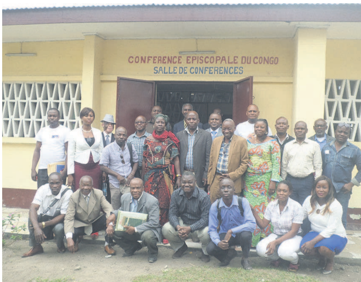
Photo de famille des participants