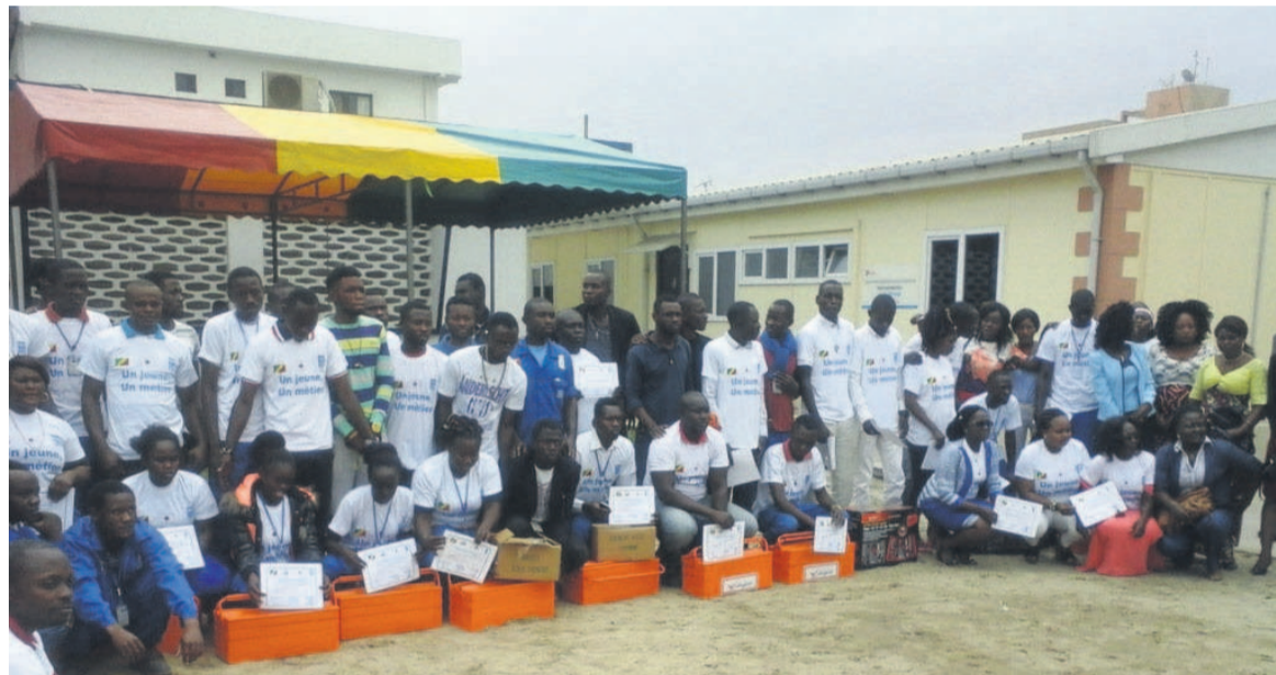
Les jeunes avec leurs diplômes et kits